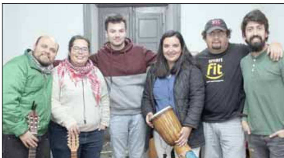
TALENTO LOCAL. - Ellos son Atempo Band, de San Felipe, estarán haciendo de las suyas la próxima semana en la terraza.