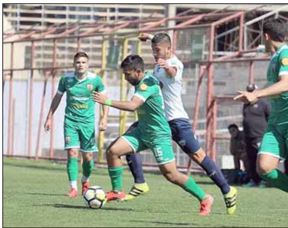
Los andinos llegan a la presente fecha a solo un punto de distancia del puntero.