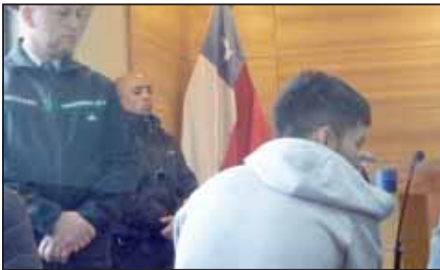
El imputado J.M.H. intentó evadir la seguridad del recinto judicial y arrancar desde la sala de audiencia, situación que fue impedida por personal de Gendarmería.

LOS ANDES.- Cerca de las 13:40 horas de ayer jueves, y mientras se realizaba una audiencia de control de detención en el Tribunal de Garantía de Los Andes, el imputado de iniciales J.M.H. intentó evadir la seguridad del recinto judicial y arrancar desde la sala de audiencia, situación que fue impedida por personal de Gendarmería.