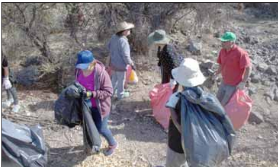
La caminata comunitaria ecológica es la segunda que se realiza en la comuna de Santa María.

tas actividades tienen como propósito concientizar a la comunidad que la basura impacta negativamente en el medio ambiente y en el entorno de sus barrios.