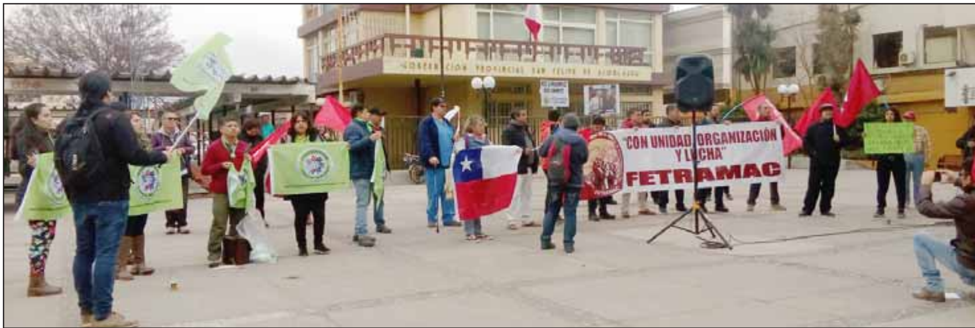
Acá los dirigentes de distintas organizaciones presentes durante el 'Banderazo'.