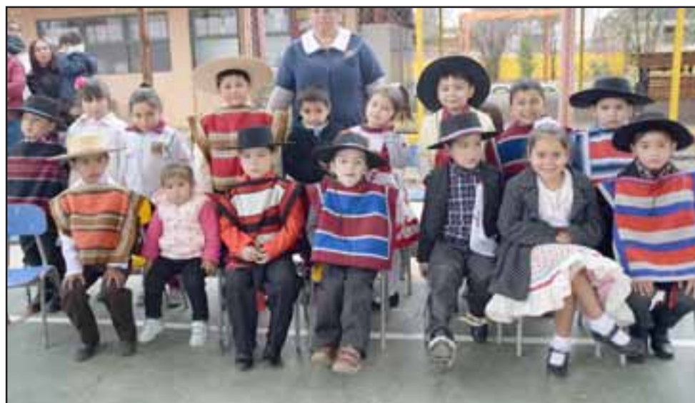
NUEVA GENERACIÓN.- Los más pequeñitos también ofrecieron una presentación y homenaje a su segundo hogar: La Escuela Carolina Ocampo.