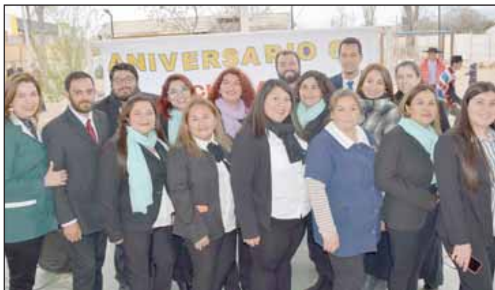
PROFES BACANES.- Ellos son gran parte del personal docente de esta casa estudiantil, quienes con alegría educan a los estudiantes.