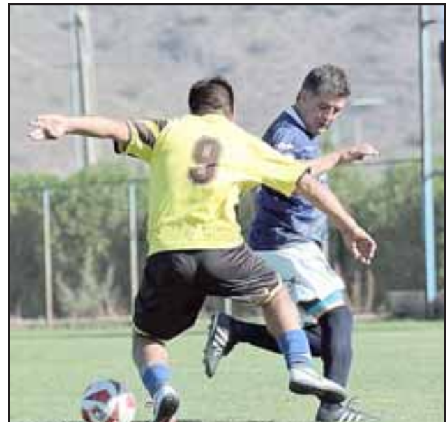
El domingo comenzará la decisiva segunda ronda en el torneo de la Asociación de Fútbol de San Felipe.

Juventud La Troya – Unión Delicias; Unión Sargento Aldea – Alberto Pentzke; Juventud Antoniana – Alianza Curimón; Ulises Vera – Mario Inostroza; Li-