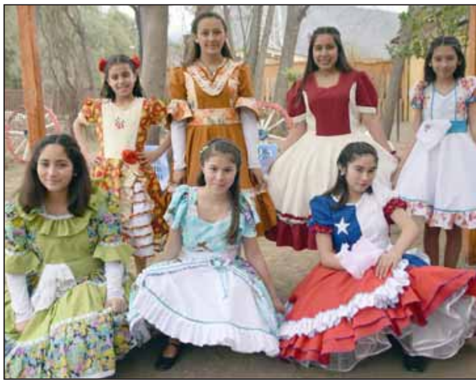
FOLKLORE INFANTIL.- Ellas son cinco de las siete bailarinas que componen el Ballet Folclórico de la Escuela Carolina Ocampo.