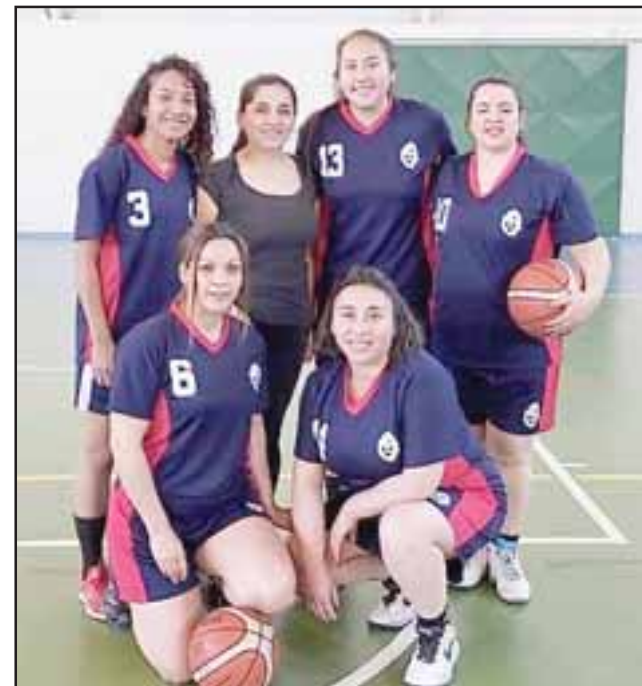
El quinteto de Aconcagua Sport se ubica en la tercera posición de su torneo.