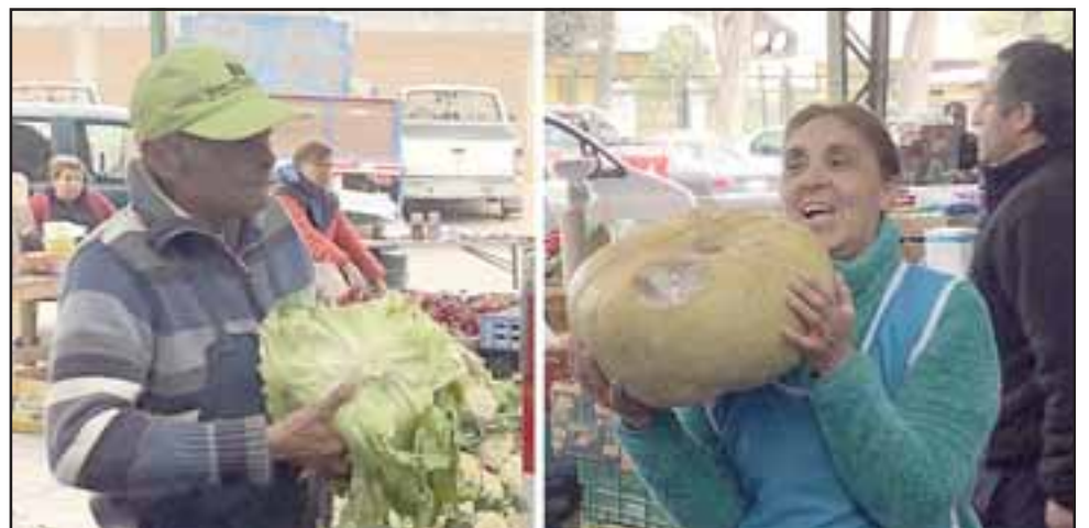
¡MUCHAS GRACIAS! - Aquí tenemos a dos de los feriantes de la Feria Mayorista haciendo sus donativos para este Comedor Solidario que ya tiene varios años funcionando en San Felipe.