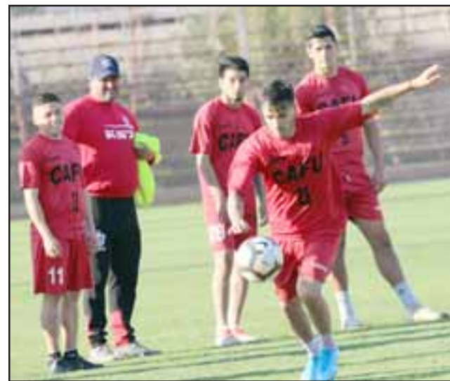
El equipo sanfelipeño está a un punto de distancia de los puestos de liguilla por el ascenso.