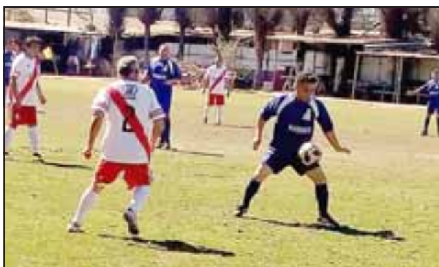
Este domingo el líder de la competencia tendrá un duro lance en Parrasía.

El duelo que en el sexto turno sostendrán el puntero de la competencia, Villa Los Álamos, con Tsunami, es el más atractivo que trae el menú futbolero de la cancha Parrasía. El equipo de 'la Ola' aparece como uno de los mayores obstáculos que el líder puede encontrar en su ruta al título.