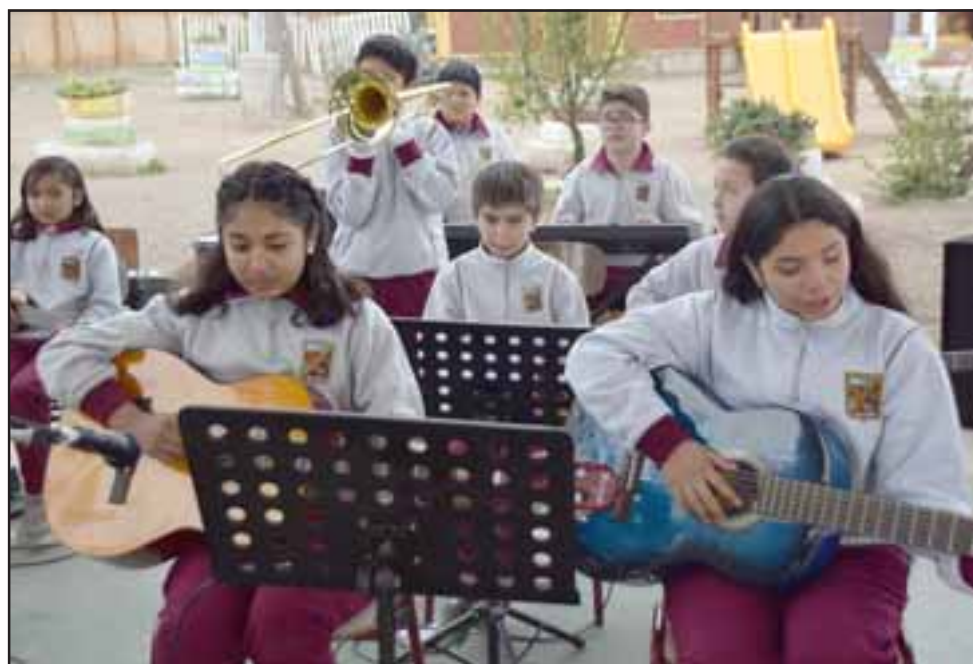
BANDA ESCOLAR.- Aquí tenemos a los más talentosos, ellos se encargan de la parte musical en los actos públicos de su escuela.