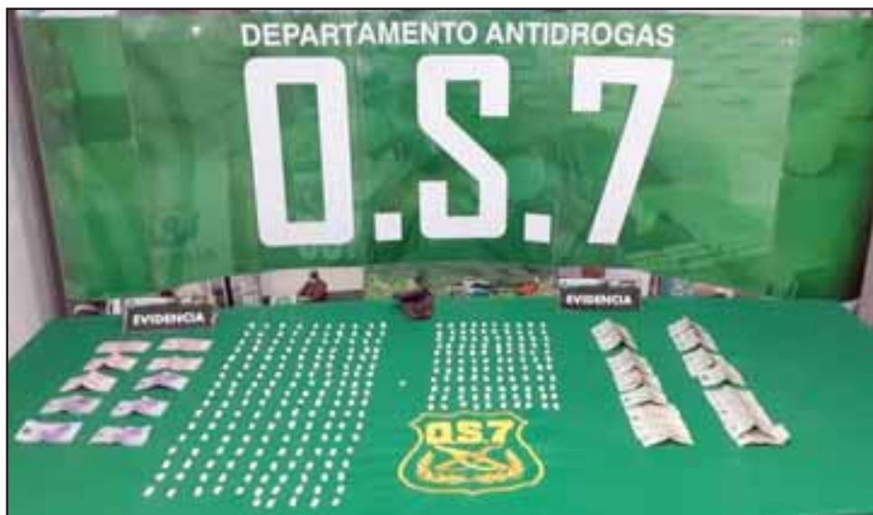
Personal del OS7 de Carabineros efectuó el decomiso de diversas cantidades de pasta base de cocaína en la Villa Departamental de San Felipe el 16 de noviembre del 2018. (Fotografía Referencial).

Las diligencias policiales culminaron con la incautación desde el local comercial de un total de 88 envoltorios de pasta base de cocaína equivalente a un peso de 13 gramos. En tanto desde el departamento, Carabineros decomisó un total de 65 envoltorios del mismo alucinógeno equivalente a 8 gramos de esta sustancia, más una bolsa con 51 gramos de esta droga y $74.000 en dinero en efectivo, atribuible a las ventas de estas sustancias ilícitas.