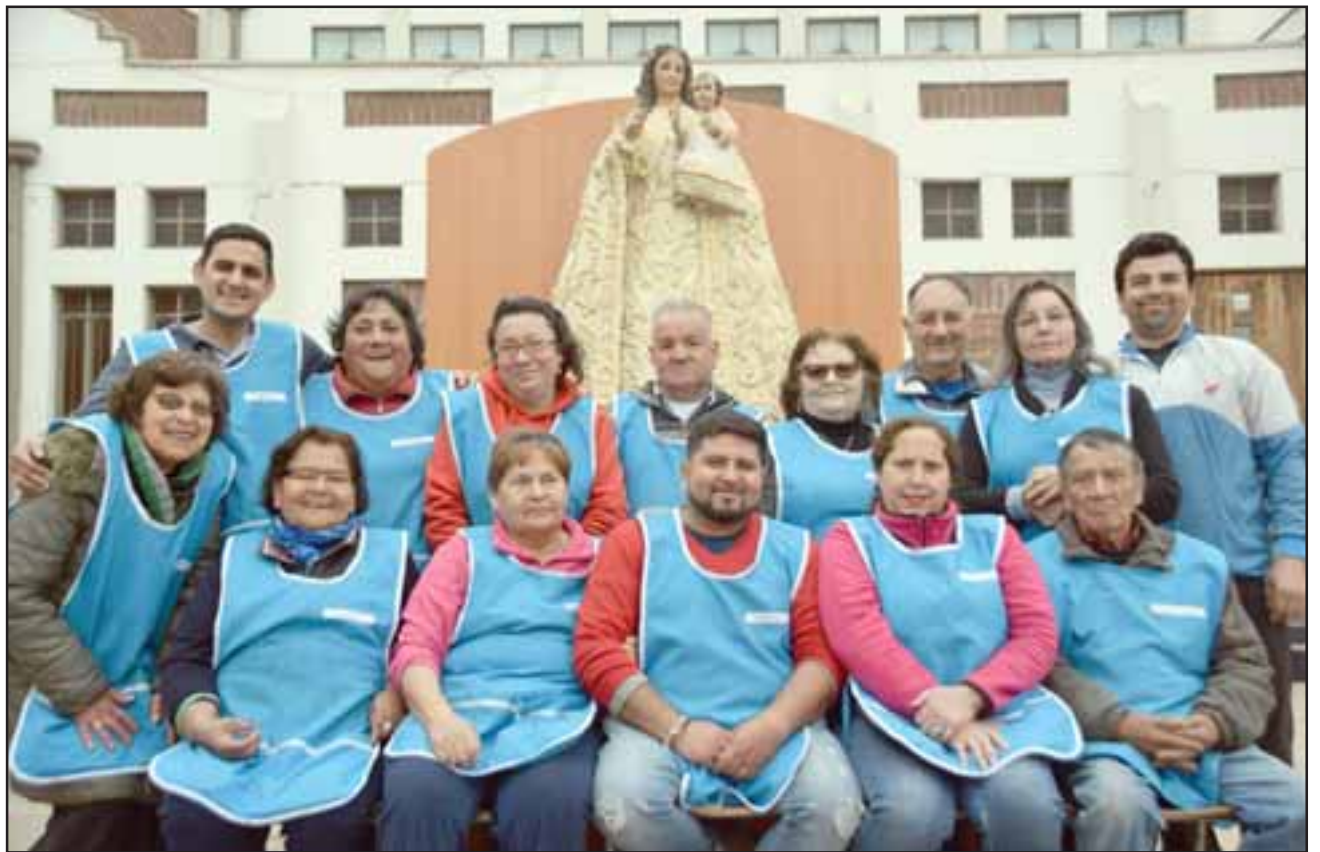
GRAN VOLUNTARIADO. - Estas personas sólo son algunas de las que de manera gratuita se entregan al voluntariado por sus hermanos menos favorecidos de nuestra comuna.