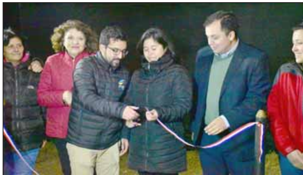
Más de una década debieron esperar los vecinos para llegar al día de la inauguración de su sistema de alcantarillado y planta elevadora de aguas servidas.

muy significativo para los vecinos y vecinas de San Jesús. Este es un proyecto de alcantarillado que data desde hace mucho tiempo. Cuando asumimos nos encontramos con una inversión que lamentablemente se había botado a la basura, un proyecto que se había ejecutado por 100 millones de pesos que lamenta-