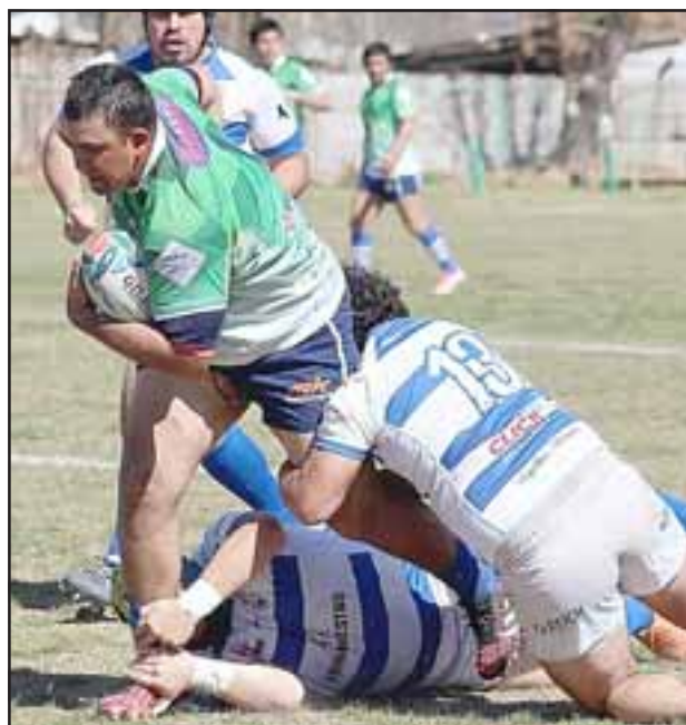
En Curicó Los Halcones jugarán su último partido del actual torneo de la Arusa.