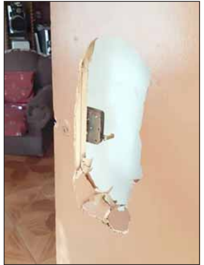
Los antisociales destruyeron la puerta principal de una de las viviendas ubicadas en la Villa Bernardo Cruz de San Felipe la tarde de este miércoles.