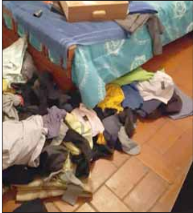
Los sujetos efectuaron diversos desórdenes en los inmuebles para apoderarse de los artículos tecnológicos.

Tras amplio operativo policial se logró recuperar parte de las especies sustraídas, siendo capturado un menor de edad, mientras que su cómplice logró fugarse con un notebook.