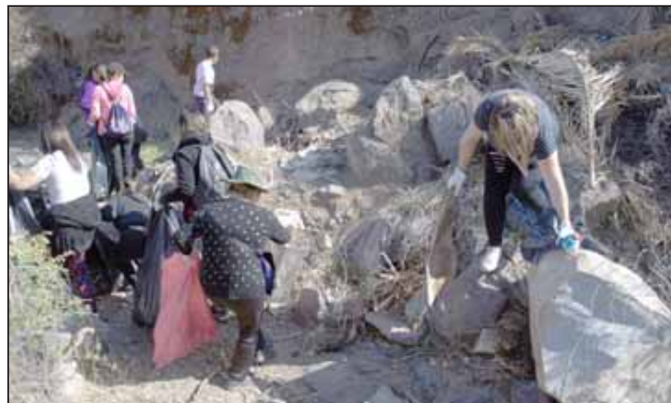
De acuerdo a lo informado por el equipo organizador, el trabajo de limpieza del zanjón recolectó una tonelada de basura.