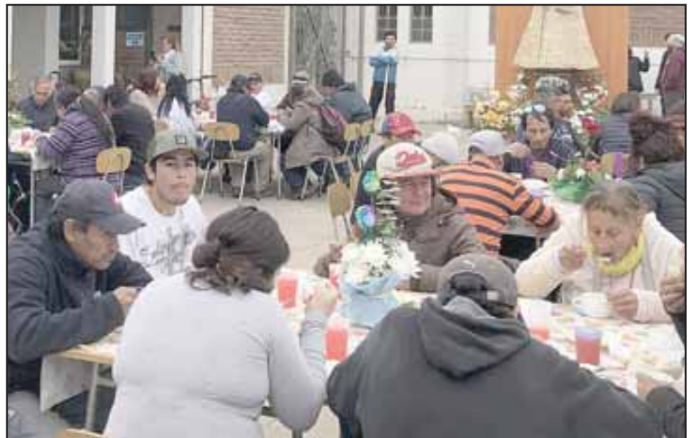
BUEN APETIDO. - De todas las edades, hombres y mujeres, jóvenes y mayores y hasta en silla de ruedas, estas personas reciben agradecidos el rico almuerzo con mucho amor para ellos preparado.