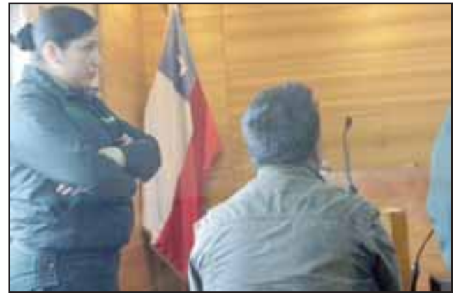
Fiscalía le imputó el delito de Robo con intimidación, tras hacerse pasar por colombiano al enviar el mensaje.

Es por ello que solicitó la Prisión Preventiva, ya que además el imputado regis-