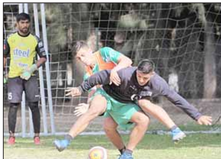
Los andinos lograron rescatar un punto con sabor a poco en su enfrentamiento con Mejillones.

Con este empate Trasandino llegó a 42 puntos, igual que Salamanca que empató como visitante con Rancagua Sur. En tanto el puntero Linares, que llegaba a esta fecha con 42 positivos, visitaba ayer al colista Ferroviarios.