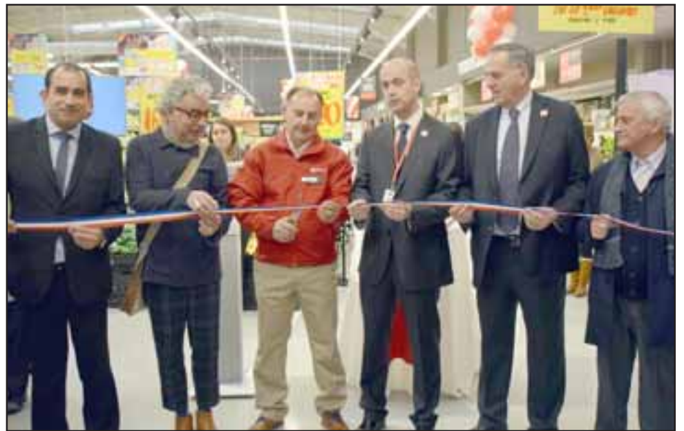
CORTE DE CINTA. - En el tradicional corte de cinta participaron autoridades de nuestra comuna y de la Alta Gerencia de la empresa.