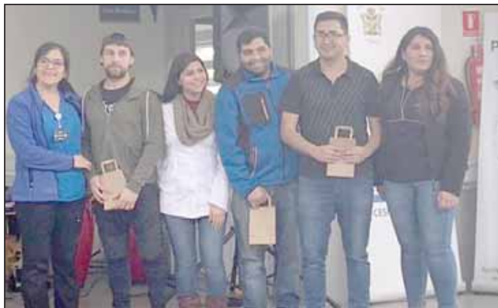
La actividad considero la realización de feria de promoción de la salud, desayunos saludables y un reconocimiento a los funcionarios del centro de salud.

con nuevas instalaciones de salud primaria, un proyecto que nos enorgullece, pues ahora los vecinos de Panquehue tienen un lugar digno para tratar sus enfermedades. Por lo mismo quiero felicitar e instar a que sigan