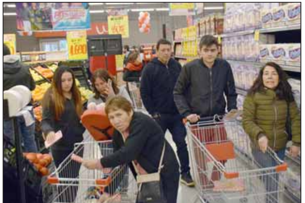
OFERTAS DE INAUGURACIÓN. - Cientos de clientes invadieron en pocos minutos los pasillos del nuevo supermercado. Unimarc cuenta con presencia en todo Chile y también en Perú.