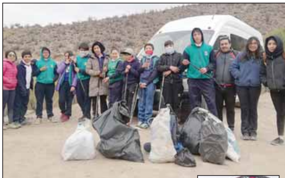
MISIÓN CUMPLIDA. - Aquí los niños nos muestran parte de las bolsas llenas de basura que recolectaron en Laguna del Copín.