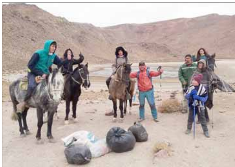
MUERE NUESTRA LAGUNA. - La Laguna del Copín, aunque está casi seca, sigue siendo visitada por mucha gente, en esta oportunidad estos niños fueron a limpiarla.