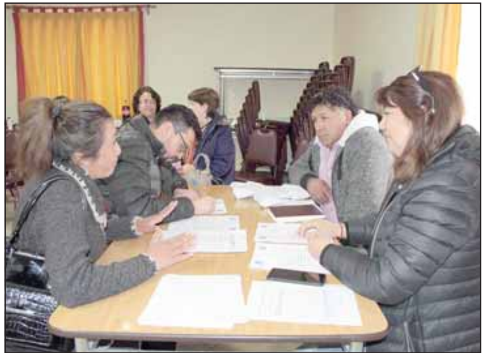
Organizaciones sociales reciben apoyo para la concreción de propuestas de desarrollo.

nador de Los Andes, junto con felicitar las propuestas adjudicadas, reconoció la labor de los dirigentes: «Si bien este año hubo aumento en el monto entregado, también hubo más postulaciones y más expectativas; se hizo difícil la selección, pero acá están las mejores propuestas técnicas. Destacamos, además, el trabajo colaborativo entre Codelco Andina, la Gobernación y la Unco».