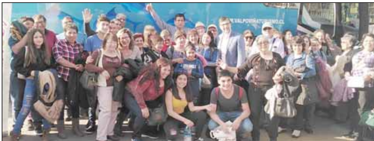
Cerca de 1.500 habitantes de la región viajarán (en varios viajes más) a la comuna costera y a Olmué por el programa Turismo Familiar, con paquetes turísticos todo incluido por tres días y dos noches.

En total son 1.474 habitantes de la región los beneficiados por este programa en su 5ª Temporada, viajan-