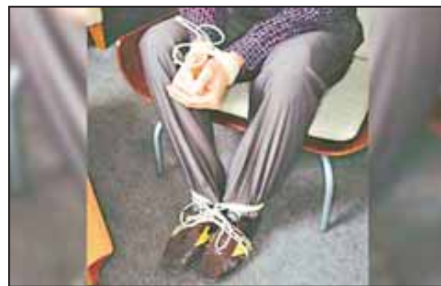
La pareja de adultos mayores comerciantes fueron asaltados en horas de la madrugada de este sábado en su domicilio en el sector de Bucalemu, en Curimón. (Fotografía Referencial).

«Posteriormente, una vez que las víctimas lo-