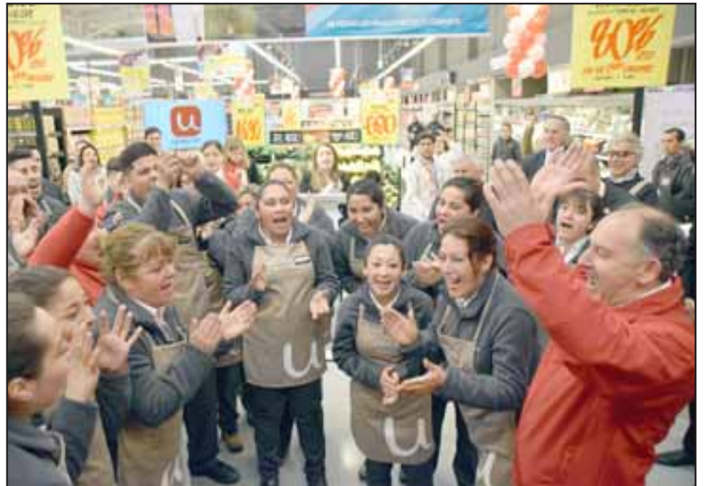
TIENEN TRABAJO. - Así reaccionaron el administrador de la nueva Tienda Unimarc y sus empleados.