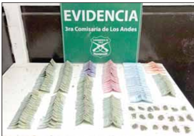
Portaba 20 pequeños contenedores transparentes con marihuana y la suma de $574.000 en billetes de diversa denominación.