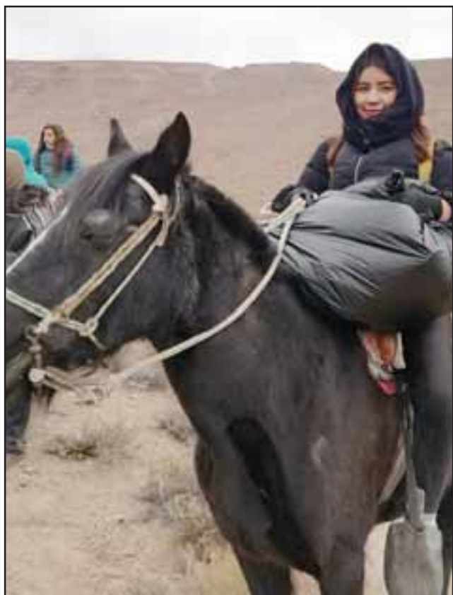
UN GRAN TRABAJO. - Esta niña cargó en este caballo una de las bolsas con botellas y desechos sólidos.