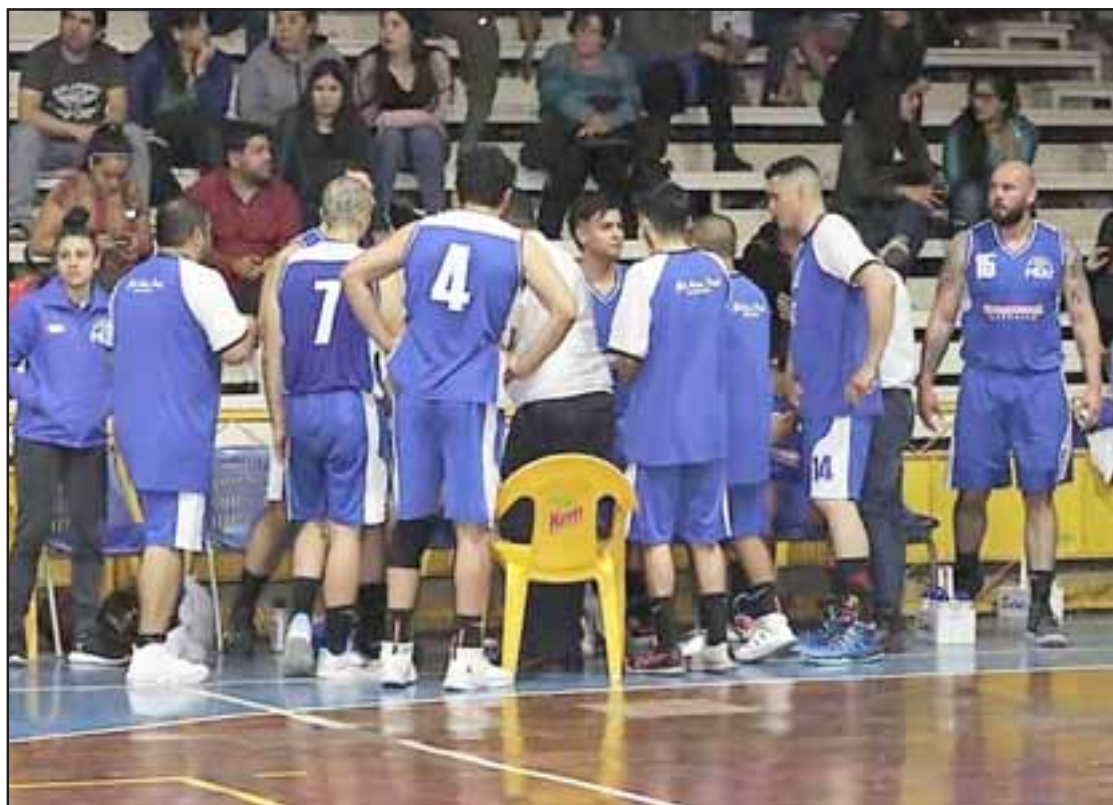
Aunque evidencia algunas mejoras en su funcionamiento el Prat volvió a caer en el torneo B de la Liga Nacional de Básquetbol.