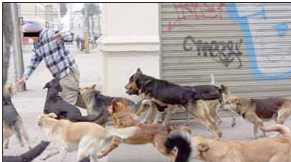
MORTAL ATAQUE.- No es la primera vez que los perros desconocen su lazo con el ser humano, esta vez ocurrió en Los Andes. (Referencial)

En Villa Esplendor, a una cuadra de locomoción colectiva. Celular 950895390