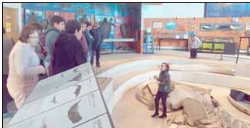
DESCUBRIENDO CHILE.- Exóticos lugares e interesantes museos fueron visitados por estos vecinos santamarianos durante esta gira.

Son las municipalidades quienes seleccionan a las familias inscritas que cumplan con los criterios de focalización, priorizando programas municipales, como el Programa Jefas de Hogar y '4 a 7'.