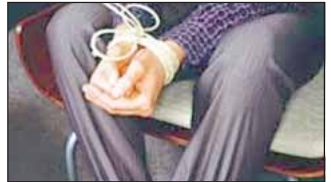
El matrimonio de conocidos comerciantes fue asaltado por delincuentes que los maniataron y amordazaron para escapar con casi cuatro millones de pesos.

puerta hasta que hicieron un forado bastante grande y solamente alcancé a decir ¡Qué pasa hombre!, y tengo un tipo frente a mí con una pistola en la cabeza... ¿Qué puede hacer uno ante eso? Mi señora intentó salir por una ventana que da hacia la piscina cuando en eso afuera habían dos tipos que la obligaron a entrar a la habitación y ahí hicieron de las suyas, iban a buscar dinero más que nada. Bueno este episodio no debe haber durado más de diez minutos, nos maniataron de las muñecas, nos amordazaron, lo único que me pedía el tipo que me apuntaba era que le diéramos cinco minutos... cinco minutos, súper desesperado y eso fue todo, yo que antes del minuto me zafé las amarras porque era