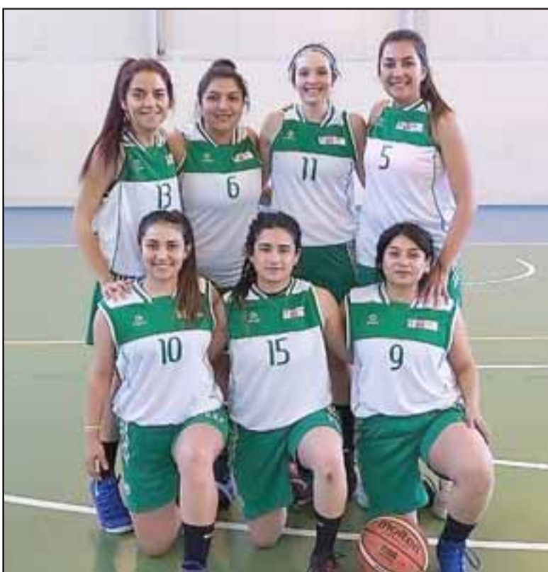
Chaves Team tuvo una actuación goleadora en la fecha del torneo de básquet Valle de Aconcagua.

corona del segundo torneo cesterero aconcaquiño.