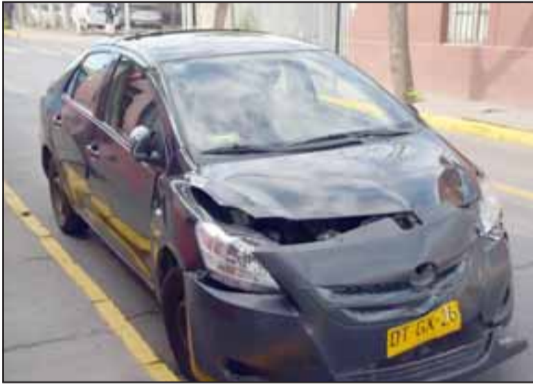
DAÑOS MATERIALES.- Así quedó la parte frontal del radiotaxi, luego de protagonizar una colisión en Navarro con Santo Domingo.

SACADO DE LAS CALLES.- Las cámaras de Diario El Trabajo registraron la grúa cuando se llevó el Toyota plateado.