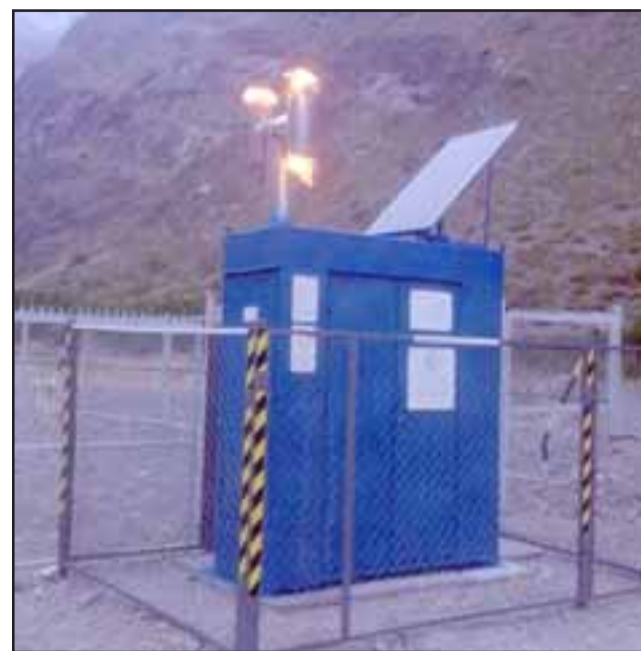
En seis puntos del valle se realiza el 'bombardeo' de nubes para estimular precipitaciones. En la imagen, la estación ubicada en el sector Piuquenes, al interior de la División Andina.