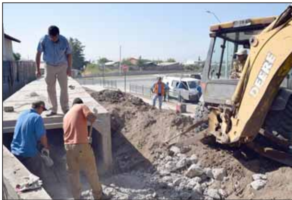
DE NUNCA ACABAR.- En febrero los sifones que se habían instalado fueron removidos del lugar, siete meses después el problema de los anegamientos sigue sin resolver.

traciones, por lo que se quitaron estos cajones que existían y se compraron unos nuevos, pero estos son abiertos, en esa oportunidad el problema mayor era que el agua se apozaba y no fluía apropiadamente, por lo tanto esa pequeña cantidad de agua pasaba a través de la tierra y lograba llegar a las viviendas (...) por encargo del señor alcalde ejecutamos los trabajos, tuvimos muchas dificultades, la máquina mala, falta de personal, la verdad es que se pudo trabajar en conjunto con Miquel por favor excavásemos con nuestra excavadora hasta la base de un tubo que sale de las viviendas en El Señorial, y estos se hizo con la finalidad de que ellos pudieran limpiar ese tubo que está por debajo, este tubo tiene aproximadamente un metro de diámetro, pero está total y absolutamente embancado, tiene barro y