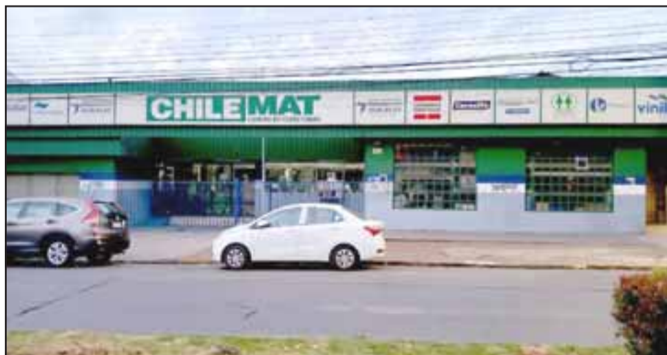
Delincuentes ingresaron hasta la Ferretería Agrasan Chile Mat ubicada en avenida O'Higgins esquina Portus en San Felipe la madrugada de este lunes.