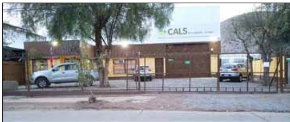
La empresa de insumos agrícolas 'Cals' mantuvo cerrada la atención durante la jornada de este lunes, efectuando un inventario para establecer el avalúo de las pérdidas, producto de este robo.

Los delincuentes procedieron a romper y cortar el sistema de cables de cámaras de vigilancia, lo que habría impedido registrar los movimientos de los ladrones, ingresando posteriormente hasta una oficina donde rompieron una caja fuerte, apropiándose