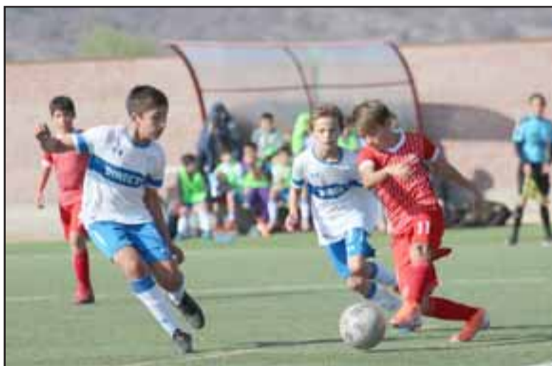
Los conjuntos más pequeños del Uní Uní enfrentaron a la Universidad Católica.