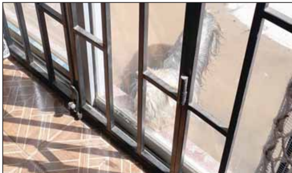
PERRO AL AGUA.- Este perrito tendrá que seguir mojándose cada vez que el agua se filtre del canal a su vivienda.