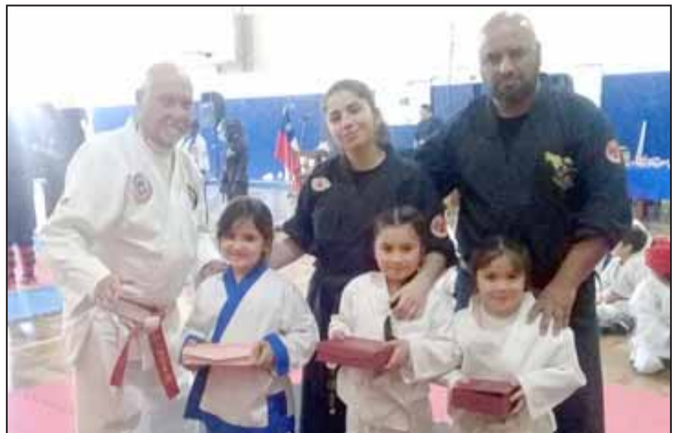
NUESTROS CAMPEONES.- Aquí vemos a varios pequeñitos recibiendo su trofeo, luego de derrotar a sus adversarios en sus respectivas categorías. Les acompañan varios maestros de Artes Marciales de la V Región.