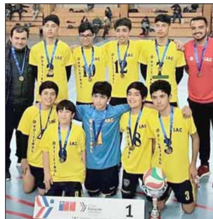
El representativo del IAC ganó el Regional Escolar de voleibol en la categoría U14.