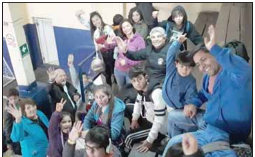
LA GRAN AVENTURA.- Aquí vemos la comitiva sanfelipeña de Karate que viajó al gimnasio naval de Valparaíso a representar a nuestra comuna.