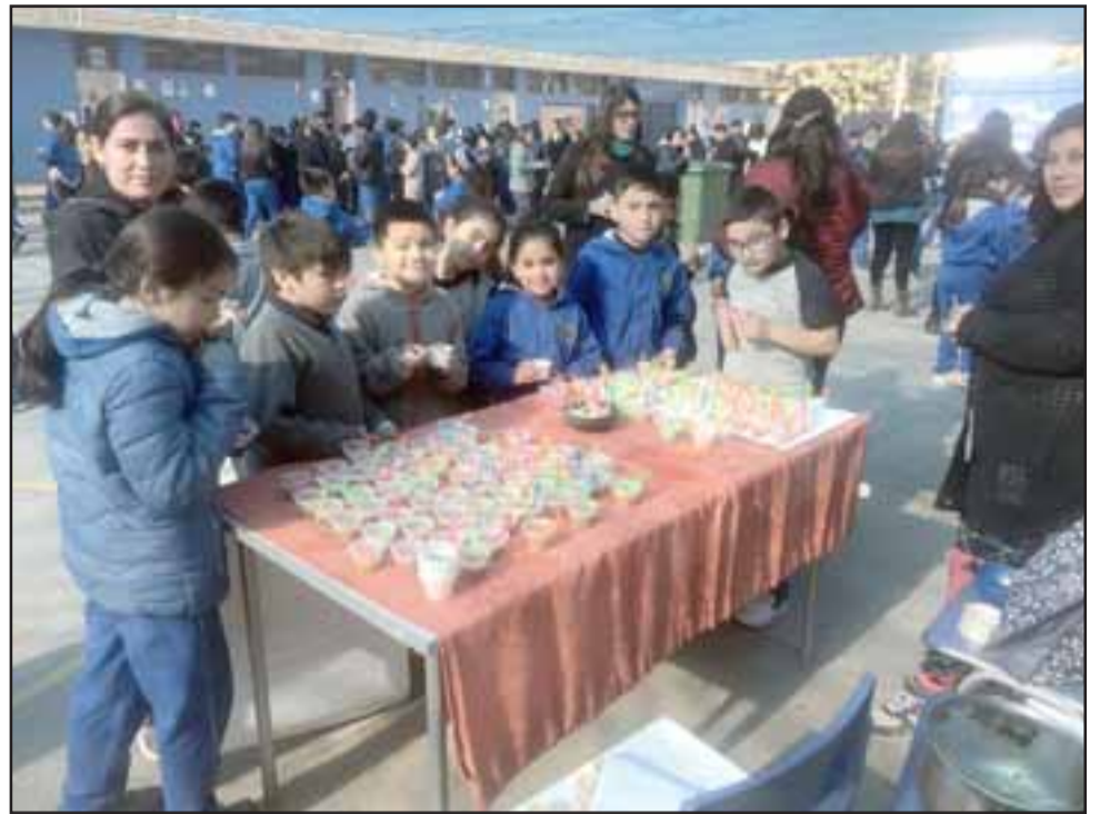
Los alumnos participaron felices en la muestra gastronómica, degustando exquisitas preparaciones (2).JPG