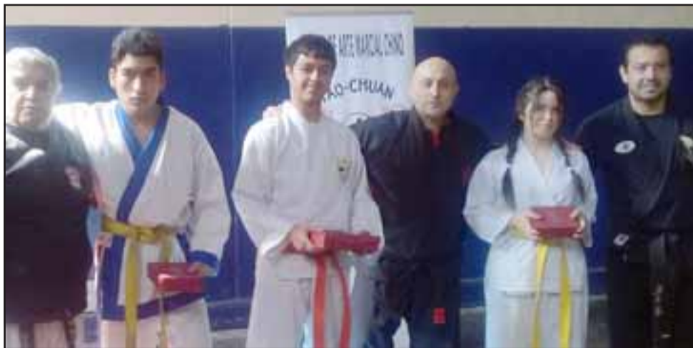
LOS MEJORES.- Cada uno de los participantes que se esforzaron y ganaron, recibieron su merecido reconocimiento.