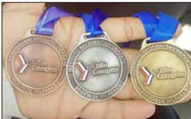
LA COSECHA.- Aquí vemos varias de las medallas que este joven atleta se ha ganado haciendo lo que más le gusta.