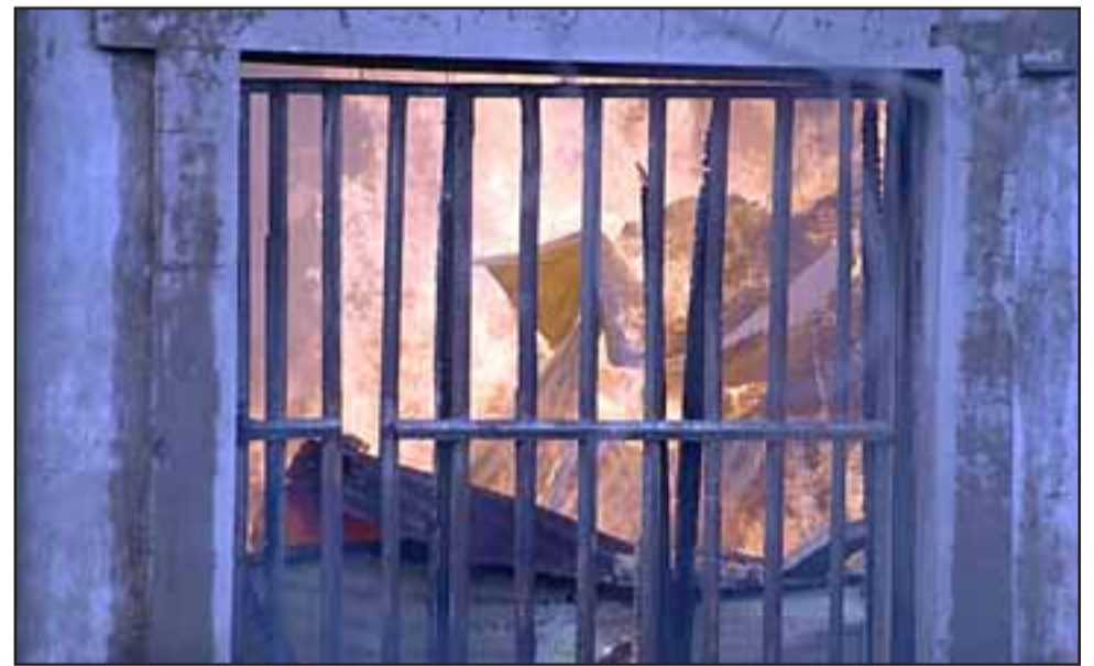
INFERNAL ESCENARIO.- Esta gráfica puede ilustrar a nuestros lectores la fuerza destructora que arrasó con cerca de 70 millones de pesos en estructura y material textil.