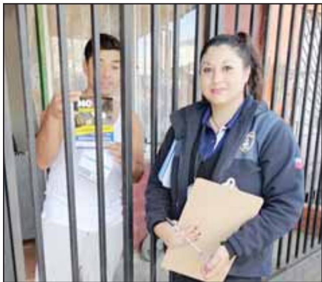
Acá apreciamos a una voluntaria terminando de ingresar a otro socio cooperador.

Señalar que anda personal de bomberos movilizados en un furgón con todos los logotipos representativos de la institución.