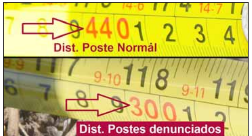
VERIFICACIÓN EN TERRENO.- Evidentemente las mediciones hechas para Diario El Trabajo demuestran casi metro y medio de diferencia entre los postes y los autos, en comparación con el resto de postes.