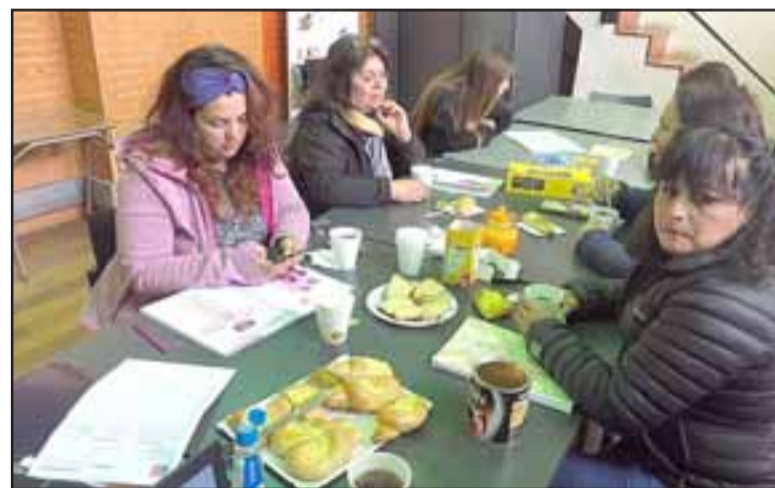
Las mujeres aprendieron cómo enfrentar una entrevista, cómo buscar lugares de trabajo, cuál debe ser la presentación personal para una determinada entrevista, y además cómo elaborar un currículum vitae.

«Los talleres de los programas de las mujeres Jefas de Hogar son de desarrollo laboral y personal, como asimismo de formación para el trabajo. Ahora en este caso puntual la sesión realizada implicó un apresto laboral además de la realización de una prueba que contempla el programa. En esta oportunidad se les enseñó a las mujeres cómo enfrentar una entrevista, cómo buscar lugares de trabajo, cuál debe ser la presentación personal para una determinada entrevista, y además cómo elaborar un currículum vitae. Nosotros como pro-