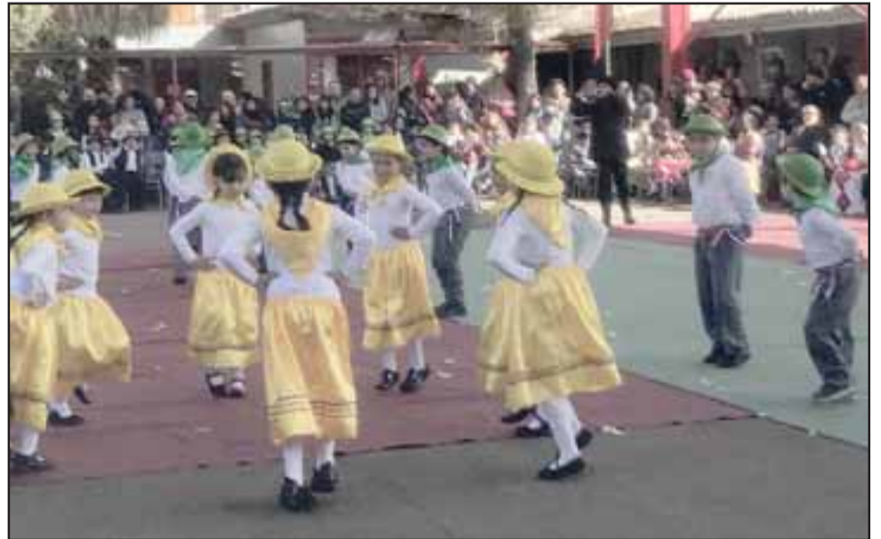
Alumnos de todos los cursos se lucieron en la Gala Folclórica realizada en la Escuela John Kennedy.