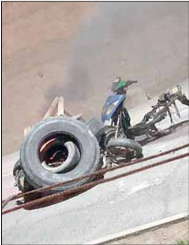
Carabineros debió intervenir tras el encendido de barricadas en el sector La Pirca de Panquehue.

Incidentes se originaron en algunos puntos de la comuna de San Felipe y Panquehue, debiendo intervenir Carabineros para restablecer el orden.