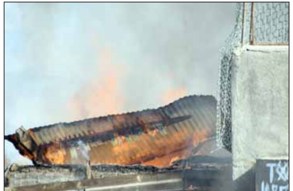
PÉRDIDAS MILLONARIAS.- Cada centímetro del inmueble fue purificado por este elemento natural, destruyendo todo a su paso.