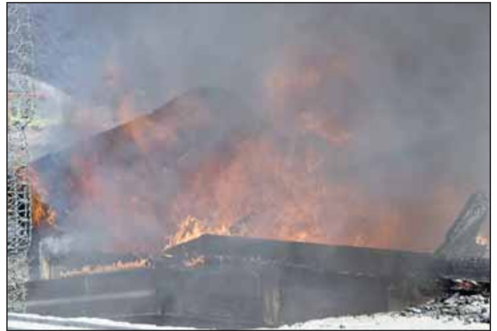
TODO DESTRUIDO.- La poderosa fuerza del calor en este infernal escenario hizo que las latas cedieran para que las lenguas de fuego hicieran su infernal labor.