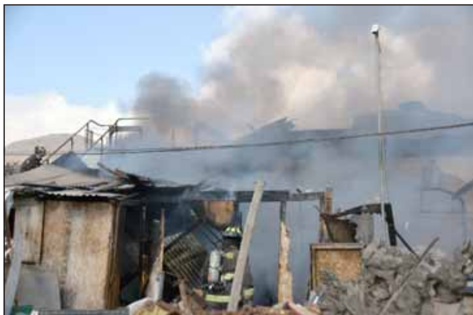
TODO EN CENIZAS.- Al final de la jornada todo quedó reducido a cenizas, esta familia tendrá que empezar de nuevo.