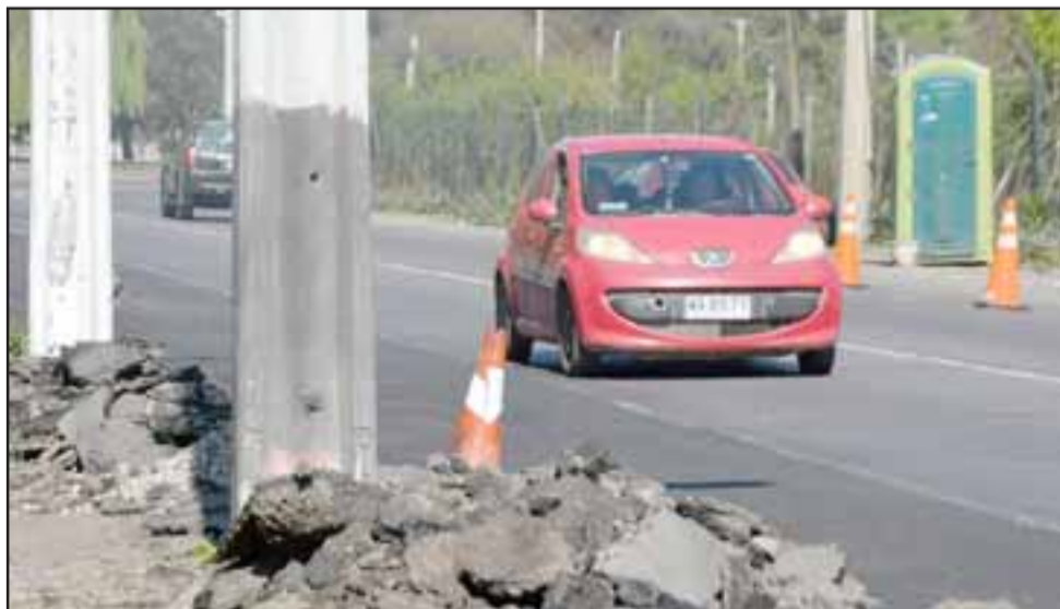
SON DE CHILQUINTA.- La empresa Chilquinta se reunirá hoy con los jefes de Vialidad para explicar esta consulta.