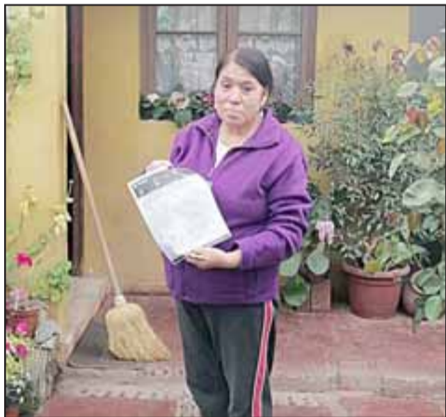
Una mujer orgullosa nos muestra el formulario de socia cooperadora de Bomberos de San Felipe.