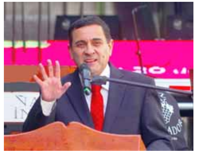
Javier Muñoz, alcalde de Curicó.

En Curicó sostuvo el alcalde Javier Muñoz, la empresa tenía el nombre de Epark. Los problemas se presentaron en los últimos tres meses, «antes de cesar el contrato y con los trabajadores particularmente casi todo el año por el no pago de imposiciones», in-