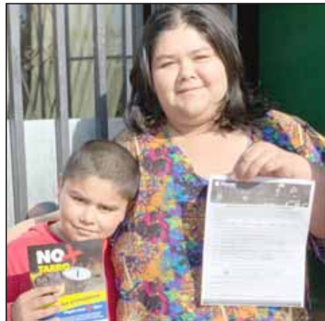
Otra socia muestra su formulario.