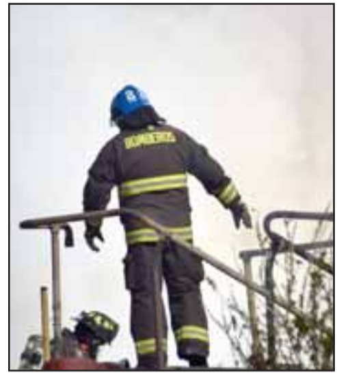
A CIEGAS.- Por minutos la visibilidad en este lugar se hizo nula para los bomberos que atendieron el desastre.