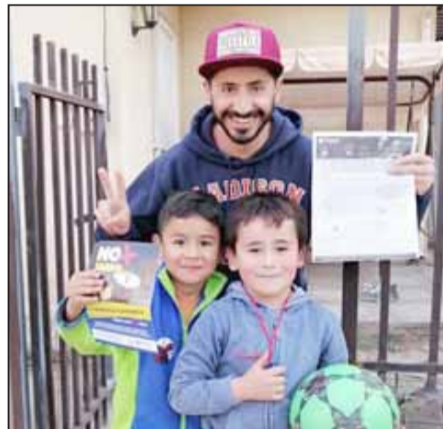
Un adulto con dos niños orgullosos y sonriendo muestran el formulario que los acredita como socio cooperador de bomberos.