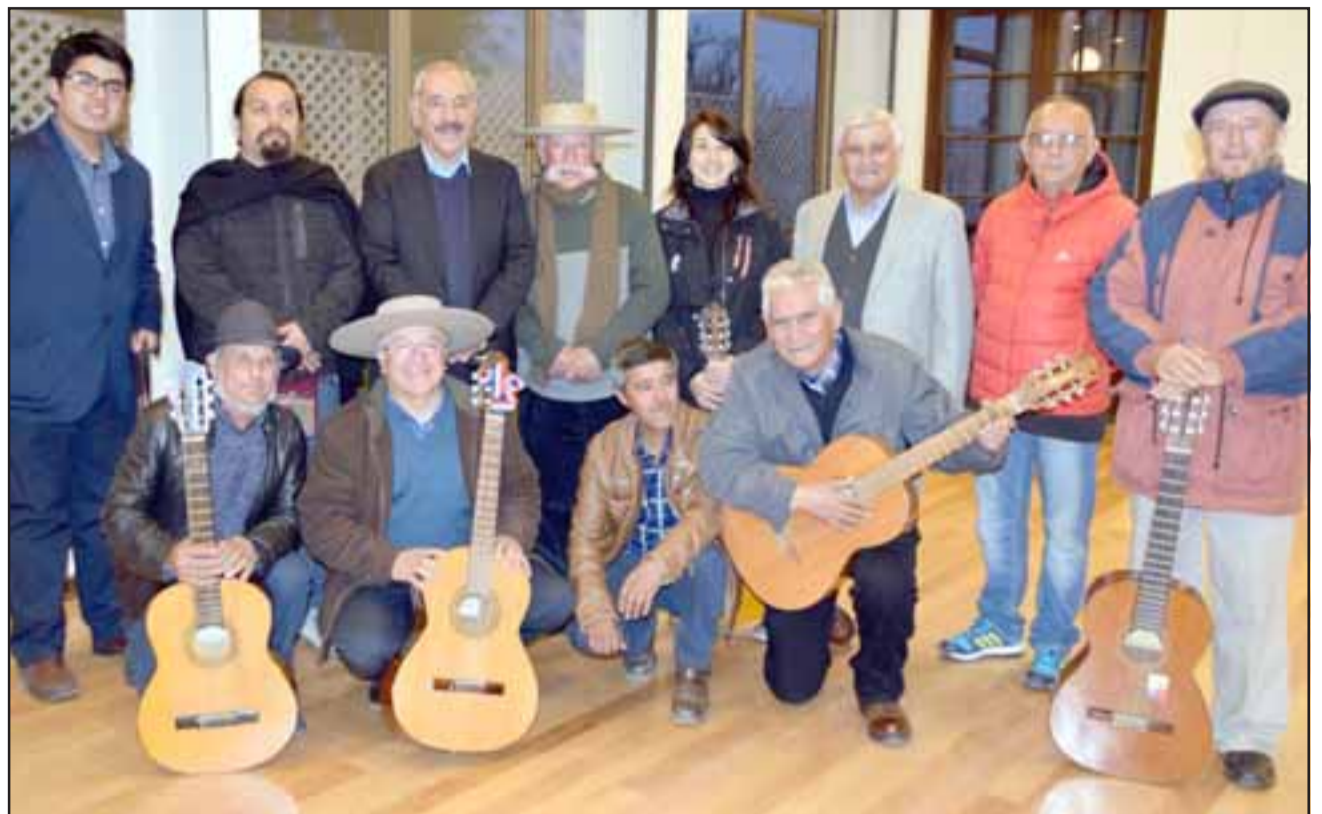
LOS MEJORES DEL PAÍS.- Aquí vemos a los principales protagonistas que este año darán fuerza y vigor a esta cuarta jornada de payadores en nuestra comuna.

Otras actividades contempladas serán en la Es-