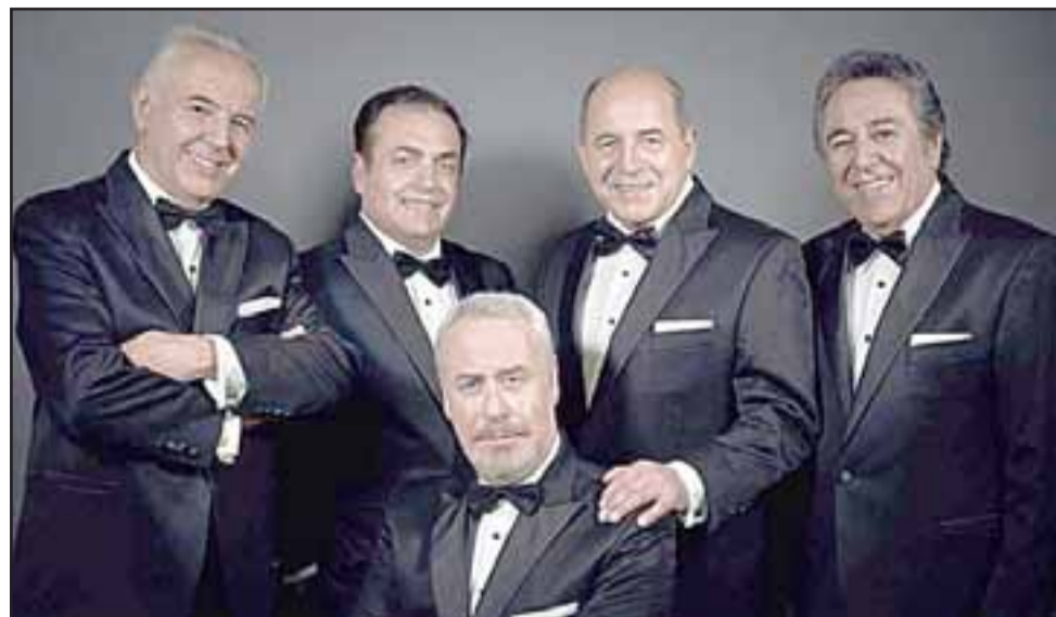
Los Cuatro Cuartos se presentan esta tarde a las 19.30 horas en el Teatro Municipal de San Felipe, con entrada totalmente liberada.

Fernando Jiménez , Los Cuatro Cuartos continúan su gira musical celebrando sus 57 años de vida, y en esta oportunidad lo harán en el Municipal sanfelipeño, trayendo lo mejor de su repertorio que va desde: «Adiós