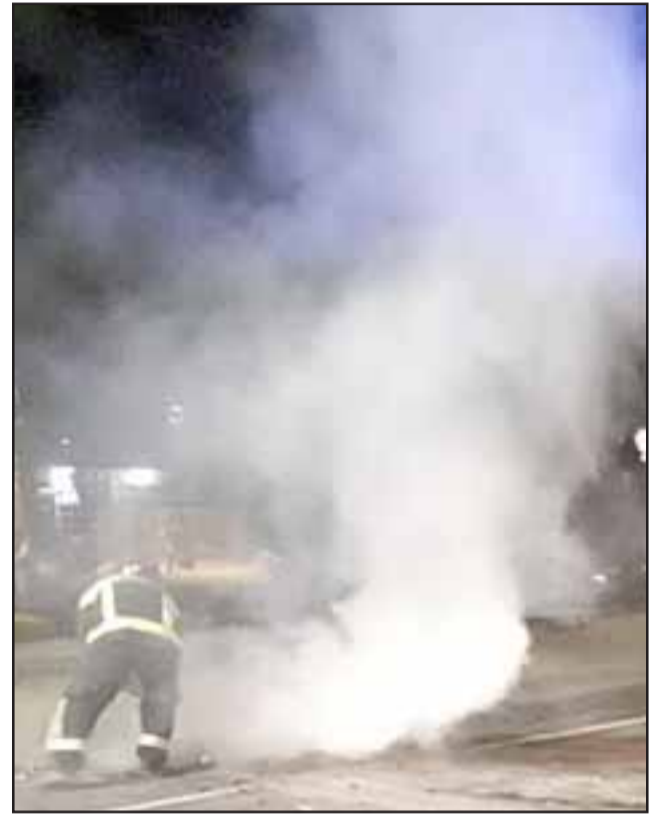
Los incidentes se registraron durante la noche de este martes en las comunas de San Felipe y Panquehue, en la previa del 11 de Septiembre.