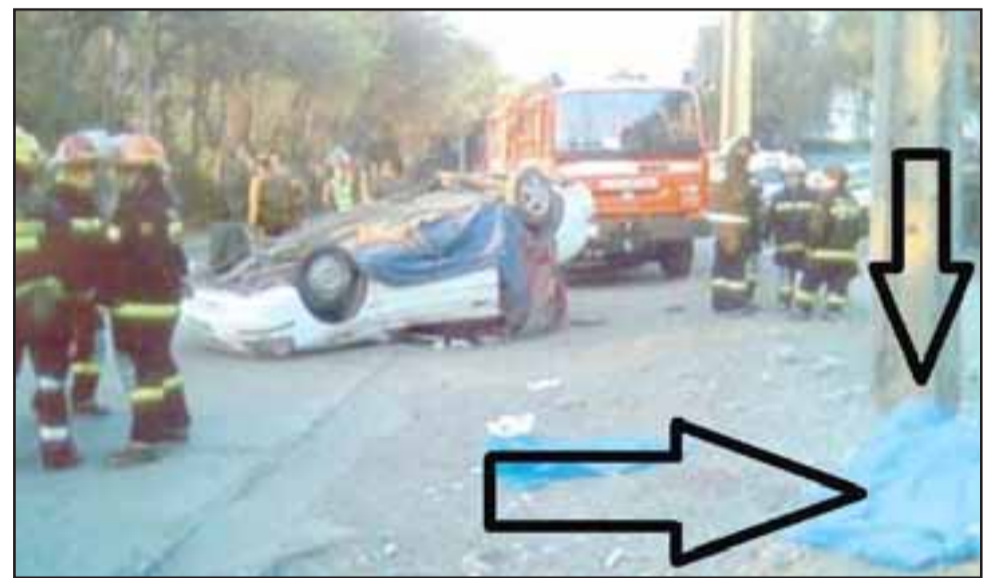
VIALIDAD TIENE LA PALABRA.- Contra este poste estalló la cabella del niño hace 13 años, la gráfica de nuestro medio lo confirma, al pie del mismo yace el cuerpo.

«Es el colmo, llevamos mucho tiempo solicitándole al Municipio de Panquehue que corrijan este error, yo envié una carta al señor alcalde Luis Pradenas hace días, nadie responde, estos postes están mal ubicados, es metro y medio hacia la calle, cuando los demás están a 4.40, estos están a 2.95, no sé qué se necesita