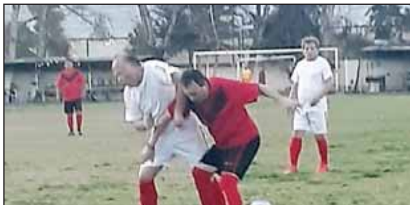
Este domingo se cumplirá el primer tercio de la segunda rueda de la Liga Vecinal.