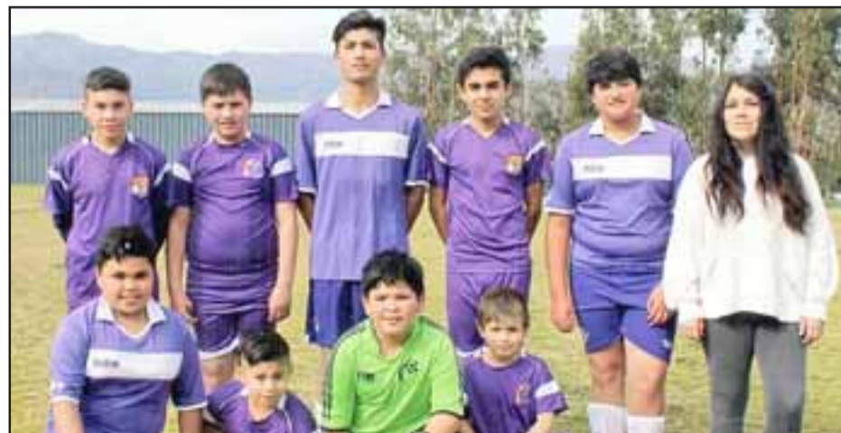
Tercera serie infantil del club Olímpico de Putaendo.