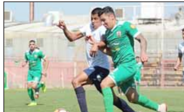
Trasandino será local por segunda vez en el estadio Municipal de San Felipe.