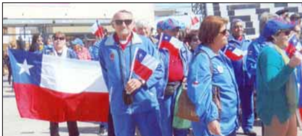
DESFILANDO.- También desfilaron por las calles de la ciudad anfitriona de este encuentro internacional de coros de adultos mayores.