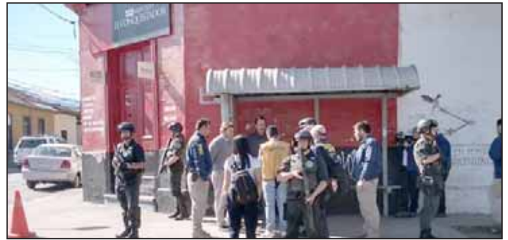
En esta diligencia participaron dos de los tres imputados por este alevoso crimen.