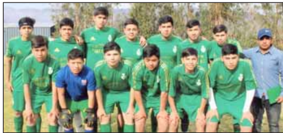
Tercera serie infantil del club Libertad de Guzmanes.

En esta oportunidad nuestros lectores conocerán las series Tercera de los clubes Libertad de Guzmanes y Olímpico.