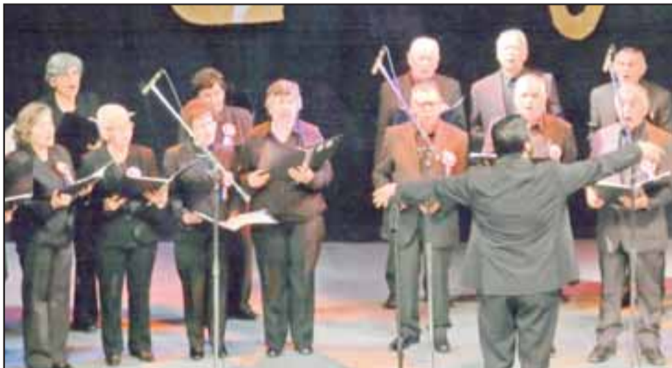
¡GRANDE CHIQUILLOS! - Así lucieron en plena gala internacional, el público les aplaudió de pie tras su presentación.