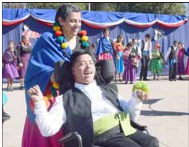
SIN BARRERAS. - No hubo limitantes para que estos niños y jóvenes disfrutaran de esta emotiva actividad.

Autoridades invitadas también aplaudieron cada uno de los bailes que se presentaron en el patio principal del centro educativo, además durante esta Fiesta de la Chilenidad hubo rifas a beneficio de la escuela, y los ganadores regresaron a casa muchos con buenos premios.