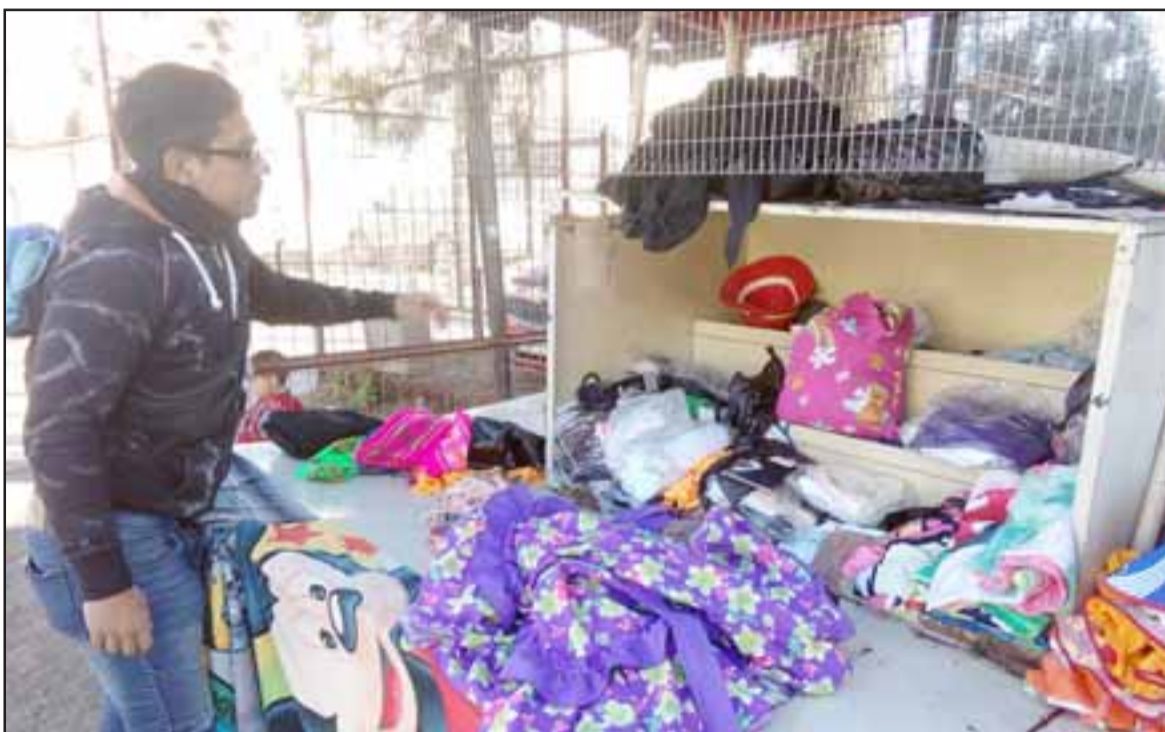
El propio afectado nos muestra donde tenía los vestidos evaluados en 30 mil pesos cada uno.

Dijo que anteriormente había sufrido un robo, pero no de esta magnitud.