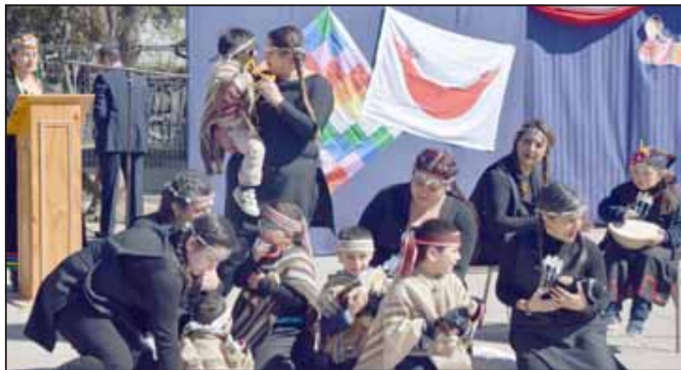
PUEBLOS ORIGINARIOS. - Representaciones mapuches fueron desarrolladas como parte del sello cultural que este año tuvo esta fiesta escolar.