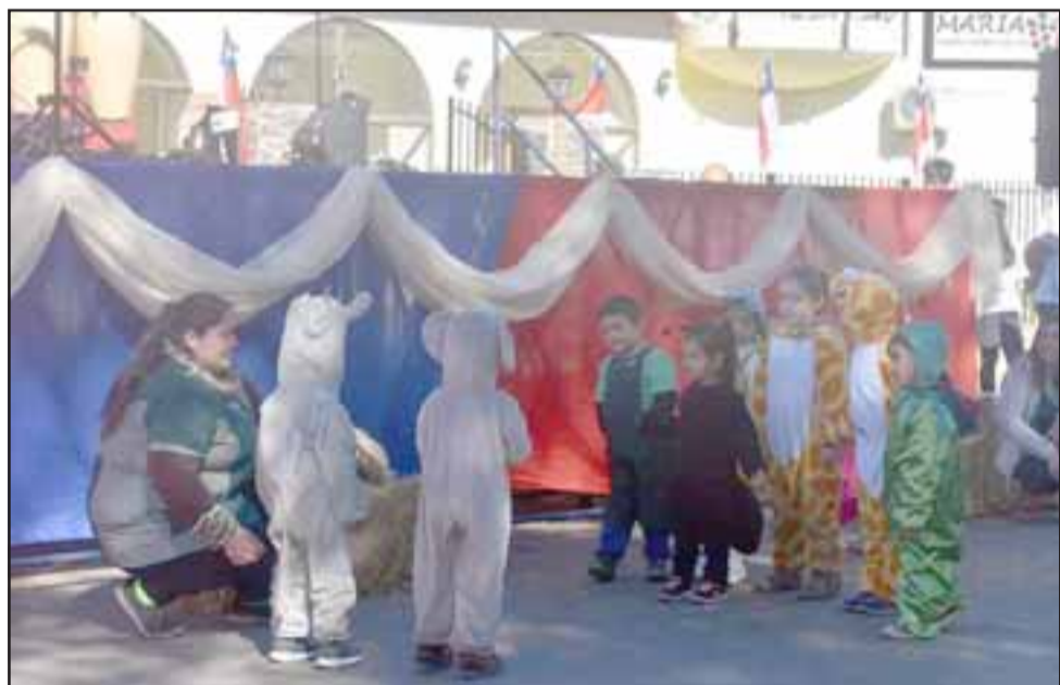
Los párvulos del jardín Pulgarcita también se hicieron presente con un cuento de fábula.