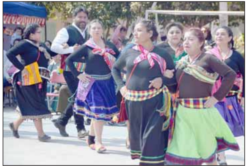
BAILES NORTINOS. - Elegantes bailes nortinos fueron presentados en el patio principal de esa escuela rural de nuestra comuna.

cada curso presenta un área como la Minera, Ganadera y Pesca, la jornada fue muy alegre y sabemos que también este año las Fiestas Patrias se vivirán con mucho entusiasmo en