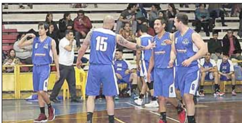
Por la fecha 8ª del torneo 2019 de la LNB, el Prat será local frente al Stadio Italiano.