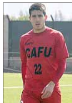
El ahora seleccionado chileno se reintegró el miércoles a los entrenamientos del Uní Uní.

La selección brasileña fue el primer punto de parada del extenso periodo de preparación que tendrá el equipo chileno de cara al