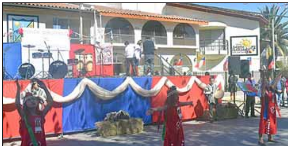
Alumnos de Escuela La Higuera realizaron una hermosa coreografía mapuche.

La autoridad comunal indicó que con la realización de esta actividad se iniciaron los festejos de Fiestas Patrias en la comuna de Santa María, los que continuarán este domingo 15 de septiembre con los tradicionales juegos típicos a partir de las 10 horas en el frontis de la Municipalidad.