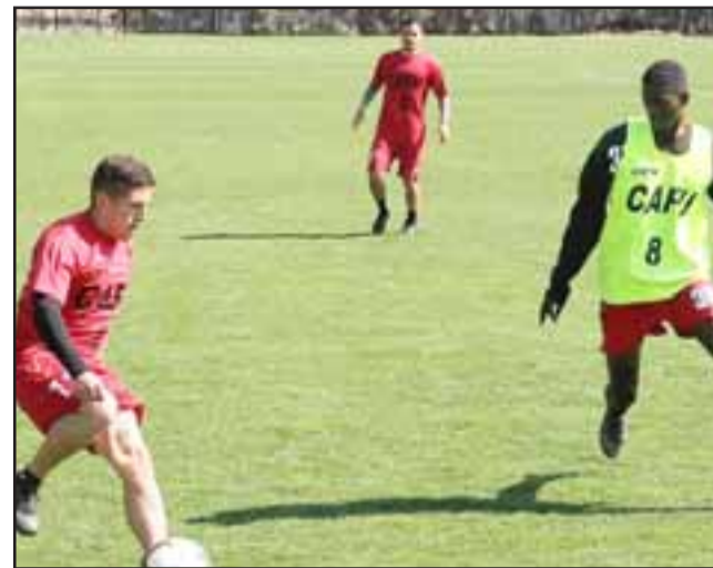
El equipo sanfelipeño debe ganar para seguir dentro de los postulantes a la liguilla del ascenso.