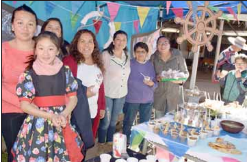
EXCELENTES COMIDAS. - Aquí tenemos a quienes prepararon los platillos, al lado de las delicias ofrecidas al público.

«Es una tradición ya en nuestra escuela hacer dos actividades, primero esta muestra gastronómica y este viernes (hoy) la gala folclórica, aquí participan apoderados y alumnos,