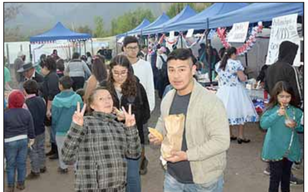
FIESTA Y SABOR.- Cada curso instaló su stand de ventas para recaudar fondos y lograr así desarrollar actividades al final del año lectivo.