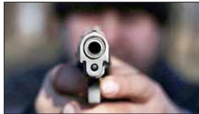
El robo con violencia ocurrió la tarde de este viernes 13 de septiembre en la comuna de Llay Llay, siendo víctima un ciudadano boliviano de 44 años de edad. (Fotografía Referencial).

El lesionado fue derivado hasta un centro hospita-