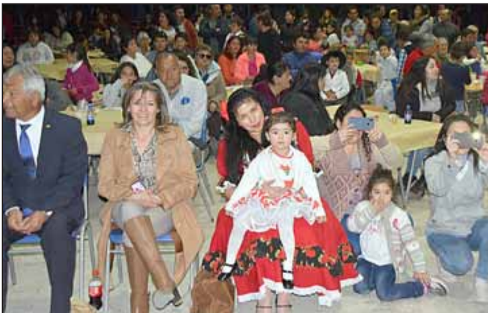
MASIVA CONVOCATORIA.- Autoridades educativas y de nuestra comuna se hicieron presentes para disfrutar este carnaval del folklore.