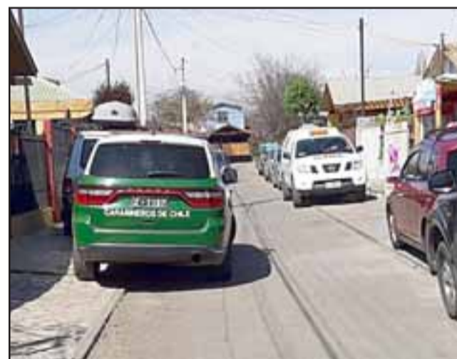
El hecho quedó al descubierto la tarde de este viernes 13 de septiembre al interior de una vivienda ubicada en Villa El Castaño de San Felipe.