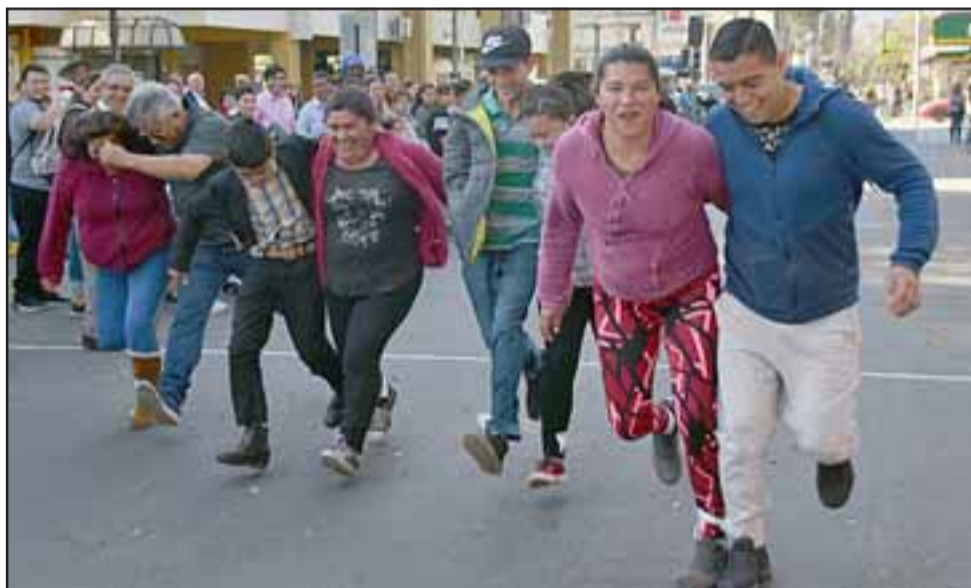
A JUGAR CHIQUILLOS. - Otros en cambio prefirieron correr atados de un pie hasta llegar a la meta.