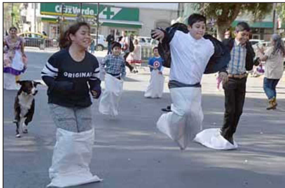
SACOS VOLADORES. - Los ensacados no corrieron, algunos volaron en sus mágico saco hacia la línea de meta.