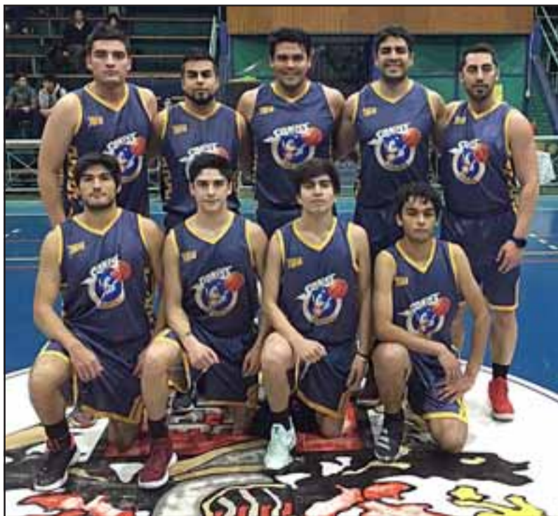
Sonic jugará en la Primera División en el próximo torneo de la Abar.

Las divisiones serán: A: Liceo Mixto, Sonic, Arturo Prat, Arabe, Lobos, San Felipe Basket y Lazen. B: Frutexport, Llay Llay Básquet, Sporting Colonial, Trasandino, Unión Jadid, Iball y Canguros.