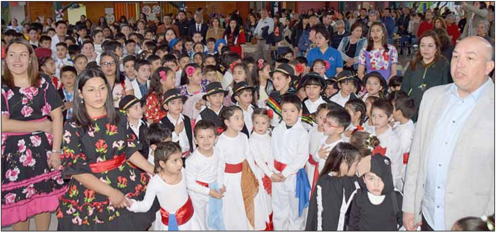
VIVEN SU FIESTA.- Cientos de niños y jóvenes vibraron con cada una de las presentaciones realizadas este fin de semana en la Escuela José Bernardo Suárez, de El Asiento.