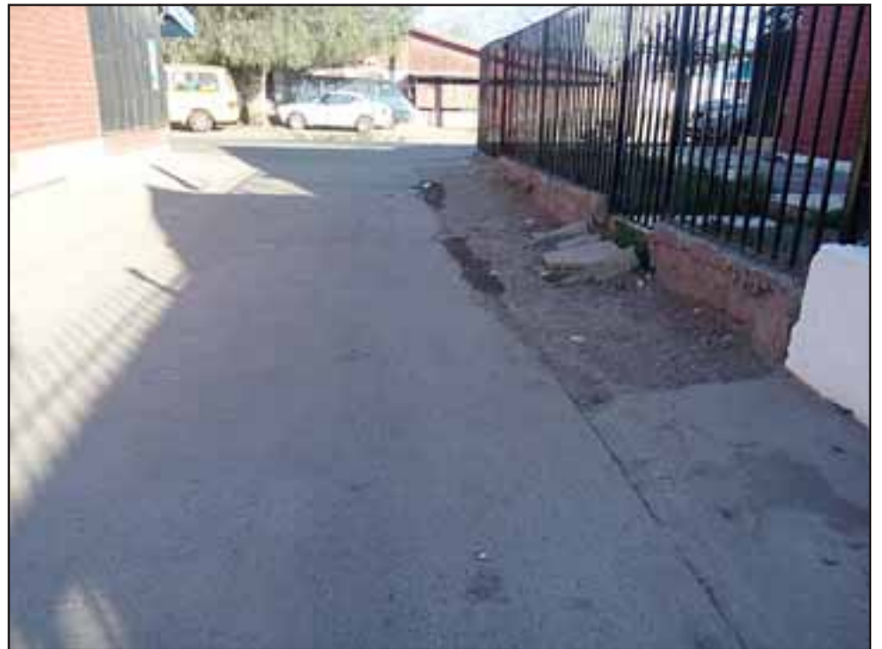
En este lugar fue el asalto al camión repartidor de mercadería.

Dicen que han postulado, pero son rechazados porque según las autoridades ellos son considerados como una 'población modelo'. Sin embargo hay delitos reiterados. Por eso llaman a las autoridades a ayudarlos.