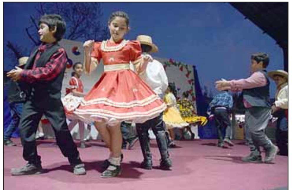
QUE SIGA EL CARNAVAL.- Estos pequeñitos presentaron sus bailes con gran alegría y evidente elegancia.