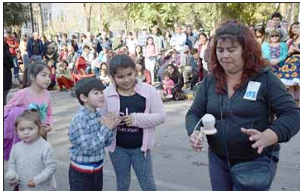
LA REINA DEL EMBOQUE. - Esta vecina ganó la competencia de Emboque, tuvo que derrotar a muchos otros jugadores.