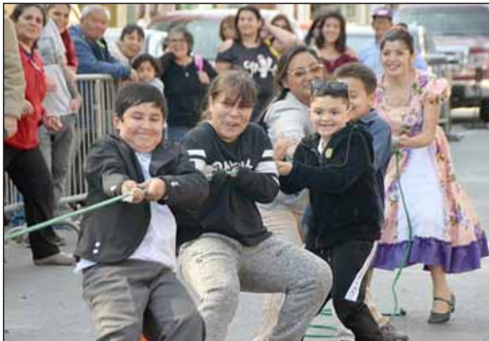
CON FUERZA Y VIGOR. - Así viven las Fiestas Patrias muchos en nuestra comuna, tirando con fuerza de la cuerda de la alegría.