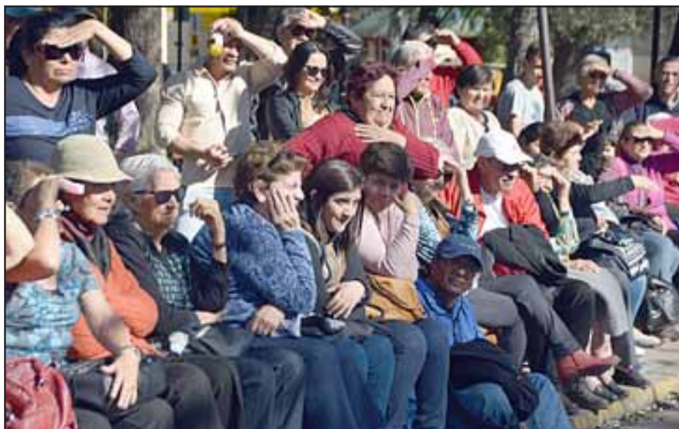
MOMENTO DE REÍR. - Miles de personas acudieron a la Plaza de Armas para ver y participar del gran espectáculo típico.