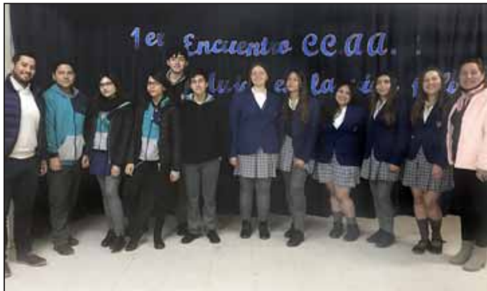
El primer Encuentro de Centros de Alumnos, denominado 'Mujer en la política', se realizó este miércoles el Liceo Corina Urbina.