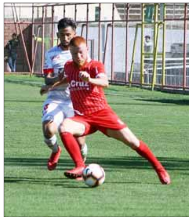
La tarde del sábado pasado Unión San Felipe no estuvo al nivel de otras actuaciones.

En síntesis, un empate completamente justo, y que claramente no fue bien recibido en las huestes locales porque esperaban irse al receso de Fiestas Patrias con una victoria.