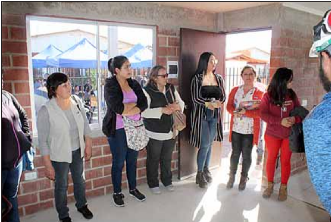
Este proyecto habitacional es una continuidad del Conjunto Habitacional Altos El Mirador.

curso e iniciar las obras de construcción de estas casas.