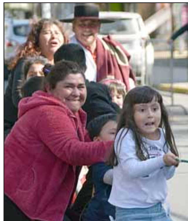
SIN EDAD PARA SER FELIZ. - Cada uno hizo su mejor esfuerzo para disfrutar de los juegos y competencias.