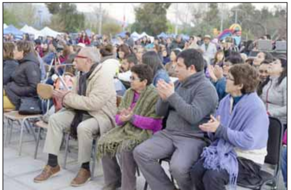
Miles de personas llegaron hasta el anfiteatro del Parque Puento Cimbra, en un espectáculo de primer nivel.