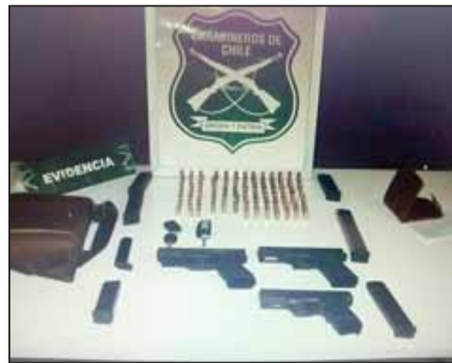
Carabineros incautó las armas de fuego y municiones el 28 de abril de 2018. El sentenciado deberá cumplir una pena única de siete años de cárcel por este delito.