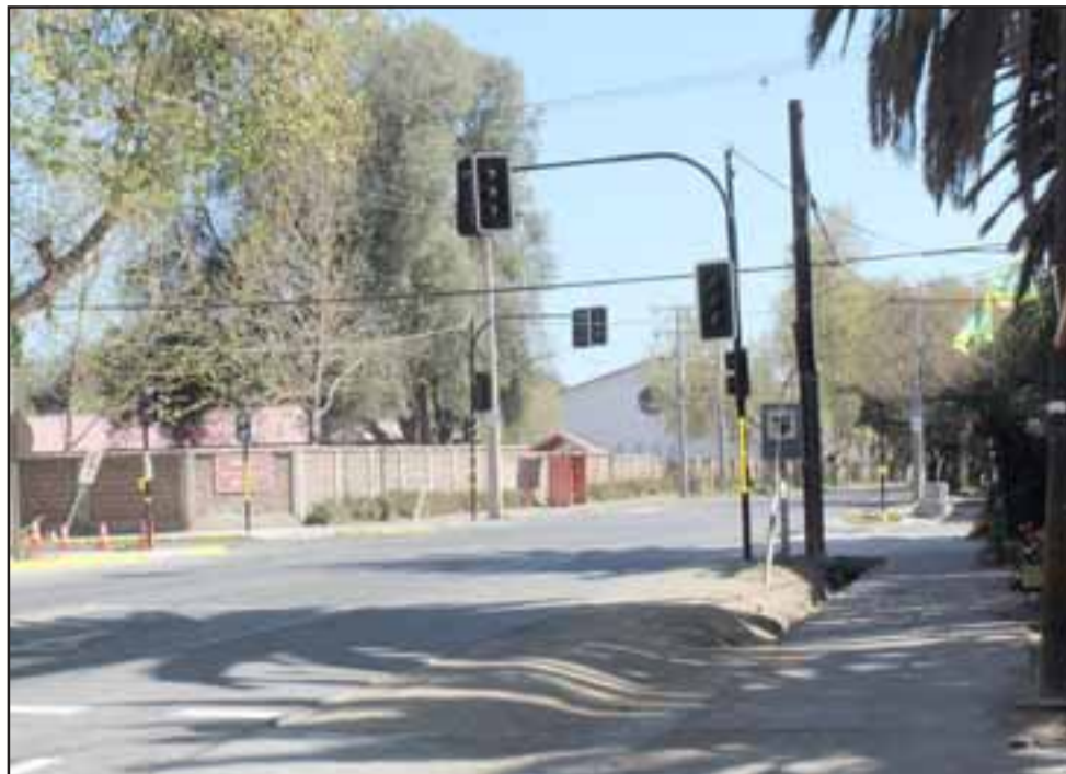
El primer semáforo de la comuna de Panquehue se ubica en el cruce de la ex Ruta 60 CH (actual Ruta Troncal 601) con la calle Antofagasta.

sugerencias en relación a la ejecución de proyectos, y una de esas solicitudes se basó específicamente en la instalación de un semáforo en ese lugar. Postulamos el proyecto, sin embargo nos demoramos en el proceso de adjudicación, ya que al tratarse de solo un semáforo, no habían las suficientes empresas interesadas, razón por la cual hubo que hacer la designación de trato directo.