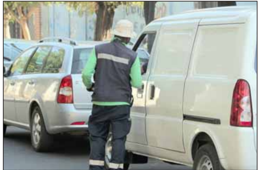
El pasado viernes se puso término a la concesión con la empresa para el cobro de parquímetros, razón por la cual en este momento nadie puede estar cobrando en las calles.

«proceso que tendrá que tomar conocimiento el Concejo Municipal en su próxima sesión».