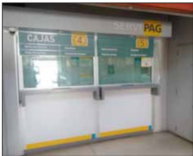
Cajas sin atender en el Supermercado Santa Isabel, pese a la enorme congestión de público.

mismo, pero es un poco más cómodo y hay más cajas», señaló una pensionada.