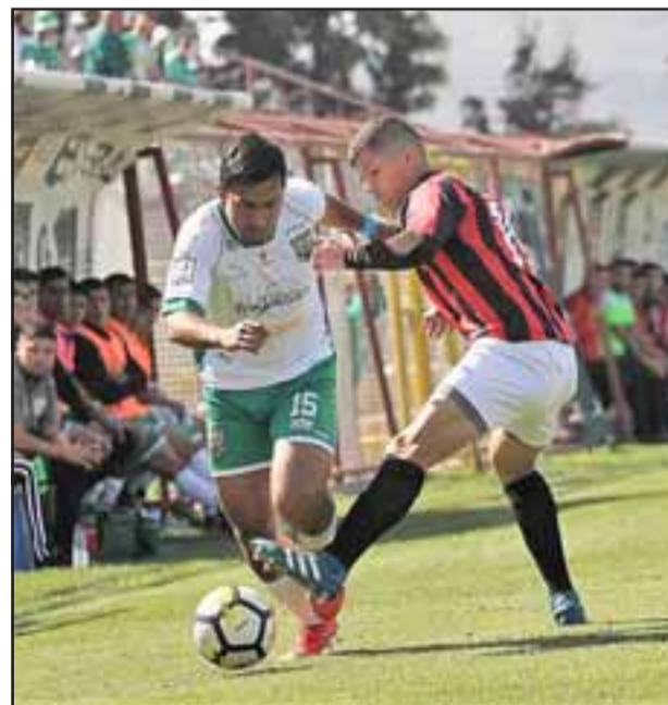
En su segundo duelo en el Municipal, Trasandino ganó 2 a 0 a Rancagua Sur.