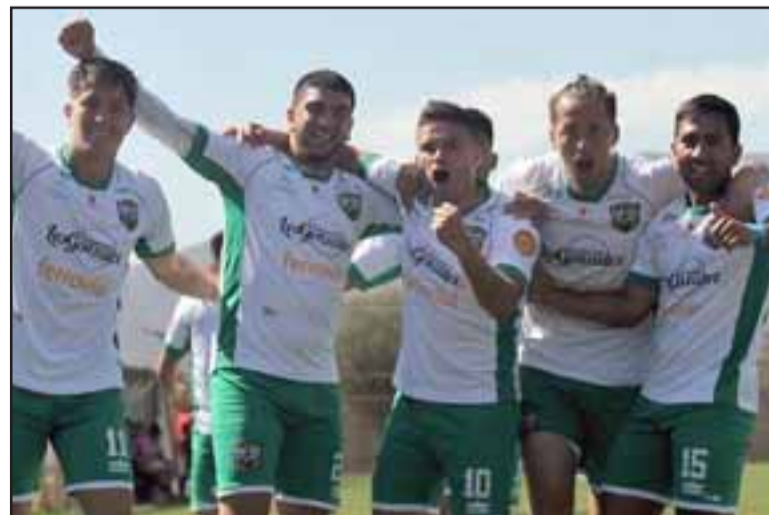
El equipo del 'Cóndor' es el sub líder del torneo A de la Tercera División.