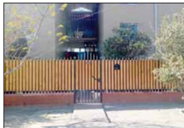
El adulto mayor residía en calle Pedro de Valdivia N° 300 de la Villa El Totoral de San Felipe.

pericias realizadas en el sitio del suceso, se descartaría la intervención de terceros en el hecho: «La data de muerte sería de tres a cuatro días. Al momento de la revisión externa policial, no tenía ningún tipo de lesión atribuible a la acción de terceros y debido a los rasgos cadavéricos, la causa de