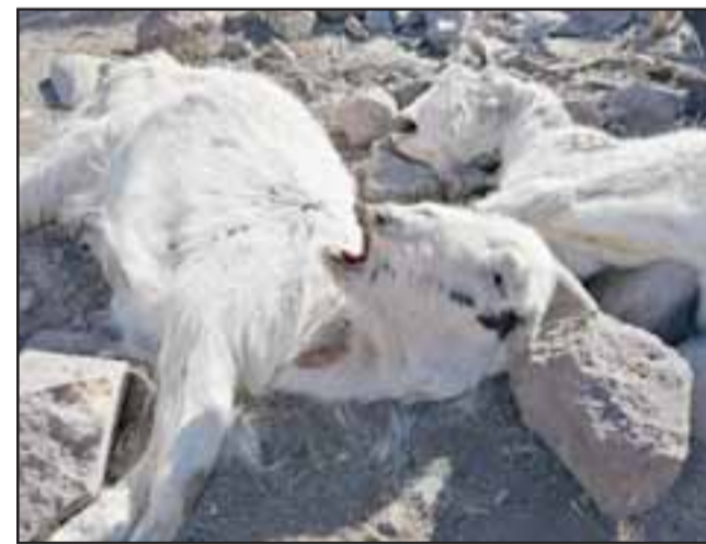
La mortandad de animales en el valle de Aconcagua alcanza cifras desoladoras, tal como las que se aprecian en la imagen.

Este decreto amplía las zonas de catástrofes que estaban vigentes en la región por el decreto 1138 que incluía solo 14 comunas, aho-