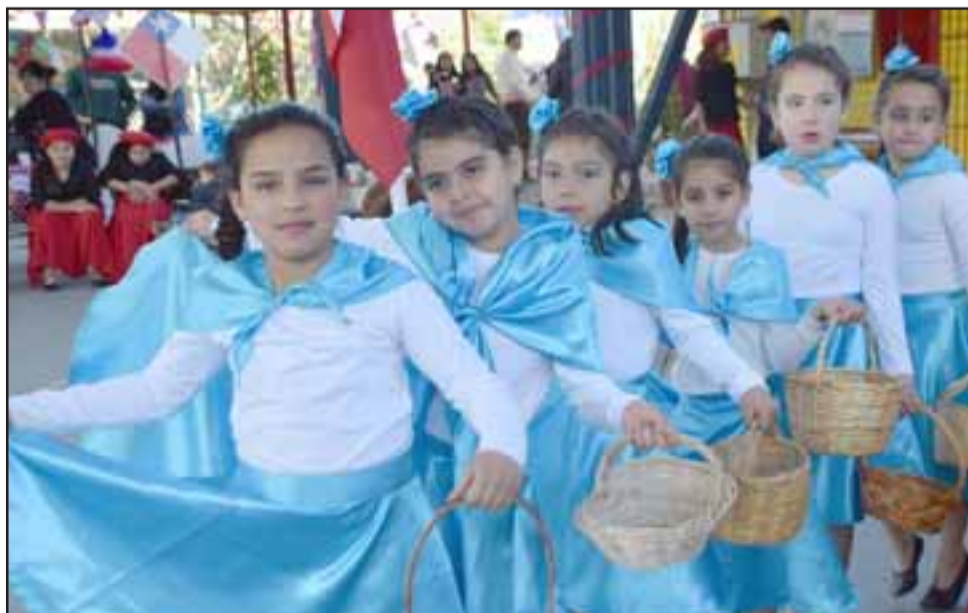
LAS ESTRELLAS DEL DÍA.- Bailes de varias partes de nuestro país fueron presentados en el patio techado de esta escuela, como parte de la Fiesta de la Chilenidad 2019.