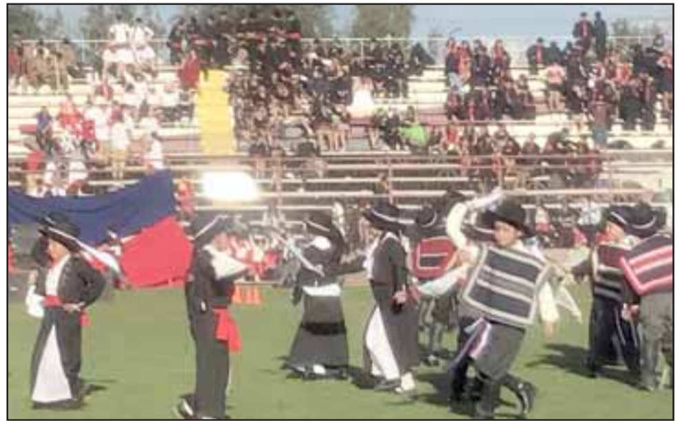
Los alumnos del Liceo Cordillera se lucieron en una gran gala folclórica presentada en el estadio Municipal de San Felipe.

La cancha del estadio municipal se llenó de música, de colores y de la alegría de los niños y jóvenes que le dan vida al Liceo Cordillera.