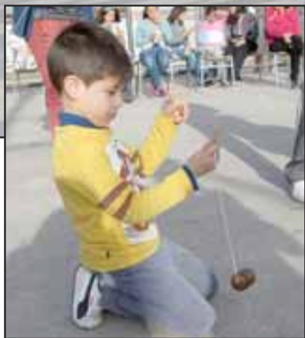
La Junta Vecinal de Villa El Señorial continúa desarrollando grandes esfuerzos en beneficio de la niñez y vecinos en general de esa población sanfelipeña. Aquí vemos a este pequeño jugando con su trompo favorito.