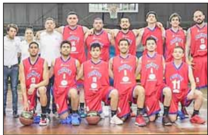
Con su caída ante Stadio Italiano, el Prat quedó como colista absoluto de la Conferencia Centro de la LNB.