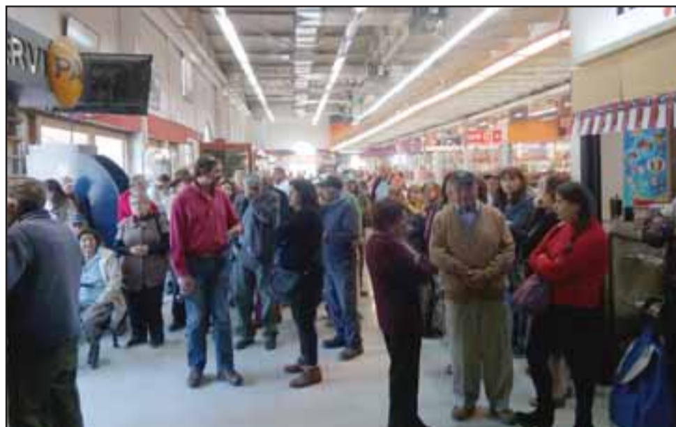
Acá se aprecia la gran cantidad de personas que estaban esperando ser atendidas ayer en la mañana.

Otra persona también de la tercera edad, opina lo mismo que la anterior: «Imagínese, llevamos cuántas horas aquí, llegué cómo a las diez y media y son un cuarto para las doce y tengo el 208. Déjeme decirle que esta situación ocurre todos los meses, ahora hay más gente porque citaron a todos el 16, hoy día, pero siempre ocurre cuando van a haber fiestas; para la semana santa también pasó lo mismo, además que no están abiertas las demás cajas, no sé por qué no las abren. En el Santa Isabel de Merced es lo