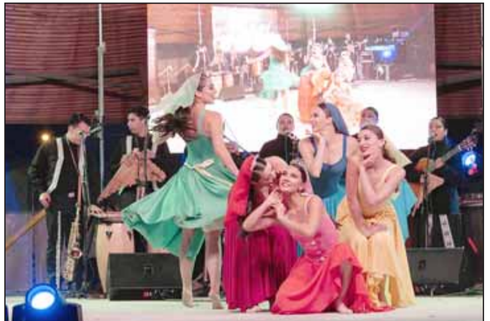
Multitudinaria actividad se vivió este fin de semana en el Parque Puento Cimbra, que tuvo como número estelar al Bafochi y que dio inicio a las actividades de Fiestas Patrias en Putaendo.

«Putaendo nunca pierde su identidad y patrimonio. En este sentido, invitamos a participar de un ambiente campesino en cada una de las actividades que se desarrollarán en toda nuestra comuna. Pasémoslo bien con alegría y responsabilidad», convocó el alcalde.