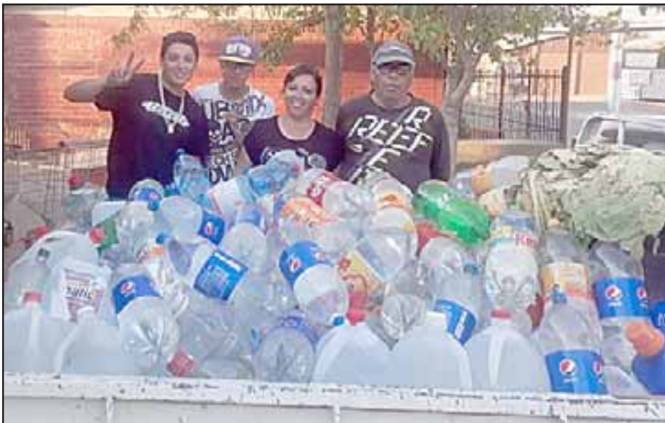
Los vecinos están bastante motivados participando en la campaña de colectar agua en bidones, botellas, lo que sea.