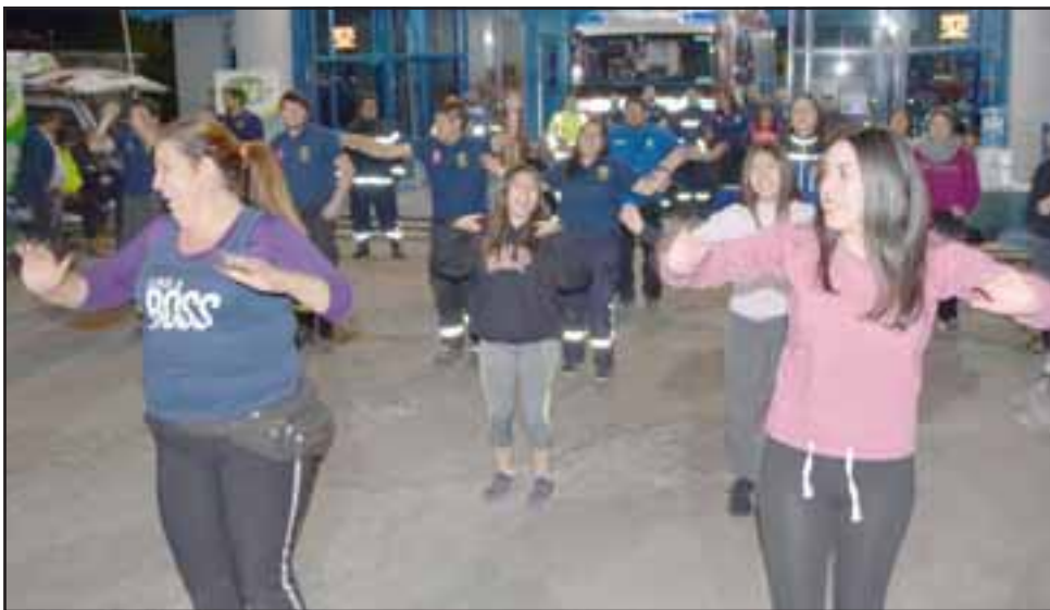
ELLAS AL FRENTE.- Las damas fueron quienes con más energía participaron en esta iniciativa organizada por 'La Segunda' de Bomberos.