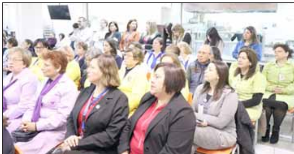
Autoridades y funcionarios del Hospital San Camilo presentes en la ceremonia de celebración de los 177 años del establecimiento.

«Estamos en medio de importantes cambios que benefician directamente a los usuarios y esperamos que en este nuevo proceso sigan llegando las mejoras que nos acercan a una atención de excelencia, para lo cual seguiremos trabajan-