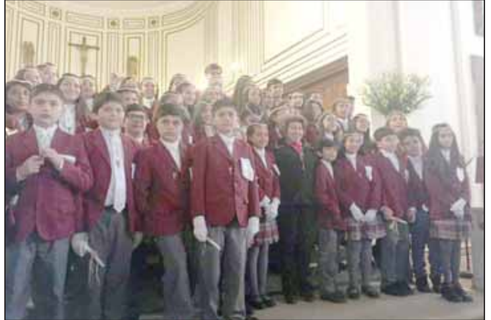
Un total de 45 alumnos del colegio Alonso de Ercilla de San Felipe realizaron su Primera Comunión en la Iglesia Catedral de San Felipe.

De igual manera la directora del centro educacional felicitó a los estudiantes y sus apoderados, quienes se comprometieron con su participación en catequesis, compartiendo eucaristías, jornadas de reflexión, retiros espirituales, encuentros de pastoral y entrega de ayuda social en visitas que los niños realizaron a hogares de ancianos.