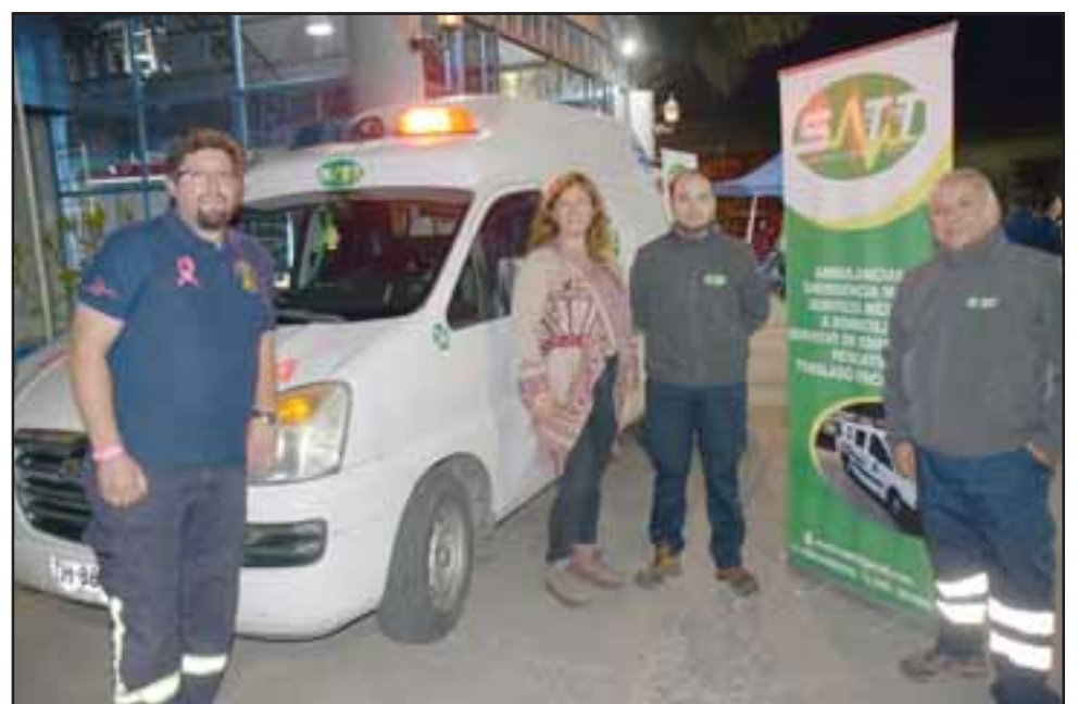
La empresa Ambulancias SATT brindó una ambulancia para atender cualquier emergencia, y lo hizo de manera gratuita.