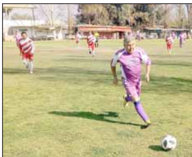
En la competencia para jugadores mayores de 50 años de la Liga Vecinal, dos equipos disputan palmo a palmo el título.

Por su lado Los Amigos sufrió harto para poder superar por 2 tantos a 1 a un crecido Unión Esfuerzo.