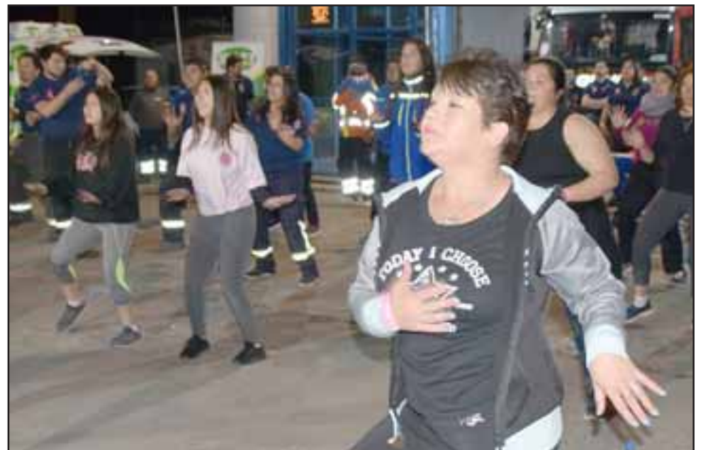
SALUDABLE JORNADA.- Hombres, mujeres y niños sacaron el mejor provecho a la jornada deportiva, como se nota en esta gráfica.