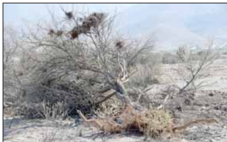
TRISTE ESCENARIO.- Son muchos los árboles que serán enterrados una vez cortados, según supo nuestro medio.

b) Agua industrial: El agua para uso industrial será provista por empresa del sector que cuente con sus respectivas autorizaciones sanitarias. La ubicación precisa de la fuente de abastecimiento será informada a la Autoridad previo al inicio de las obras. Se estima un consumo de agua para uso industrial, estableciendo un cálculo estimado de 10.000 litros diarios . El agua para uso industrial se utilizará como mecanismo de humectación de los caminos internos no pavimentados del Proyecto. Se estima un volumen mensual de 200.000 litros para esta actividad, considerando humectación de lunes a viernes (20 días).