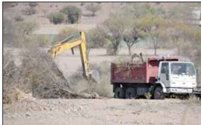
TODO EN REGLA.- Así luce ahora el panorama, algunos de los comuneros arrendaron este terreno y al parecer todos los permisos están en regla.