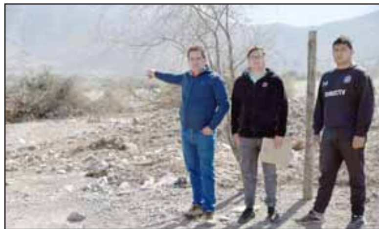
VECINOS MOLESTOS.- Varios vecinos del sector muestran a Diario El Trabajo los árboles arrancados por los tractores de la empresa a cargo del proyecto.

- En lo del tema del agua usted está en lo correcto, en el sentido que existe una condición de sequía, en nuestra empresa estamos enterados, por lo que a efectos de atenuar el impacto en términos de consumo de agua, nuestra empresa producirá una modificación respecto a lo que está declarado en la RCA y los compromisos que ahí están escritos, hablando de manera más concreta, para la etapa de construcción de la planta solar no se van a utilizar recursos hídricos de la zona, sino que se van a comprar bidones a nuestro costo y los llevaremos al lugar de construcción y los vamos a consumir en obra a través de bidones. También los baños van a ser químicos, tampoco para los baños consumiremos agua de la zona (...) en la etapa de operación en el estado actual en la RCA se contemplan diez personas para operar la planta, eso es lo que originalmente se contempló, quiero dejar en claro que nosotros no necesitamos diez personas para esta operación, podemos trabajar con una persona y a lo más dos personas en