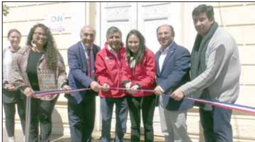
Autoridades presentes en la ocasión proceden al corte de cinta que da por inaugurada la única Oficina de la Niñez en la Quinta Región.