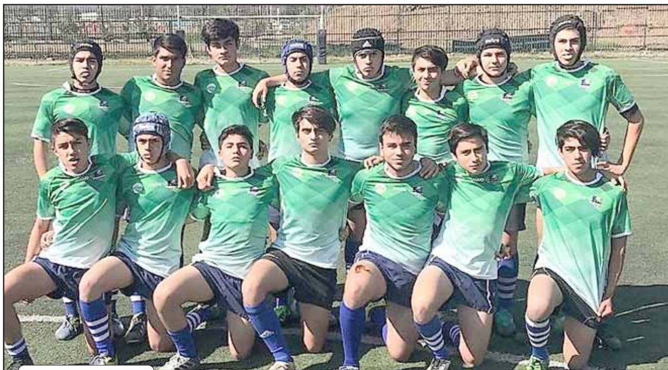
Por el torneo de la Arusa el equipo de la serie intermedia de Los Halcones se enfrentará a la Universidad de Chile.