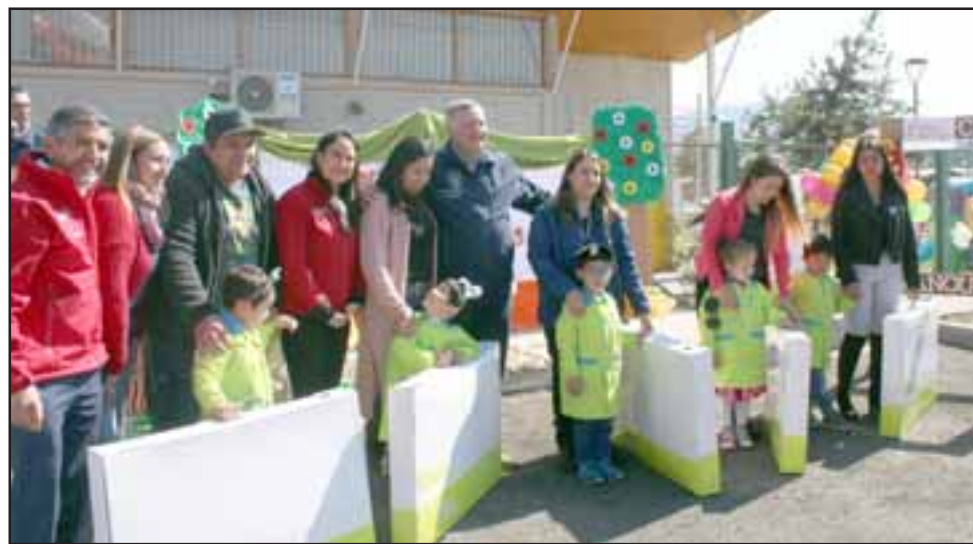
La entrega de los sets del 'Rincón del Juego' se realizó en ceremonia efectuada en el centro de Salud Familiar María Elena Peñaloza, con la presencia de autoridades, padres, apoderados y niños de la comuna.