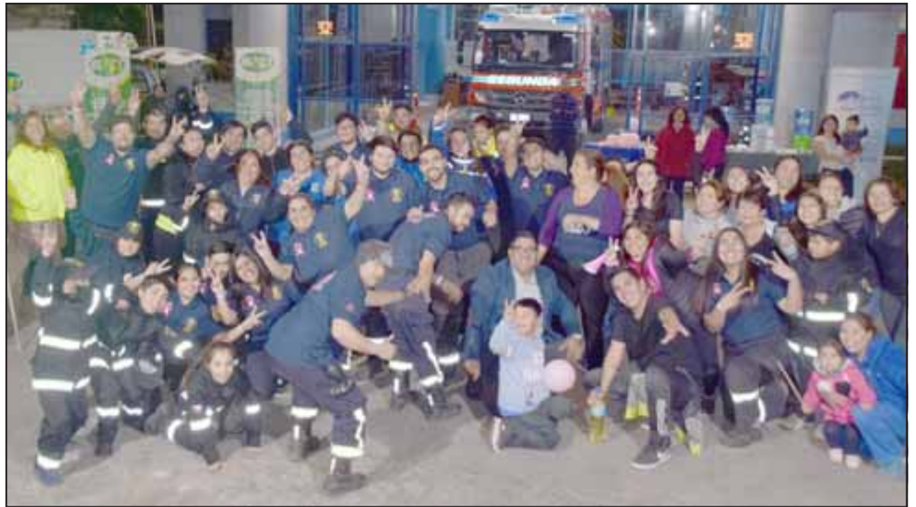
A PREVENIR EL CÁNCER DE MAMA.- Ellos son parte de los participantes de esta masiva Zumbatón por la vida, desarrollada la noche del martes en el patio de Bomba La Internacional.

Entre las actividades programadas por Bomberos para este mes de octubre están: Visita a Hogar de Mayores San Felipe El Real 1 y 2, frente a Sodimac, mañana viernes 4 de octubre a las 16:00 horas; Competencias internas de bomberos en Bellavista al mediodía, y Charla sobre riesgos eléctricos a las 19:00 horas en el cuartel de la Segunda Com-