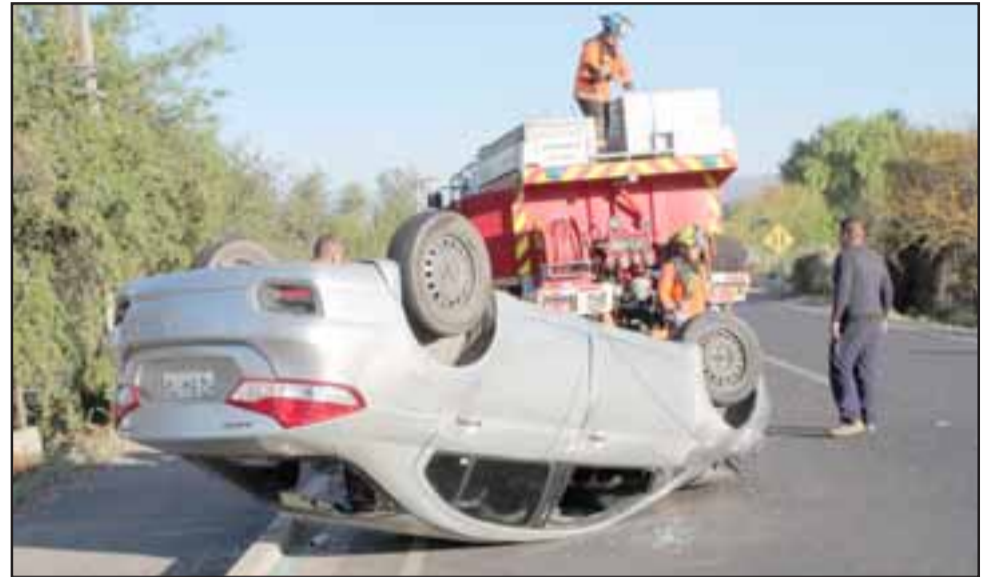
Primero este auto chocó contra una barrera de contención y al evitar colisionar con un camión perdió el control.

Afortunadamente el joven logró salir por sus propios medios desde el interior del auto, siendo asistido en primera instancia por su padre que iba en una camioneta que lo precedía. Posteriormente arribó la