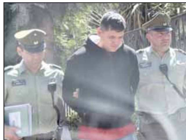
El imputado de 26 años de edad fue detenido por Carabineros, siendo trasladado hasta el Tribunal de Putaendo para ser formalizado por la Fiscalía.

En tanto el segundo sujeto que logró fugarse, estaría identificado y su deten-