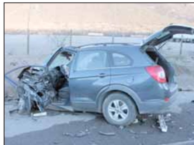
Este accidente se produjo frente al parqueadero 'El Toco', en Autopista Los Libertadores.

A consecuencia de lo anterior, su conductor de iniciales H.A.C. , de 81 años y su esposa C.L.B. , de 80 años de edad, quedaron atrapados en el interior de la cabina, siendo