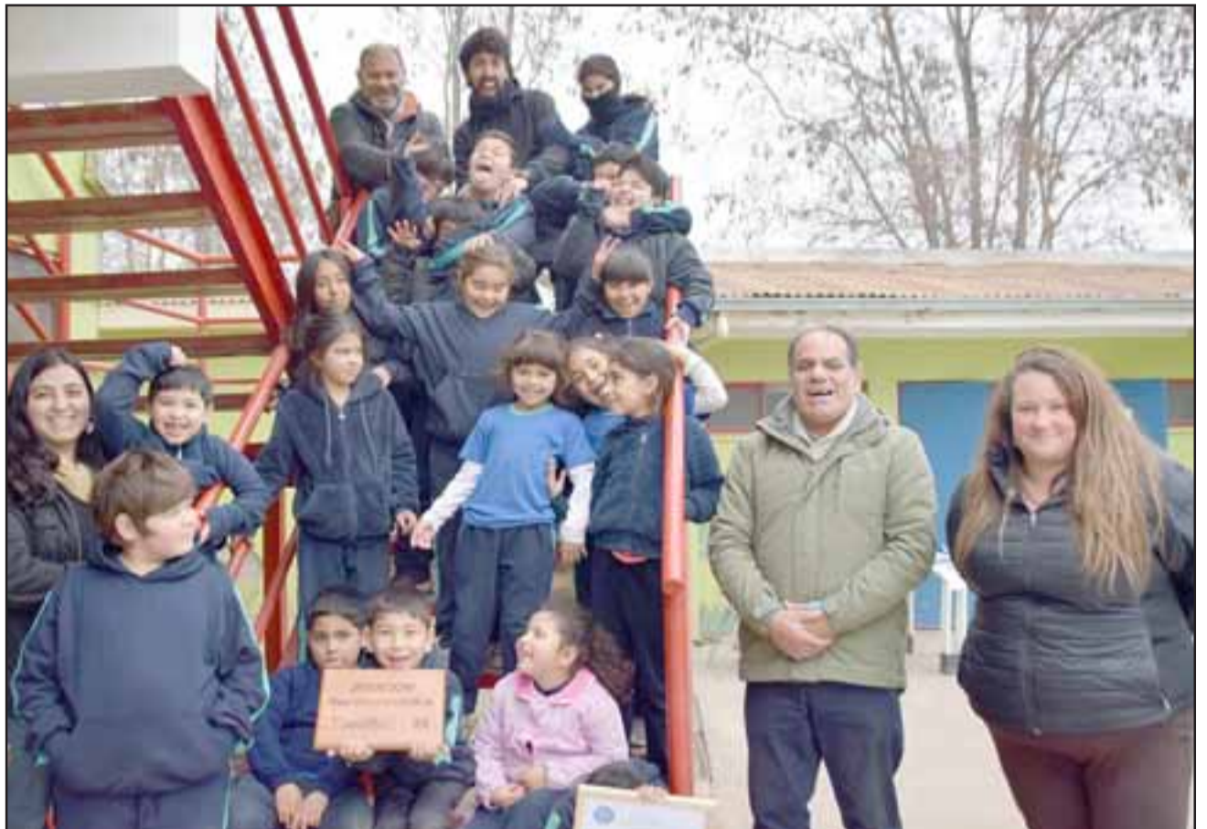
LOS ANFITRIONES.- Estos pequeñitos son los anfitriones de la III Feria Científica Comunal 2019, que desarrolla su Escuela San Rafael en el centro de nuestra comuna.

corresponden al Plan de Mejoramiento Escolar del establecimiento, y el lema de la feria este año es: ‘La Curiosidad es Patrimonio de todos’ . Esta escuela cuenta con una matrícula de 42 alumnos y, aunque es pequeña, es una de las que más iniciativas visibles desarrollan durante el año.