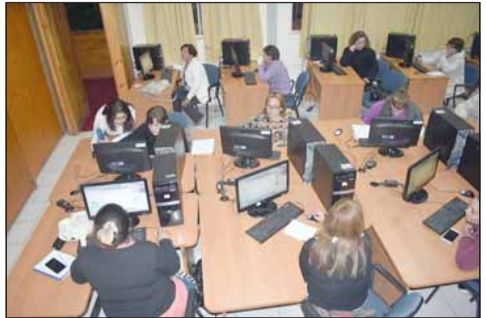
Alfabetización digital, uno de los cursos que ha concitado bastante interés por parte de la comunidad.