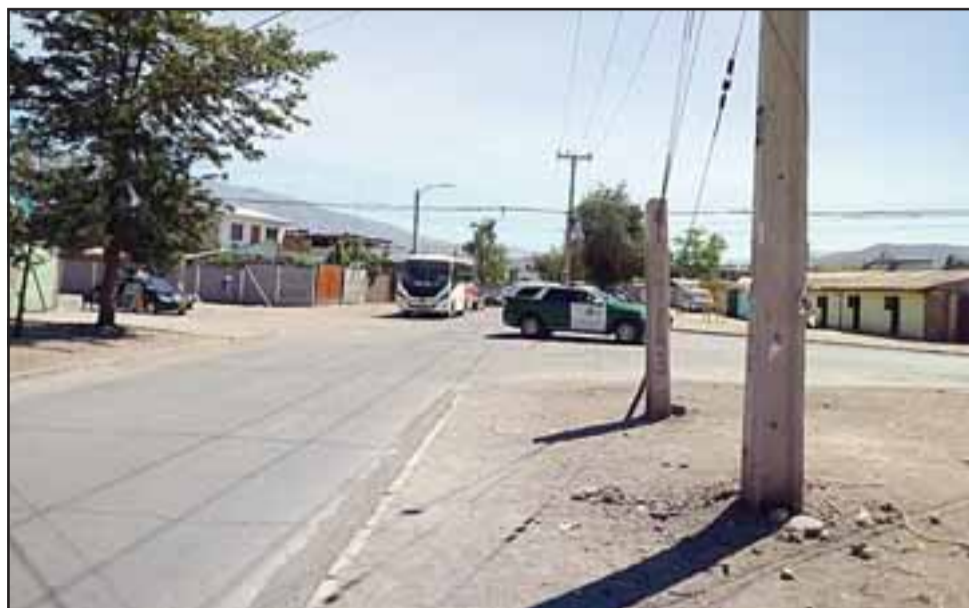
Este es el lugar donde se reúne gran cantidad de haitianos, especialmente en la mañana tipo 07:00 horas para salir a sus trabajos.

Reconoce que cuando recién llegaron eran muy humildes; «Ahora no, la tratan a uno de concha de