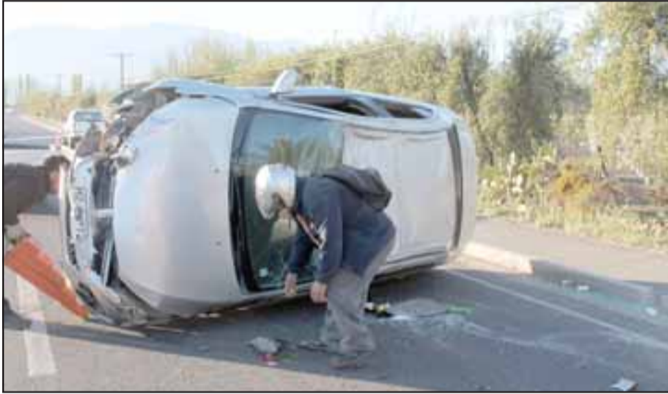
La Unidad de Rescate del Cuerpo de Bomberos de San Esteban que colaboró con labores de despeje de la ruta.

las barreras de concreto que lo hicieron perder el control. A fin de evitar impactar con un camión que iba en sentido opuesto realizó una maniobra que evasiva que lo hizo terminar volcando de campana.