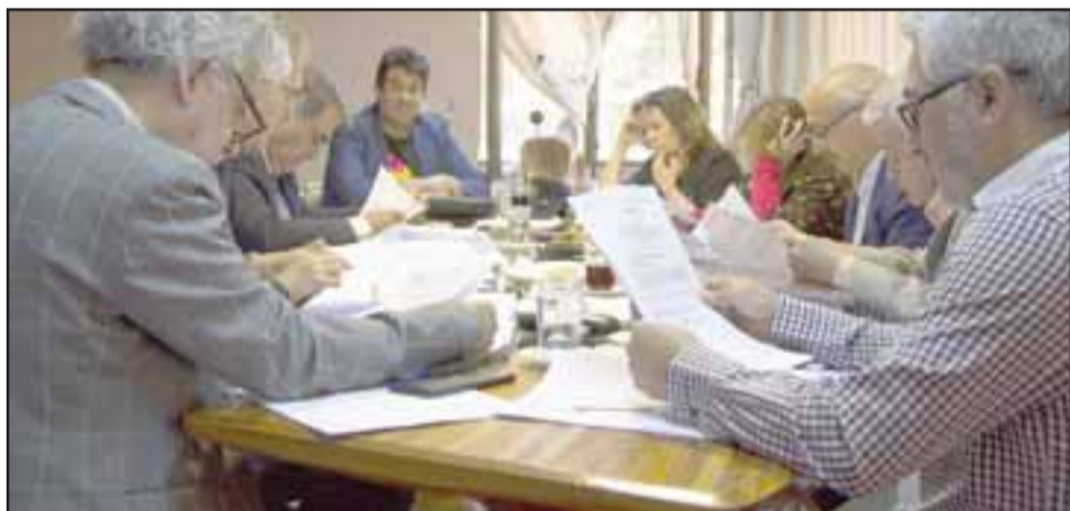
El Concejo Municipal en su sesión de ayer resolvió adjudicar el cobro de parquímetros a la empresa NEC, la que operará en forma transitoria por cuatro meses.

La empresa NEC se adjudicó el trato directo para la concesión de los parquímetros durante los próximos cuatro meses, esto tras la votación favorable del Concejo Municipal y que permite iniciar el trámite administrativo para que comience a operar a la brevedad.