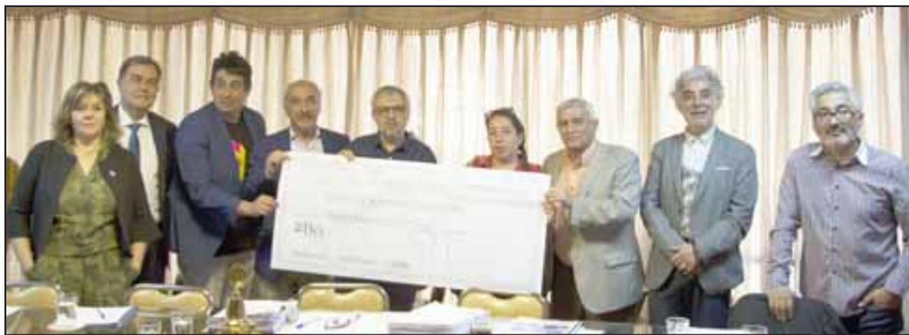
Alcalde y concejales entregando un gigantesco cheque a la institución de los 'Caballeros del Fuego'.

A esto se suma que, en este mes de octubre, se hará entrega oficial del cuartel de la Quinta Compañía a la empresa que se adjudicó el proyecto de reposición, lo que permitirá contar con un edificio moderno acorde a los requerimientos que tie-