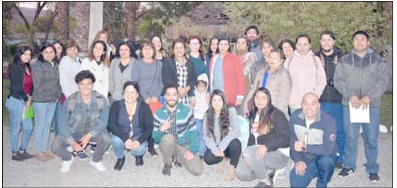
En la imagen los alumnos y alumnas del curso primeros auxilios.