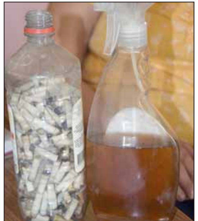
ORIGINAL INVENTO.- Este es el repelente de insectos que fabricaron los estudiantes de la Escuela San Rafael, tomando como base las colillas de cigarro.