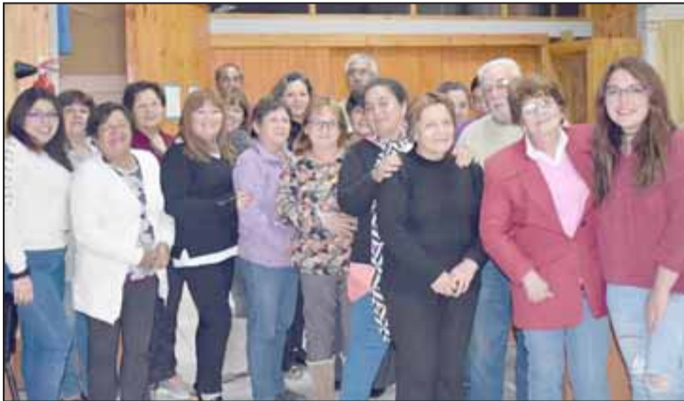
Aquí vemos a los estudiantes de Alfabetización Digital, felices participando de su primer día de clases, junto a sus profesoras.

das por académicos y otras actividades de interés.