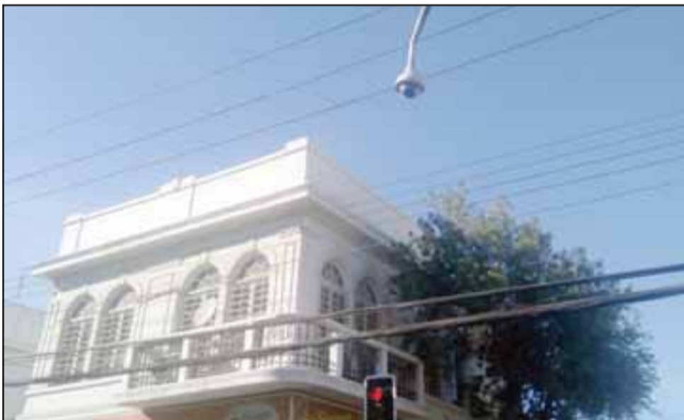
Esta es la cámara que nunca ve nada, se encuentra ubicada en la intersección de Salinas con Merced.

veinte veces las que le han robado; «Voy para las 30 veces que me han robado», finalizó.