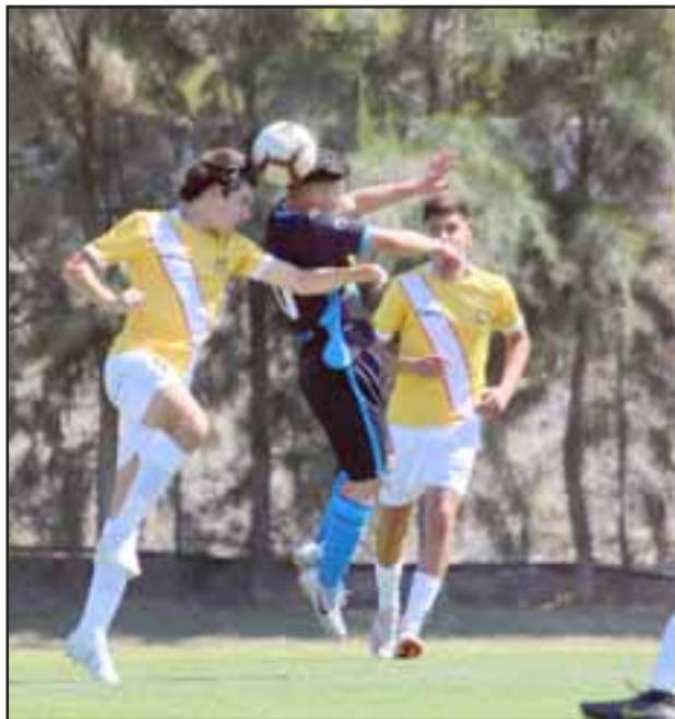
El equipo Sub-17 albirrojo superó 3 a 1 a Colchagua