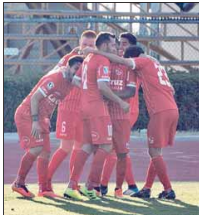
El cuadro sanfelipeño está a las puertas de los puestos de postemporada.