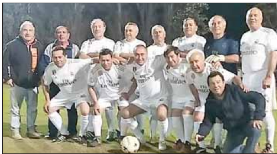
Los Del Valle es uno de los equipos que participa en la competencia Súper Máster de la Liga Vecinal.