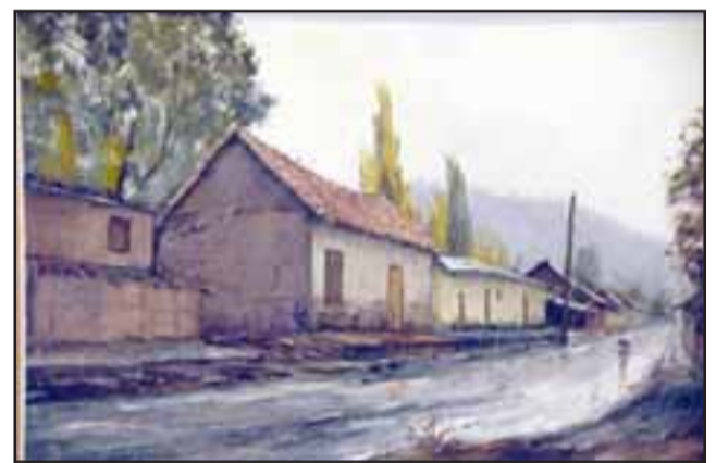
IMPERDIBLE.- Muchas son las obras de este fructífero artista del pincel que estarán en exhibición a partir de hoy y hasta el 31 de octubre.