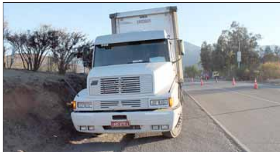
Este camión con matrícula brasileña salía del parqueadero 'El Toco' cuando ingresó a la autopista para dirigirse a Santiago, golpeando al auto menor.

ambos derivados hasta el Hospital San Juan de Dios. En cuanto al conductor del camión, este salvó ileso, siendo trasladado hasta también al centro asistencial para realizarle el examen de alcoholemia. Carabineros de Los Andes quedó a cargo del procedimiento para establecer las responsabilidades.