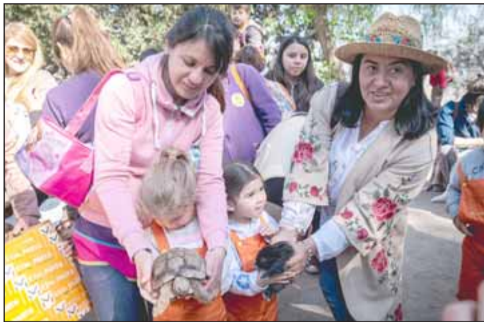
BENDICIÓN DE ANIMALES.- Estos niños llevaron sus mascotas a lo alto del cerro para que fueran bendecidas.