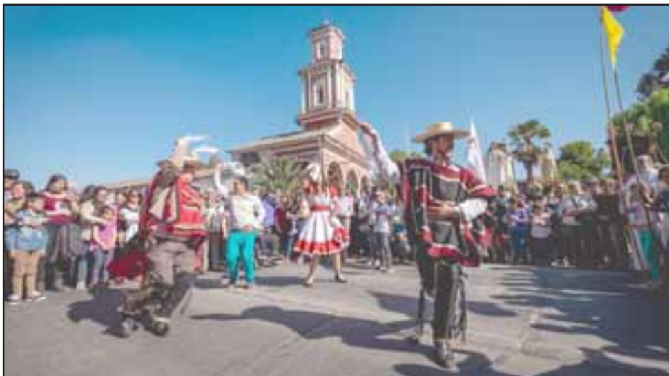
VIVO CURIMÓN.- La cueca no pudo faltar en este espectacular escenario, al fondo vemos el majestuoso pero tristemente célebre templo católico.