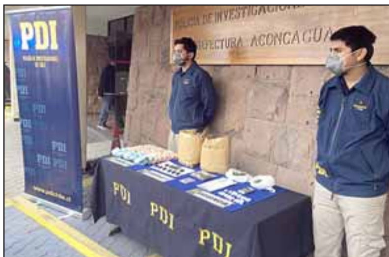
El procedimiento policial denominado 'Operación Proceso' culminó con la detención de un ciudadano chileno y un boliviano, quienes registran domicilio en Catemu.

trasladan la droga». El ciudadano boliviano fue individualizado con las iniciales J.T.L. de 34 años de edad, mientras que el chileno F.J.G.S. de 33 años de edad, ambos sin antecedentes delictuales fueron derivados hasta el Juzgado de Garantía de Los Andes para ser formalizados por la Fiscalía por el delito de Tráfico de drogas. Pablo Salinas Saldías