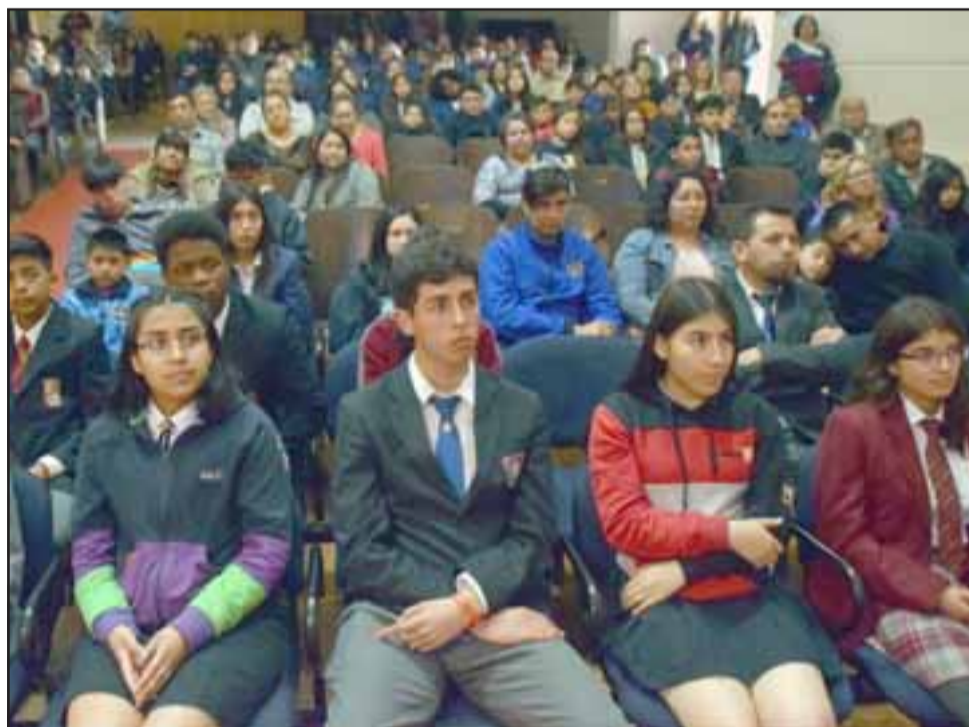
SON LOS MEJORES.- Al frente vemos a todos los jóvenes premiados ayer por Rotary Club San Felipe.