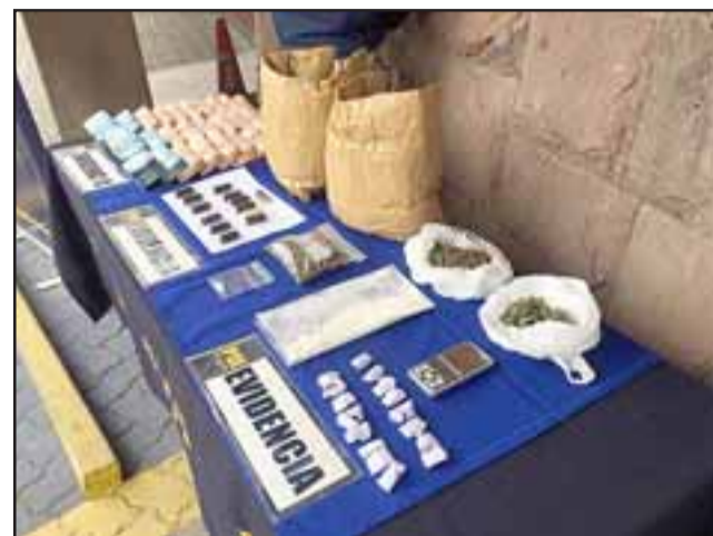
Personal de la Brigada Antinarcoóticos de la Policía de Investigaciones de Los Andes incautó las drogas y el dinero en efectivo en la Ruta 5 Norte de la comuna de Llay Llay.