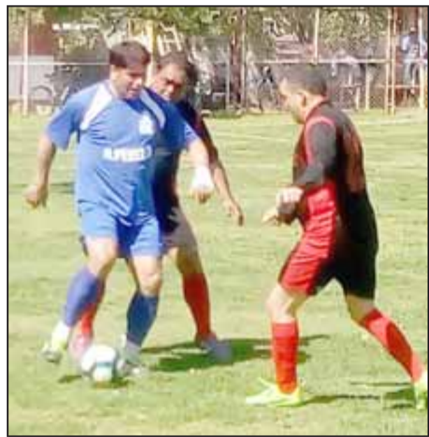
El domingo se jugará un partido que puede ser decisivo en la Liga Vecinal.