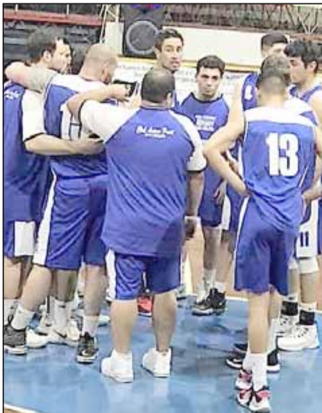
El quinteto pratino jugará como forastero ante Sergio Ceppi.