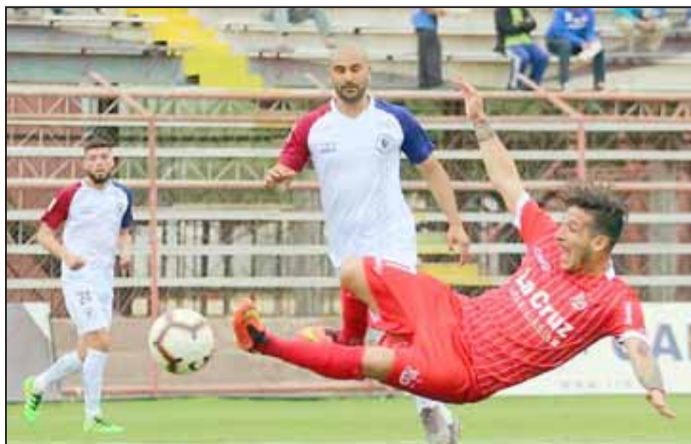
Al partido de mañana la escuadra albirroja llega precedida de tres triunfos en línea.