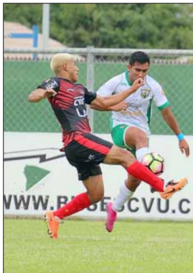
Este sábado Trasandino puede clasificar a la liguilla por el ascenso.