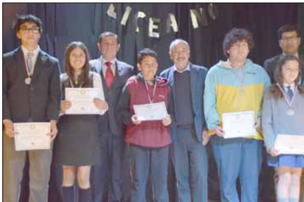
SEMANA DEL NIÑO.- Las autoridades rotarias, municipales y de Educación destacaron a los Mejores Compañeros de distintos colegios de nuestra comuna.