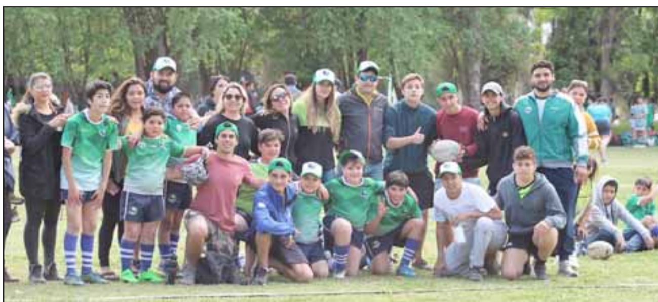
Una delegación de Los Halcones participó en un festival de rugby en Argentina.