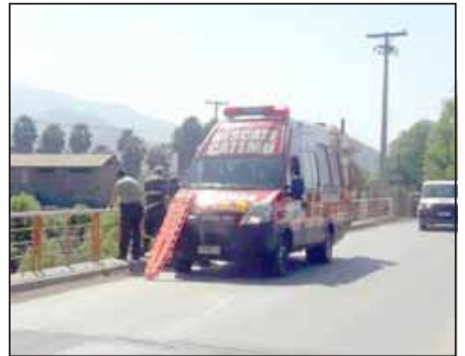
A eso de las 10:45 horas de ayer jueves fue hallado el cuerpo sin vida de un vecino de 59 años de edad, quien se habría suicidado en el Puente Santa Rosa de Catemu.