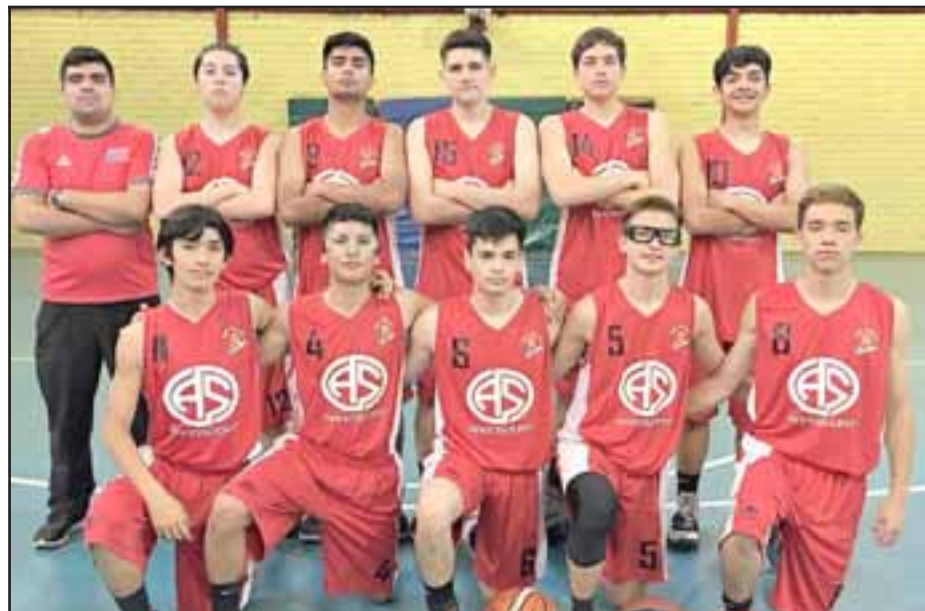
San Felipe Básquet apostó por la juventud en el torneo Clausura de la Asociación de Básquetbol Alejandro Rivadeneira.