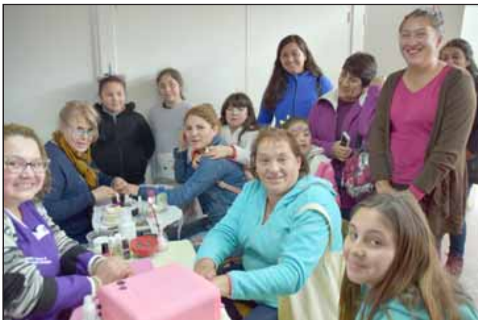
REGALONEADAS.- Las damas también fueron regaloneadas en este operativo, pues recibieron su pedicura de manera gratuita.