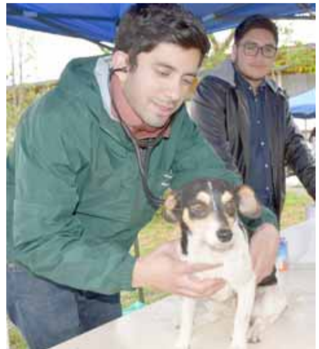
ATENCIÓN VETERINARIA.- A este perrito también le tocó médico, el profesional valoró las condiciones del animal y recomendó cuidados a su amo.

CORTES DE PELO.- A este pequeñito lo dejaron bien guapo con este corte de pelo, una gran jornada comunitaria en la que todos se vieron favorecidos.