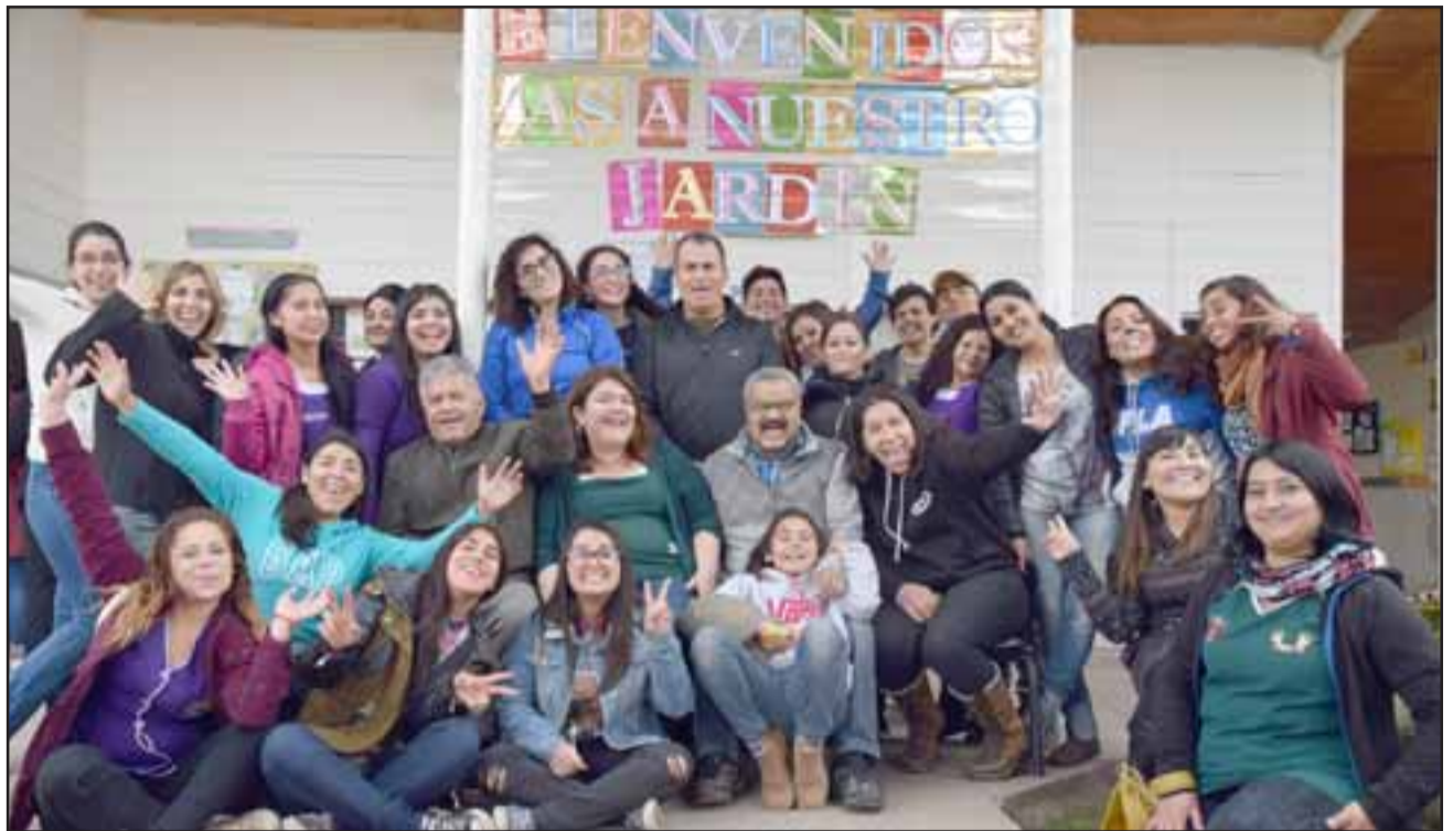
VIENE EL SEGUNDO.- Aquí tenemos a gran parte del equipo que desarrolló el operativo social en el Jardín Rincón de Angelitos en 2018, entre ellos personal del mismo Jardín, estudiantes universitarios y miembros de la Iglesia.

Esta actividad estará siendo patrocinada por la Daem San Felipe y la Municipalidad de nuestra comuna, y será ejecutada por la Iglesia Latinoamericana, Templo Belén, así lo confir-