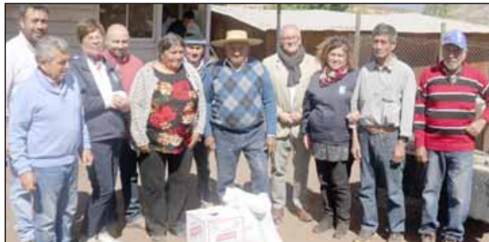
Ellos son parte de las familias que ya están recibiendo recursos para salir adelante en esta situación de emergencia.

REPÚBLICA DE CHILE GOBIERNO INTERIOR PROVINCIA DE SAN FELIPE MUNICIPALIDAD DE SANTA MARÍA