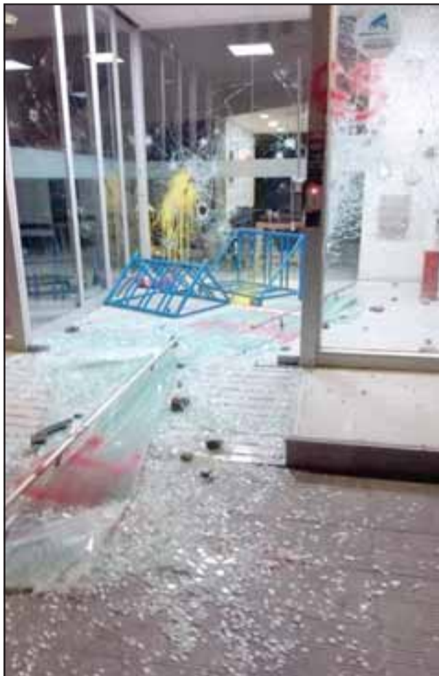
Banco Scotiabank con daños de consideración.

Serios incidentes se registraron desde la tarde noche de este sábado tras el descontento social que impera en el país con el inicio de protestas pacíficas de la ciudadanía por las calles de las provincias de San Felipe y Los Andes, que dieron paso a los saqueos y daños a la propiedad privada.