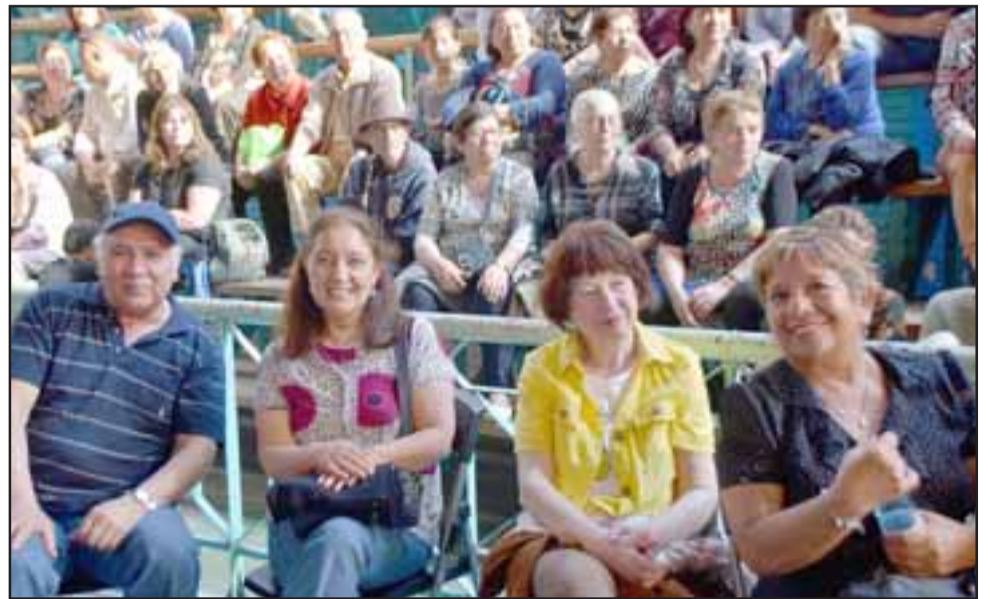
RECORDAR ES VIVIR. - Vecinos de todas las edades se dieron cita en el gimnasio del Liceo Roberto Humeres para disfrutar del Primer Malón del Recuerdo.

«Estamos muy contentos de celebrar a nuestros adultos mayores, quisimos que ellos tuvieran una tarde muy especial y vemos que lo pasaron muy bien, bailamos y cantamos todas las canciones de aquellos tiempos, para esta gestión es fundamental celebrarlos, no solo un día, sino todos los días, porque la experiencia que ellos tienen es importante para nosotros.