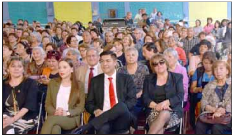
TODOS AL MALÓN. - Autoridades de varias trincheras se olvidaron de su color político para disfrutar amablemente del gran Malón del Recuerdo.