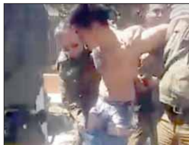
CAPTURADO.- El malviviente fue seguido por vecinos y finalmente descubierto oculto bajo la cama en un inmueble donde vive un funcionario de Carabineros.