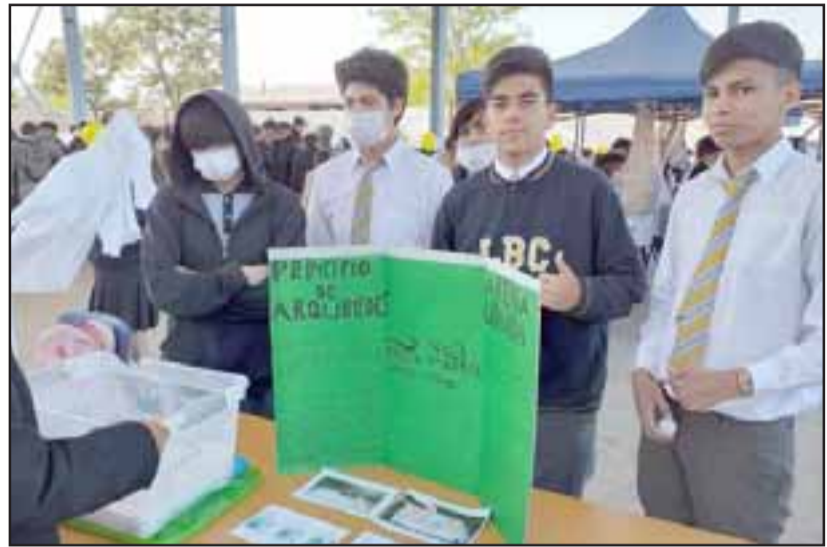
Cada uno de los cursos presentó su mejor propuesta en esta jornada de ciencias.

Durante toda la mañana los alumnos pudieron conocer el trabajo de los distintos cursos, con proyectos de sumo interés, entre los que destacaron estudios sobre el ADN, el reciclaje, el mejor uso del agua, así como distintos experimentos. Para el departamento de Ciencias del establecimiento, el objetivo es que los alumnos puedan experimentar y conocer sobre distintas áreas de la ciencia, ya sea física, química o matemática, como una forma de que los estudiantes reciban preparación en todas las áreas del conocimiento.