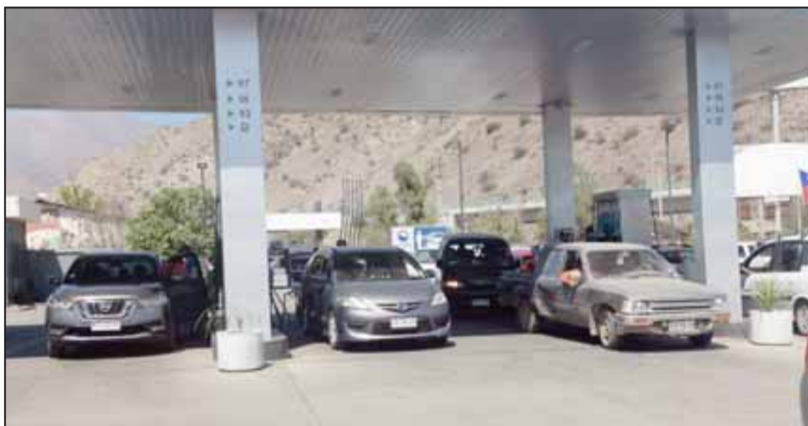
Estación de Combustibles Copec de avenida Manso de Velasco en San Felipe.

medio de la marcha por las calles de San Felipe, comenzaron saquear la Farmacia