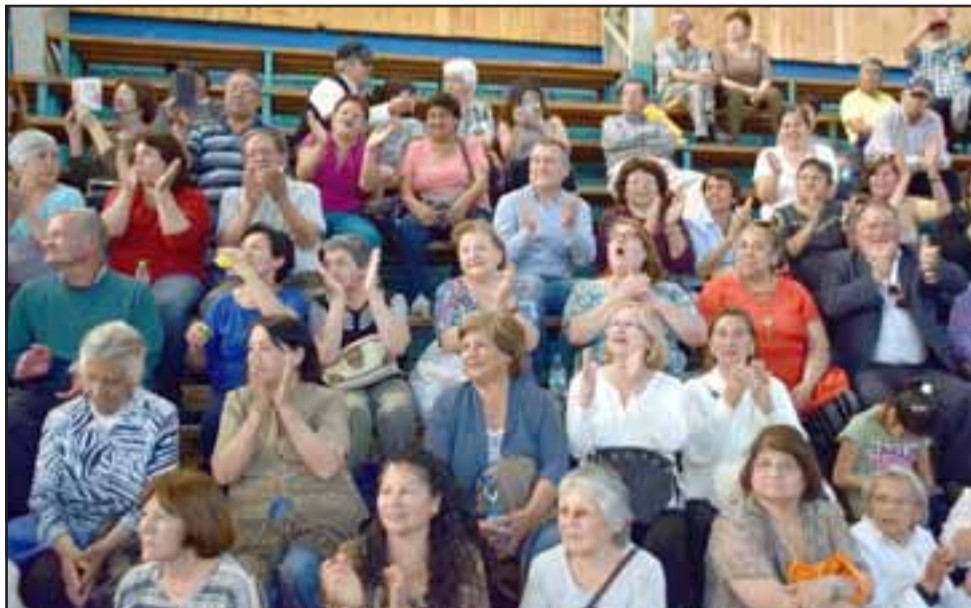
TREMENDA FIESTA. - Más de 2.000 vecinos aplaudieron y corearon sus temas musicales favoritos.