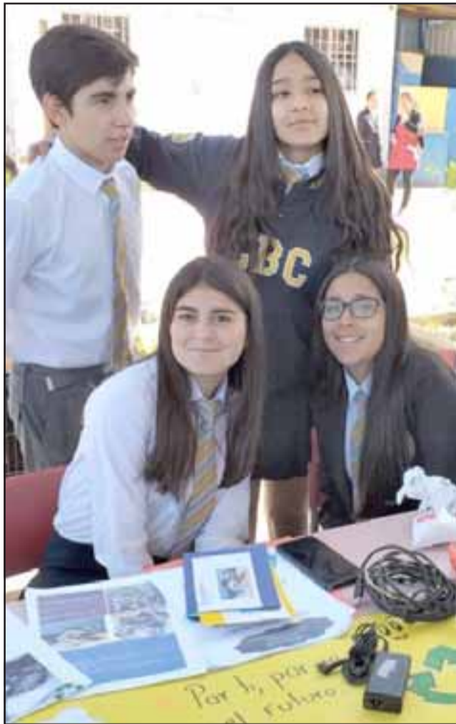
Usaron láminas de papel, cartulina y otros materiales ilustrativos.

Una nueva versión de su Feria Científica realizó el Liceo Bicentenario Cordillera, a través de su departamento de Ciencias. La jornada del viernes recién pasado los alumnos de todos los cursos se ubicaron en el patio de ingreso al liceo en distintos stands, donde mostraron parte del trabajo que han realizado durante el año en el área de las ciencias.