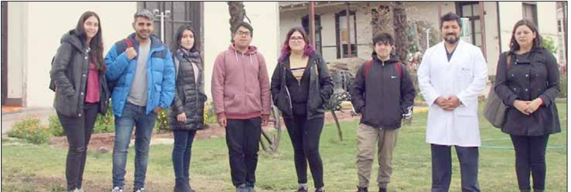
La visita, coordinada a través de la Unidad de Patrimonio del Ministerio de Salud, tuvo por finalidad trabajar en lineamientos técnicos que permitan postular al Hospital San Antonio de Putaendo como monumento histórico nacional.