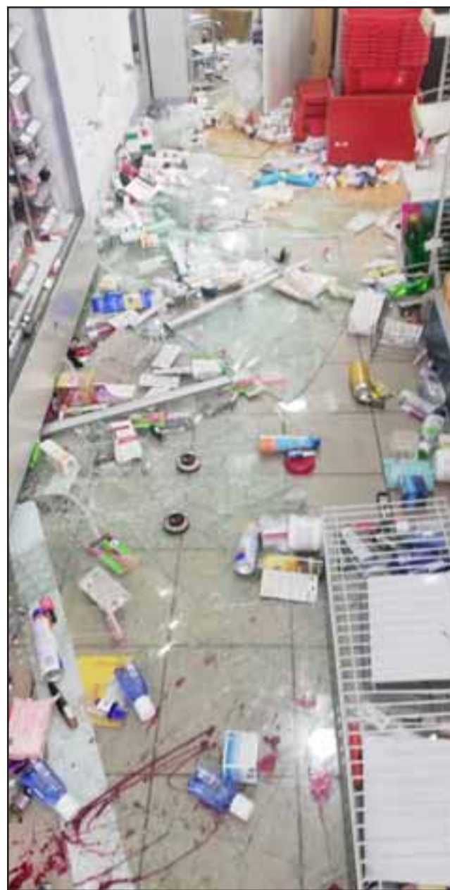
Los daños ocasionados a la Farmacia Ahumada de San Felipe.