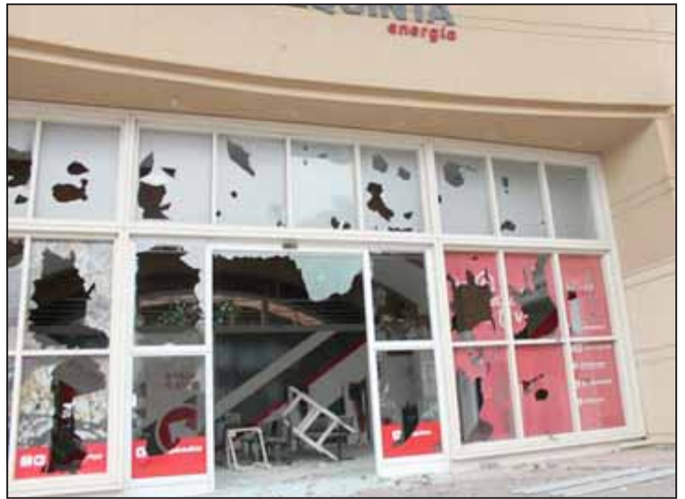
Los incidentes sólo se calmaron después del Toque de Queda y la salida de patrullas del Destacamento Yungay a apoyar las labores de orden público de Carabineros.

Igual cosa ocurrió con el edificio consistorial de Calle Esmeralda, el que también resultó con algunos daños de menor consideración. Según información preliminar, hubo varias personas detenidas en estos incidentes por diversos ilícitos.