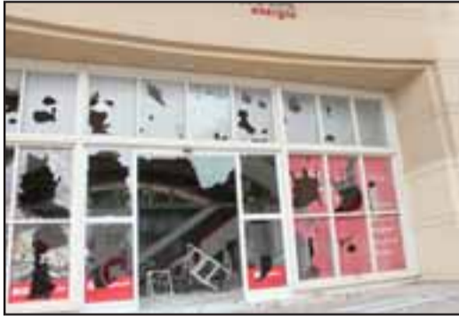
En Los Andes también reinó la violencia

Empresas ofrecen 1.200 puestos: Miles de personas visitaron Expo Empleo 2019 en la Plaza Cívica Pág.3