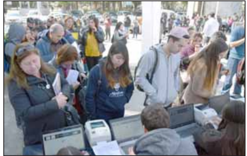
MILES LLEGARON. - En total, fueron 37 empresas las que ofrecieron 1.200 puestos laborales durante la jornada.

nueva indicó que la situación del Valle de Aconcagua es compleja, «así que toda