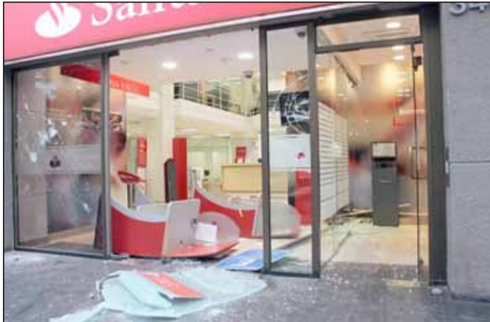
Este banco quedó con daños en su inmueble, como lo muestra esta gráfica.