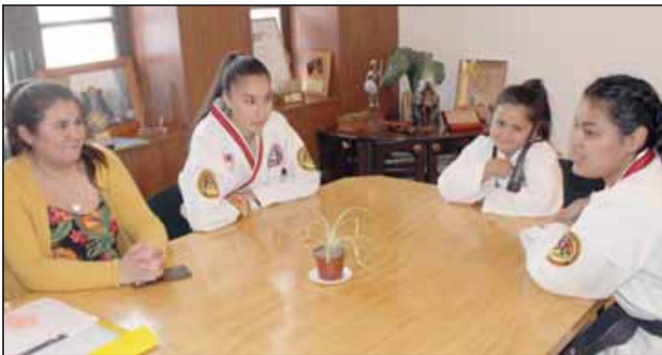
La pequeña que es apoyada por la Escuela Ata Bekho de Los Andes, se reunió con el alcalde Luis Pradenas, y ofrecieron la realización de talleres para el próximo año.

na de Taekwondo (ATA) se formó en 1969, y ocho años después estableció su sede en el estado de Arkansas en Estados Unidos, hoy se practica en varios países latinoamericanos, entre estos Chile