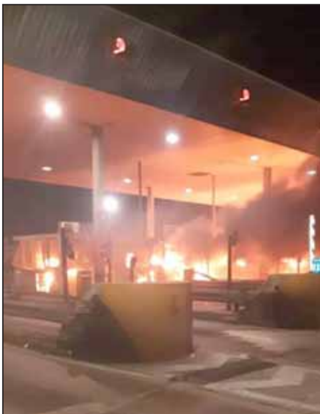
Peaje Las Vegas de Llay Llay fue completamente incendiado por manifestantes.