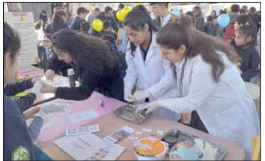
Ellas y ellos lograron trabajar perfectamente en armonía en beneficio de sus proyectos estudiantiles.