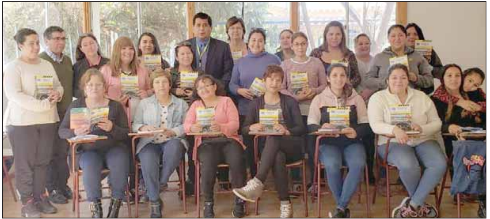
El alcalde Claudio Zurita realizó una visita a las mujeres del programa Jefas de Hogar que participan del curso de conducir.

Desde el equipo de gestión del Programa Mujeres Jefas de Hogar se informó que a través de este curso de conducir, se busca contribuir con las mujeres independientes para fortalecer y hacer crecer su emprendimiento a través de nuevas formas de comercialización. Asimismo ge-