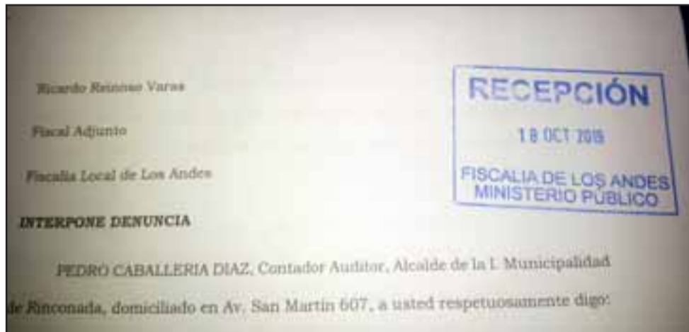
La denuncia ante la fiscalía fue interpuesta el 18 de octubre.

No me temblará la mano para defender los recursos de las y los rinconadinos, al contrario. Mi único compromiso es con la gente de Rinconada», concluyó.