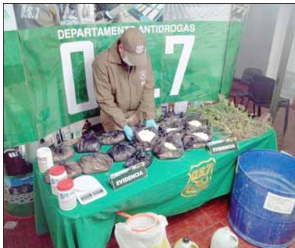
Personal del OS7 de Carabineros incautó más de 14 kilos de pasta base de cocaína y elementos químicos desde una vivienda ubicada en la población Luis Gajardo Guerrero de San Felipe, el pasado mes de junio de 2018.

das por parte de la Fiscalía durante el juicio en contra del imputado, quien se encuentra en prisión preventiva, la terna de jueces concluyó en su veredicto decla-