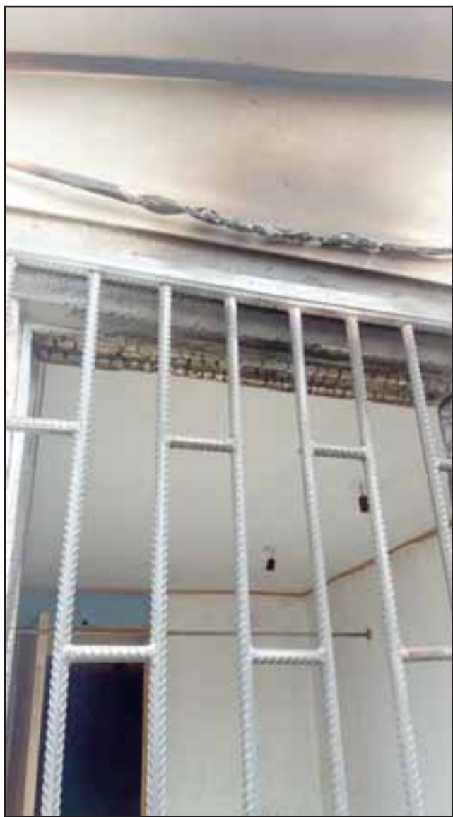
Daños en el techo y cables producto de este intento de incendio en el Campo de Entrenamientos en Quebrada Herrera.

El Cuerpo de Bomberos de San Felipe está compuesto por siete compañías, incluyendo la de Panquehue.