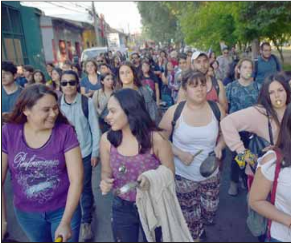
GRAN CONVOCATORIA. - Estas imágenes son más que elocuentes para describir la energía de esta masiva manifestación en las calles de San Felipe.

Gobierno, así poco a poco fueron buscando el damero central de nuestra ciudad para terminar dando vuelta a la Plaza de Armas, en donde se apostaron e hicieron sentir con gran Fuerza y Vigor.