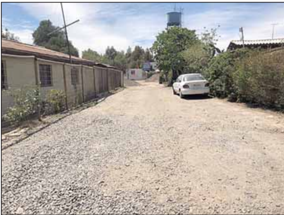
El proyecto considera la reposición de aceras del pasaje, extrayendo el pavimento existente para instalar una nueva capa de concreto, agregando accesibilidad universal con acceso para sillas de ruedas en ambas veredas.