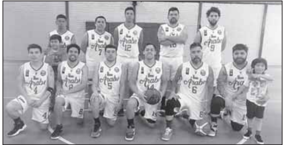
El Arabe de San Felipe es uno de los punteros de la serie A del Clausura de la ABAR.

ce del quinteto de Frutexport al superar en línea a: Llay Llay Basket e Iball respectivamente. Con estas dos victorias los exportadores quedaron solos en la cima de su torneo, convirtiéndose con ello en el principal candidato para ascender a la serie mayor de los cestos locales.