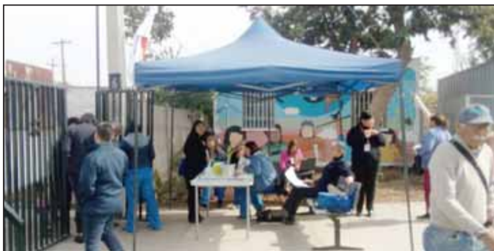
Personal atendiendo, mientras una pareja de adultos mayores ingresa al Cesfam.