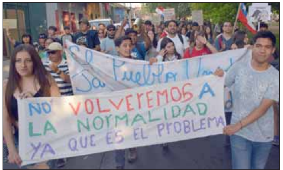
EN SINTONÍA. - Las marchas y protestas siguen a la orden del día en casi todo el territorio chileno, los sanfelipeños también se unen al sentimiento de malestar general.