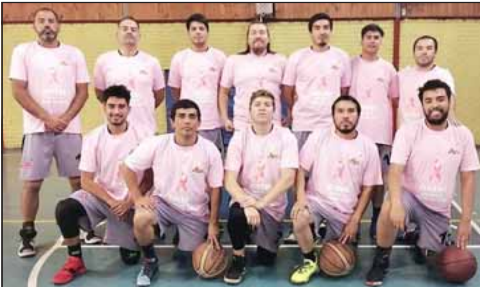
Frutexport está cumpliendo una excelente campaña en la segunda división del básquetbol aconcagüino.

pondientes a las series A y B, de la ahora principal competencia cesterá de todo el valle de Aconcagua, que entre el sábado y domingo vio la excelente performan-