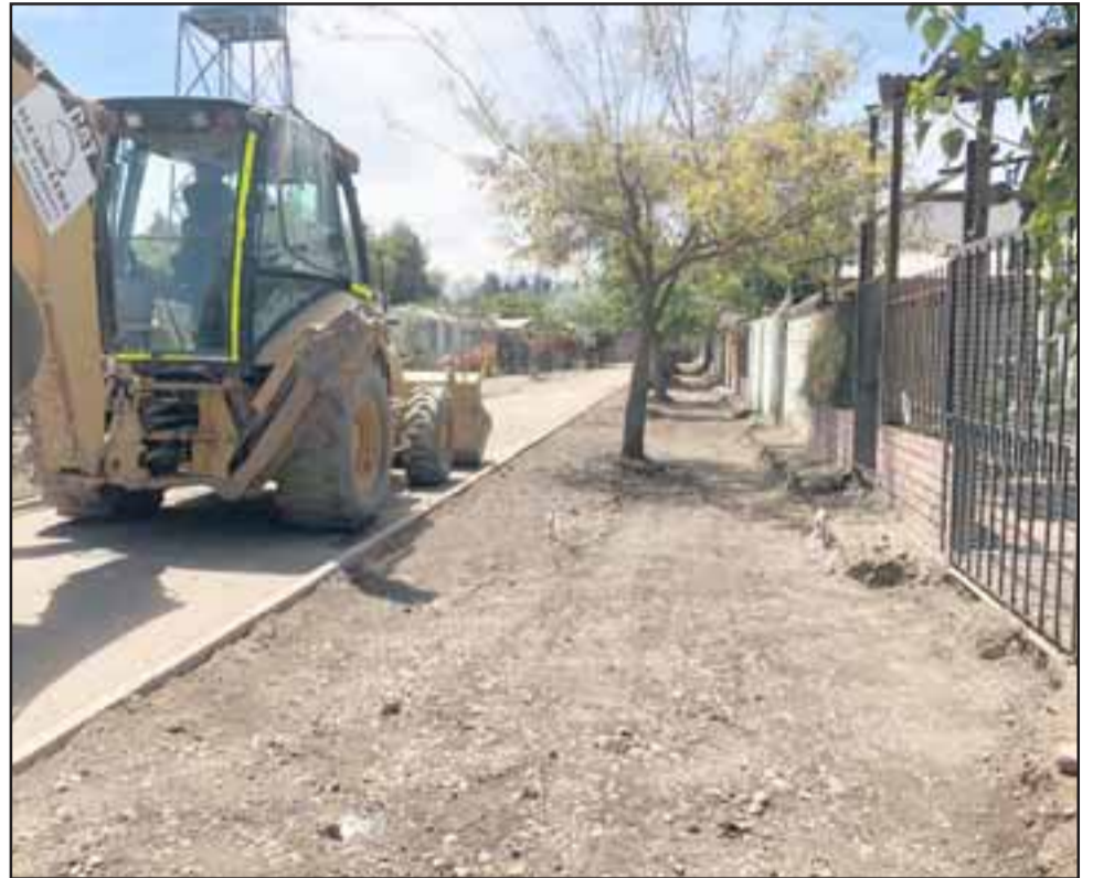
Los trabajos de reposición de aceras del pasaje Los Aromos en la población Santiago Carey del sector Escorial en Panquehue, ya presentan un 20 por ciento de avance.

Comentó que dentro de sus políticas de desarrollo comunal, se ha dado especial prioridad cubrir al máximo las necesidades de cada uno de los sectores de la comuna, y si bien se ha logrado pavimentar en un