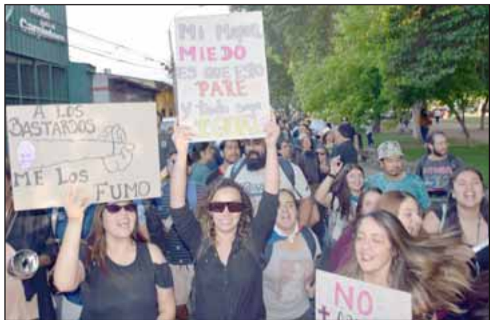
TAN CLARO COMO EL AGUA. - Los mensajes fueron claros y directos en las pancartas que estos vecinos llevaron a la marcha de ayer lunes.

Radio Comunitaria Aconcagua Haití lleva dos años transmitiendo: