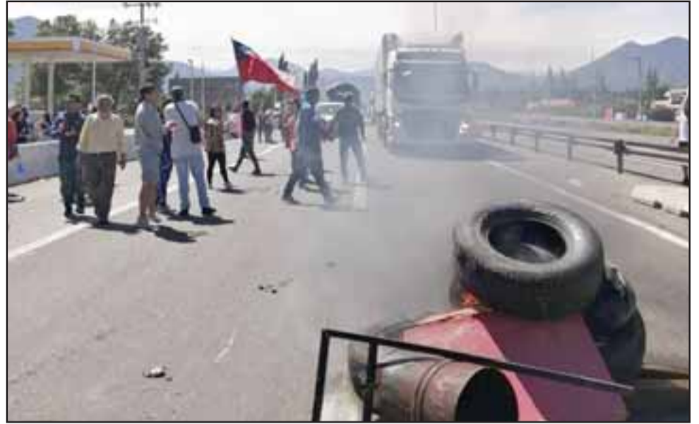
Las manifestaciones se registraron la tarde de este domingo en la ruta 5 Norte en la comuna de Llay Llay, siendo detenidas cuatro personas por parte de Carabineros. (Fotografía archivo manifestaciones en Llay Llay).