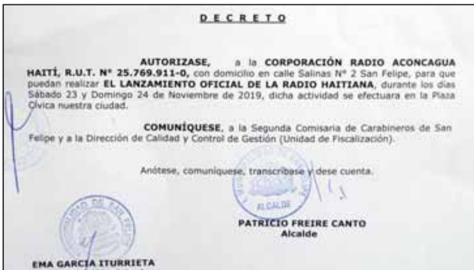
LANZAMIENTO OFICIAL. - Este documento faculta a la comunidad haitiana para que transmitan vía streaming en la página https://aconcaguahaiti.cl/ .