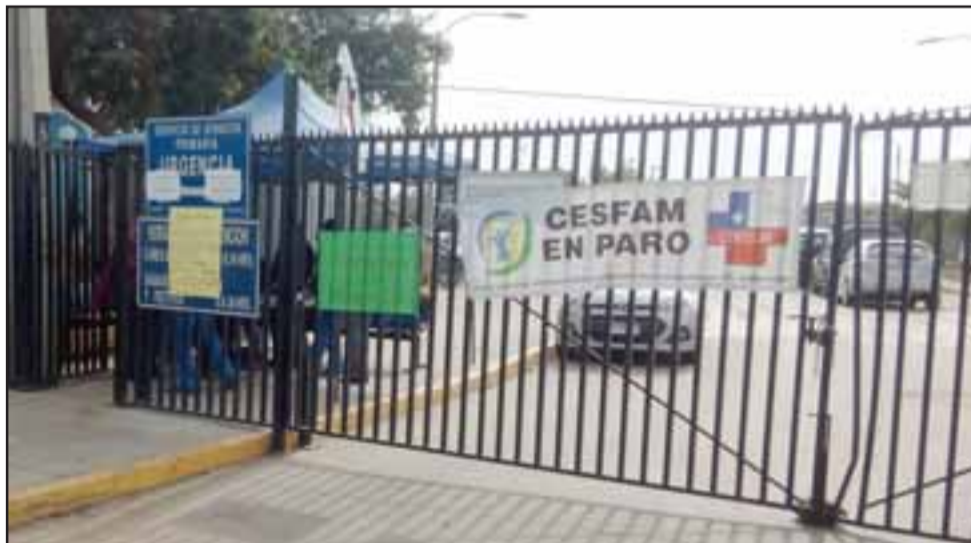
En la cerrada reja del Cesfam los letreros que indican que el centro de salud familiar se encuentra en Paro.

La salud municipal en San Felipe la conforman los Cesfam Doctor Segismundo Iturra Taito, Curimón y Cefco de Quebrada Herrera.