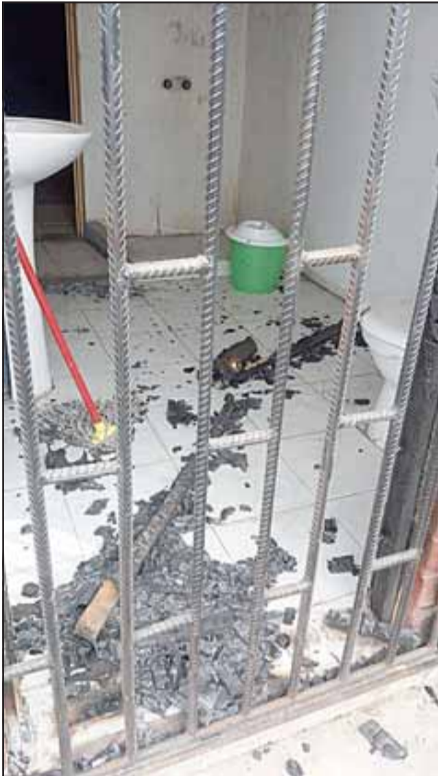
Daños en la puerta producto del intento de incendio en el campo de entrenamiento.