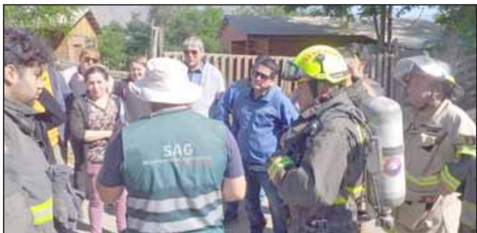
Los menores afectados luego de ser atendidos en diferentes centros asistenciales, fueron derivados hasta sus hogares.