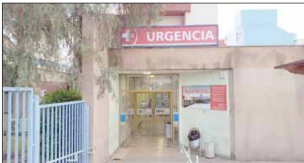
El Servicio de Urgencias del Hospital San Camilo sigue en problemas para atender a sus usuarios.