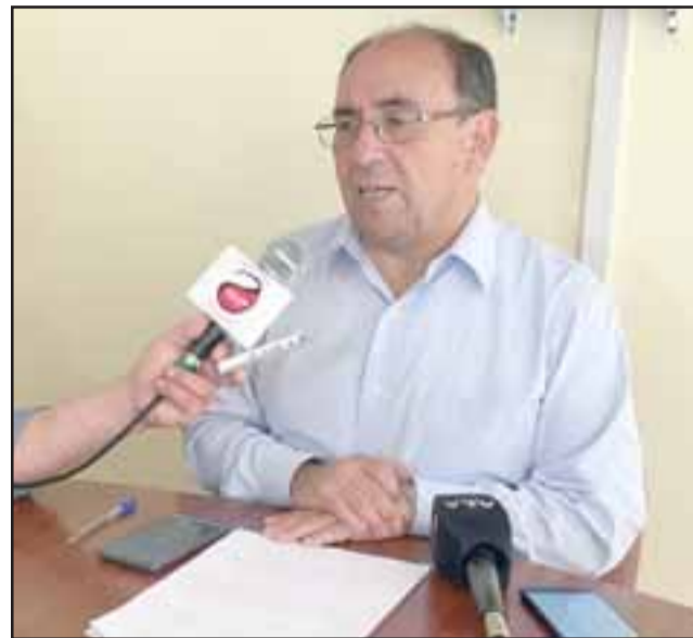
Un total de nueve micro y pequeñas empresas de la provincia de San Felipe han resultado con daños o saqueos, diagnóstico que se afina de manera conjunta con municipios y cámaras de comercio, según precisó el gobernador Claudio Rodríguez.

De igual manera, el gobernador señaló que se realizarán las acciones posibles para dar con los responsables de los hechos que han afectado de igual manera edificios públicos: «La intendencia regional ya ha interpuesto querrelas criminales contra todas aquellas personas que puedan resultar responsables de los daños por el incendio de la Municipalidad de Catemu, en espacios públicos de San Felipe y el intento de incendio que afectó al edificio de la Municipalidad de San