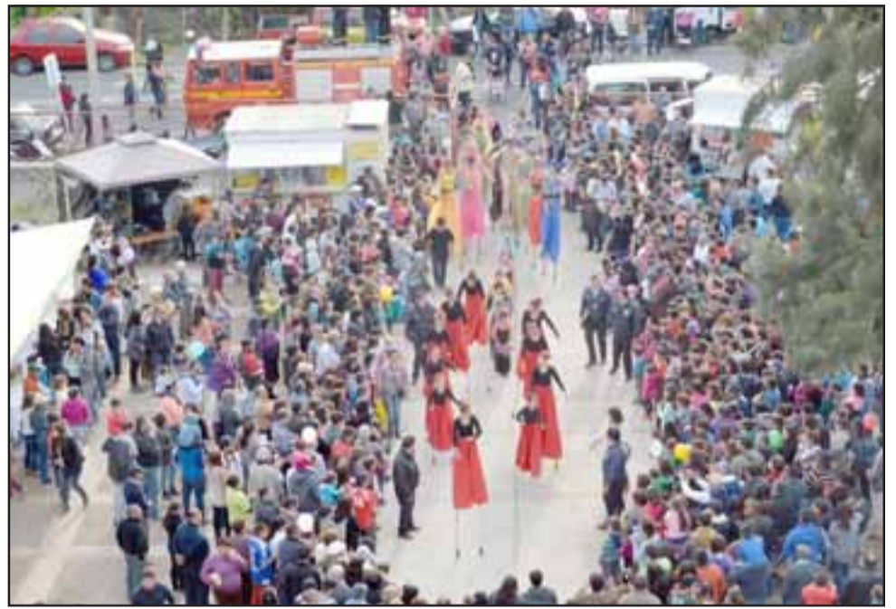
FIESTA RELIGIOSA.- Este escenario, la entrada principal del templo de Santa Filomena, se llenará de fieles durante todo este fin de semana.