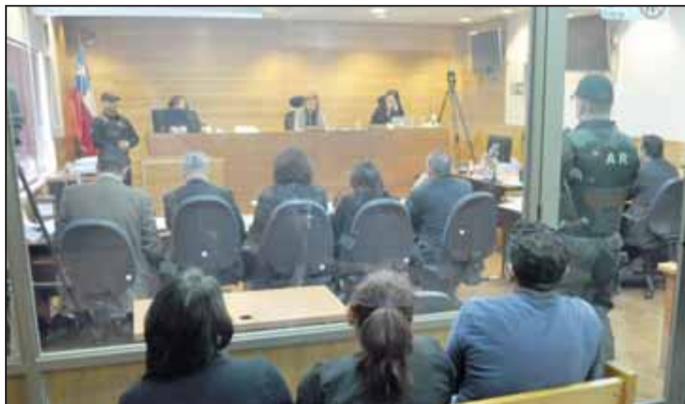
EL GRAN JUICIO.- El acusado dijo que efectivamente se quedó solo en el domicilio con la pequeña, contando que estaba preocupado de su cuidado, que le había dado leche en dos ocasiones, que la llevó a acostarse y se durmió.

Señaló que por estas razones y por lo que podía suceder en dos ocasiones dijo que no iba a continuar con el cuidado de ambas niñas, lo que expresó tanto a su esposa como a las profesionales del FAE Ayún.