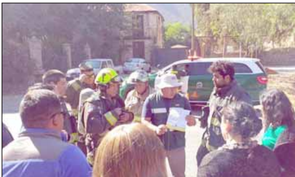
Los organismos de emergencia se constituyeron durante la mañana de ayer miércoles en el sector Las Compuertas de Catemu.

La autoridad comunal precisó que ante la emergencia química se hizo presente el personal del Servicio Agrícola y Ganadero además del Servicio de Salud Aconcagua, cursando las multas correspondientes al predio agrícola desde donde se habrían utilizado