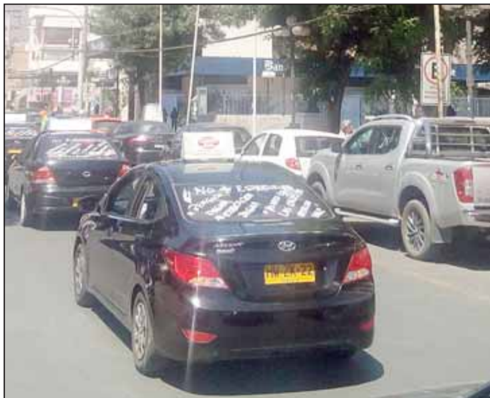
La caravana de taxis, conformada por una treintena de conductores, pasando por calle Salinas.