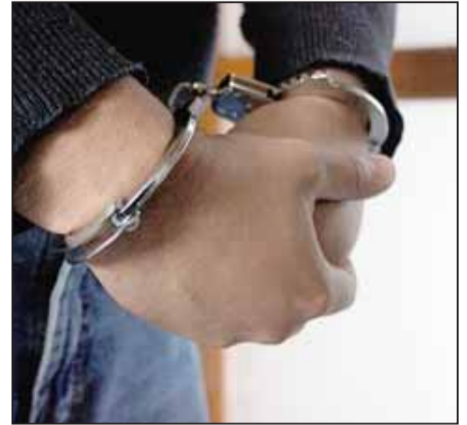
El automovilista debería cumplir la sentencia en la cárcel tras juicio en el Tribunal Oral en Lo Penal de San Felipe. La Defensa elevó un recurso de nulidad ante la Corte de Apelaciones de Valparaíso. (Fotografía Referencial).

Fiscalía acusó además reincidencia específica, por cuanto el actual sentenciado ya había sido condenado por el mismo delito el año 2017.