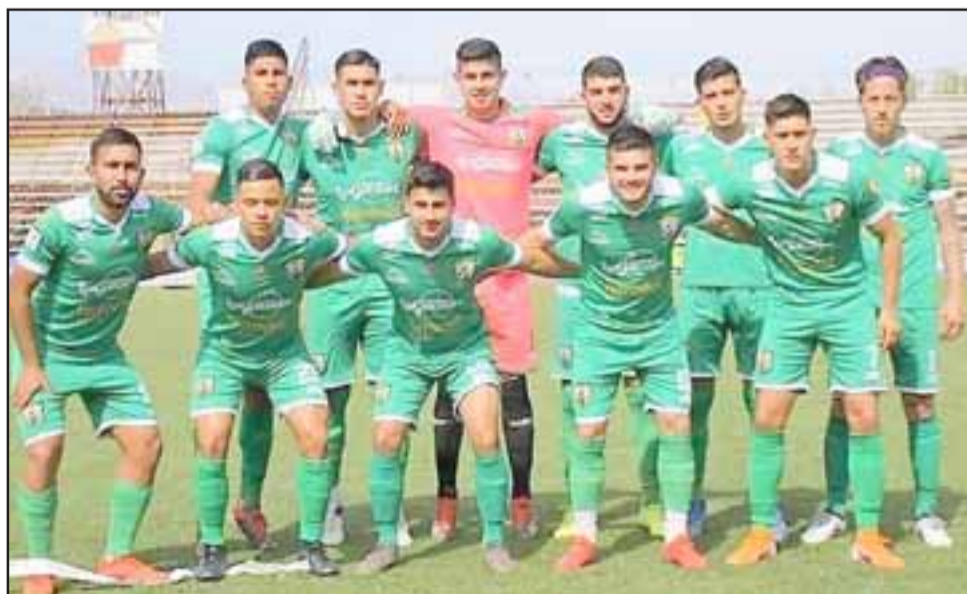
Trasandino comenzará como local su incursión en la liguilla por el ascenso de la Tercera A.

Fecha 1º: Trasandino – Limache Fecha 2º.- Deportes Concepción – Trasandino Fecha 3º.- Trasandino – Ovalle Fecha 4º.- Limache – Trasandino Fecha 5º.- Trasandino – Concepción Fecha 6º.- Ovalle – Trasandino