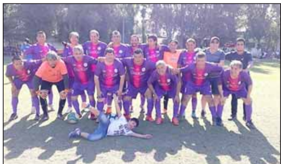
El domingo pasado el conjunto de Los Amigos aseguró el título en la serie central de la Liga Vecinal.