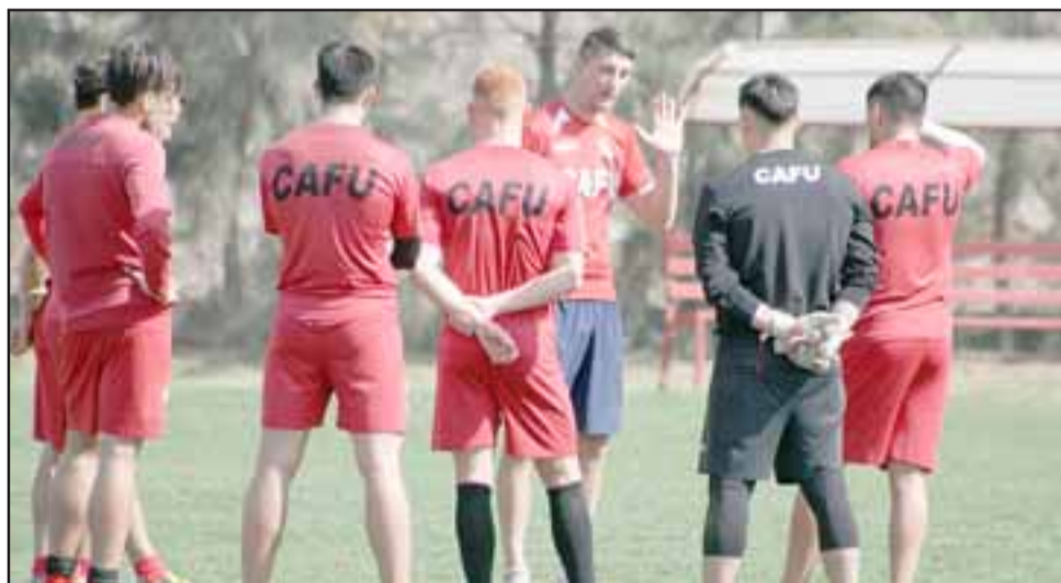
Unión San Felipe sigue con sus entrenamientos a la espera del retorno del torneo.

Con esto Unión San Felipe deberá seguir esperando para volver a ver acción en el torneo de la Primera B, donde se supone, una vez que regrese la competencia deberá enfrentar a Deportes Temuco.