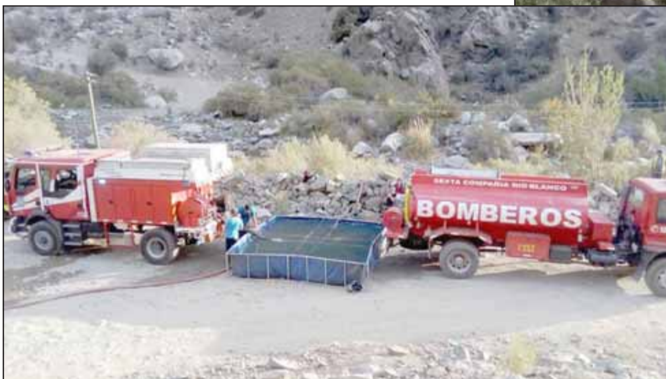
La emergencia se declaró pasadas las 16:30 horas del martes, debiendo concurrir en primera instancia voluntarios de la Segunda Compañía de Bomberos de San Esteban