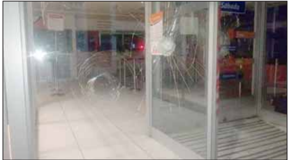
La oficina de ServiEstado de Calle Santo Domingo fue apedreada por manifestantes.