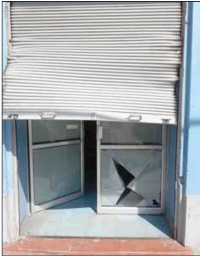
En este estado quedó el supermercado Unimarc de Avenida Encón tras ser nuevamente saqueado por sujetos.