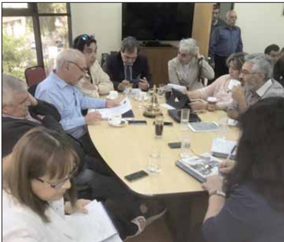
El Padem es el instrumento de planificación estratégica, que permite guiar la Educación municipal de la comuna, con distintos planes de acción.

apoyo de la Dirección Provincial de Educación.