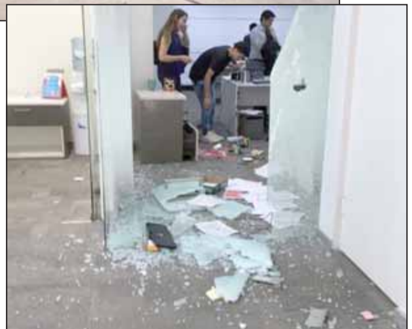
En la sucursal del Scotiabank los daños son más que cuantiosos, pareciera que esto continuará.