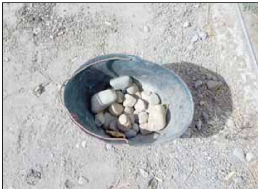
Carabineros recolectó las piedras arrojadas hacia el cuartel policial.