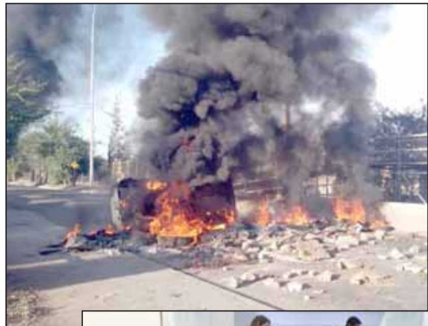
Las barricadas fueron bastante visibles y ardieron en las principales calles andinas.