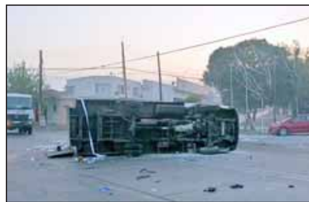
El camión fue volcado e incendiado por grupo de manifestantes.

Asimismo, las cámaras de seguridad y lectora de patentes instaladas en este punto fueron destruidas por los manifestantes. Mismo situación fue la que ocurrió