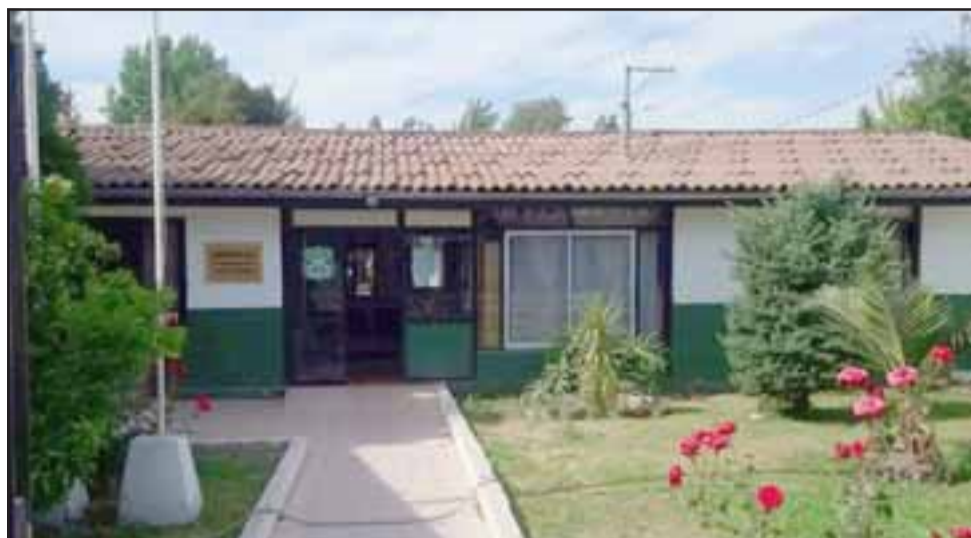
Grupo de manifestantes habrían apedreado las dependencias del Retén de Carabineros de Curimón.

Carabineros informó que tras este ataque no se lograron producir daños a la propiedad ni funcionarios policiales lesionados, como tampoco personas detenidas.