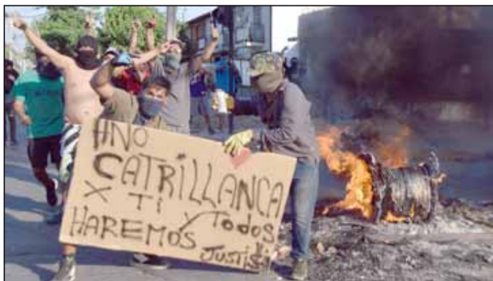
ENCAPUCHADOS AL ASECHO.- Recordando al líder mapuche fallecido hace ya algunos años en el sur, estos encapuchados se instalaron a fuerza de piedras y fuego en las calles de nuestra comuna.