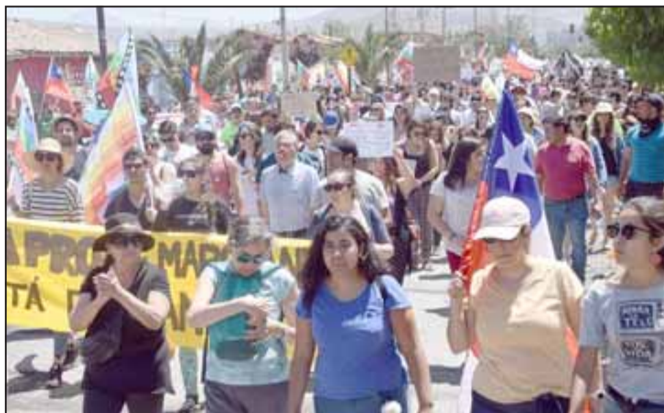
MILLARES MARCHARON.- Cada uno se hidrató como le fue posible, en total se estima que al menos unas 5.500 personas marcharon al mediodía del martes.

Panquehue, prácticamente de todo el valle. Además en esta convocatoria no solamente estamos los profesores, también estamos todos los que trabajamos en Educación, asistentes y auxiliares; este fue un llamado de Educación (...) Muy satisfecho de la forma en que se desarrolló la manifestación, no hubo provocaciones ni disturbios, porque el Pueblo de Chile y nosotros especialmen-