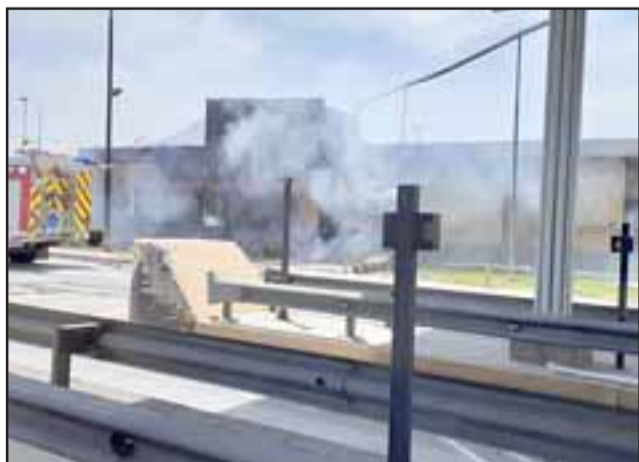
El incendio intencional ocurrió durante las manifestaciones de este martes en la ruta 5 Norte de Llay Llay.

El imputado fue detenido junto a otro sujeto acusados de apedrear el cuartel policial de Llay Llay y provocar daños a una patrulla de la institución uniformada. Ambos fueron derivados hasta tribunales para ser formalizados por la fiscalía.