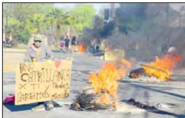
ACCIONES SEPARADAS.- Al parecer estos actos no tienen relación directa con las marchas pacíficas desarrolladas durante el día.