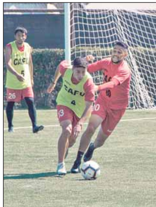
Unión San Felipe no viajará este fin de semana a Novena Región para enfrentar de Deportes Temuco.

La ANFP, fue clara en señalar que el retorno de la actividad del fútbol profesional no es contrario a lo que vive nuestro país, ni tampoco relativiza las demandas sociales que existen en este momento, recalcando además que esta actividad es un espacio de promoción del diálogo, que tiene como uno de sus objetivos aportar a la paz social.