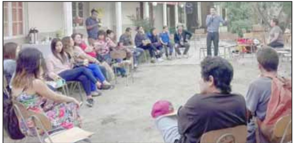
CABILDEANDO. - El Cabildo se desarrolló la tarde de este lunes en las mismas dependencias del Colegio de Profesores de San Felipe.

nosotros aportar a este proceso colectivo que se está llevando en el país, y para eso realizamos grupos de trabajo según la edad. Se reunieron estudiantes por su parte, apoderados por otra y los trabajadores de la educación en otros grupos, en los que reflexionamos a partir de preguntas y también dinámicas. Fue muy amena la jornada, no tan sólo fueron reflexiones, logramos conocernos y re-