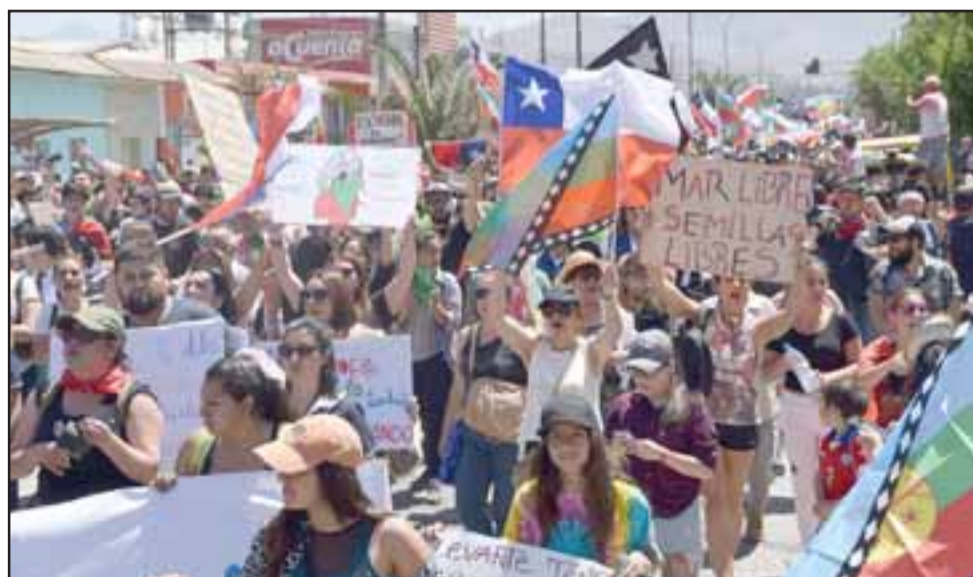
CAUSAS Y PETICIONES.- Hasta por el mar y las semillas protestaron algunos con sus carteles. Pareciera que llegó la hora de nivelar todo en Chile.