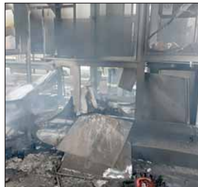
El incendio destruyó las casetas del Peaje Las Vegas de Llay Llay.