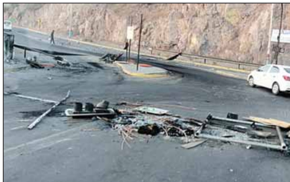
El triste panorama en la entrada principal hacia San Felipe en Puente El Rey tras el encendido de barricadas.