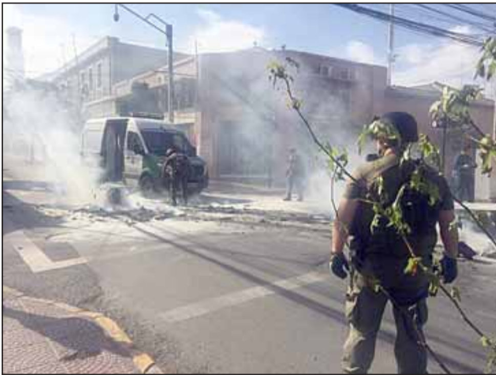
Varios carabineros debieron hacer labores de limpieza y contención, para habilitar las vías.

de no más de diez manifestantes hizo ingreso a la sucursal de Scotiabank ubicada en Papudo con Esmeralda y tras obligar a salir a trabajadores y clientes, sacó mobiliario para levantar una barricada. Personal de Carabineros debido concurrir hasta ese lugar y colaborar con la extinción del fuego, no resultando personas lesionadas. Los daños causados en la sucursal bancaria fueron millonarios.