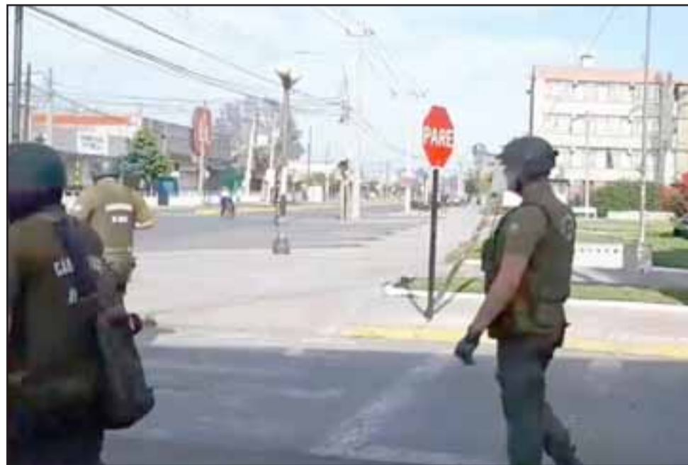
Fuerzas Especiales lanzaron gases disuasivos al interior del municipio de Llay Llay, cuando funcionarios realizaban actividades pacíficas en el marco de la movilización nacional.

Debido a esta situación, se realizaron los reclamos respectivos: «Ya comunicamos informalmente esta situación a la gobernación, vamos a hacer la denuncia formal y también la denun-