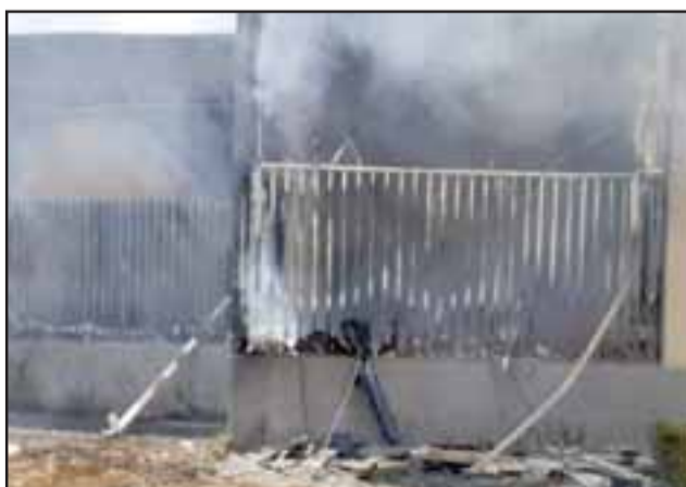
Las oficinas administrativas resultaron completamente dañadas.