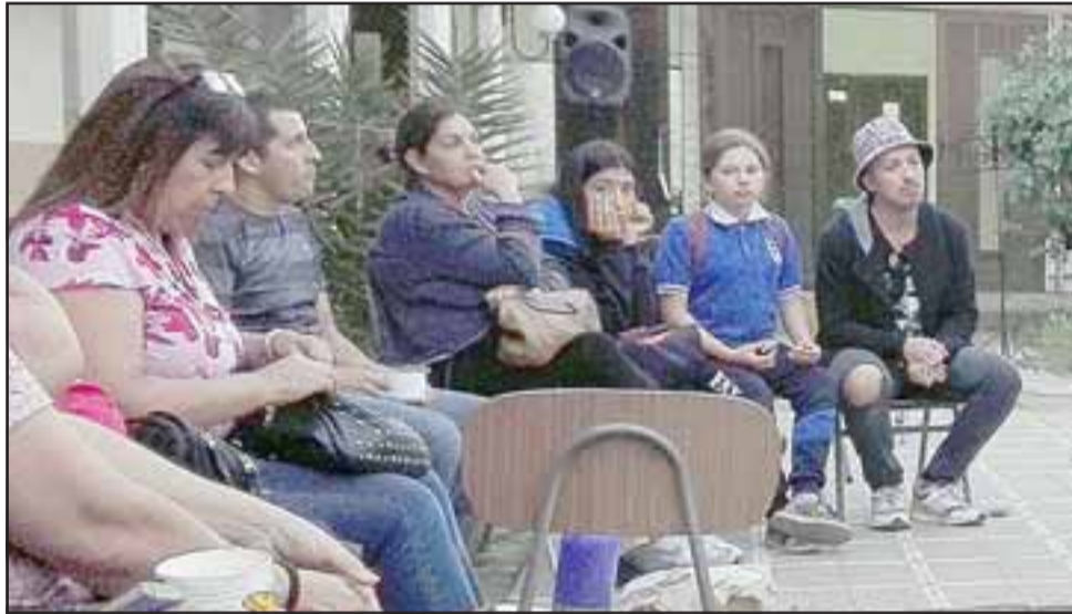
Profesores y estudiantes de varias escuelas municipalizadas de San Felipe, participaron en este Tercer Cabildo convocado por el Colegio de Profesores de nuestra comuna.

conocernos (...) Las inquietudes más que nada apuntan a que nuestros estudiantes son quienes han dado el puntapié inicial a este movimiento, nosotros como educadores justamente tememos por su seguridad ya que son ellos quienes están encabezando las movilizaciones y todas estas actividades, por lo tanto nosotros como docentes nos preocupa también que todas estas movilizaciones que se han llevado a cabo no lleven ningún cam-