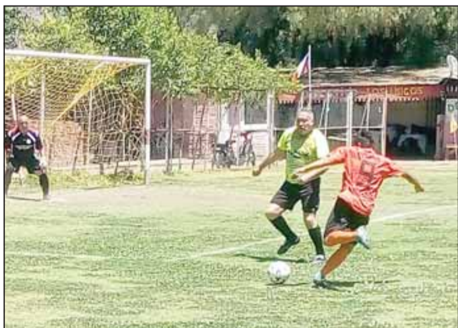
El Torneo de Clausura de la Liga Vecinal está a un paso de culminar.

Todos los equipos formativos del Uní Uní culminaron su actividad competitiva durante la presente temporada.