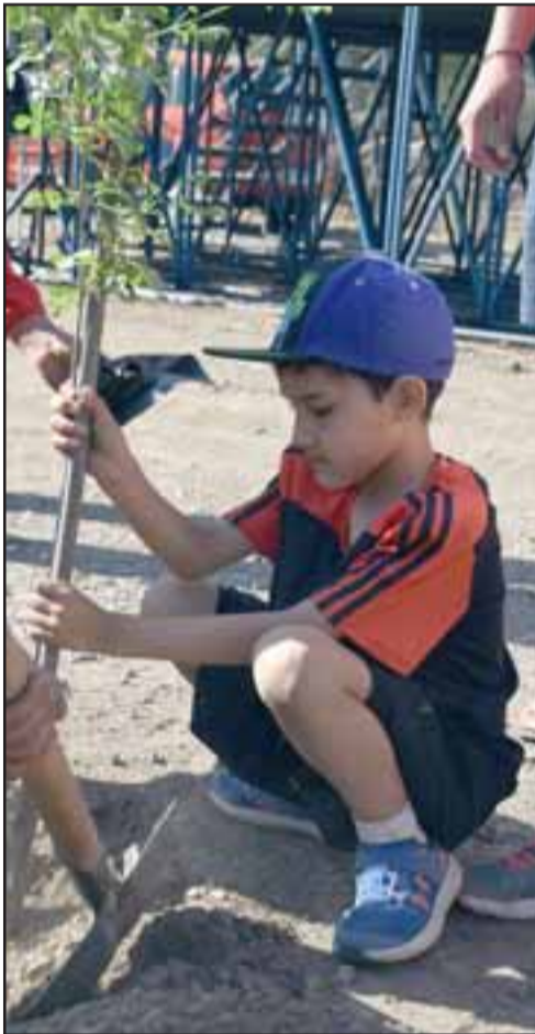
SU PRIMERA ÁRBOL.- Este pequeñito también se puso las pilas y plantó su árbol, él se encargará de cuidarlo siempre.