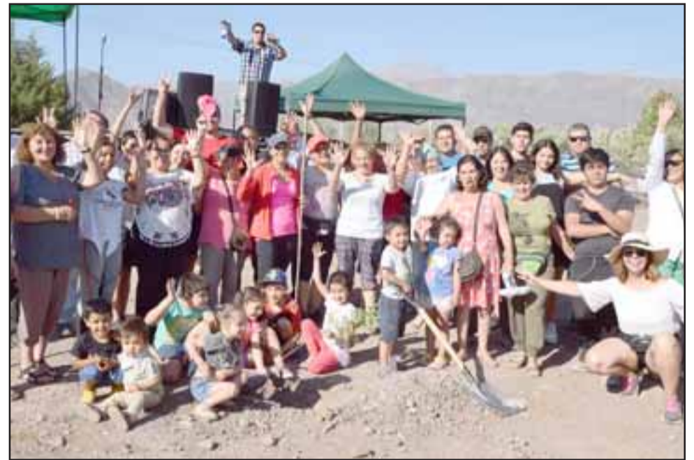
SIEMBRA DE ÁRBOLES.- Aquí vemos a los vecinos y colaboradores de Lo Galdámez, plantando sus árboles en la plazoleta.

Esta banda nació de los talleres de la Escuela Artística El Tambo, cuando se conocen estos jóvenes, dándose cuenta del amor y pasión que ellos tienen por la música. A partir de la afinidad entre ellos, luego de una