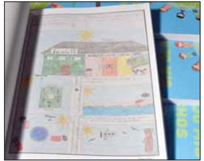
Este es uno de los dibujos que contiene la publicación.

se destacó que «a 30 años de la ratificación de la Convención de los Derechos del Niño y la Niña, OPD Santa María ha querido entregar el libro 'Yo dibujo mis derechos', cuyo contenido son dibujos realizados por los niños y niñas de nuestra comuna, para la participación en el Concurso Arte y Derechos Humanos Año 2019, del Instituto Nacional de Derechos Humanos, que muestran lo importante que es escuchar la expresión de nuestros niños, niñas y