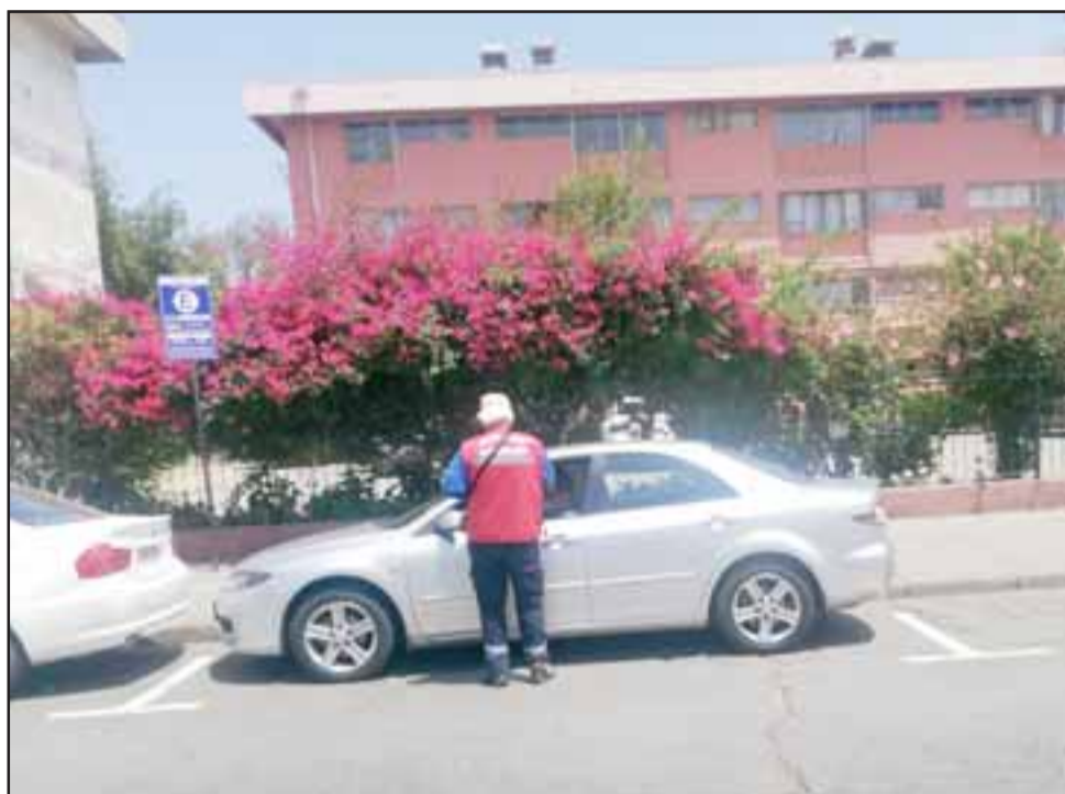
A partir de ayer lunes volvieron a las calles los cobradores de parquímetros, servicio que reporta 14 millones de pesos al municipio.

tener el cobro de $18 el minuto, manteniendo la misma cantidad de calles licitadas. Esto busca normalizar el servicio, hoy tenemos vehículos que se estacionan durante todo el día, lo que no genera movilidad, incluso el mismo comercio establecido pidió una mayor rotación de público en el centro, lo cual se logra sólo con el cobro de estacionamiento», comentó.