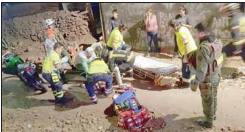
El pasado 5 de noviembre, el joven fue atacado por la espalda con un cuchillo, resultando gravemente herido. El agresor fue detenido por Carabineros y formalizado por la Fiscalía.