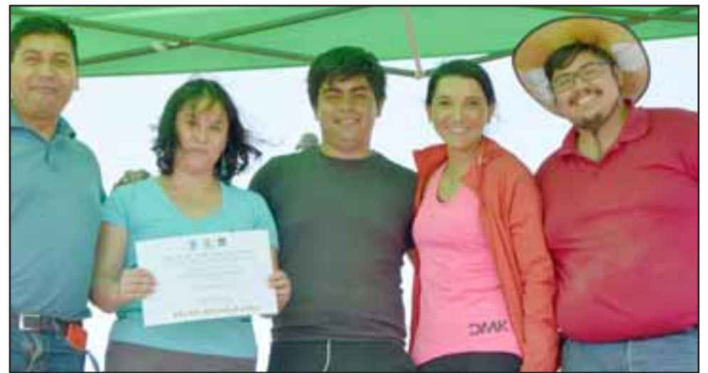
VOLUNTARIADO.- Estudiantes y docentes del Instituto Profesional AIEP de San Felipe, también fueron destacados por su voluntariado.