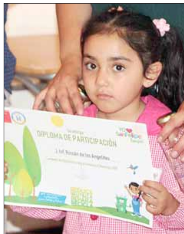
Alumnos de diferentes colegios municipalizados, subvencionados y particulares participaron de los talleres.

Junto con esto, el Concejo Municipal aprobó y autorizó 15 puntos para la instalación de colilleros para la campaña comunal #SanFe-