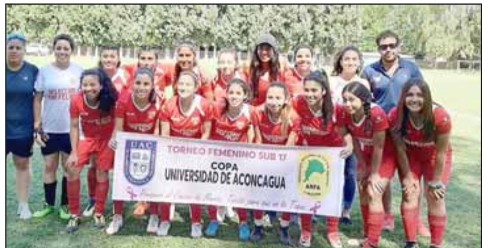
La selección de San Felipe goleó a Los Andes en el inicio del Regional femenino U17.

tuvo lugar en el estadio de Curimón, en el que San Felipe dio un paso enorme hacia la segunda etapa de la competencia femenina que se tomará la agenda durante la parte final del año.