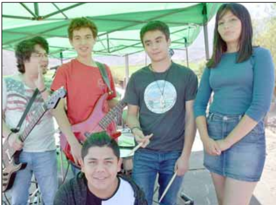
BANDA JUVENIL.- Estos tremendos chiquillos son los integrantes de la Banda Ana Himene, de El Tambo San Felipe.