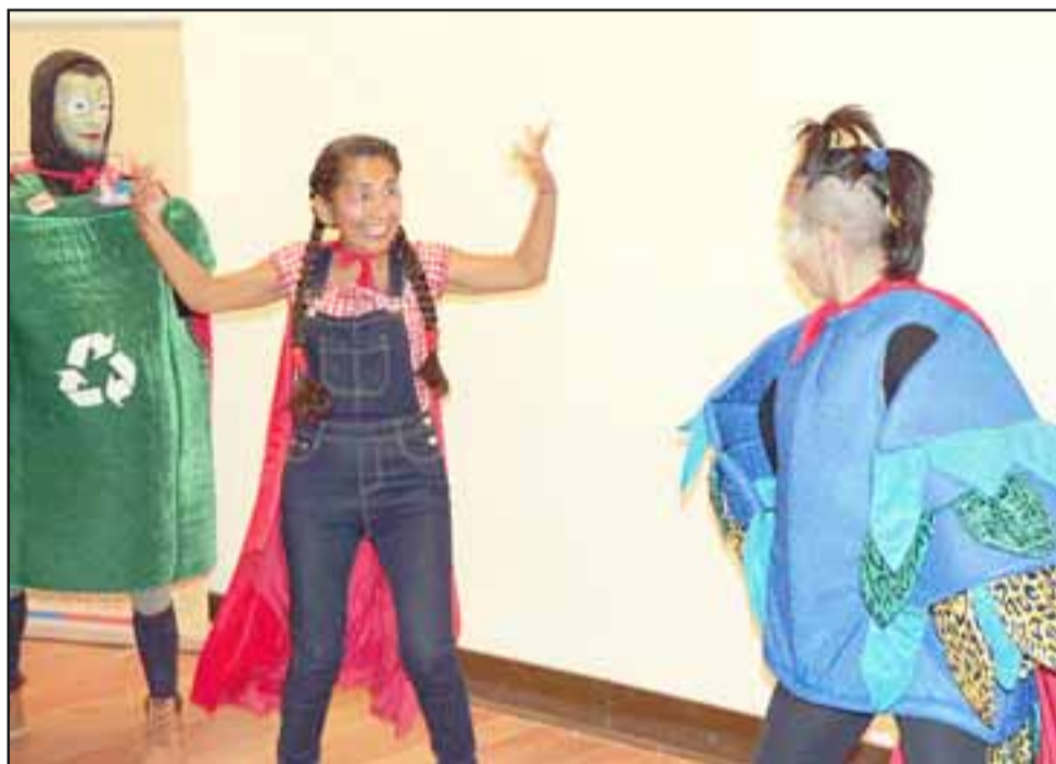
Dos obras de teatro para la educación parvularia permitió enseñar en forma didáctica a los niños, lo importante que es el cuidado del medioambiente.