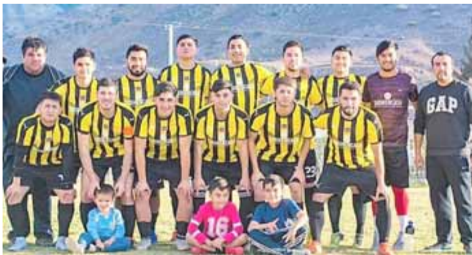
Ayer el club Pentzke cumplió 94 años de existencia.