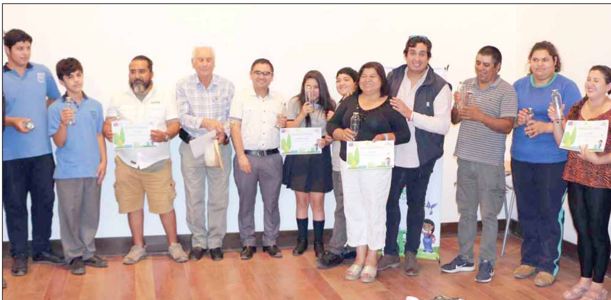
A los 24 talleres dirigidos a escolares se sumaron otros 25 para 56 organizaciones sociales de la comuna.