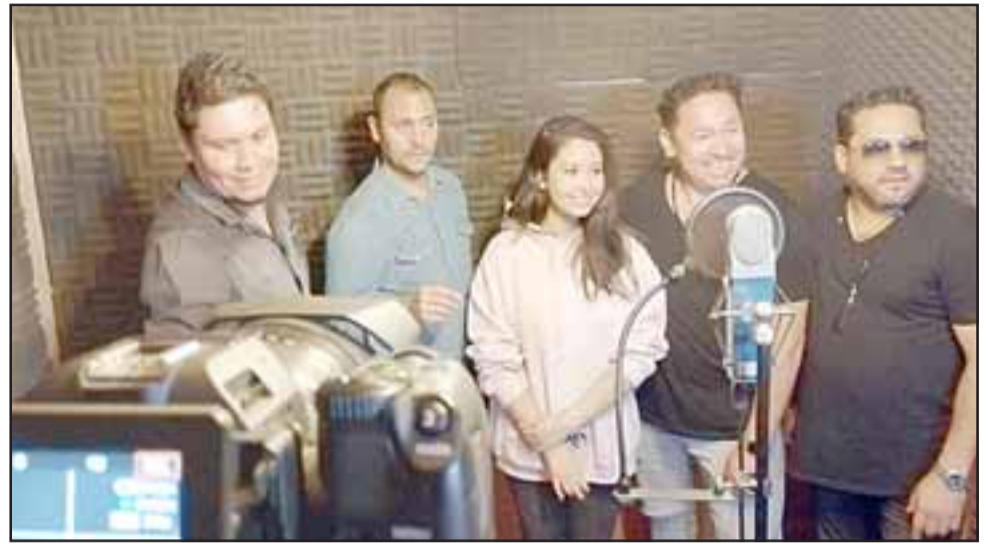
Acá parte de los cantantes locales que interpretaron este cover 'Sueña'.

- Súper, súper perjudicial, porque es mucha gente detrás del Palmenia, mucha gente musicalmente, de todo, de todo, nadie sabe la dimensión de haber suspendido el Palmenia, a parte que está entre los festivales más importantes de Chile, entonces haberle privado de