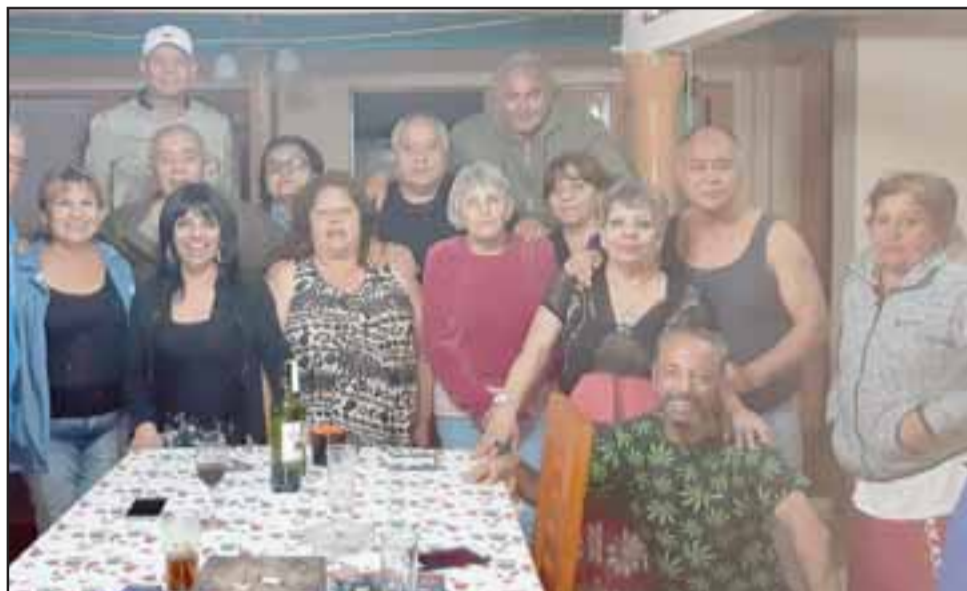
DISFRUTANDO EN QUINTERO.- Aquí vemos a parte del grupo de egresados 1975 de la Escuela Uno, ahora Bernardo O'Higgins.