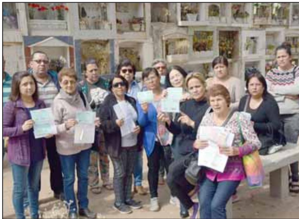
EXIGEN EXPLICACIONES.- Ellos son sólo un grupo de las tantas personas que llegaron ayer lunes al Cementerio Parroquial de Catemu, algunos para saber dónde están sus seres queridos, y por qué sus nichos aparecen con varios dueños.