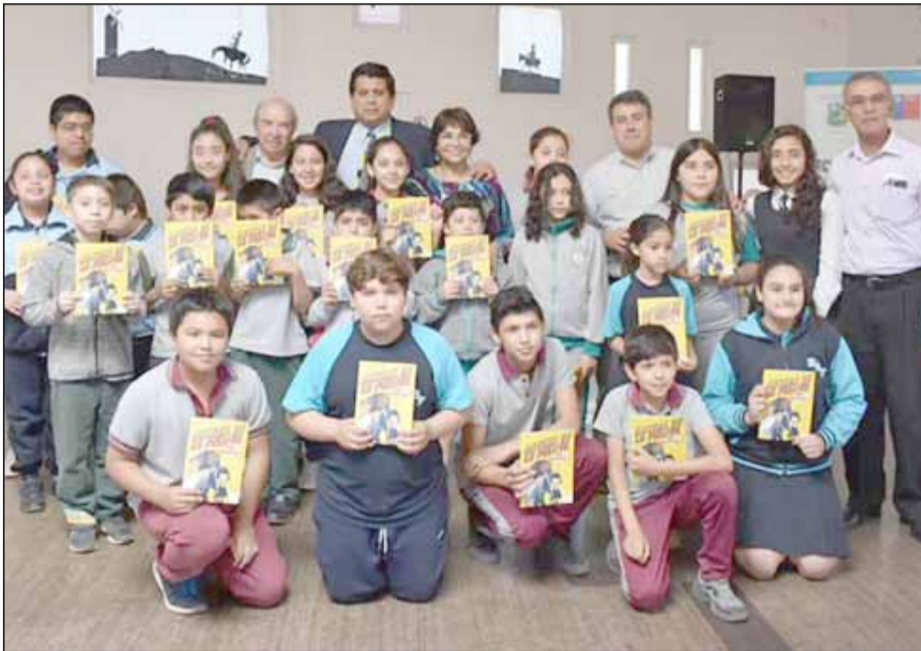
Niños y niñas recibieron un ejemplar del comic «Arriba de la Pelota. Niñ_s defensor_s».