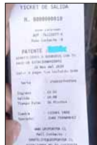
En la imagen el ticket donde aparecía la leyenda, la cual fue retirada tras el desmenti- do de Bomberos.

Cabe recordar que este contrato es por cuatro me- ses. Después viene la licita- ción por más años.