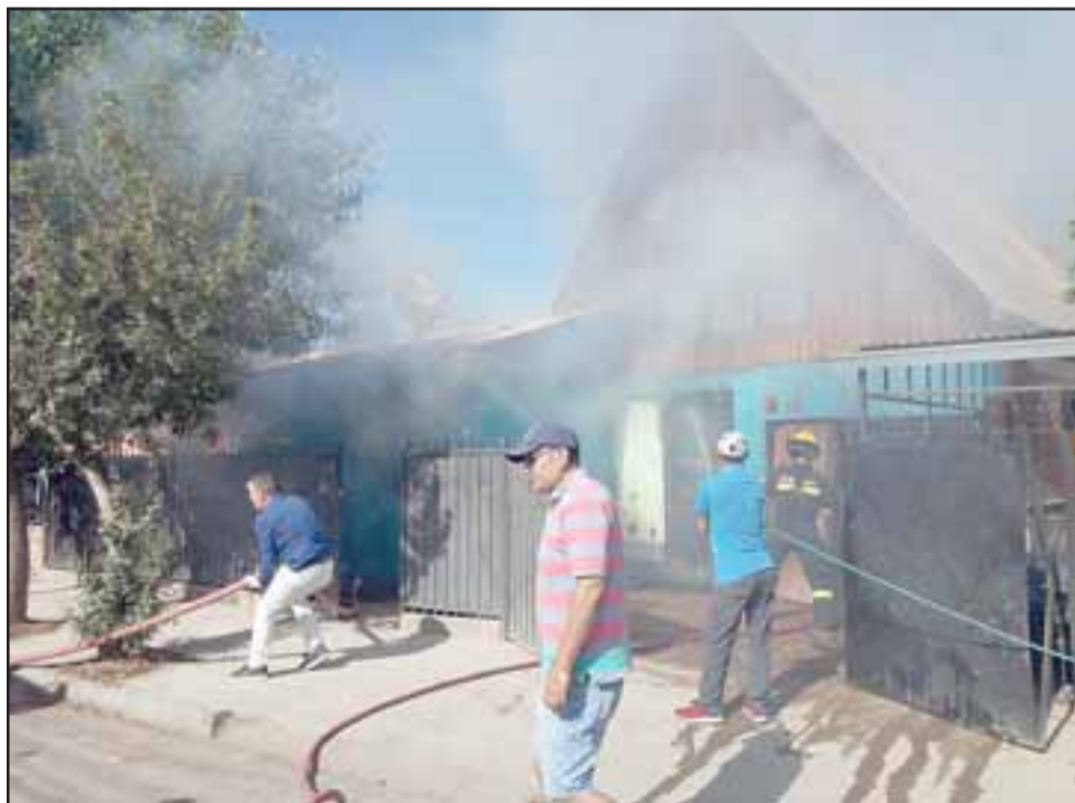
Compañías de Bomberos de Santa María y San Felipe combatieron el fuego.