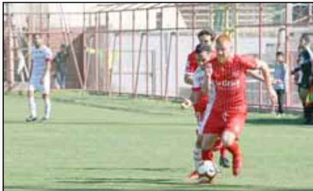
Los jugadores profesionales se oponen a que retornen las actuales competencias de la ANFP.