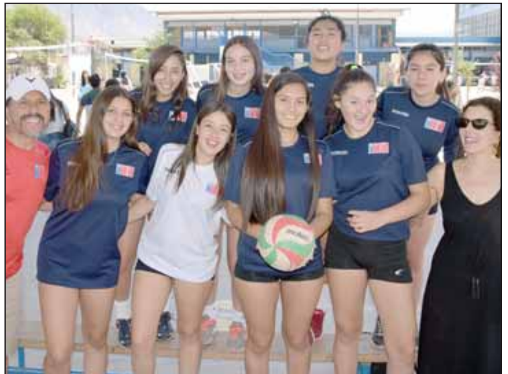
FUERZA CHIQUILLAS.- Aquí tenemos a las niñas del Cordillera, posando para nuestras cámaras en uno de sus entrenamientos, ellas esperan poder llegar a Paraguay con la mejor condición física.

Chávez , quien explicó que «estamos ya ad portas de viajar a Paraguay para disputar nuestros tercer Sudamericano como colegio y las expectativas son normales, esperamos jugar bien y tener suerte en el grupo que nos toque un buen grupo en el sorteo y a partir de eso poder determinar cómo esperamos que nos resulte (...) queremos superar que siempre hemos sido cuartos o quintos lugares, nunca hemos ganado un sudamericano ni hemos subido al pódium por lo tanto el primer objetivo nuestro es poder estar entre los primeros tres lugares, si logramos eso ya entonces empezar a pensar en el Título pero objetivamente hablando queremos subirnos al pódium por primera vez en la historia (...) el tema aquí es que nosotros competimos con los mejores del mundo Brasil, Perú Colombia, a nivel femenino son de los mejores equipos del mundo por lo tanto la competencia es