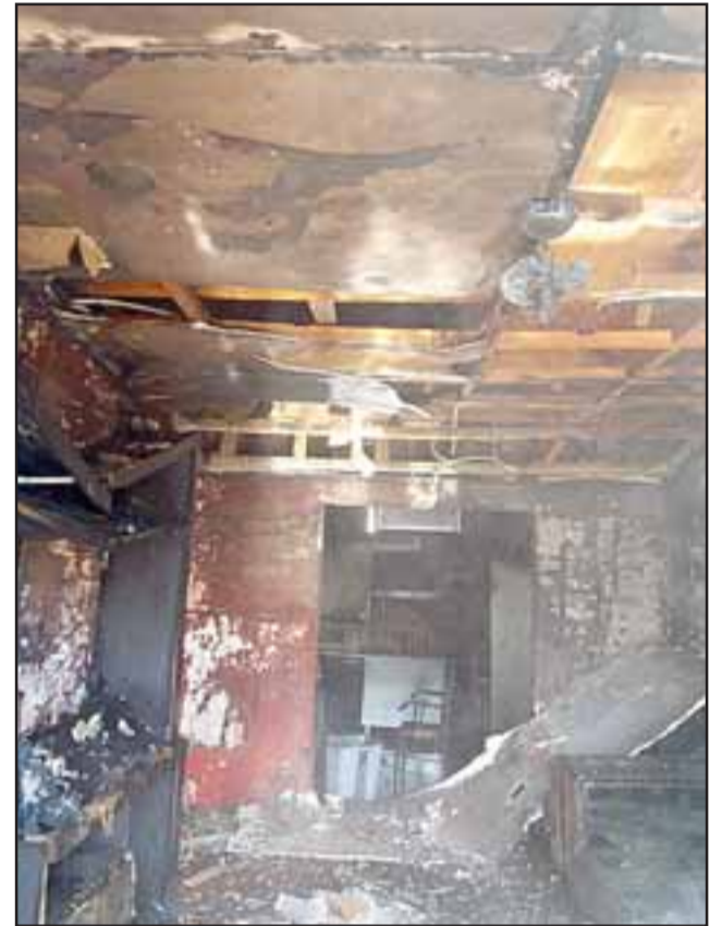
Pérdidas totales para la familia afectada producto de este incendio. (Fotografías: Emergencias Santa María).