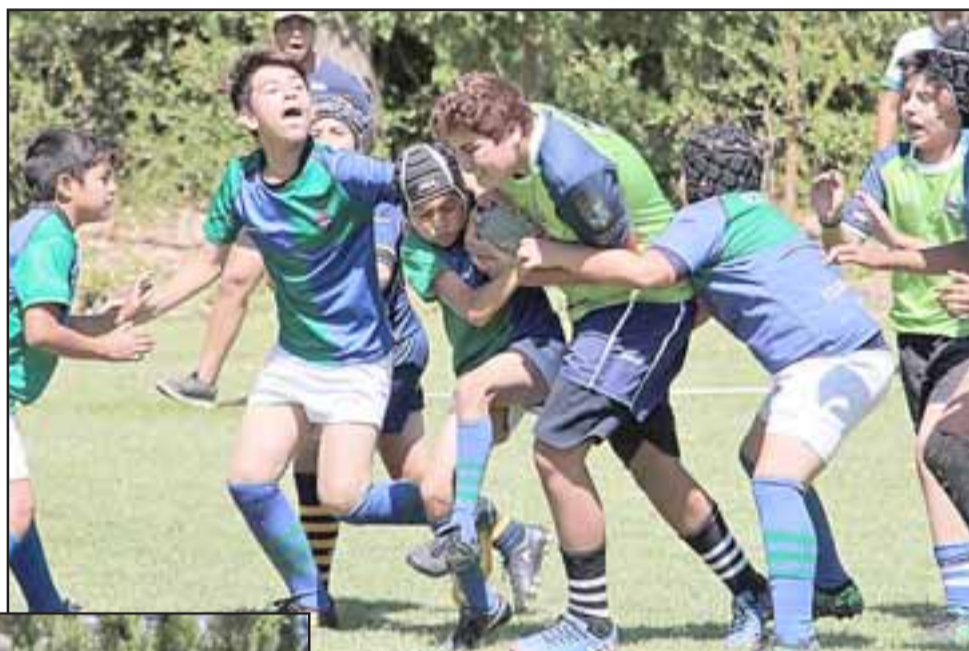
Partidos muy entretenidos hubo en la 9ª edición del Festival de Rugby que organizó el club Los Halcones.

Una vez concluida la actividad deportiva se dio inicio al 'tercer tiempo', espacio en el cual los niños pudieron disfrutar de ricas hamburguesas, jugos y bebidas. Al final del encuentro cada niño recibió una distinción por haber sido parte de la novena versión del Festival de Rugby Los Halcones.