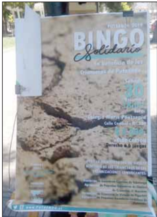
Este es el afiche de promoción del bingo que se realizará sí o sí este sábado 30 de noviembre.

regar. Piensa que se van a tener que dedicar a otro rubro. La gente está decaída. Hay mucha gente de edad que no tiene otra área para ganarse la vida. Porque en todos lados le piden cuarto medio. Reitera la invitación para este sábado 30 de noviembre a participar del bingo en apoyo a los crianceros. Para ello van a estar ubicados en la plaza hoy para vender las tarjetas que tienen un valor de 2.000 pesos.