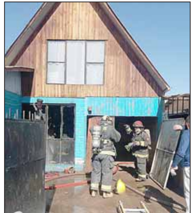
La vivienda afectada se ubicada en el pasaje Las Palmeras de la Villa Los Aromos de Santa María.