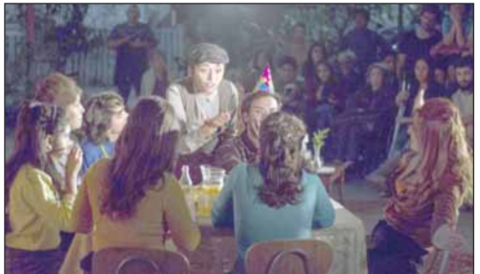
DILEMA MORAL.- Aquí vemos una escena de la obra, cuando los vecinos de Las Cañas deliberan cómo enfrentar el dilema de seguir por el camino correcto, o dar la espalda al valor de la verdad.