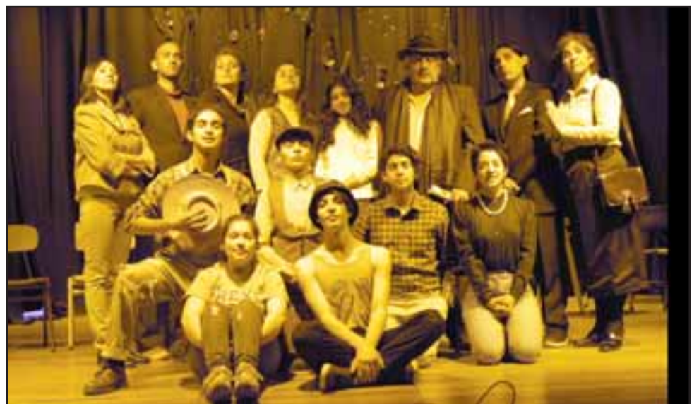
ELENCO DE LUJO.- Ellos conforman el elenco actual que estará actuando este lunes en el Teatro Roberto Barraza, con la obra La Enemiga del pueblo.

«La obra se presentará en el Teatro Roberto Barraza del Liceo Roberto Humeres, después de terminada la misma (una hora) se realizará un conversatorio, todos los actores son del Va-