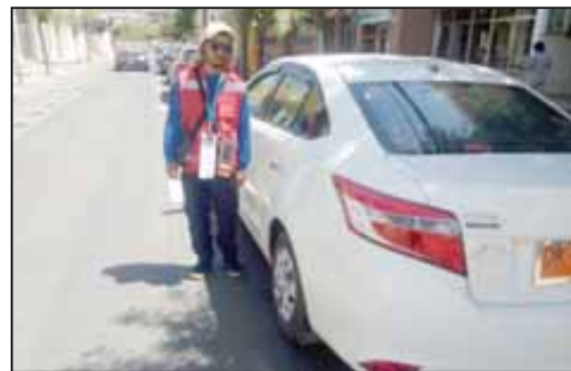
Con normalidad se ha reinstaurado el cobro de estaciona- mientos en el centro de la ciudad.

Por información recaba- da por nuestro medio, ayer en la tarde se iba a reunir el propietario de la empresa