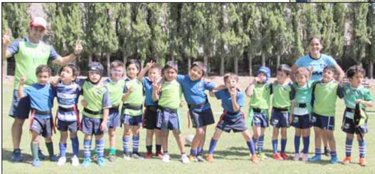
Los más pequeños se robaron la atención de los asistentes en el evento de la ovalada.