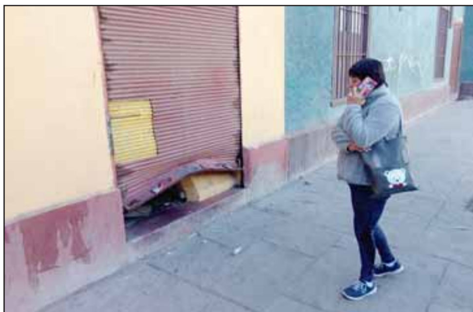
La cortina levantada, así amaneció ayer en la mañana Cecinas Santa Julia.

Cuenta que debido a los robos había mejorado la calidad de las cortinas, «pero en esta ocasión pusieron una gata hidráulica, pero