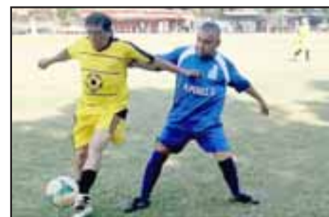
Dos jugadores disputan el balón en el inicio del torneo de Apertura de la Liga Vecinal.

Barcelona 1 – Santos 1; Andacollo 1 – Hernán Pérez Quijanes 0; Los Amigos 2 – Tsunami 1; Villa Los Álamos 2 – Carlos Barrera 1; Pedro Aguirre Cerda 3 – Unión Esperanza 2; Unión Esfuerzo 4 – Resto del Mundo 1; Villa Argelia 4 – Aconcagua 1.