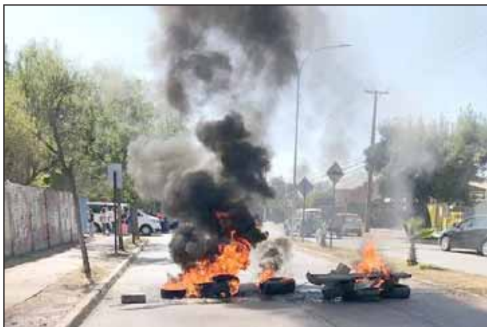
Barricadas durante la mañana de este martes en Avenida Miraflores, a pasos del Hospital San Camilo de San Felipe.

Pasada la medianoche se registró el corte del suministro eléctrico en gran par-