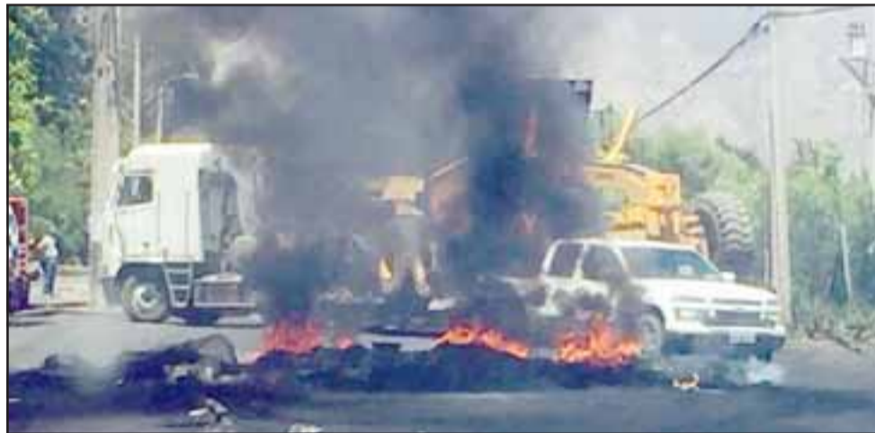
Cortes en la ruta Troncal de Panquehue y barricadas encendidas durante las últimas jornadas de movilizaciones.