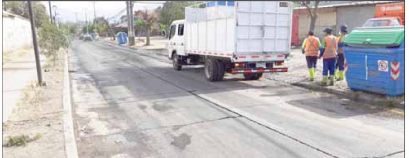
Cerca de mil personas entre adultos mayores y población de menores ingresos, quedarían exentas de pagar los derechos de aseo para todo el próximo año.