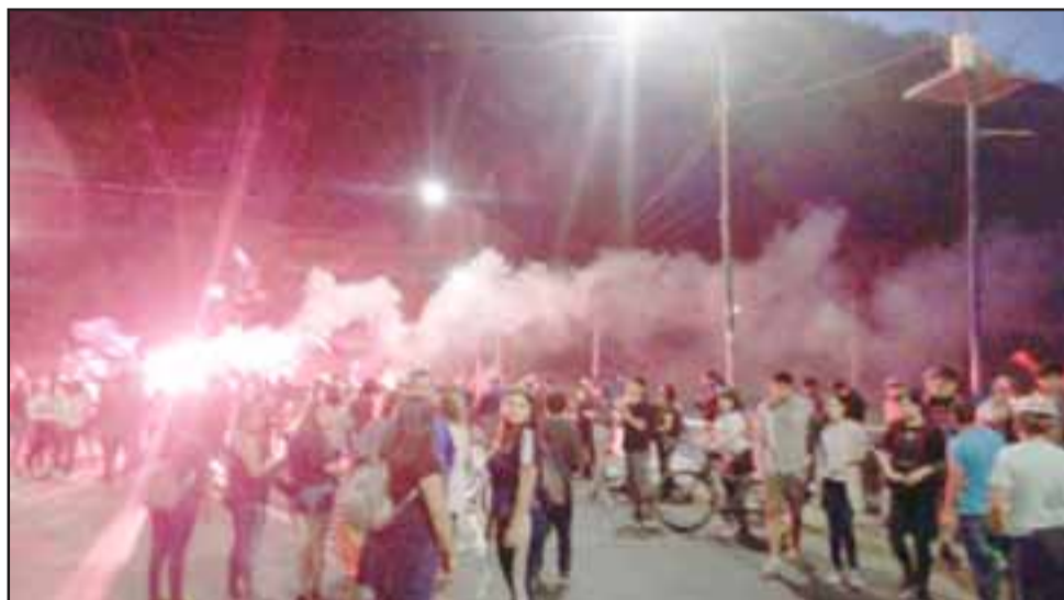
Durante la tarde noche de este martes, manifestantes se reunieron en el sector del Puente El Rey, originándose desmanes y encendido de barricadas.