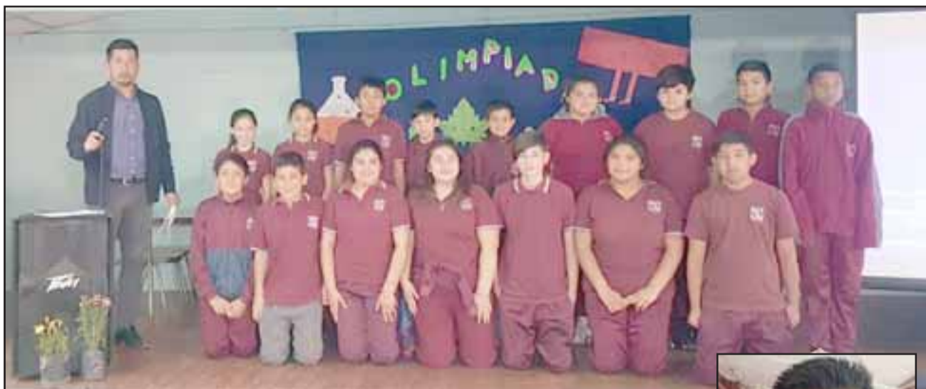
Los alumnos de quinto, sexto, séptimo y octavo año básico participaron en las olimpiadas de matemáticas de la Escuela Bucalemu.

«Queremos, por intermedio de juegos lúdicos, preguntas abiertas, trabajos de operatoria, ya sean sumas, restas, multiplicaciones, resolución de problemas, que ellos puedan tener una actividad lo más didáctica posible y así de alguna forma enriquecer el saber de las matemáticas por intermedio de esta actividad», dijo Raúl Contreras , profesor de matemáticas y organizador de las olimpiadas de la Escuela Bucalemu.