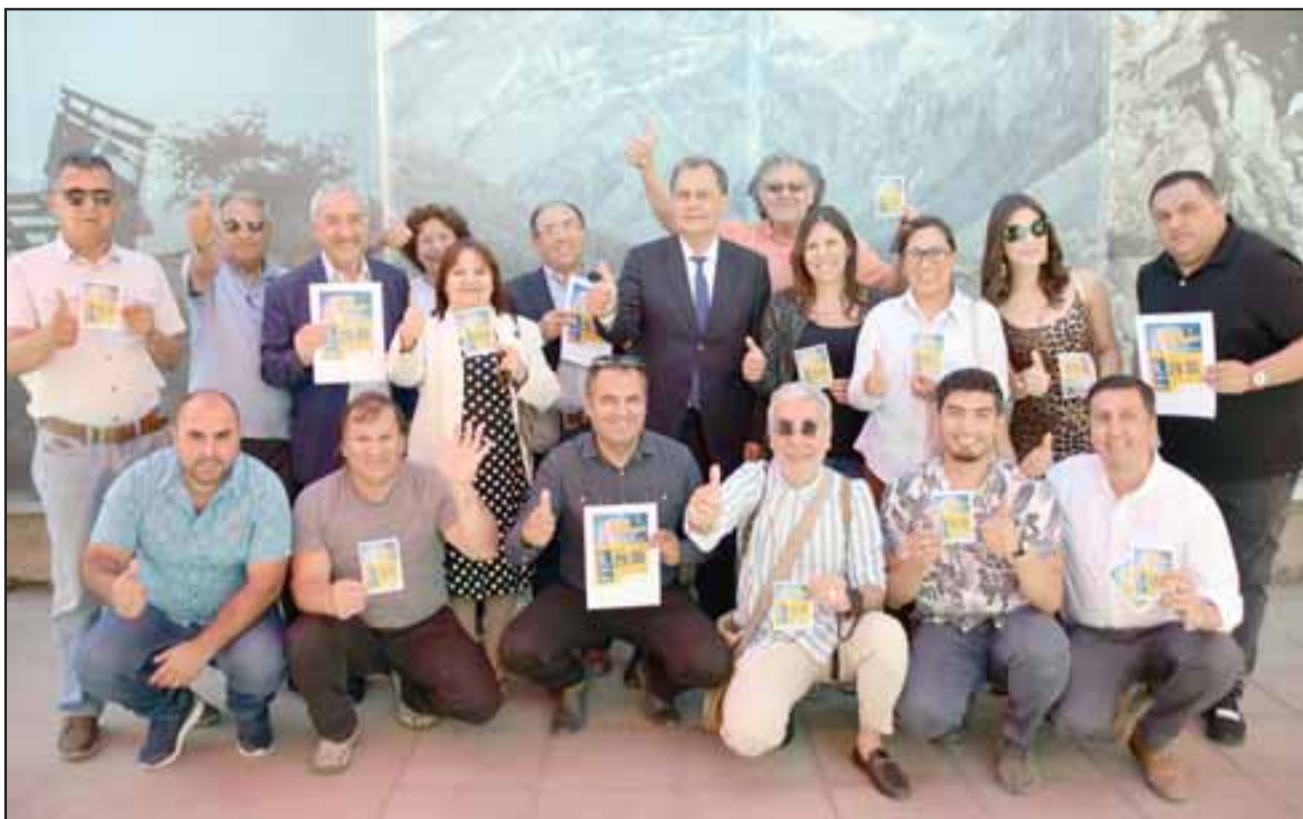
TODOS UNIDOS.- Comerciantes y autoridades de nuestra comuna apuestan todo a la Gran Venta Nocturna, iniciativa que invita a todos los aconcaquinos a disfrutar de las ofertas hasta la media noche este viernes y sábado.

ductores, la mayoría de ellos están con disposición de aportar con su granito de arena y hacer que el tema funcione».