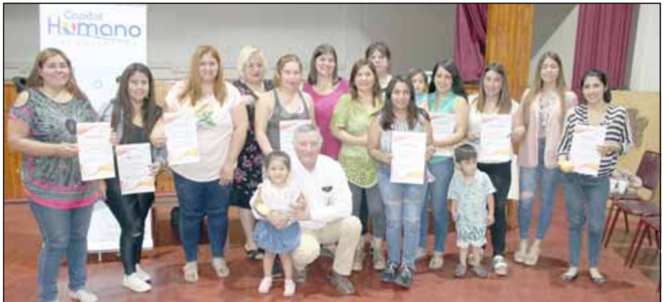
Participantes del taller lucen con orgullo sus diplomas que las certifican para realizar su propio emprendimiento relacionado con el alisado de pelo con keratina.

«Las mujeres vinieron a clases alrededor de una semana, luego de eso fueron evaluadas y finalmente se les entregó su respectiva certificación. En este caso las chicas aprobaron todas, por lo mismo estamos muy contentos con el trabajo de cada una de ellas. Esto se