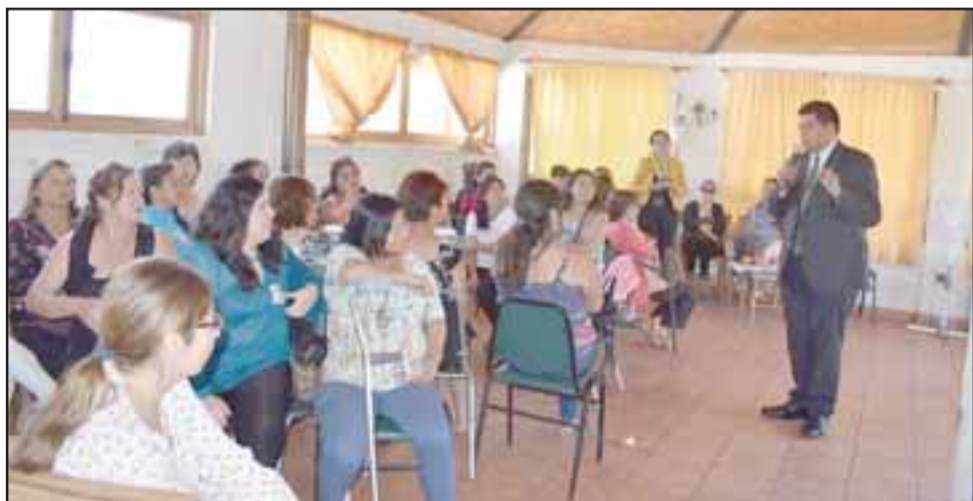
El programa Mujeres Jefas de Hogar es ejecutado por la Municipalidad de Santa María a través de un convenio con el Ministerio de la Mujer y Equidad de Género.

Para lo anterior se ha realizado un trabajo coordinado con organismos intra y extra municipales, don-