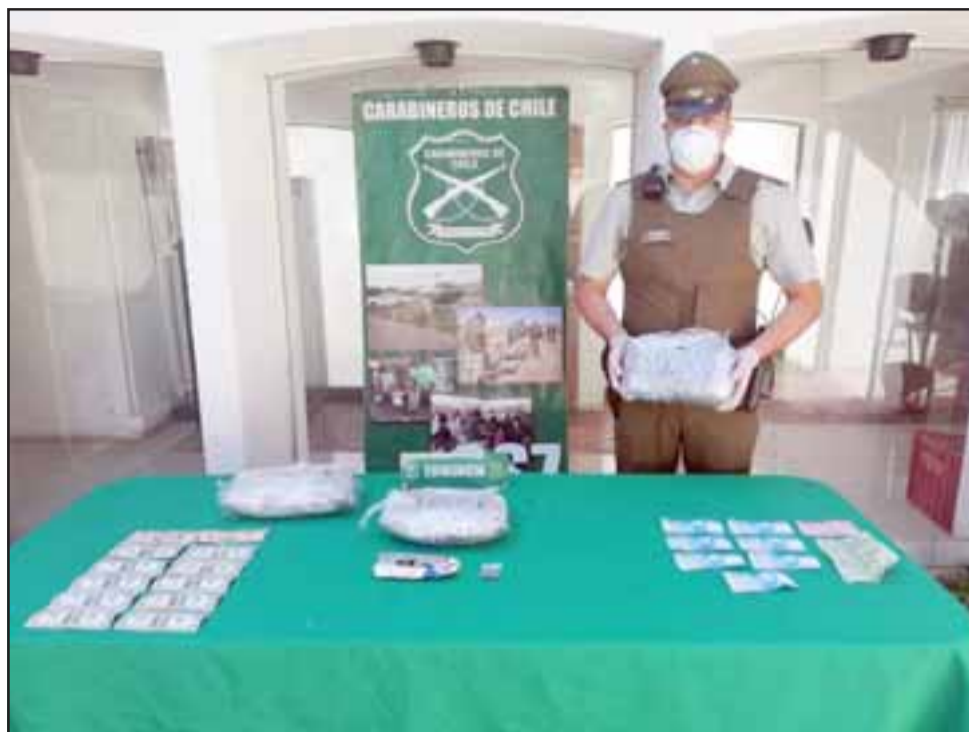
Personal del OS7 de Carabineros Aconcagua incautó más de tres kilos de marihuana elaborada en el sector Las Vegas de Llay Llay el 12 de abril de este año.

cias que Carabineros de la sección OS7 Aconcagua efectuaba controles selectivos vehiculares en la ruta 5 Norte, en el sector Las Vegas de Llay Llay.