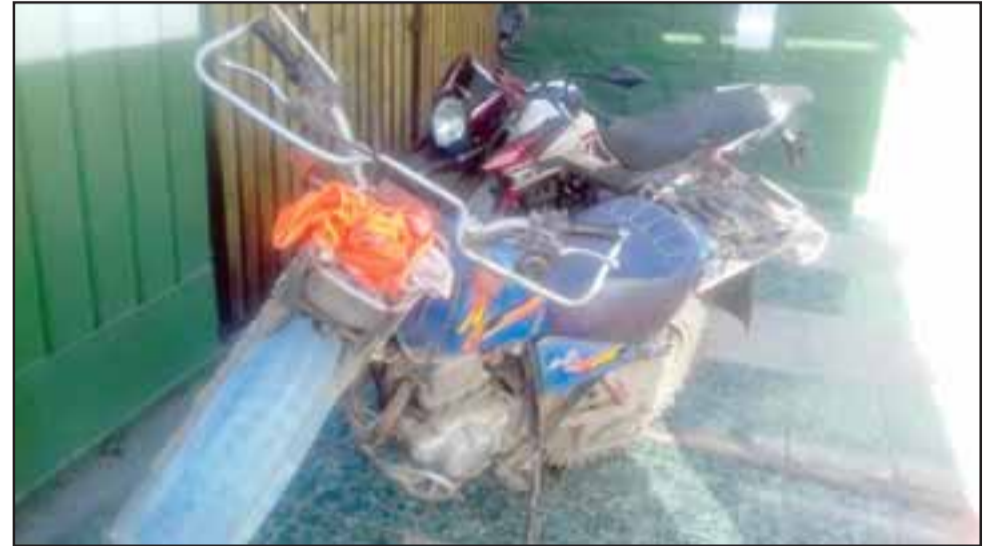
Ambos conductores circulaban en estas motocicletas, originándose una colisión en calle Antofagasta, frente a la Viña Errázuriz de Panquehue durante la mañana de ayer.