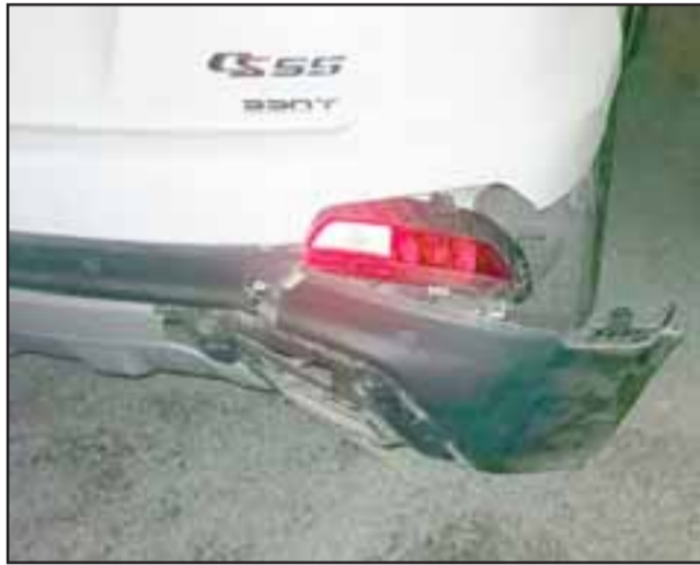
El vehículo policial también resultó con daños, mientras que al alocado conductor sólo le retuvieron su licencia.

siendo formalizado por los delitos de Manejo en estado de ebriedad, causando daños, huir del lugar del accidente de tránsito sin prestar ayuda, amenazas, daños respecto de la radiopatrulla y Lesiones a Carabineros en servicio. El irresponsable conductor quedó sólo con la medida cautelar de Retención de licencia por los cuatro meses que durará la investigación.