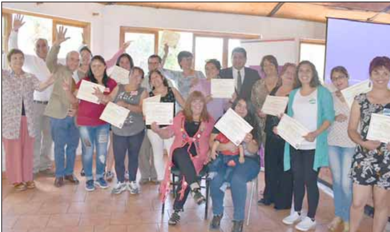
Mujeres del área independiente reciben certificación del curso Online Dream Builder.

Asimismo, se ha querido complementar la participación de las mujeres con otros elementos que aporten a su desarrollo integral.