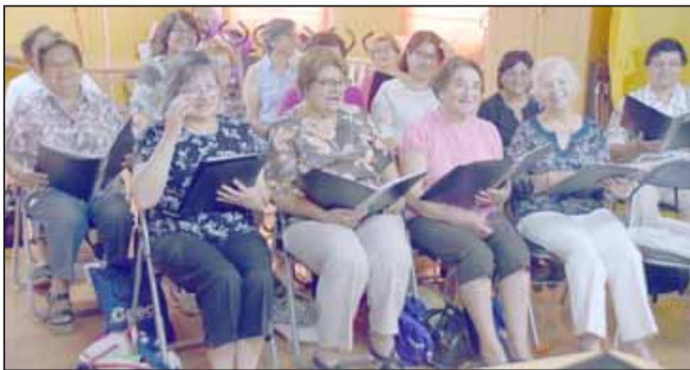
CORISTAS LOCALES. - Estos vecinos llevan años cultivando su talento coral y dominio escénico.