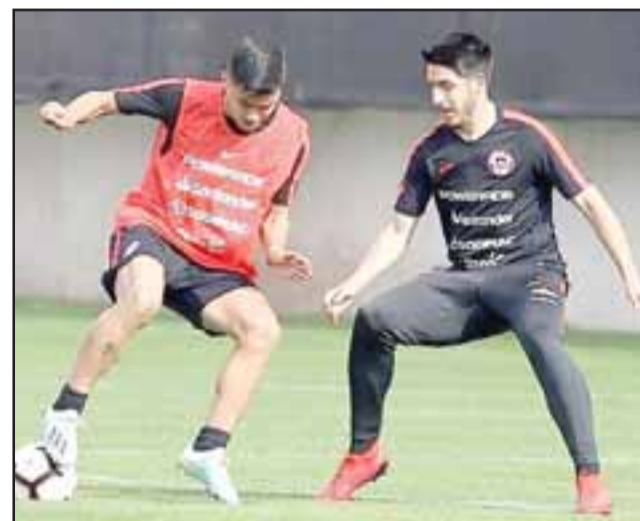
El zaguero central albirrojo (a la derecha) en uno de los entrenamientos del combinado juvenil chileno.

La Selección Chilena Sub-23 quedó sembrada en el grupo A, el que además está integrado por Colombia, Argentina, Ecuador y Venezuela.