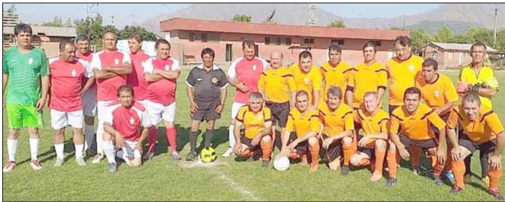
Los equipos de El Mirador y Unión Escorial posaron unidos para El Trabajo Deportivo.