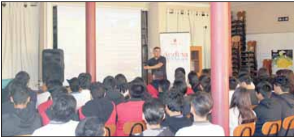
El trabajador destacó lo importante que es respetar los procedimientos, el autocuidado, la cultura preventiva y también el uso de todas las herramientas de seguridad y de protección personal.

dores de la empresa, quienes también aportan a la formación de jóvenes de la Escuela Industrial Guillermo Richards Cuevas de San Felipe, el Liceo Polivalente Manuel Rodríguez de Til Til y el Liceo Pedro Aguirre Cerda de Calle Larga. Y desde el 2018 se sumó a Andina más Cerca el Liceo de San Esteban y el Instituto Tecnológico de la Universidad de Playa Ancha (UPLA).