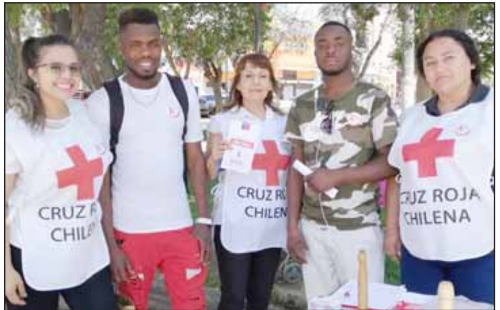
SÉ VOLUNTARIO. - Los jóvenes que quieran ser voluntarios de la Cruz Roja de San Felipe pueden llamar al 342510006.

Medicina General y lavados de oídos; podología, kinesiología, oftalmología, chequeo visual, masajes y clínica: toma de presión arterial y glicemia. Sinceramente nos sentimos contentos por las personas que demostraban sus agradecimientos por éste operativo, por la respuesta y lo nece-