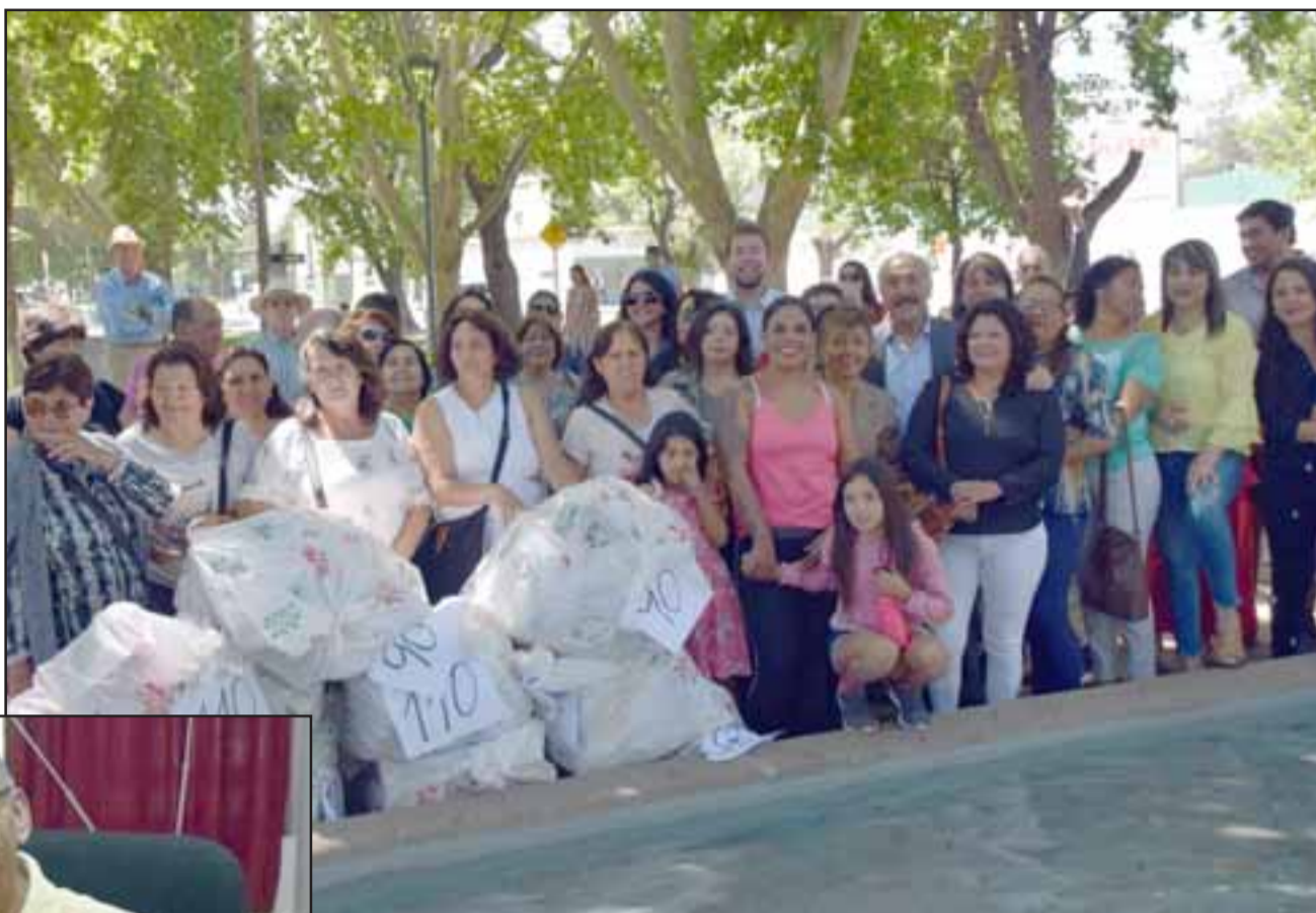
JUGUETES EN CAMINO. - El año pasado, como muestra esta gráfica, las autoridades entregaron miles de juguetes en la Pileta de Los Sapitos.

los nombres de tantos niños correspondientes a los reportados por cada una de las 116 juntas vecinales de nuestra comuna es bastante agotadora, sin embargo es un trabajo que desarrollamos con mucho gusto, sabemos que estos niños tendrán un juguete esta Navidad gracias a los recursos autorizados por el Concejo Municipal, no puedo dar el monto exacto, pero sí puedo adelantar que son más de 15 millones de pesos. En su momento el alcalde Patricio Freire anunciará todo lo relacionado a este programa 2019», dijo Solís.