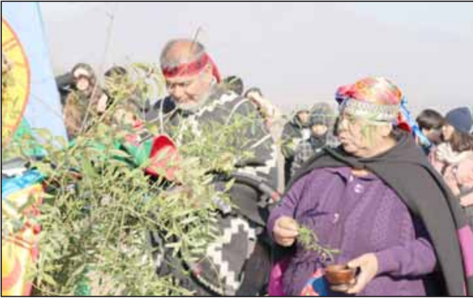
Este sábado 7 de diciembre la Plaza de Armas de Calle Larga albergará exposiciones, stands con medicina tradicional y ancestral, además de cuentacuentos y una serie de actividades pensados en los niños y la familia.