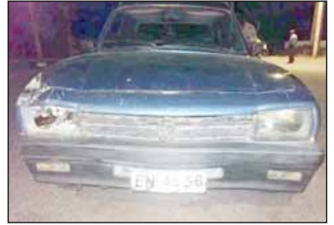
Este es el vehículo que conducía el ahora imputado. Finalmente el irresponsable conductor quedó sólo con la medida cautelar de Retención de licencia por los cuatro meses que durará la investigación.

Finalmente el ebrio pudo ser reducido, siendo