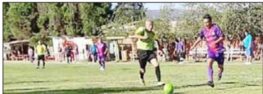
Jugadores en la disputa de la pelota durante la segunda jornada del naciente certamen central de la Liga Vecinal.