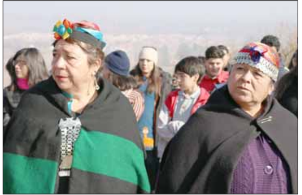
La actividad está en el marco de un proyecto que se adjudicó el Centro de Salud Familiar José Joaquín Aguirre, de Calle Larga y la Agrupación de Grupos Originarios 'Futa Repu'.