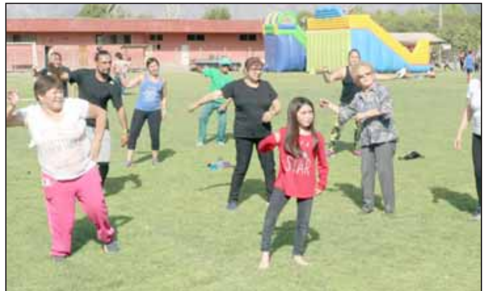
La feria deportiva tuvo la particularidad que niños, jóvenes y adultos mayores pudieron realizar todo tipo de actividades deportivas, las que fueron supervisadas por monitores.