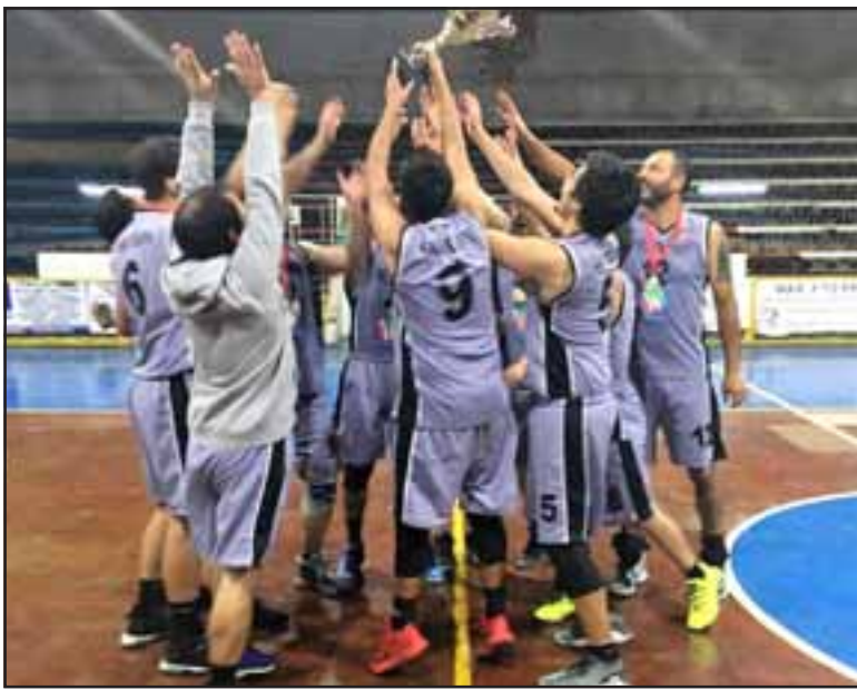
El equipo exportador levanta la copa reservada al mejor.

Resultados serie A Árabe 53 – Sonic 55 Mixto 71 – Prat 81