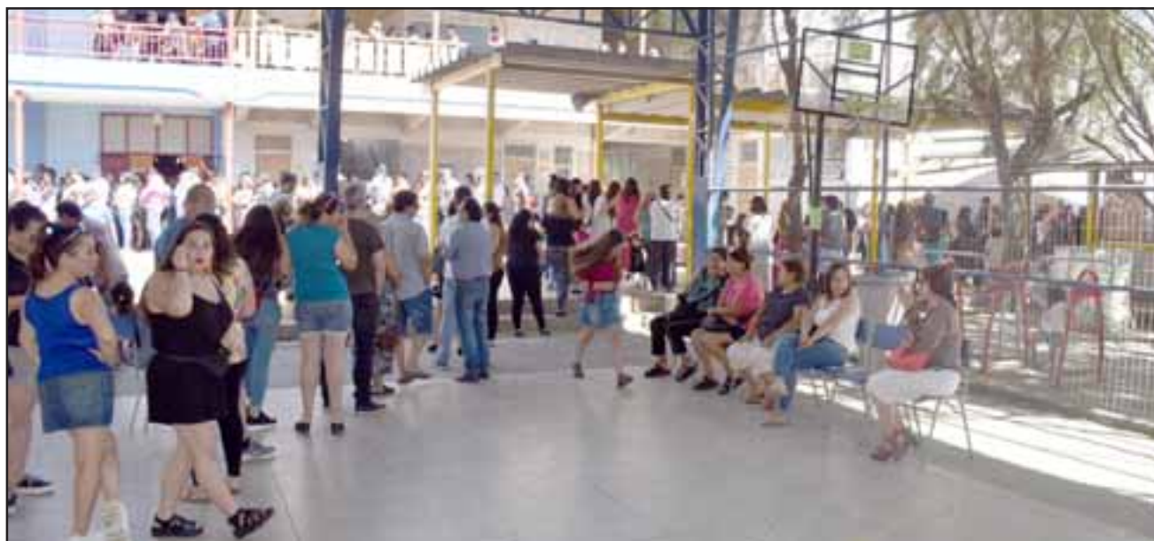
Con gran entusiasmo y masividad se realizó la consulta ciudadana en Llay Llay, donde en total participaron 3.072 personas este domingo.

nía a nivel país», señaló el alcalde Edgardo Gonzá-