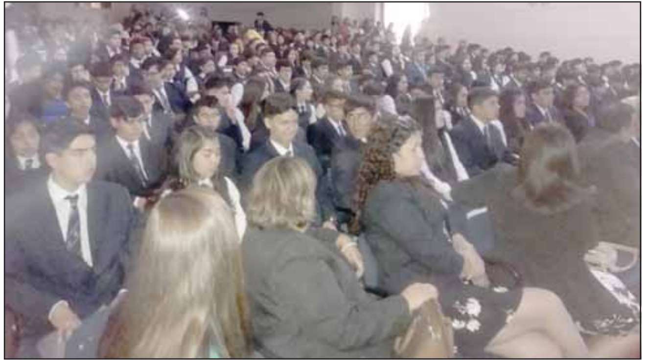
Los alumnos de octavo básico de la Escuela José de San Martín participaron de una emotiva ceremonia en el Teatro del Liceo Roberto Humeres.

Y respecto de los desafíos para el próximo año, la