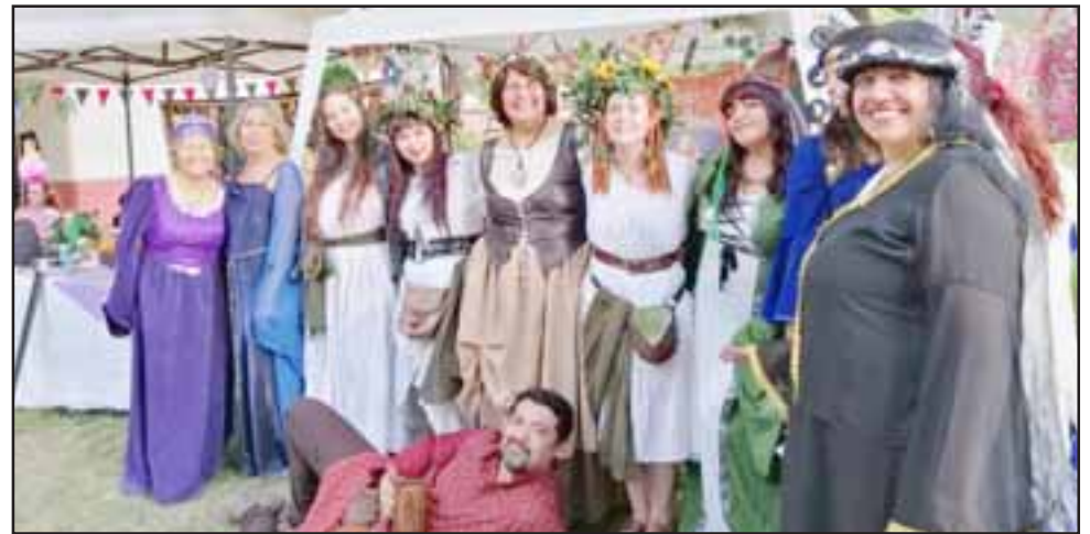
GRATIS PARA TODOS.- Ritmo, atuendo y música medieval hoy en el Roberto Barraza a partir de las 18:30 horas.