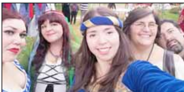
IMPERDIBLE.- El evento, denominado 'De Europa a América', es una fina muestra de la cultura europea y su repercusión en nuestro continente a través de la música y el baile flamenco.