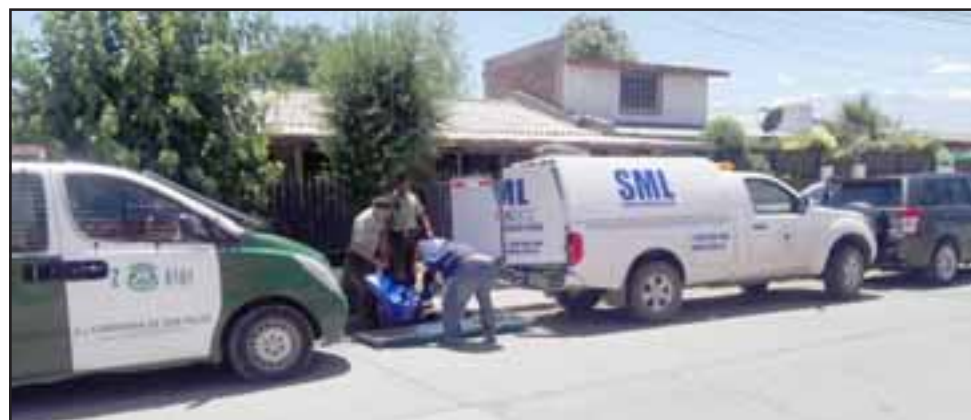
El cuerpo fue levantado por personal del Servicio Médico Legal para la correspondiente autopsia de rigor. (Fotografía referencial).

po de la fallecida fue levantado por personal del Servi-