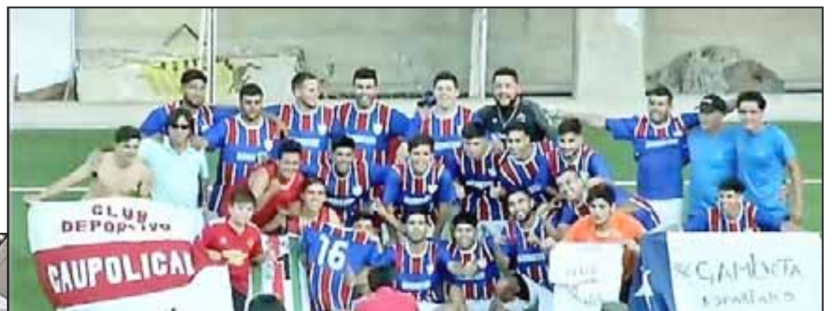
La selección de Catemu alcanzó un logro histórico para el deporte aconcañino al ganar el Regional amateur de Honor.

El encuentro jugado en Quillota contó con un considerable marco de público, sobresaliendo la gran cantidad de hinchas cateminas que prácticamente llenaron una tribuna del coliseo deportivo que en el segundo tiempo se cargó de emoción, ya que fue en ese lapso donde llegaron los goles.