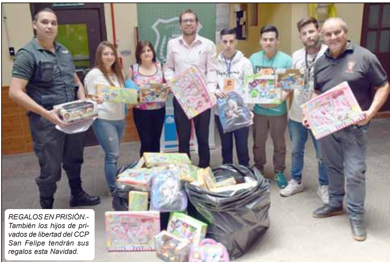
REGALOS EN PRISIÓN.- También los hijos de privados de libertad del CCP San Felipe tendrán sus regalos esta Navidad.