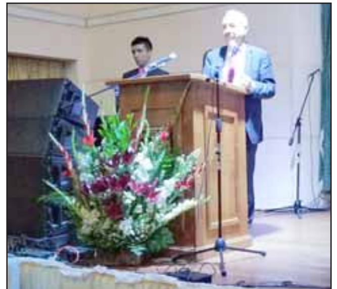
El alcalde Patricio Freire despidió a los cuatro octavos que participaron en la ceremonia de licenciatura.

continuidad a los alumnos de octavo básico. «Las familias siempre han manifestado su interés de poder mantenerse en la escuela, más del 60% de los alumnos manifiesta querer tener la enseñanza media en nuestro establecimiento, entonces ese es uno de nuestros grandes desafíos», finalizó la profesional.