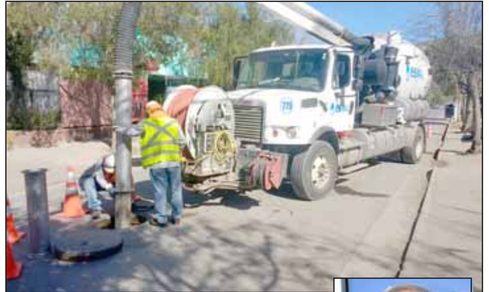
Esvál inició las obras en diversas calles de la comuna, con una inversión que supera los $260 millones.

El ejecutivo valoró el apoyo del municipio de Putaendo para la ejecución de los trabajos, junto