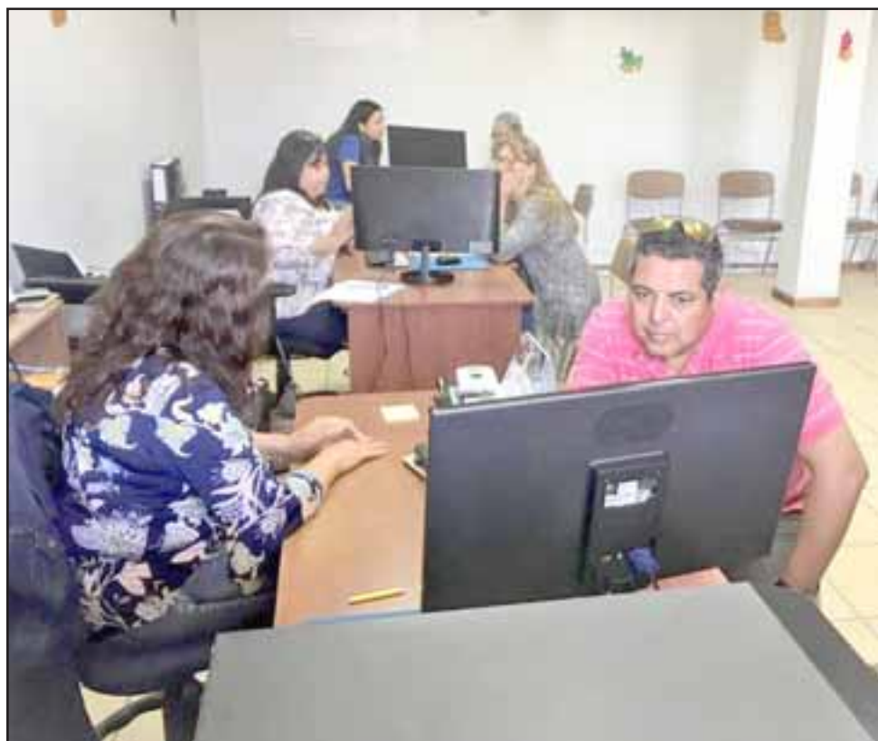
Los participantes utilizaron el voto electrónico en los cinco puntos habilitados para este efecto: Dirección de Desarrollo Comunitario, Municipalidad de San Felipe, Centro Ayecán, Escuela 21 de Mayo y Biblioteca Curimón.