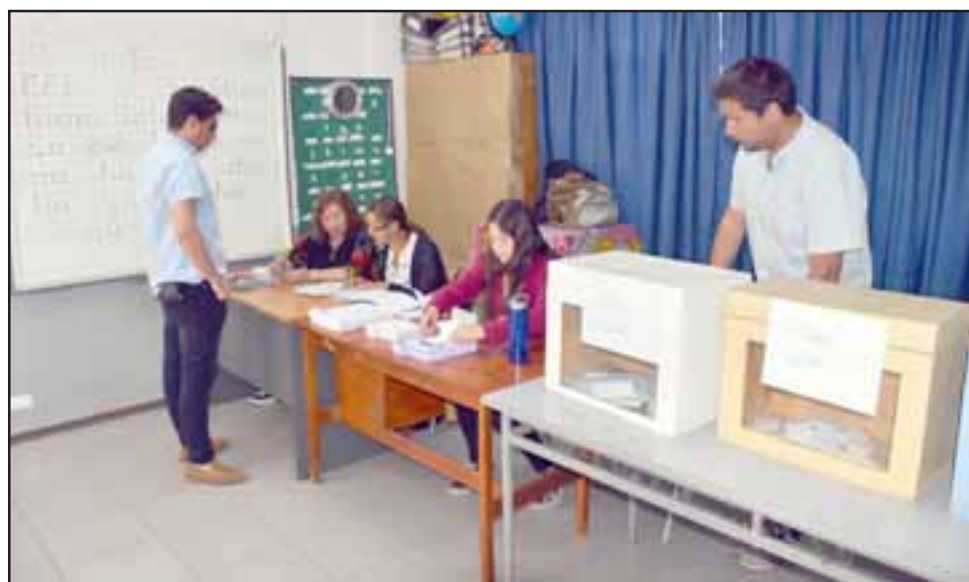
Pasado las 9 de la mañana se abrieron las 10 mesas, recibiendo a los interesados en participar en el proceso que fue apoyado por voluntarios de distintas organizaciones.

entregamos esta instancia participativa, por cierto, que no es vinculante, pero creemos que es formativa, significativa para el desarrollo social de la comuna, porque una comuna crece cuando hay participación, interés y se dialoga. La convocatoria nos dejó conformes y la forma en que se desarrolló fue muy tranquila, alegre, familiar y mostró que la voluntad ciudadana quiere cambios a nivel nacional y eso es un llamado de atención a las autoridades y como se está manifestando la ciudadana