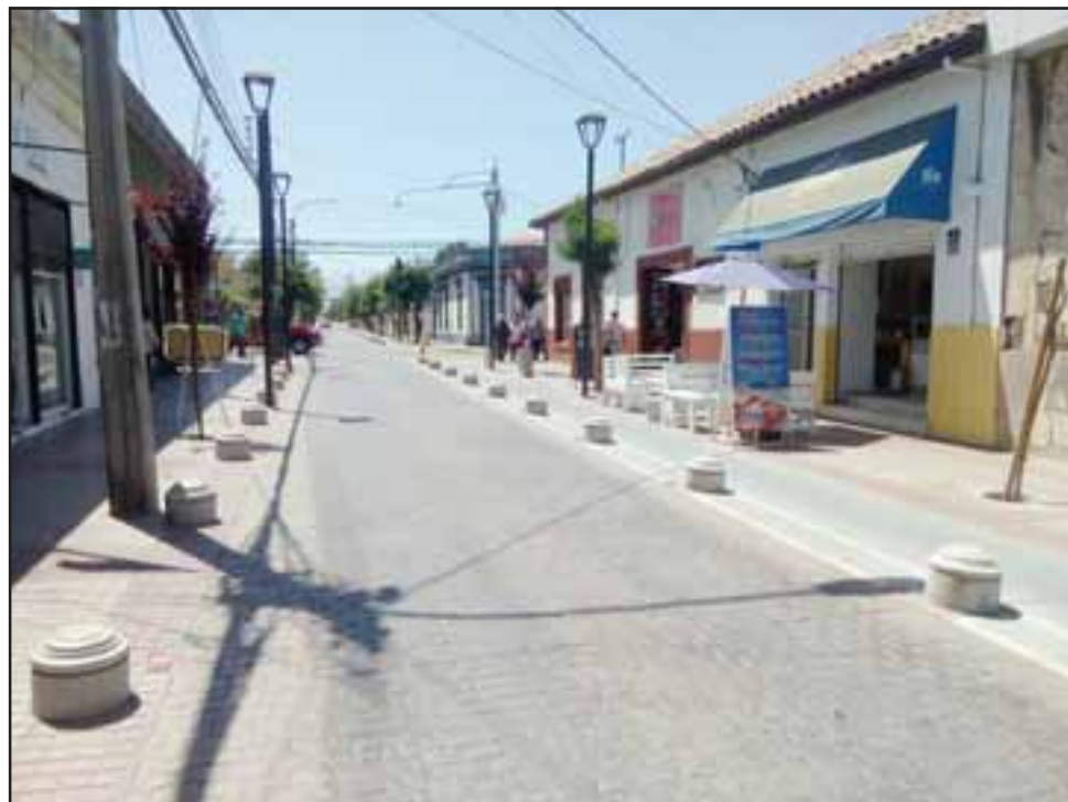
Comerciantes de calle Prat recomiendan absolutamente la venta nocturna.