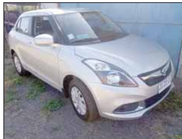
Este es el vehículo que lograron robar los asaltantes la madrugada de este domingo en el sector El Algarrobal de San Felipe.

- Sí, porque nunca me había pasado algo igual,