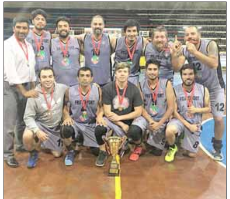
Frutexport no tuvo contrapesos en el torneo B de la ABAR.

la ABAR, solo se jugaron dos partidos, por lo que la definición para conocer al dueño absoluto de los cestos de la futura Región Cordillera quedó re-