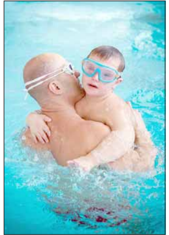
Los menores disfrutan de la piscina, además de las diferentes actividades preparadas para ellos. (Foto referencial).

Para mayor información llamar al siguiente número +56 9 3146 1069, con Siria Mena.