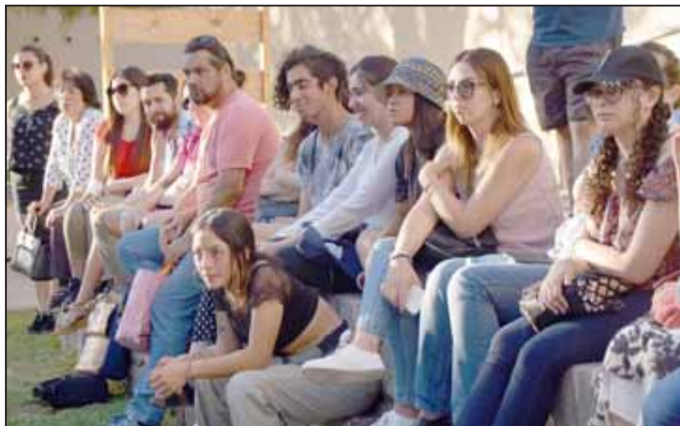
HIPNOTIZADOS. - Amigos, familiares y público en general de las artistas disfrutaron complacidos del gran espectáculo ofrecido.