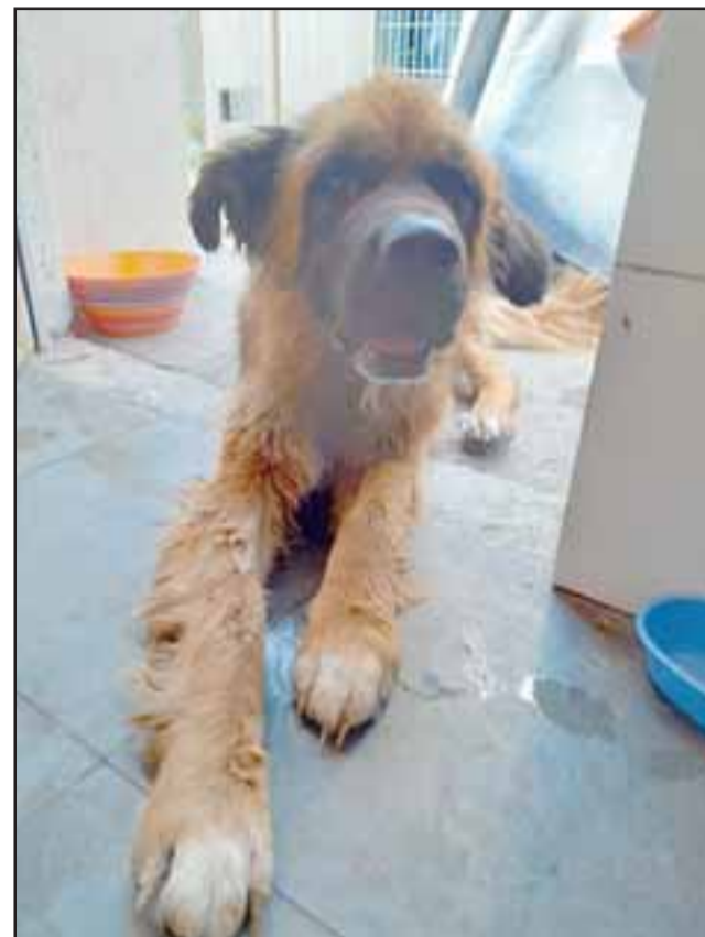
El perrito finalmente fue adoptado por una familia que se conmovió con su historia.

La profesional agregó que la semana pasada el perrito ya estaba adaptado a su nueva familia en excelentes condiciones: «Es un perro mestizo sénior de entre 8 a 10 años de edad, ya está bien viejito (...) Asimismo nos pasa semanalmente con el abandono de cacho-