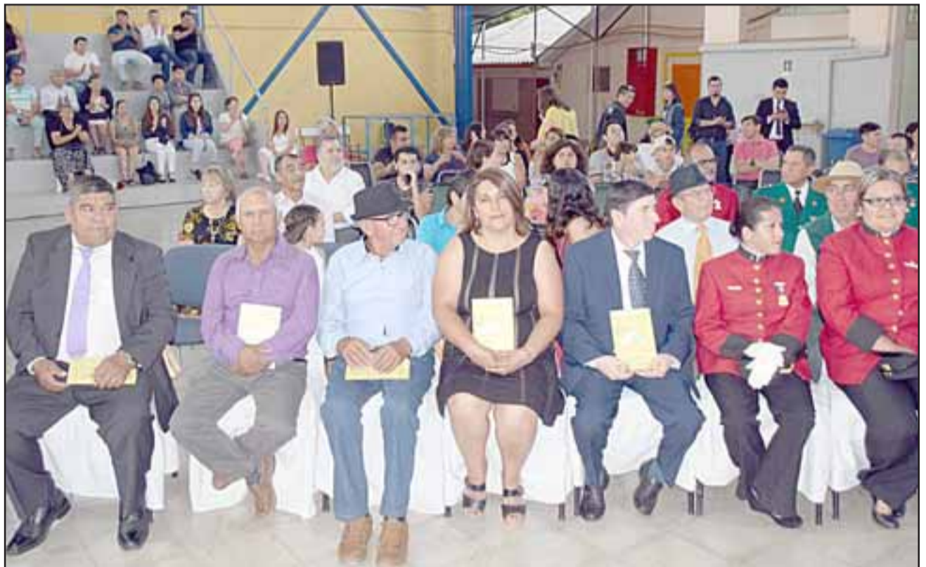
RECIBEN HONORES.- Acá tenemos a más premiados, cada uno de ellos brilló con luz propia a lo largo de este año.