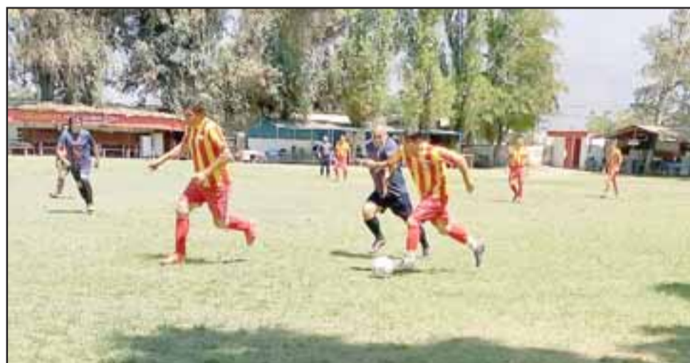
En el Apertura de la Liga Vecinal ya comienza a tomar forma la parte alta de la tabla.

Unión Esperanza 0 – Los Amigos 0; Unión Esfuerzo 1 – Carlos Barrera 1; Aconcagua 1 – Villa Los Álamos 0; Hernán Pérez Quijanes 1 – Tsunami 1; Pedro Aguirre Cerda 2 – Santos 1; Villa Argelia 2 – Andacollo 1; Barcelona 3 – Resto del Mundo 1.