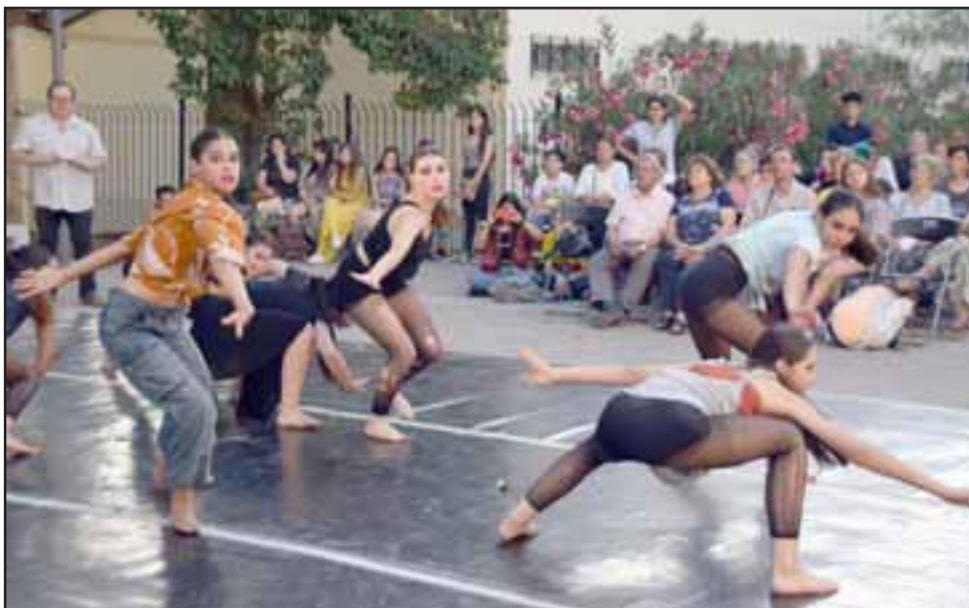
MAGISTRAL. - No hubo espacio para el error, cada movimiento de las niñas y jóvenes fue perfecto.