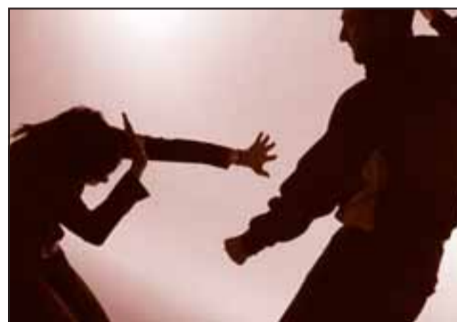
La denuncia por violencia intrafamiliar fue efectuada el 12 de mayo de este año en la población Yungay de San Felipe. (Imagen referencial).