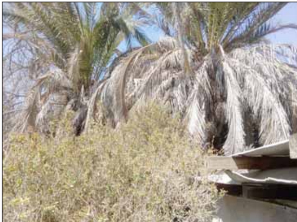
En la imagen se puede apreciar claramente el estado de sequedad de las especies arbóreas.

Preocupado se encuentra un vecino de calle San Martín porque en la parte posterior de su inmueble hay mucho arbusto y palmeras secas, las cuales en cualquier momento se podrían encender teniendo en cuenta las altas temperaturas.