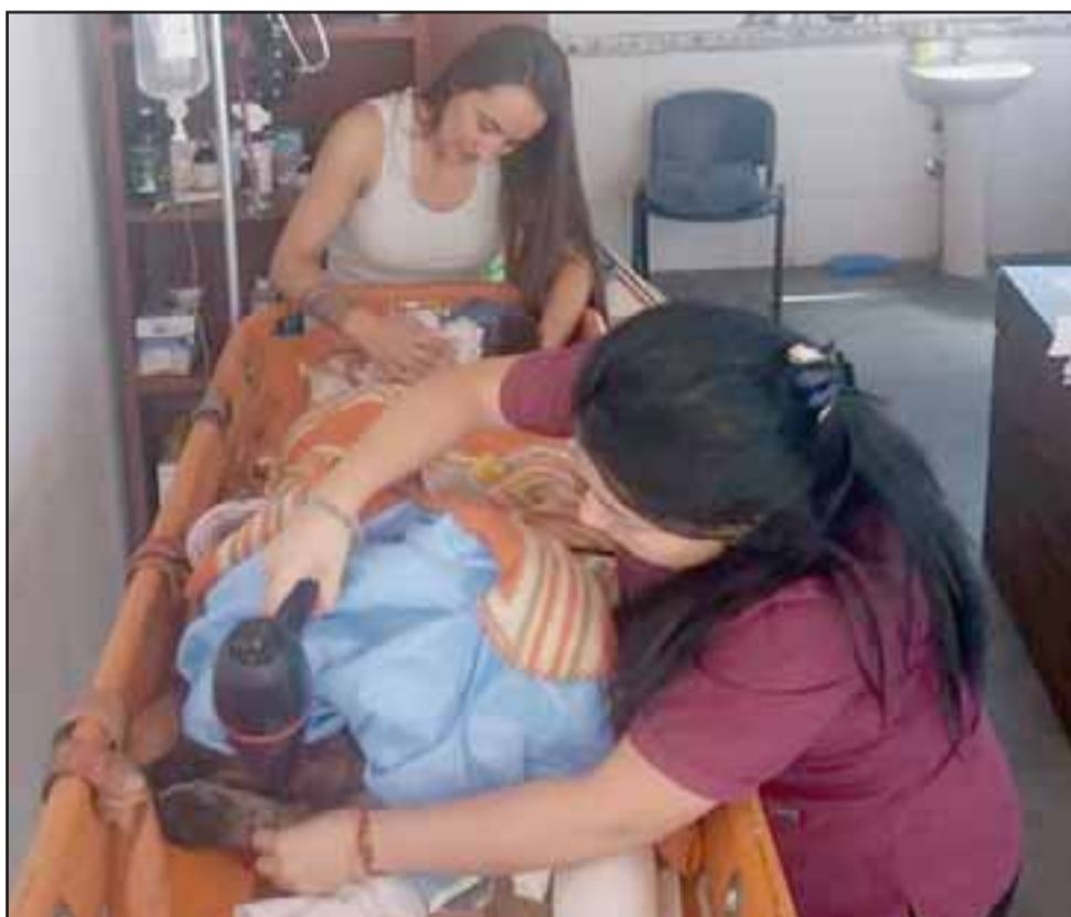
El animalito de avanzada edad fue atendido en la Consulta Veterinaria Municipal.