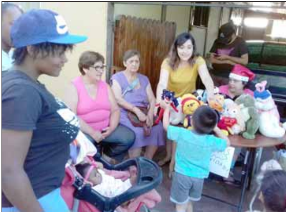
UNA ESPECIAL NAVIDAD. - En 2018 llegaron muchos niños del sector a recibir su peluche, eran pequeñitos de Población Juan Pablo II, El Totoral, Los Graneros, Población San Felipe y la misma Población San Felipe y Aconcagua. (Archivo)