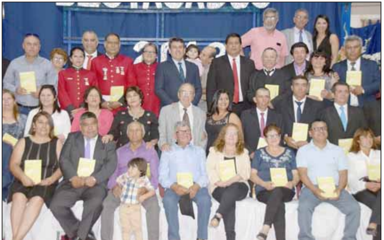
CUMPLIENDO 128 AÑOS.- En esta gráfica vemos a la mayoría de personas destacadas por el Municipio de Santa María este año 2019.