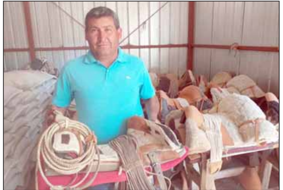
En total seis agricultores se adjudicaron proyectos para equipamiento de cabalgatas y otro proyecto para construcción de taller de trabajo destinado a un usuario del sector, lo que le permitirá mejorar su espacio de trabajo donde elabora piezas de artesanía.

Los incentivos de Indap para estos proyectos representan una inversión total cercana a los 12 millones de pesos, con un aporte total de los agricultores del 10 por ciento de sus recursos.