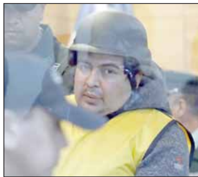
Este 'Chacal' recién podrá optar a beneficios cuando tenga 70 años de edad y haya pasado 40 tras las rejas.