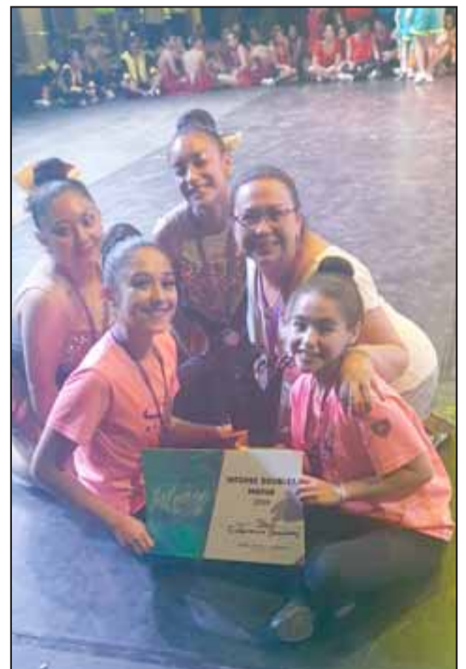
BECADAS AL EXTERIOR. - Aquí vemos a las más pequeñas con su diploma y beca, por ganar en Dobles Mayor.