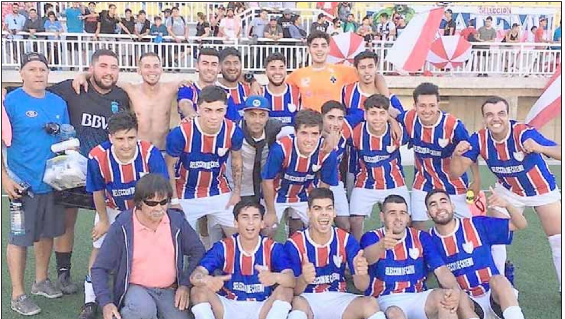
El combinado de Catemu regaló una enorme alegría al titularse campeones en el Regional de Fútbol de Honor.