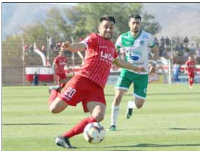
Tras un muy mal inicio el Uní Uní logró enderezar su campaña en el torneo de la Primera B.