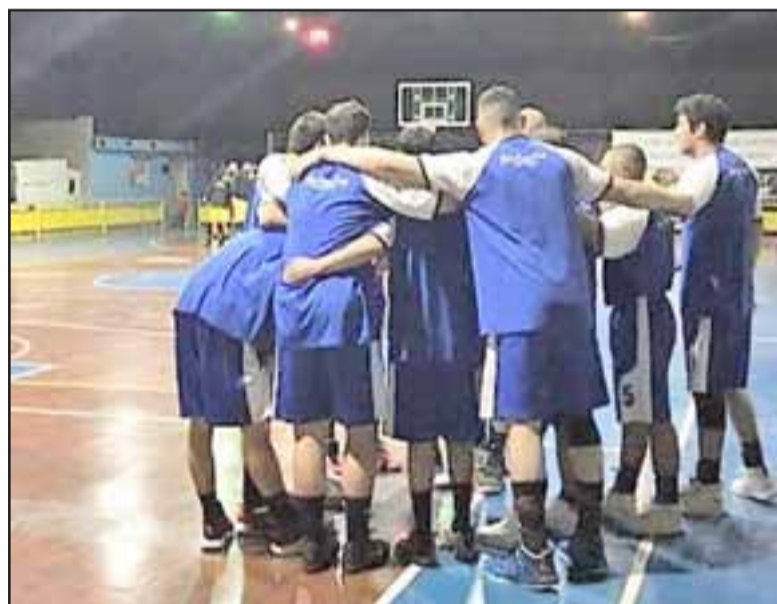
El quinteto del Prat bajó a la tercera categoría del baloncesto chileno luego de cumplir una campaña para el olvido en la LNB.