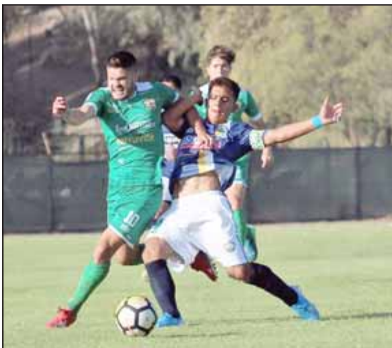
Una vez más Trasandino defraudó a su hinchada al no conseguir el ascenso a la tercera categoría del fútbol profesional chileno.