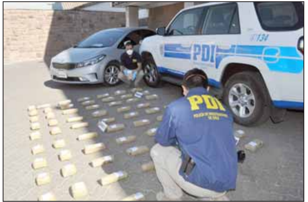
El trabajo de análisis criminal desarrollado por la PDI, el que duró más de seis meses, dieron como resultado el decomiso de esta droga, y quienes la transportaban.

Comentó que los imputados recibirían una cantidad determinada de dinero por transportar esta droga, siendo encontrados en su poder la suma de $116.000. «Este fue un control que llevamos adelante en la plaza de Peaje Las Vegas, donde se tomaron todas las medidas para poder llevar adelante este operativo que cul-