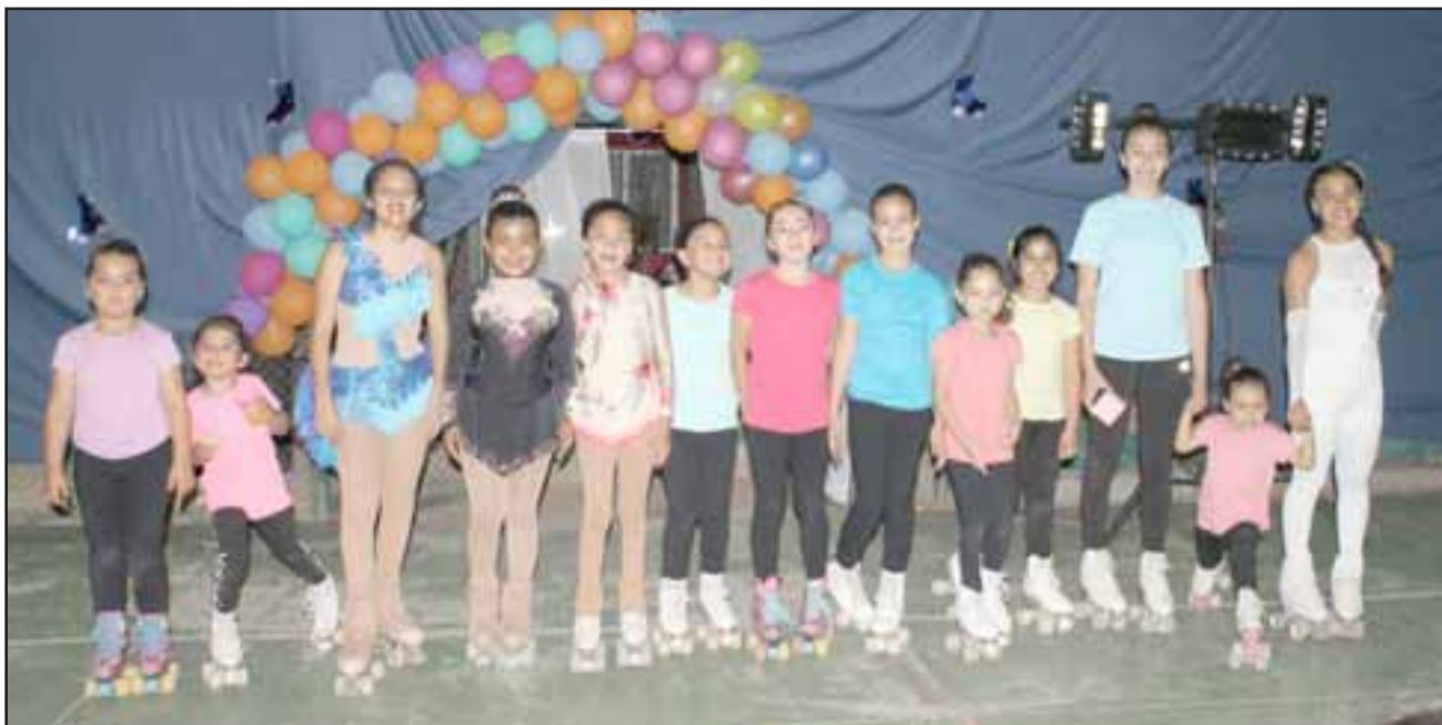
En la muestra participaron en total 13 patinadoras, nueve de ellas pertenecientes al club y cuatro que fueron invitadas.

El club lleva trabajando tres meses y esperan para el mes de mayo de 2020 hacer una muestra grande, expo-