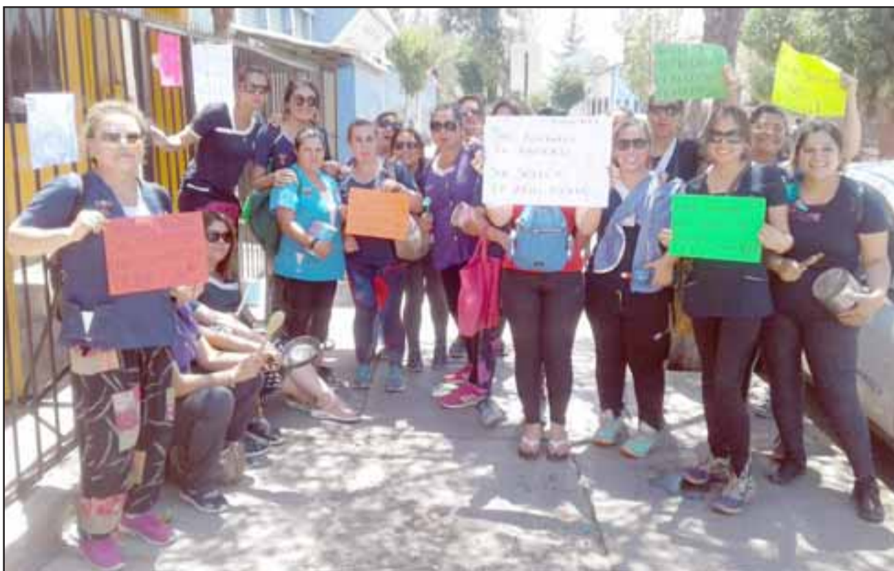
Las educadoras de párvulos del jardín infantil 'El Rincón de los Angelitos' realizaron una protesta ayer frente a las oficinas de la DAEM.

- Nosotros como jardín somos cerca de 23 funcionarias que estamos lamentablemente sin plata ni aguinaldo, que tuvimos que endeudarnos con nuestras tarjetas de crédito para po-