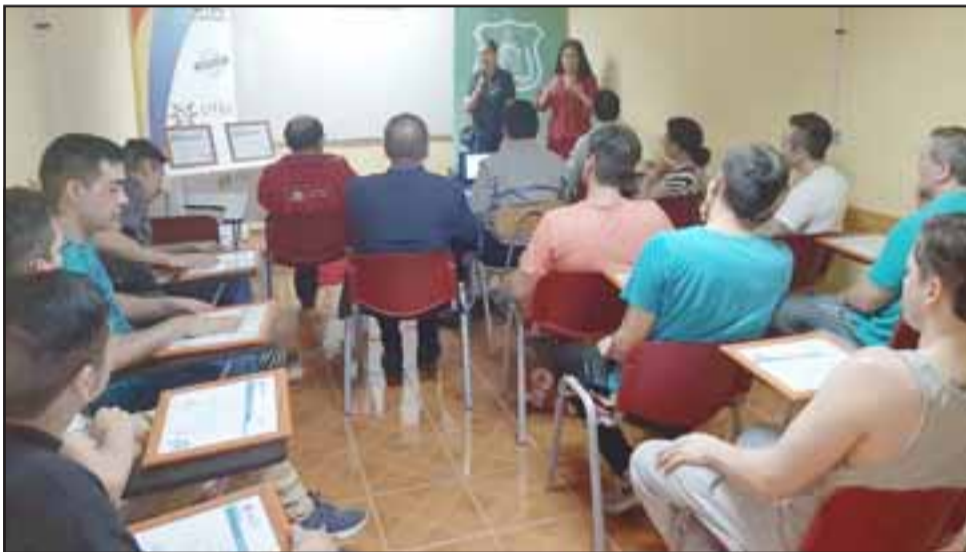
La ceremonia de certificación se efectuó el pasado viernes en la unidad penal del Aconcagua, donde 15 internos recibieron su certificado que los acredita como restauradores.

Durante el año también se efectuó otra capacitación, como lo fue la de higiene y manipulación en alimentos, en la que participaron 20 privados de libertad.