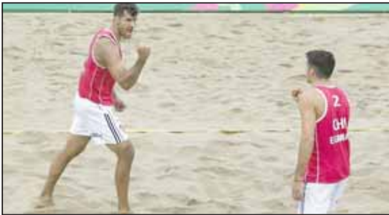
Los primos Grimalt se consagraron como monarcas Panamericanos en el voleibol playa.

Unión San Felipe repitió el mismo derrotero del año anterior, al tener un comienzo simplemen-