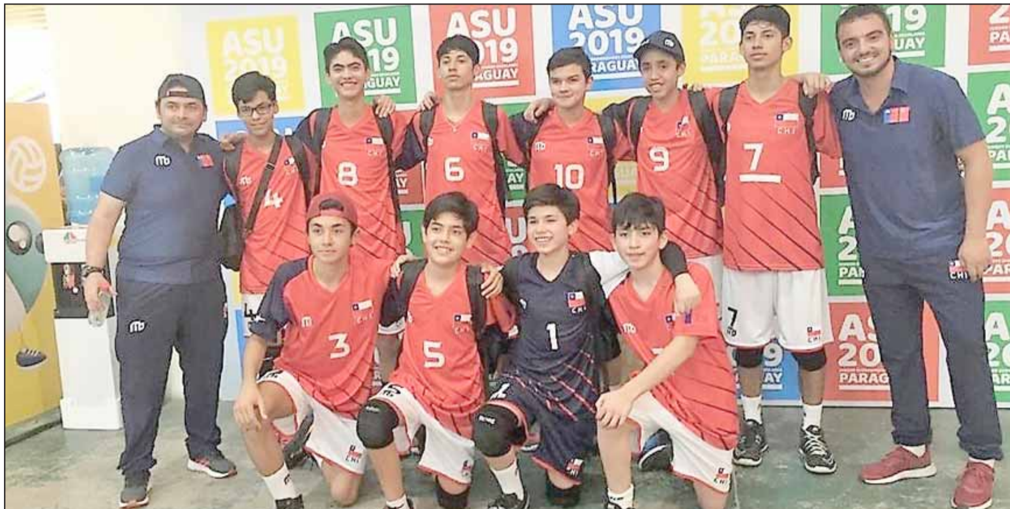
El seleccionado del IAC hizo historia al ganar el Nacional Escolar y posteriormente ser tercero en el Sudamericano de Paraguay.