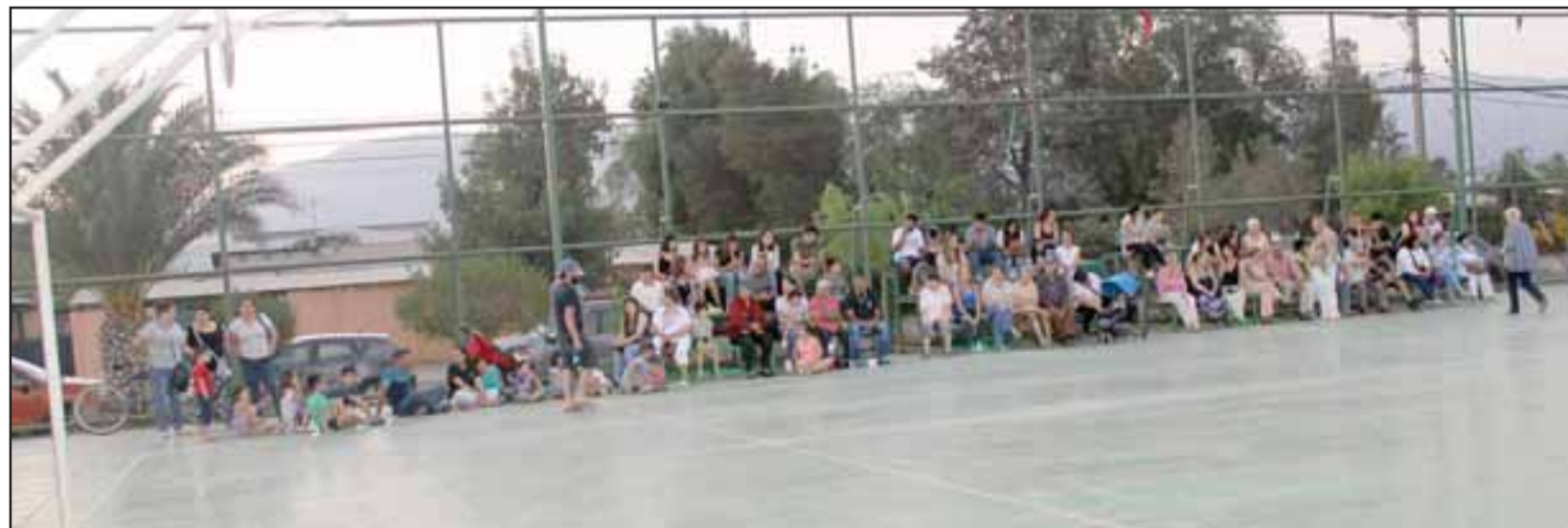
Los vecinos que siempre han apoyado el funcionamiento del club de patinaje disfrutaron felices del espectáculo.