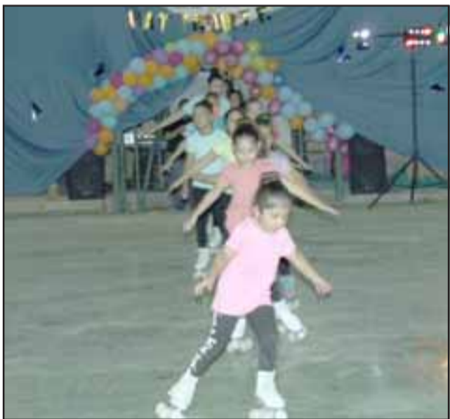
Las alumnas mostraron toda su destreza adquirida durante estos meses de práctica.

tinarte' funciona los días viernes desde las 19:00 a 21:00 horas, y los días sábado de 09:00 a 11:00 horas. El valor de la inscripción es de 25 mil pesos, pero el próximo año esperan tener proyectos, postularlos para que ese valor vaya bajando, porque entienden que tiene que ser al alcance de todos.