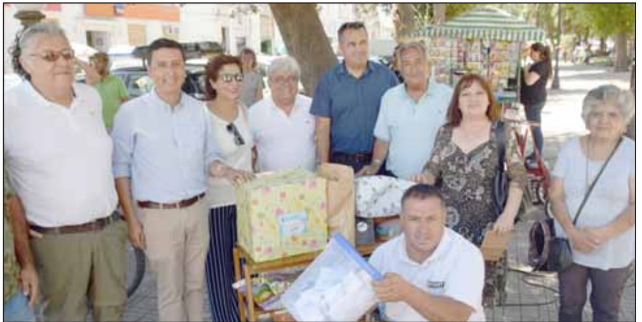
A BUSCAR TU PREMIO.- Al mediodía de ayer lunes se realizó el público sorteo de los cupones de clientes, cada uno compró en nuestro comercio local.