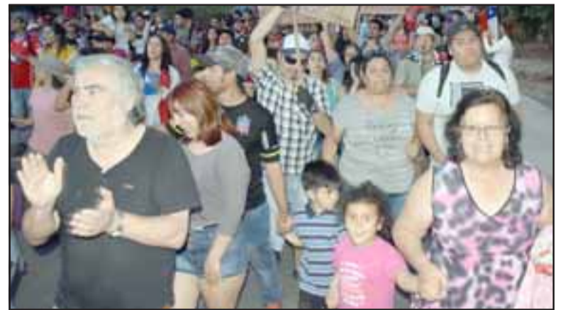
EL AÑO SE FUE.- También durante este año las Fuerzas Vivas del Valle de Aconcagua se hicieron sentir en cada rincón de las comunas. Aquí, una noche en Villa El Señorial.