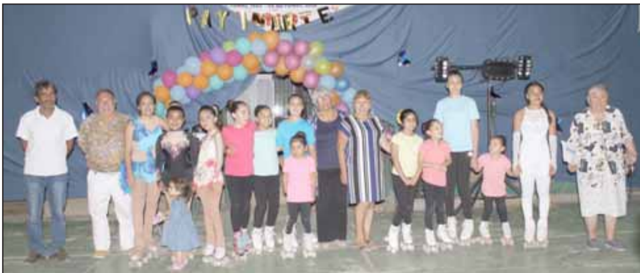
En la imagen las protagonistas de la muestra junto a la directiva del Club Santos.