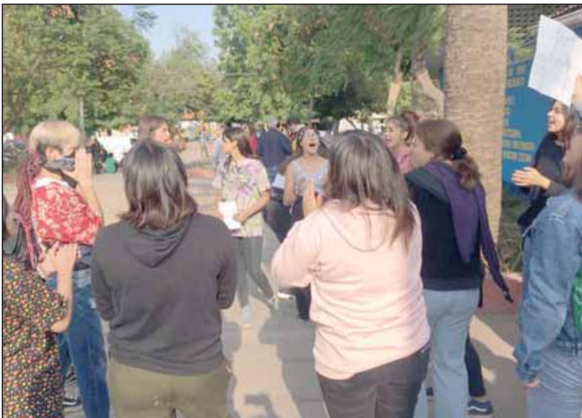
Algunas personas manifestándose pacíficamente en el liceo de niñas.