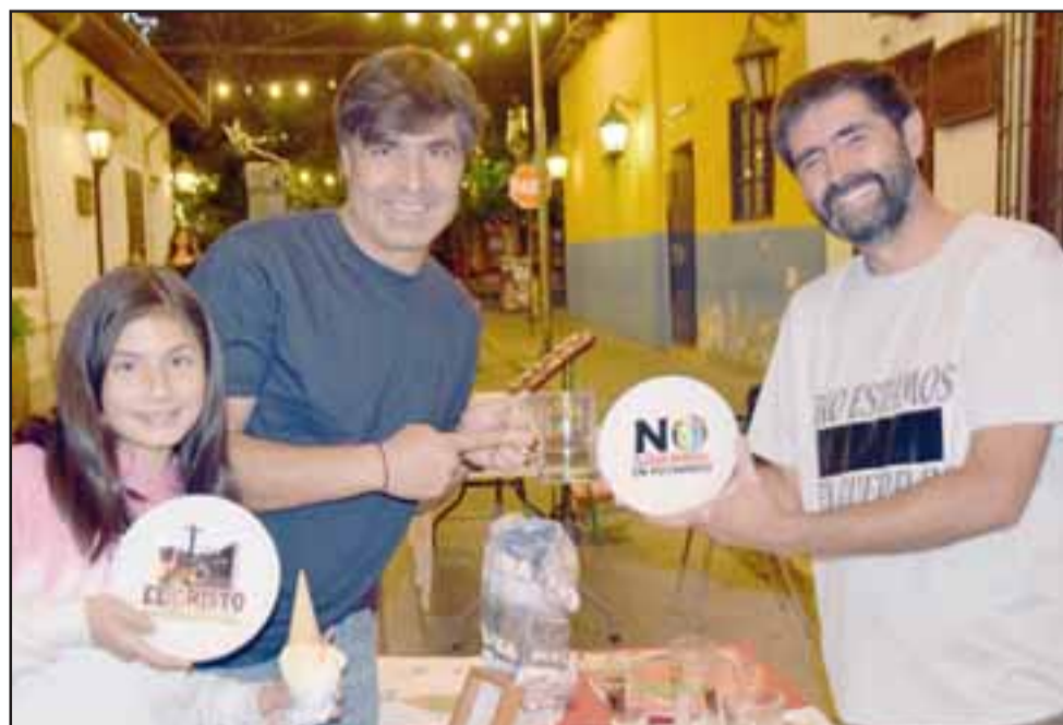
ARTESANÍA LOCAL.- Varias artesanías conmemorativas a los lugares populares de la comuna también se promocionan en platos de porcelana.