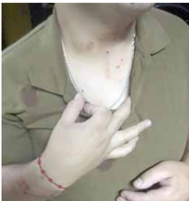
Los funcionarios policiales recibieron atención médica, siendo diagnosticadas sus lesiones de carácter leve.