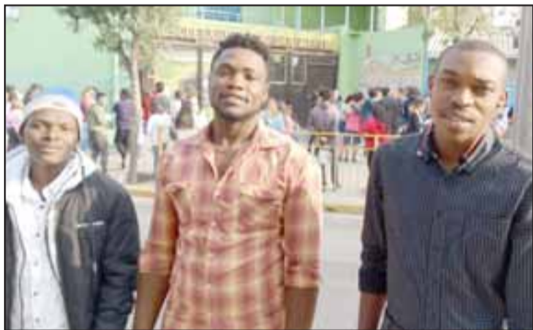
Tres inmigrantes haitianos también rindiendo la PSU.

Ayer en la tarde se rindió la prueba de Ciencias, hoy por la mañana la prueba de Matemáticas y en la tarde la prueba de Historia.