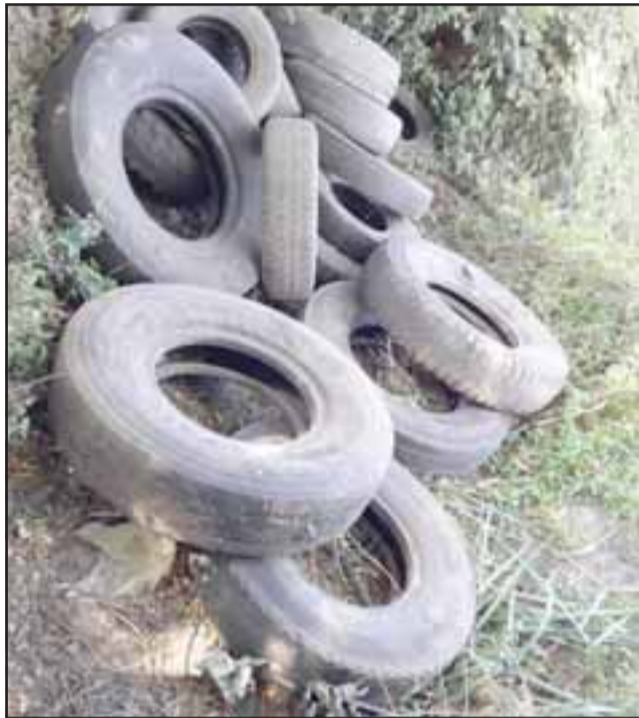
Una gran cantidad de neumáticos fueron decomisados por Carabineros de Llay Llay.