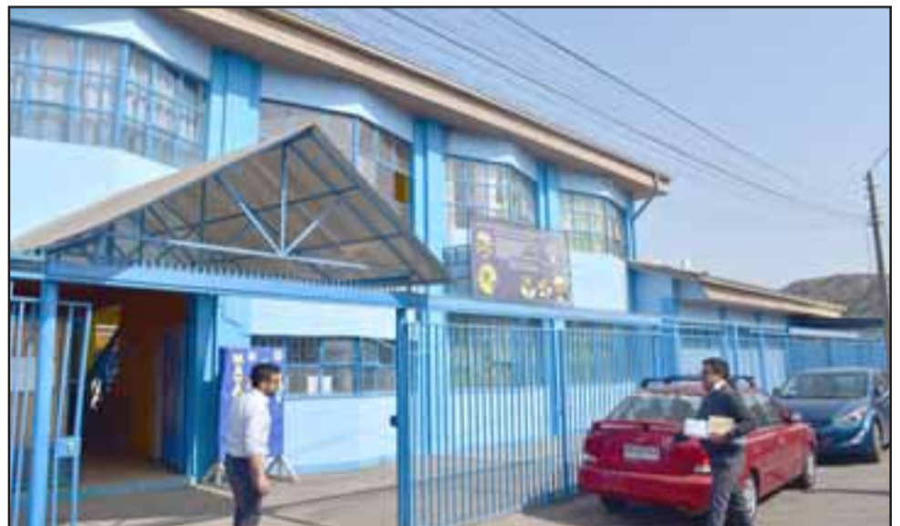
La Escuela Héroes de Iquique de la Población Juan Cortés mantenía una serie de problemas en su infraestructura debido al paso de los años.

continuo en patios e ingresos para mayor accesibilidad de personas con movilidad reducida; ventanas aluminio de termo panel, para así mantener aisladas las salas del calor y el frío, como también termo paneles solares de 300 litros.