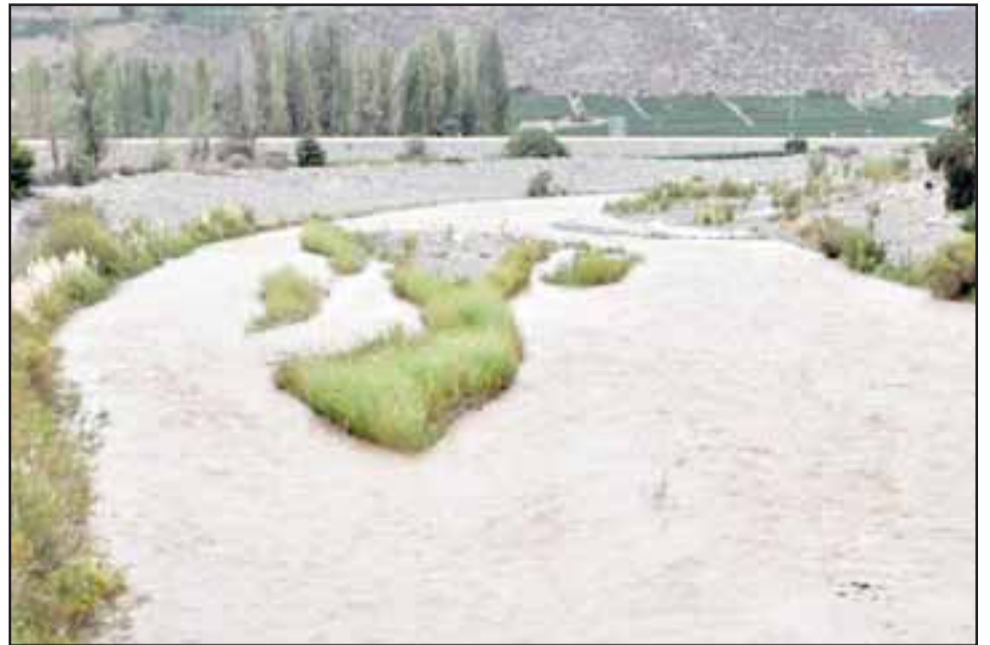
Esvál informó que durante la madrugada de este lunes, todos los sectores que se mantenían sin suministro de agua potable producto de la turbiedad extrema en el Río Aconcagua, quedaron normalizados y actualmente, la totalidad de la comuna presenta servicio continuo.

Lamentamos los efectos de estos cortes, pero estamos ante una situación de fuerza mayor. La extrema turbiedad no podía ser tratada por nuestra planta, y la decisión de suspender el servicio responde a la necesidad de proteger la infraestructura y evitar el embanque de nuestras instalaciones, lo que podría haber generado un corte por varios días en gran parte de la comuna. Valoramos la coordinación permanente con las autoridades durante el desarrollo de este evento y agradecemos especialmente la comprensión de los vecinos de la comuna.