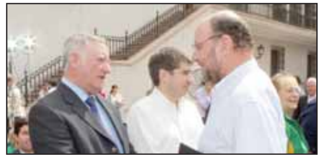
También el ministro de Obras Pública, Alfredo Moreno, pudo escuchar algunas de las inquietudes planteadas por el alcalde de Panquehue.

Agregó el ministro de Agricultura que como medidas por parte del gobierno, se destaca la declaración de zonas de emergencia agrícola, además se ha concretado una alianza con Indap para disponer de 30 mil millones de pesos, los que han sido destinados fundamentalmente al riego de la agricultura familiar campesina, forraje y alimento apí-