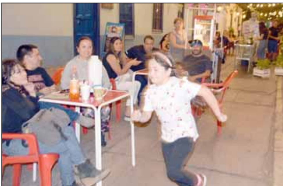
Venta de cabritas, bebidas naturales, bocadillos al gusto y cabritas corriendo, es el ambiente que estos comerciantes y sus clientes generan en Calle Comercio, los fines de semana hasta la medianoche.