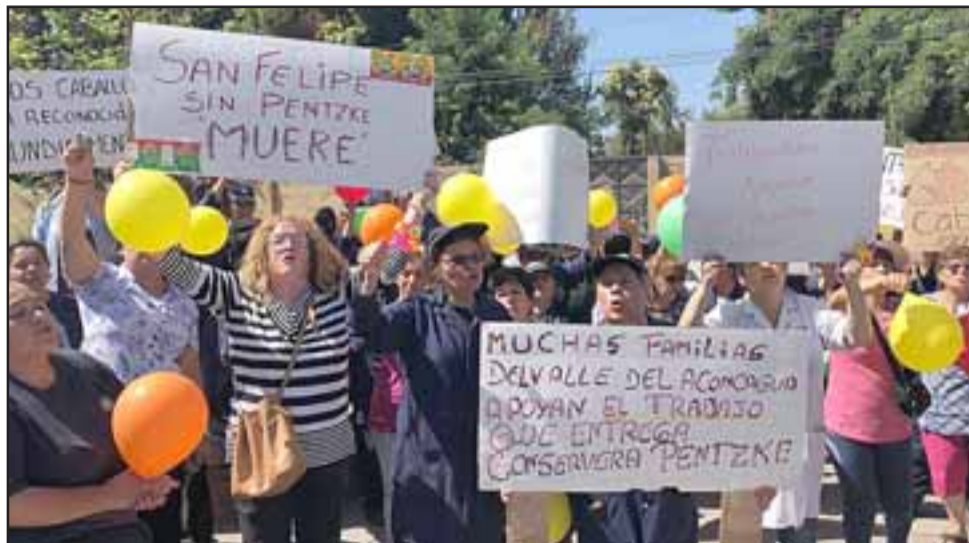
Trabajadores el día de la quiebra de la conservera Pentzke en el tribunal.

das sus cotizaciones, y aparte de eso lo que va a salud, entonces íbamos a tener una reunión con ellos, o sea yo los invité a una reunión para informarle que podían entablar acciones legales, pero no he podido conversar porque justamente empiezan a llegar abogados, la gente se entusiasma por escuchar a los abogados, pero no se interesa lo que uno le va a comentar, e incluso todavía no les puedo decir que hubo una reunión con la gente del gobierno interior, con el gobernador, la Seremi del Trabajo, que nos ofrecieron una ayuda y eso ha quedado en el aire, por supuesto facilitando los teléfonos de uno, con las que se puede conversar, porque hay mucha gente de temporada que al final como es siempre, gente que no quiere entender que uno está tratando de ayudar, porque aquí uno no gana nada con estar haciendo esto que uno hace de estar entrevistándose con las autoridades y buscando alguna solución para que nos apoyen. Entonces hay personas que no quieren escuchar y eso ocurrió en los últimos días, donde llegaron abogados de Santiago entregando un montón de información que por supuesto es válida, pero también la gente se entusiasma y quiere al tiro relacionarse con ellos sin escuchar a otras personas, personas que quizás también están tratando de ayudar. Yo he estado en contacto en este momento con gente de la diputada Marzán que corresponde a esta zona, parece que mañana me voy a reunir con el asesor de la diputada que también se ha