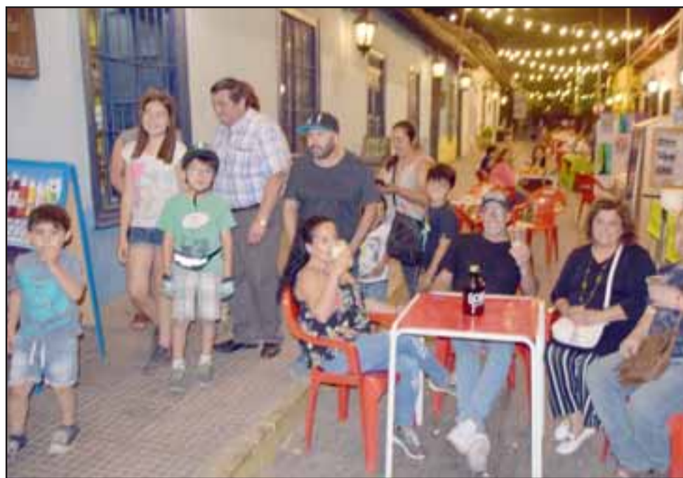
PUTAENDO VIVO.- Locales y visitantes, familias enteras han encontrado en esta modalidad de comercio putaendino el ambiente perfecto para disfrutar en familia de las novedosas promociones.