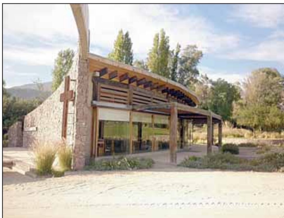
Frontis de la oficina del cementerio parque Valle de Auco.

- No, nada todavía, toda esa parte la está viendo Policía de Investigaciones que llegaron hoy día (ayer) en la mañana; se tomaron huellas dactilares, estuvo Carabineros aquí toda la noche, pero estaban encapucha-