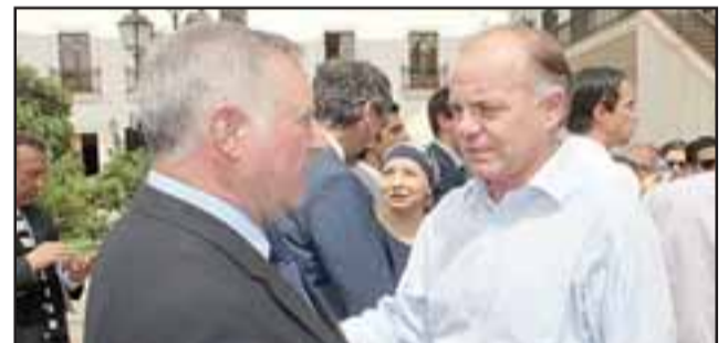
En la oportunidad el alcalde Luis Pradenas aprovechó de dialogar con el ministro de Agricultura, Antonio Walker.