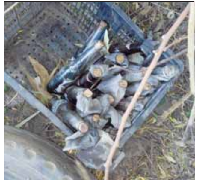
Un total de 15 bombas molotov fueron encontradas por la policía uniformada.