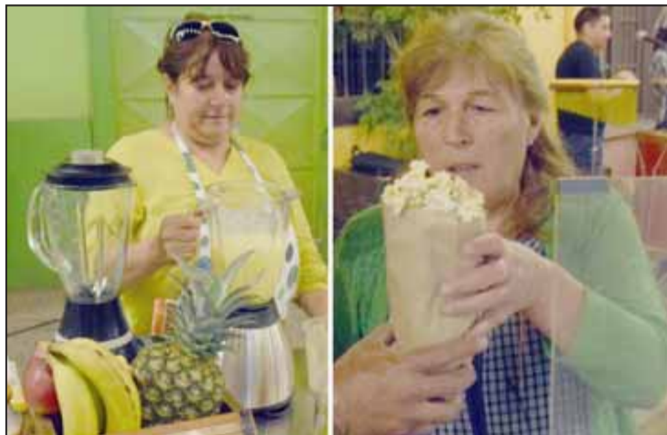
VEN A PUTAENDO.- Estas dos comerciantes se las ingenian para ofrecer las mejores cabritas de la comuna y los más exquisitos jugos naturales preparados en el lugar.