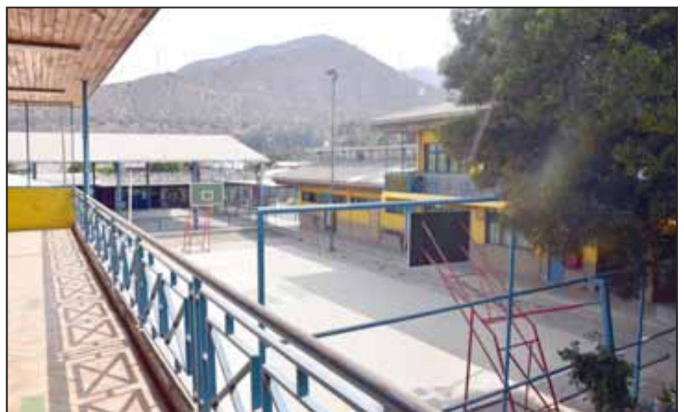
El proyecto contempla reponer cubiertas de asbesto cemento, cielos segundo nivel; remodelación de baños damas, varones y manipuladoras de alimentos; agua potable y alcantarillado; normalización red eléctrica; construcción drenes de aguas lluvias; baldosas podotáctiles, recarpeteo de multicancha y cierre de su lado norte; rampas para personas con movilidad reducida; ventanas aluminio de termo panel y termo paneles solares de 300 litros.