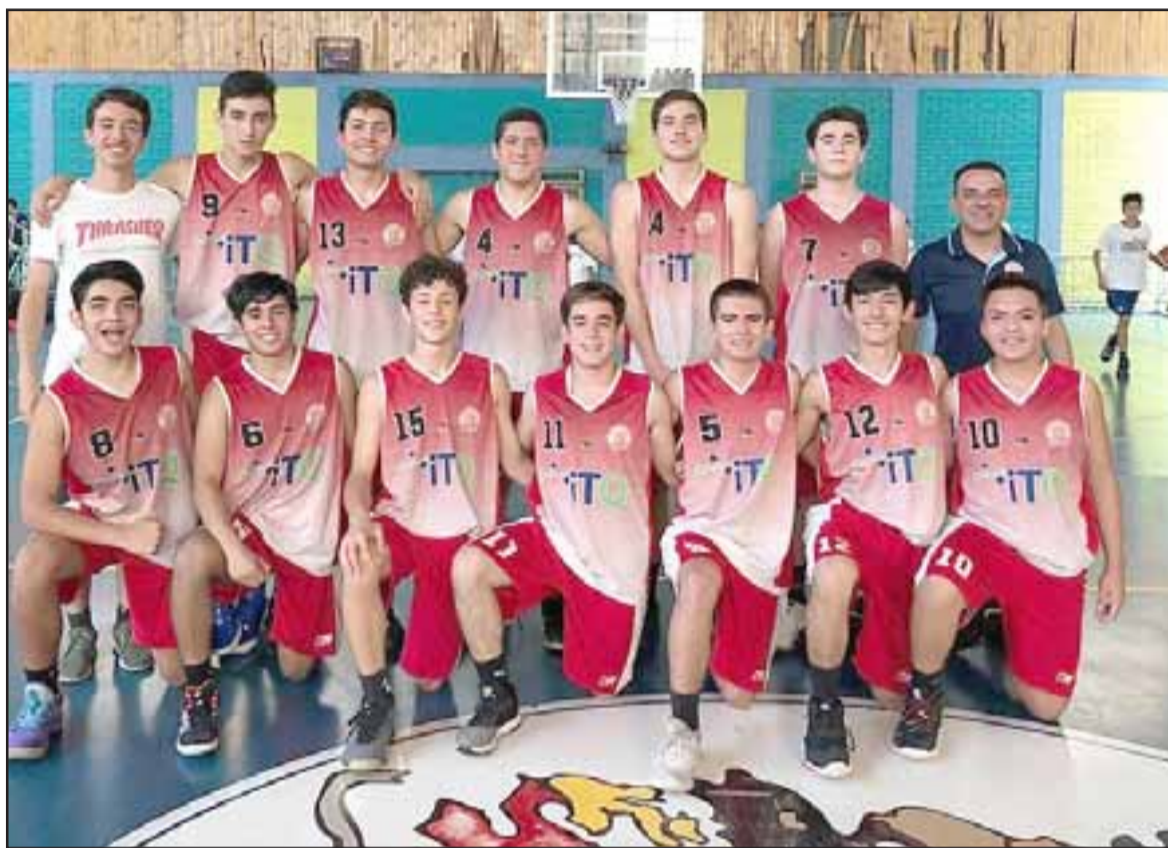
Este es uno de los equipos de San Felipe Basket que ayer viajó al sur del país.