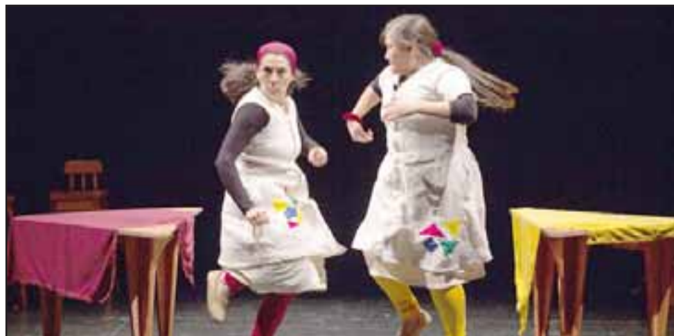
TEATRO DEL BUENO.- La obra teatral ' Vino por la causa ' se estará presentando este sábado a las 19:30 horas en el mismo recinto del CIEM Aconcagua. Valor de la entrada $2.000. (Mayores de 14 años)

VALOR DE LA ESCUELA ES DE $60.000 , y da derecho a participar de los talleres que a elección se escojan dentro de los que se están programando. Para más información al WhatsApp +56997032205 . Para Transferencias: Corporación CIEM Aconcagua, Rut: 72.793.300-K, Cuenta corriente 43004727 Banco Scotiabank. Correo: marielacanelo@gmail.com. Ó al correo extensionemdral@gmail.com Roberto González Short