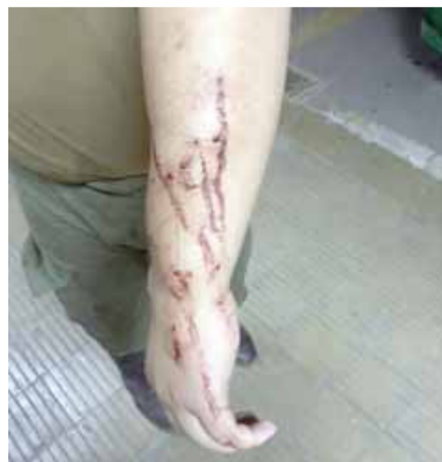
Un capitán y un cabo de Carabineros fueron las víctimas de este atentado.