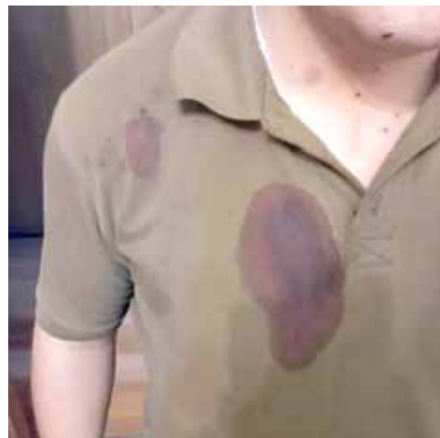
Dos funcionarios policiales resultaron heridos por el impacto de perdigones en Llay Llay.