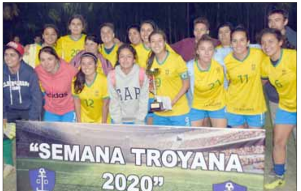
LAS SUBCAMPEONAS.- Aquí tenemos a las poderosas de Deportes Brasil, de Putaendo, quienes por poco se quedan con el título.