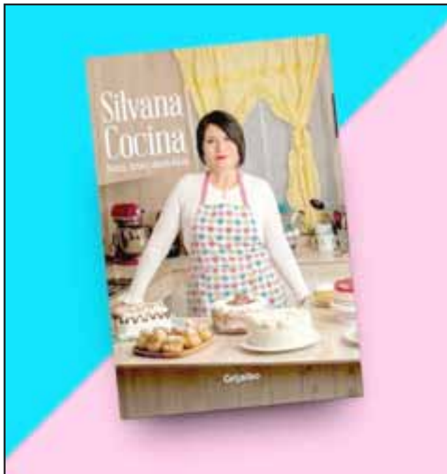
Este es su primer libro publicado, en octubre de este año saldrá su segunda obra escrita e ilustrada.

una persona que no tengo propios errores, cayéndome y levantándome», recalcó la joven 'Influencer digital'.