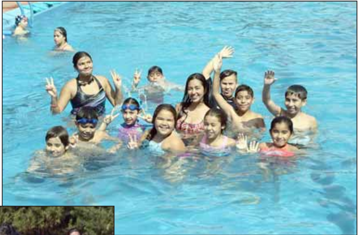
PATITOS AL AGUA. - Las cámaras de Diario El Trabajo captaron ayer a estos pequeñitos aprendiendo a nadar, los profesores en todo momento estuvieron al tanto de los pequeños.

«Los cursos de Natación dieron inicio este martes 7 de enero y culminan el 14 de febrero, se practican en ciclos de dos semanas, de martes a viernes, son ciclos de ocho clases las cuales tienen un valor de $10.000 que es muy bajo el precio comparado con las tarifas que tenemos alrededor, y tienen como fin precisamente permitir que los chicos que quieran aprender más de la natación y que quieran mejo-