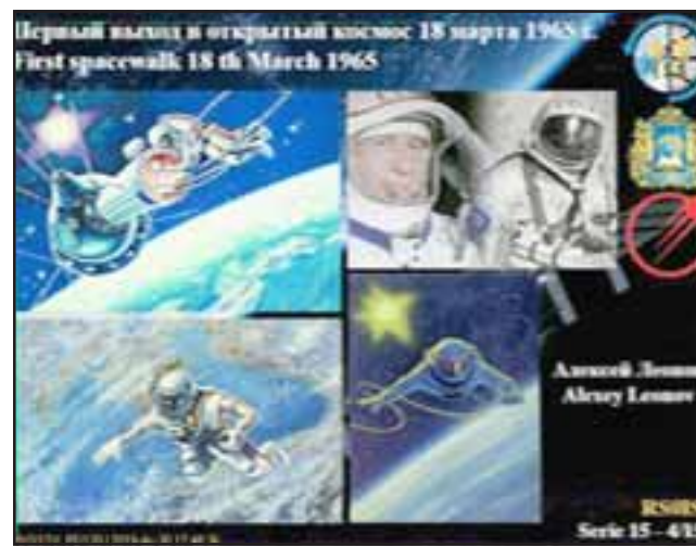
CERTIFICADAS. - Esta es una de las imágenes conmemorativas que desde el espacio recibieron los radioaficionados de Aconcagua.