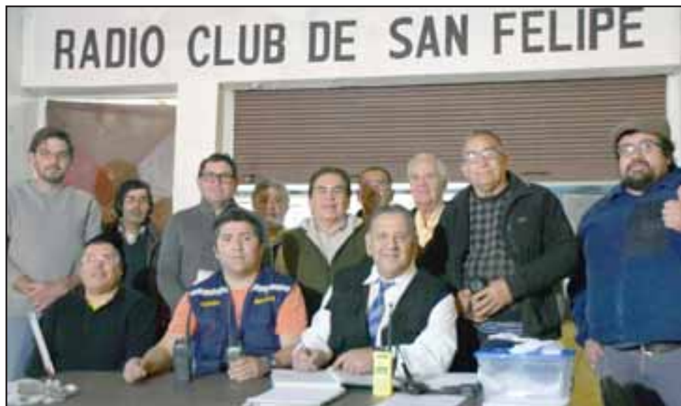
RADIO CLUB SAN FELIPE. - Ellos son el directorio y parte de los socios del Radio Club San Felipe, quienes están invitando a nuestros lectores a incursionar en el mundo de los radioaficionados.