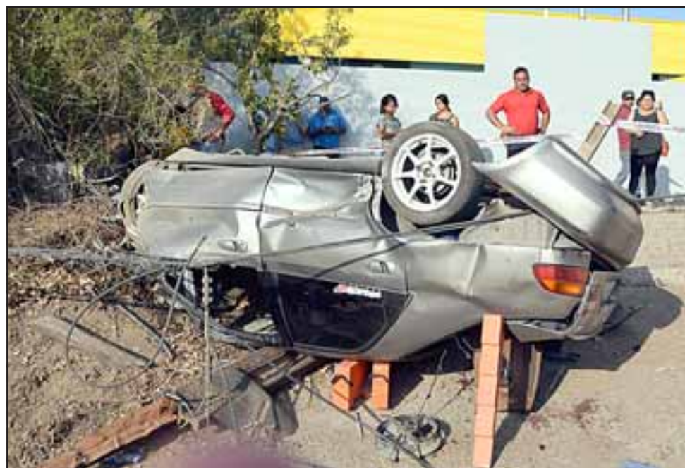
NO ERA SU HORA.- Milagrosamente las dos personas a bordo de este vehículo resultaron sólo con heridas, el escenario nos indica que pudo ser peor.

Con ayuda de Bomberos, Carabineros y vecinos: