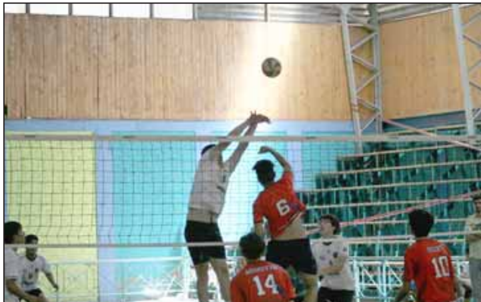
El gimnasio del ex Liceo de Hombres es uno de los recintos que alberga la Copa de Verano organizada por el club Unión Volley.

U17: varones: IAC, Unión Volley, La Pintana, IMV, DPA Valparaíso