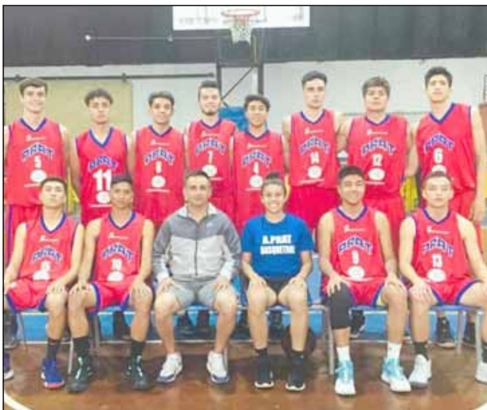
Esta tarde se producirá el esperado debut del Prat en el Domani 2020.

El partido que levantará el telón en el Domani está programado para las cinco de la tarde en el gimnasio del Stadio Italiano, ubicado en la comuna de Las Condes.