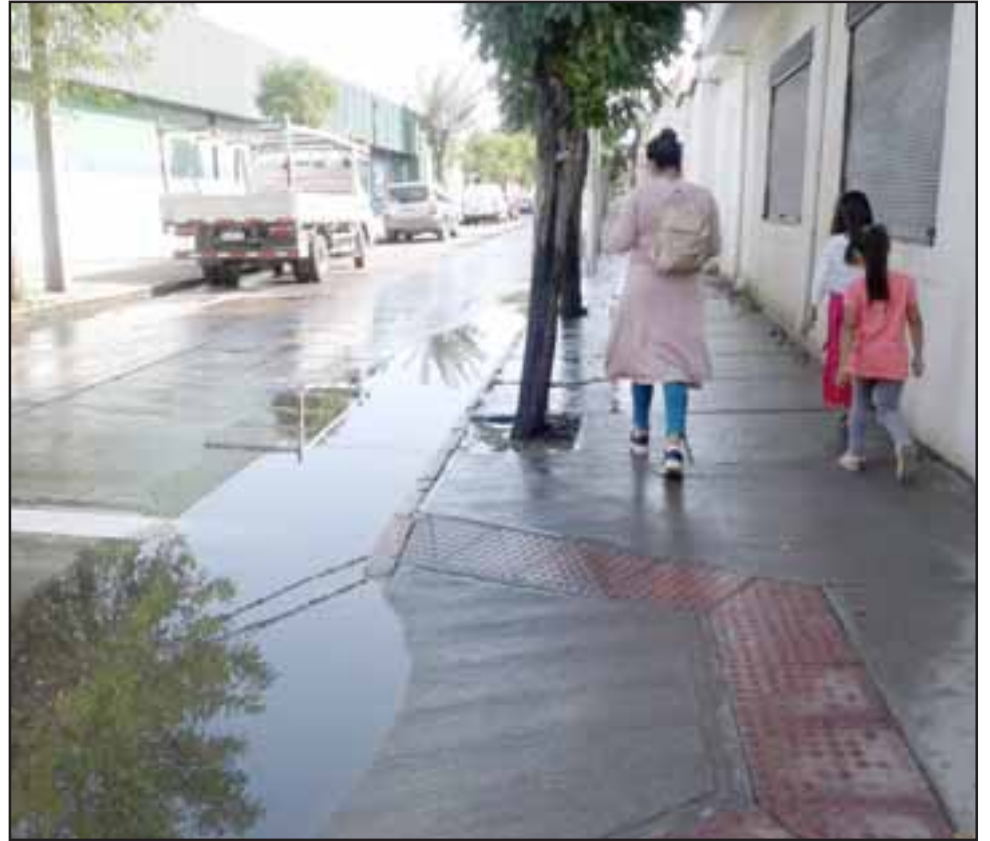
En la imagen se aprecia que el sifón está tapado por envases plásticos que la gente arroja a los canales.

Reiteramos este problema se da en calle Portus llegando a la Avenida O'Higgins.