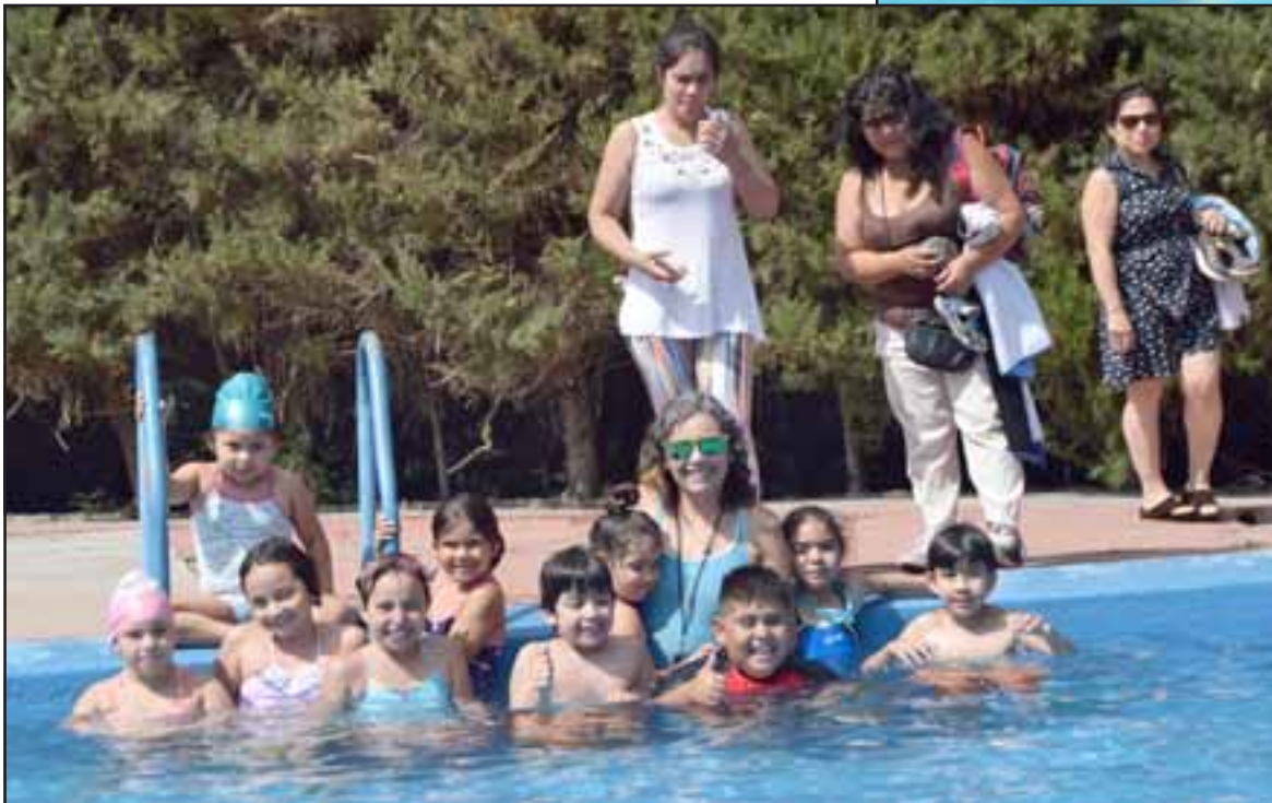
PIEDRAS INQUIETAS. - Los más chiquititos (Piedra) hacen su curso en una piscina hecha para su estatura y condición de destrezas.

rar en su estilo o aquellos que están en la categoría Piedra que son los no saben nadar absolutamente puedan de alguna u otra manera en esos ciclos avanzar y lograr sus metas deportivas y poder nadar de una mejor manera», dijo Peña.