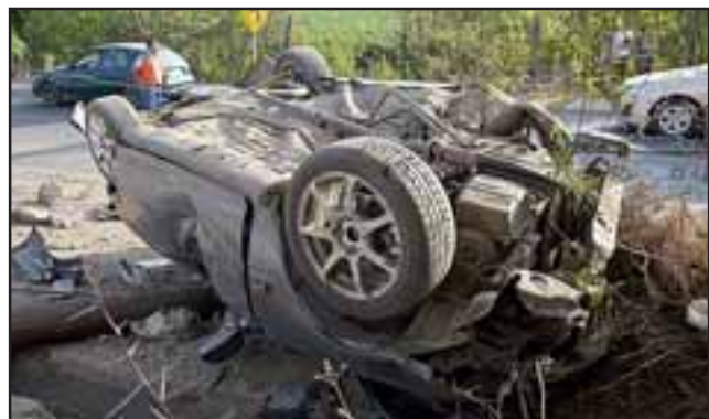
ESPECTACULAR.- Debajo del vehículo se puede apreciar el poste arrancado de cuajo de su lugar.