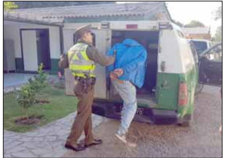
El sujeto fue capturado por Carabineros por el delito de robo en lugar habitado en la comuna de Llay Llay. (Fotografía Referencial).