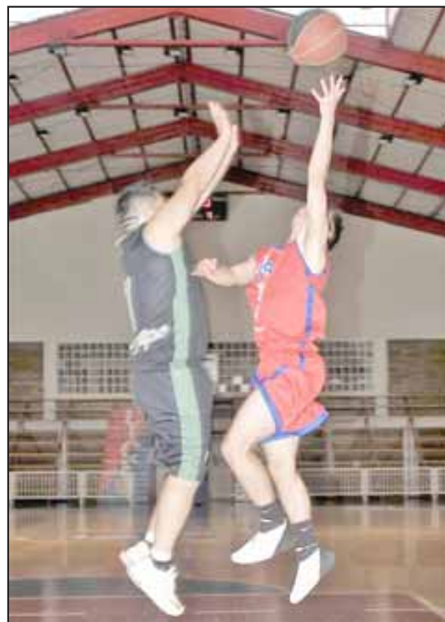
Los pratinos tuvieron intensos partidos de preparación para llegar bien al principal torneo cestero del país