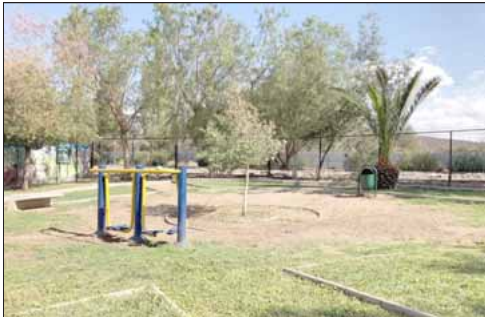
El proyecto permitió recuperar una plazoleta y otras áreas deterioradas con el paso del tiempo, pudiendo instalar un sistema automatizado de riego tecnificado gracias al aporte de la sanitaria.

ma automatizado de riego tecnificado, aportando al cuidado y el uso eficiente del agua, dada la sequía extrema que afecta a la zona. La iniciativa beneficiará a unos 2.500 vecinos del sector.