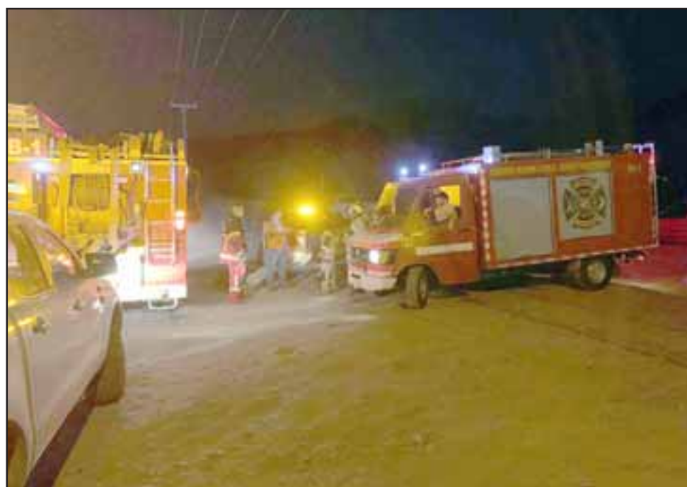
En horas de la noche de este martes se inició una intensa búsqueda de un menor de 8 años de edad que se extravió en la comuna de Santa María, debiendo concurrir personal de Bomberos y Carabineros.

Al lugar concurrió personal de Carabineros y dos