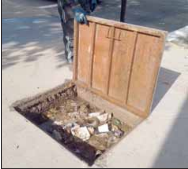
El agua acumulada en calle Portus se convierte en una grave molestia para transeúntes.