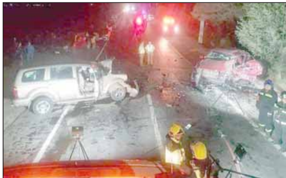
Las causas del accidente están siendo investigadas por parte de la SIAT de Carabineros de San Felipe.