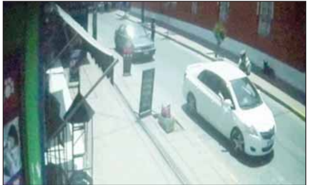
Este vídeo de las cámaras de seguridad municipales muestra el momento en que el sujeto fue fiscalizado por una funcionaria de Carabineros, quien al percatarse que este no mantenía licencia y los documentos del auto Peugeot modelo 306 estaban vencidos, iba a cursarle la infracción correspondiente.

Además, dio cuenta que el imputado mantiene condenas anteriores por Porte ilegal de arma de fuego, Recepción de especies, Lesiones menos graves en con-