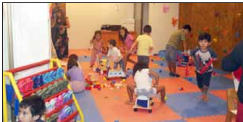
La Sala HEPI está ubicada al interior del Centro Comunitario, en Calle Camus #277.

La Sala HEPI está ubicada al interior del Centro Comunitario, en Calle Camus #277. El horario por el mes de enero es de lunes a jueves desde las 14:00 hasta las 18:00 horas. Los viernes se atenderá de 14:00 a 17:00 horas. El único requisito para asistir a la sala de juegos es que los niños vengán acompañados de su cuidador o adulto responsable.