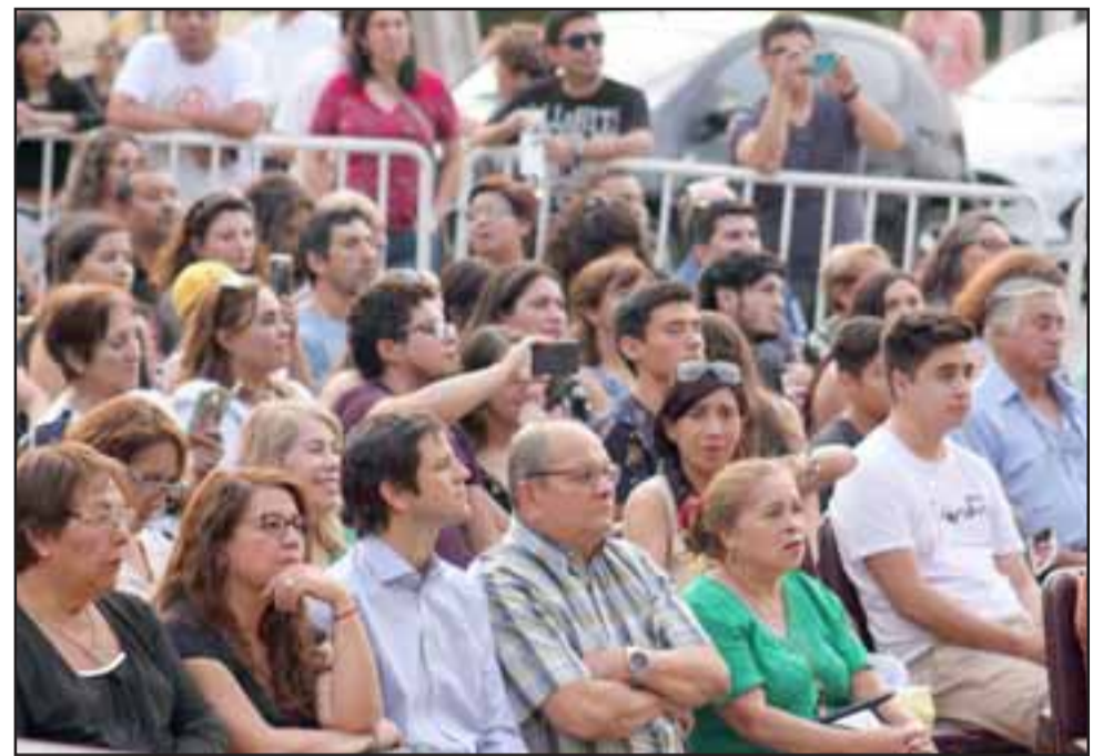
Los pequeños y jóvenes músicos cerraron con el exitoso concierto su trabajo del año 2019. El público premió con el aplauso.