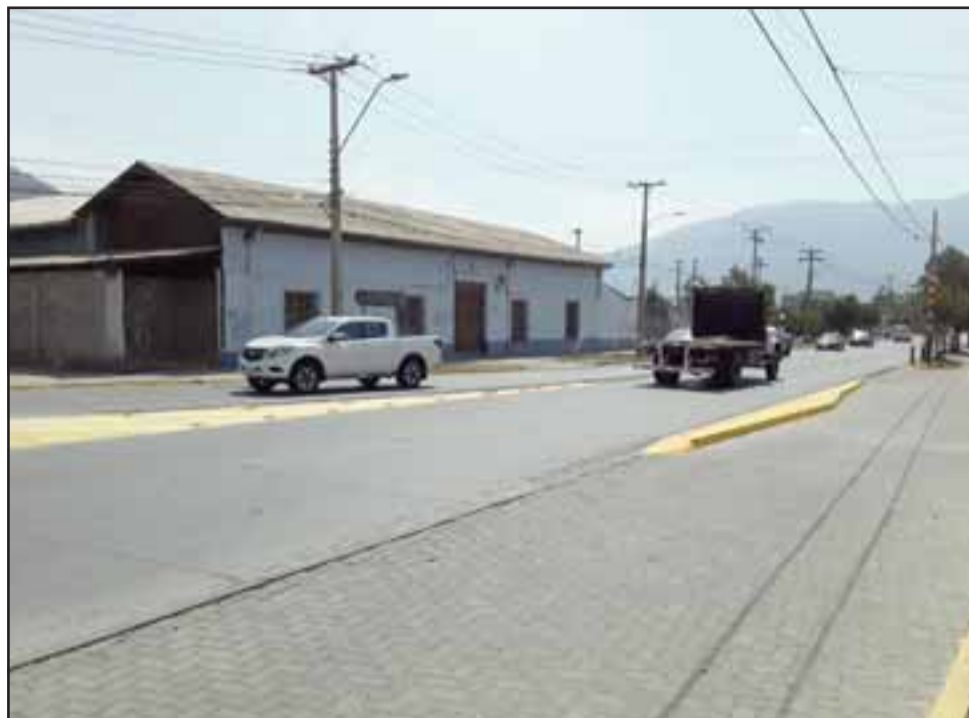
A los vecinos les llama la atención que esté pintado todo lo que son las demarcaciones.

- ¡Obvio!, porque a las finales si van a recarpetear hagan toda la pega completa, porque dicen algo y no lo hacen, entonces no le mientan a la gente de que van a