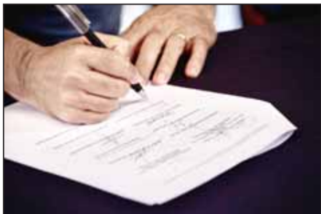
Esta iniciativa busca potenciar la cultura y el patrimonio local de las diez comunas que componen las provincias de Los Andes y San Felipe.

tura, en colaboración con los municipios de Los Andes, San Felipe, Santa María, Llay Llay, Putaendo, Catemu, San Esteban, Rinconada, Panquehue y Calle Larga.