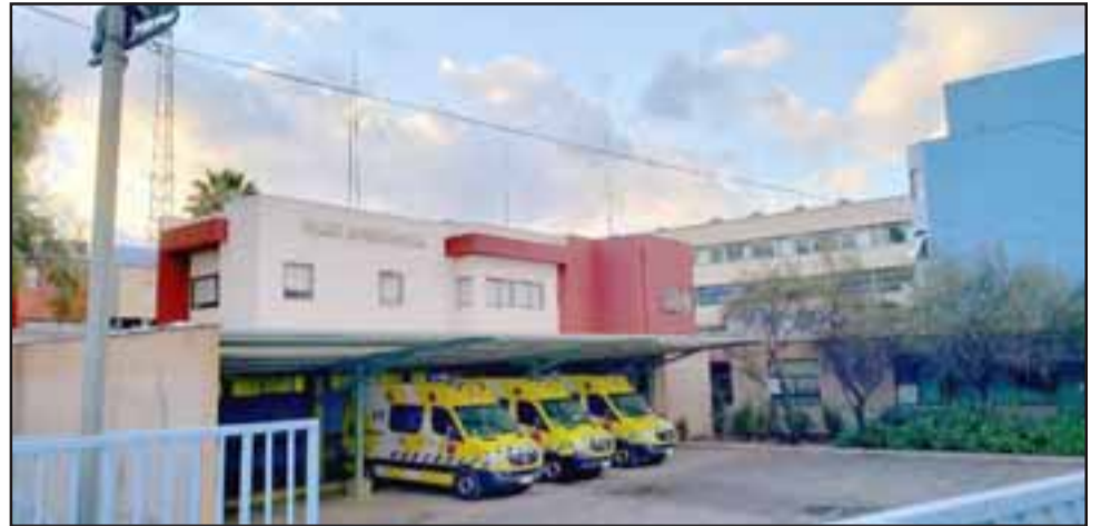
El afectado fue trasladado hasta el Servicio de Urgencias del Hospital San Camilo de San Felipe, la madrugada de este sábado.

La víctima no logró aportar mayores antecedentes del caso aparentemente por su estado etílico, debiendo ser derivado hasta el Servicio de Urgencias del Hospital San Camilo de San Felipe, con lesiones graves pero fuera de riesgo vital, según informó Carabineros. Pablo Salinas Saldías