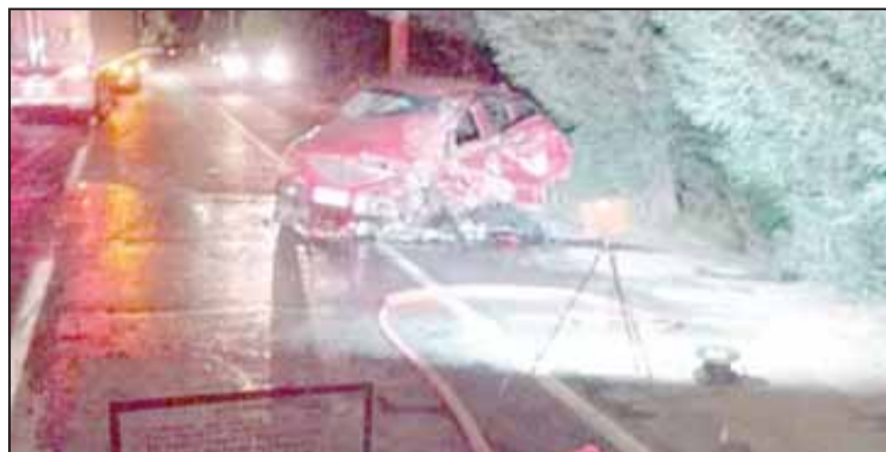
El grave accidente ocurrió en la ruta Troncal de Panquehue.