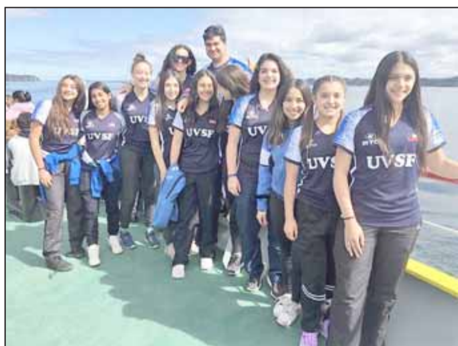
La delegación de Unión Volley pasando ayer el Canal de Chacao.