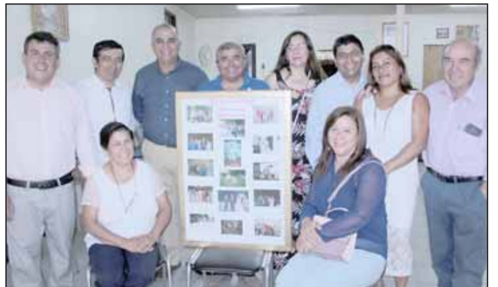
MUCHOS RECUERDOS. - Aquí vemos a los vecinos con este cuadro con fotos antiguas, cada una es un recuerdo de los vecinos.