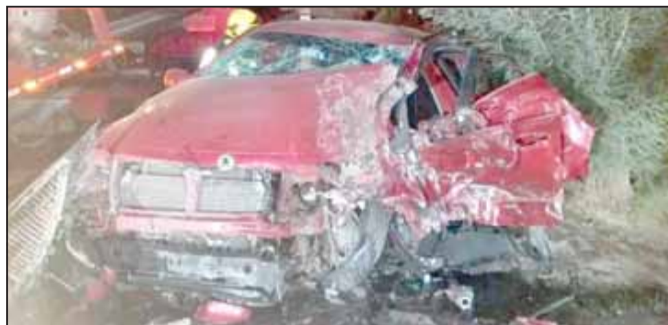
Personal de Bomberos rescató a los nueve tripulantes de ambos vehículos involucrados.