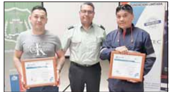
A lo largo del presente mes varios privados de libertad han sido certificados en oficios en distintas unidades penales de la región.

El curso contempló 75 horas pedagógicas, a las que se sumó una etapa práctica en el taller de confección de pallet. Cabe destacar que la OTEC además ha realizado cursos de capacitación en: corte y confección, restauración de muebles, administración de bodegas, electricidad básica domiciliar y refrigeración.