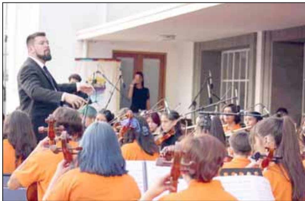
Con la interpretación de cada pieza musical los integrantes de Fosila demostraron lo aprendido en cada ensayo.

HABITACIÓN DISPONIBLE A partir del 8 de febrero. Alfombrado, baño, agua caliente, Netflix, internet, cocina, etc. $ 130.000.- +56 969181819