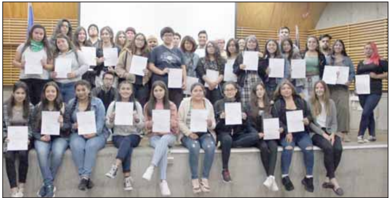
En total, 76 alumnos de la región ingresaron a la UPLA gracias a esta iniciativa, siendo 19 alumnos del Liceo Bicentenario de Llay Llay. scribir...

«Estamos muy felices con esta gran gestión que se logró, especialmente del Liceo Bicentenario, de su equipo técnico, donde fuimos parte como municipio, por cierto. Este gran convenio que permite que nues-