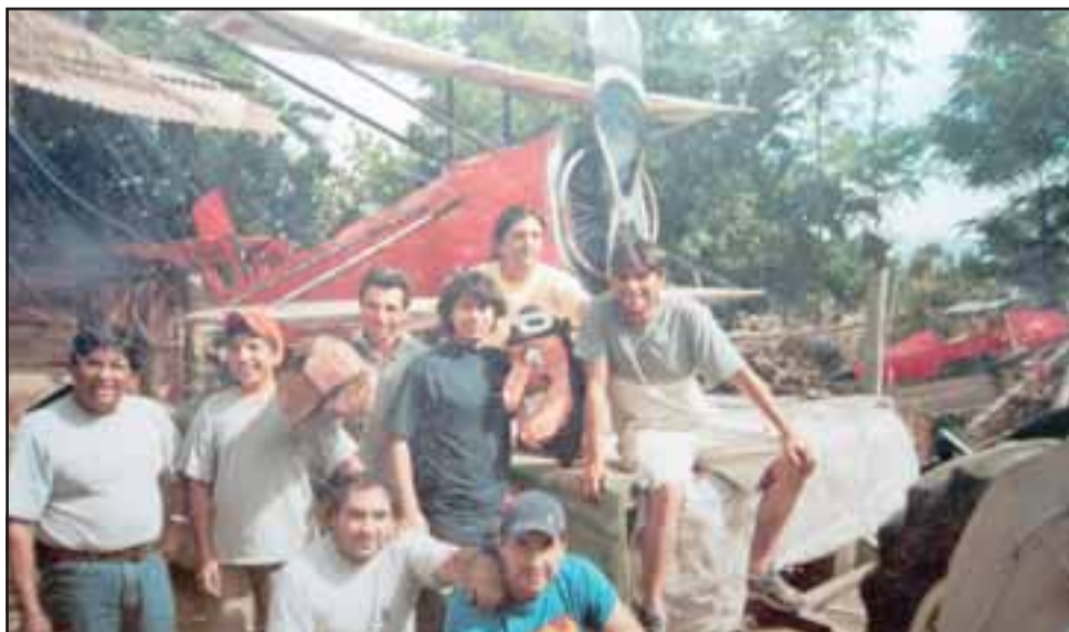
AQUELLOS TIEMPOS. - Este es un carro alegórico de los años ochentas, hace tiempo esta era una de las sedes comunitarias más activas de la comuna.