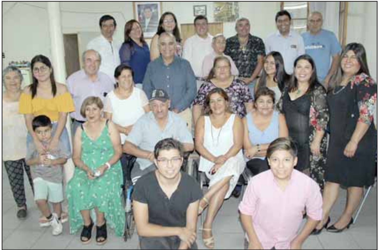
SEDE COMUNITARIA. - Aquí tenemos a vecinos y autoridades municipales buscando la manera de reactivar esta sede