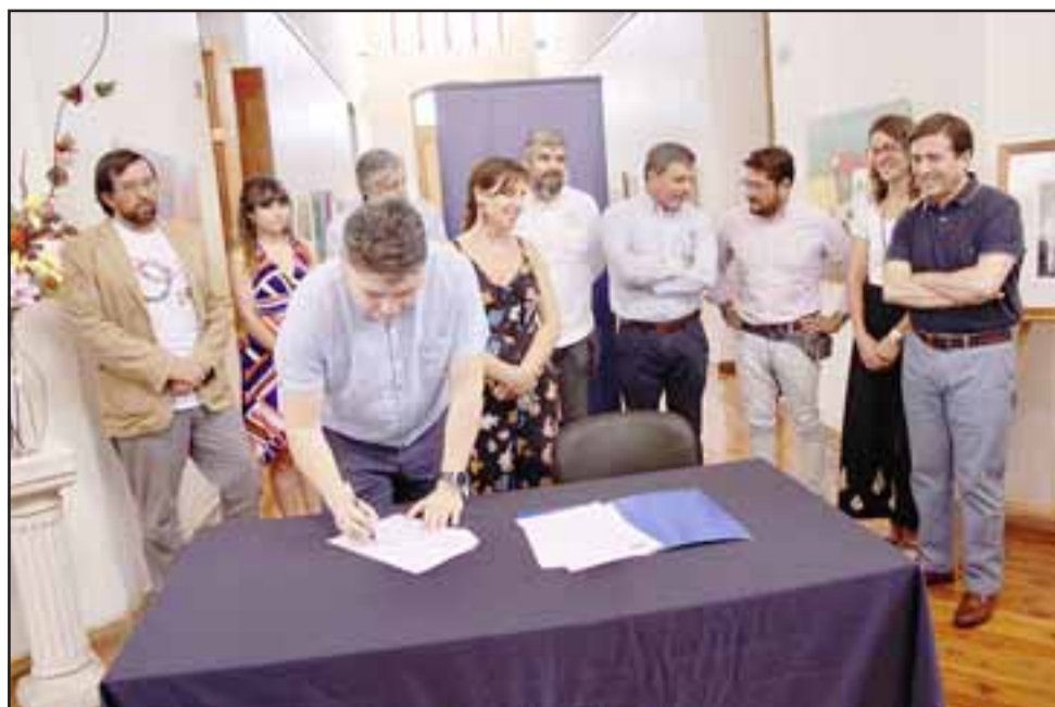
El objetivo de la iniciativa es fortalecer la oferta turística, poniendo en valor el patrimonio material e inmaterial para potenciar la asociatividad y sostenibilidad del turismo identitario.

El proyecto también contempla el desarrollo de un seminario sobre cultura, identidad y turismo territorial con la presencia de otros servicios y relatores, para fomentar el desarrollo de habilidades ligadas a la gestión de emprendimientos y normativas asociadas, propiciando un desarrollo sustentable y sostenible en el tiempo.