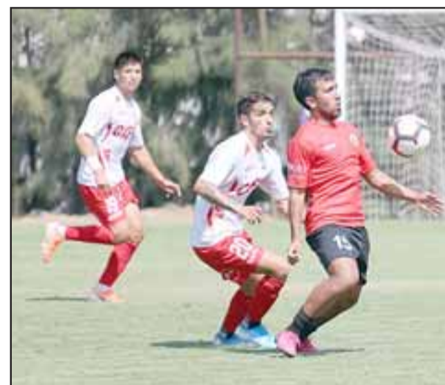
Los sanfelipeños tuvieron un juego de ensayo frente al potenciado cuadro de Lautaro de Buin.