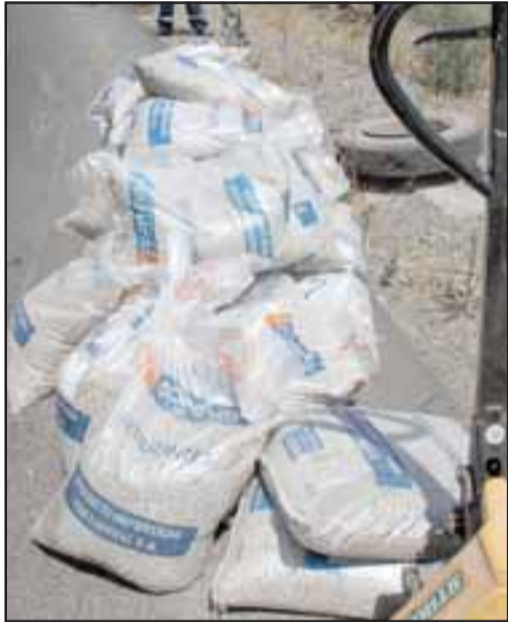
POCO PESO.- Esta era la única carga que transportaba el camión, sólo 1.000 kilos de abono.

SALVÓ ILESO.- Personal de Rescate se encargó de controlar la escena tras el vuelco, se hizo necesario para atender el accidente, mientras que una larga fila de autos esperó la habilitación de la ruta.