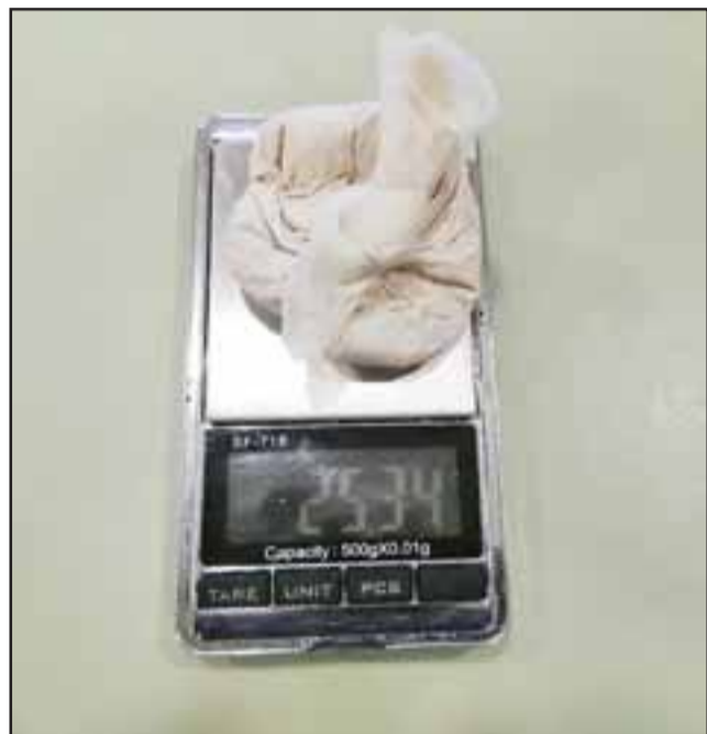
El abogado habría ingresado cantidad de pasta base de cocaína y marihuana hasta la Cárcel de San Felipe.