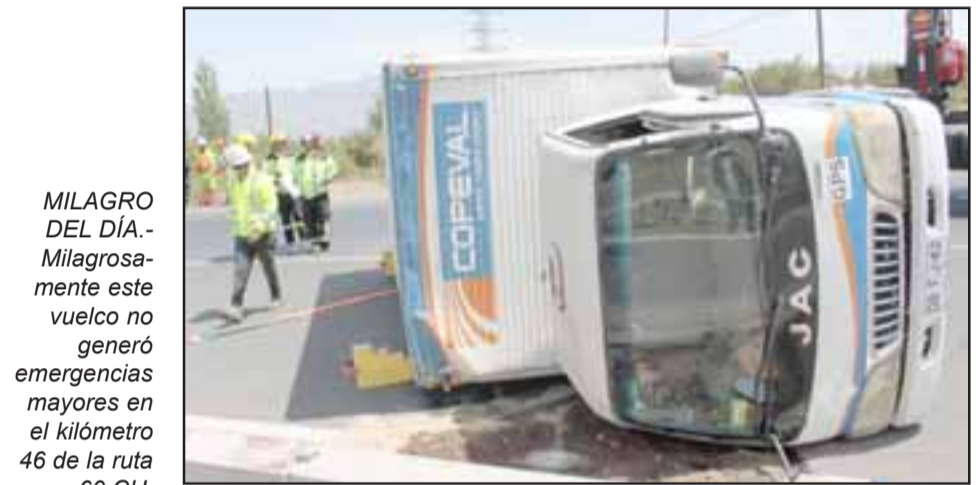
MILAGRO DEL DÍA.- Milagrosamente este vuelco no generó emergencias mayores en el kilómetro 46 de la ruta 60 CH.