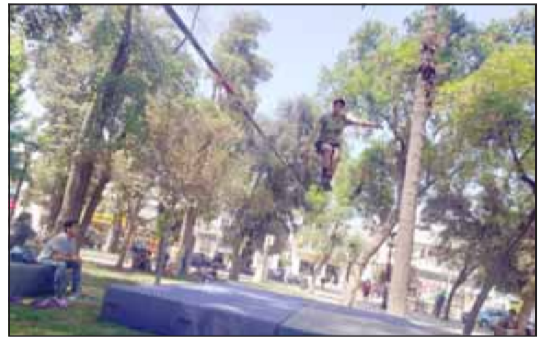
La jornada permitió acercar esta disciplina a la comunidad y brindó un espacio para que los deportistas demostraran sus destrezas.