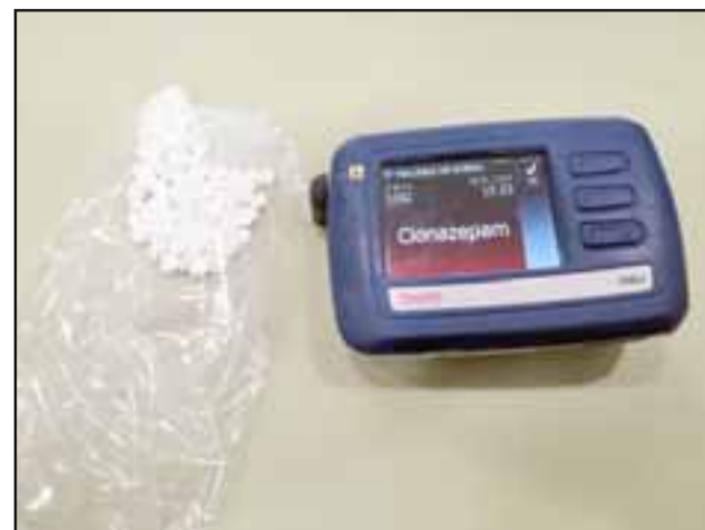
Más de cien dosis de Clonazepam fueron incautadas por Gendarmería la tarde de ayer martes.

Hasta el cierre de esta nota, el abogado se encon-