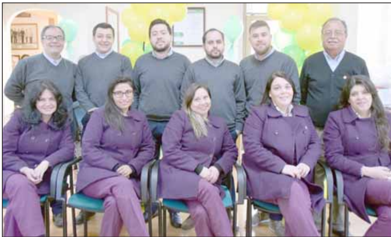
PERSONAL YA LISTO.- El personal administrativo de Sanfecoop ya está en los preparativos finales para esta jornada de trabajo especial en sus oficinas en San Felipe.

- Para ser miembro del Consejo de Administración y Junta de Vigilancia, el postulante deberá reunir los siguientes requisitos: Ser chileno; socio activo y tener más de 21 años de edad; no haber sido condenado por delito que merezca pena aflictiva, salvo que haya sido objeto de los beneficios de indulto o eliminación de antecedentes penales conforme a la ley; tener a lo menos dos años de antigüedad como socio de Sanfecoop; no haber incurrido en un atraso superior a 60 días corridos en el cumplimiento de cualquier obligación económica con nuestra cooperativa, dentro de los doce meses anteriores a la fecha de realización de la Junta General de Socios en que presente su postulación; que no se haya encontrado en proceso de cobranza judicial o prejudicial, dentro de los últimos doce meses con anterioridad a la fecha de realización de la Junta General de Socios en que presente su postulación; no haber sido condenado o hallarse actualmente formalizado por crimen o simple delito; tener buenos antecedentes comerciales y financieros,