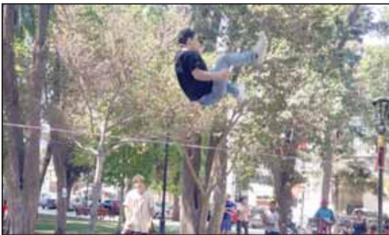
Diversas y complejas piruetas son las que realizan los practicantes de esta atractiva disciplina deportiva sobre una cinta tensa.