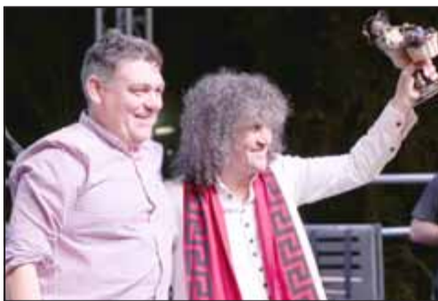
El Grupo Illapu recibió el aplauso y premiación de las autoridades por su actuación.

todo los años vengo y participo en esta trilla en la salida en la era. Es una de las pocas tradiciones que van quedando vigentes. Estoy muy contento, primero por poder participar, y segundo, de poder disfrutarla, pues de eso se trata, de disfrutar las tradiciones y mantenerlas vivas, pues cada año la trilla de Calle Larga crece. Todos los años tengo la suerte de correr la primera carrera y la última con el alcalde, lo que me hace sentir muy orgulloso».