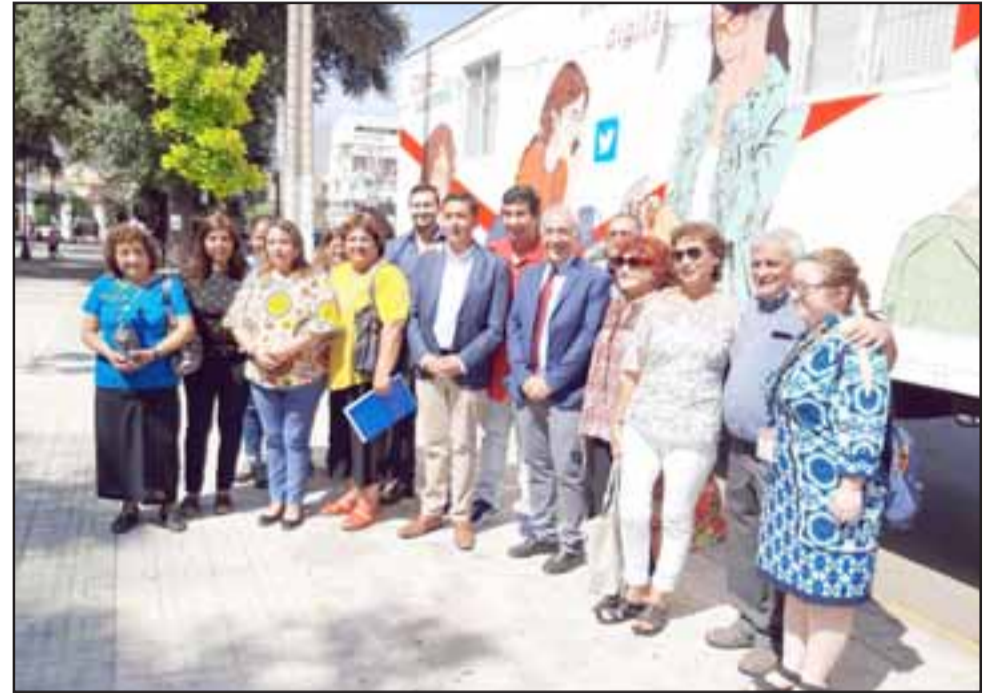
Los cursos se impartirán en el Aula Móvil ubicada en plena Plaza de Armas, por calle Salinas, que ya ha recorrido diversos puntos del país.

Los cursos se desarrollan en un aula adaptada para que 25 personas puedan realizar su aprendizaje con computadores y conexión a internet, en un ambiente confortable y seguro. Son intensivos, por lo que las alumnas solo deben disponer de dos días para obtener los conocimientos