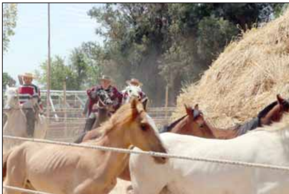
El día domingo fue el tradicional desfile de huasos, con más de 120 caballistas a caballo, se inició desde la Plaza de Armas hasta la Trilla, amenizando la folclorista Mirtha Iturra, para luego dar inicio a la inauguración oficial de la Trilla a Yegua Suelta.

La 44ª versión de la Fiesta Costumbrista Trilla a Yegua Suelta prosiguió con