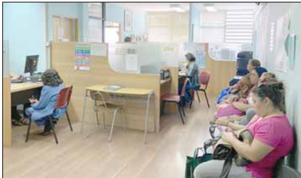
El Departamento de Rentas de la Municipalidad de San Felipe está atendiendo en horario continuado de 8 a 18 horas (el viernes hasta las 19) para que los contribuyentes cancelen sus respectivas patentes.

«Además, en caso de no pagar dentro del plazo legal, se genera automáticamente un interés para el contribuyente, por ese motivo, el llamado es que se acerquen a la brevedad a cancelar», comentó.