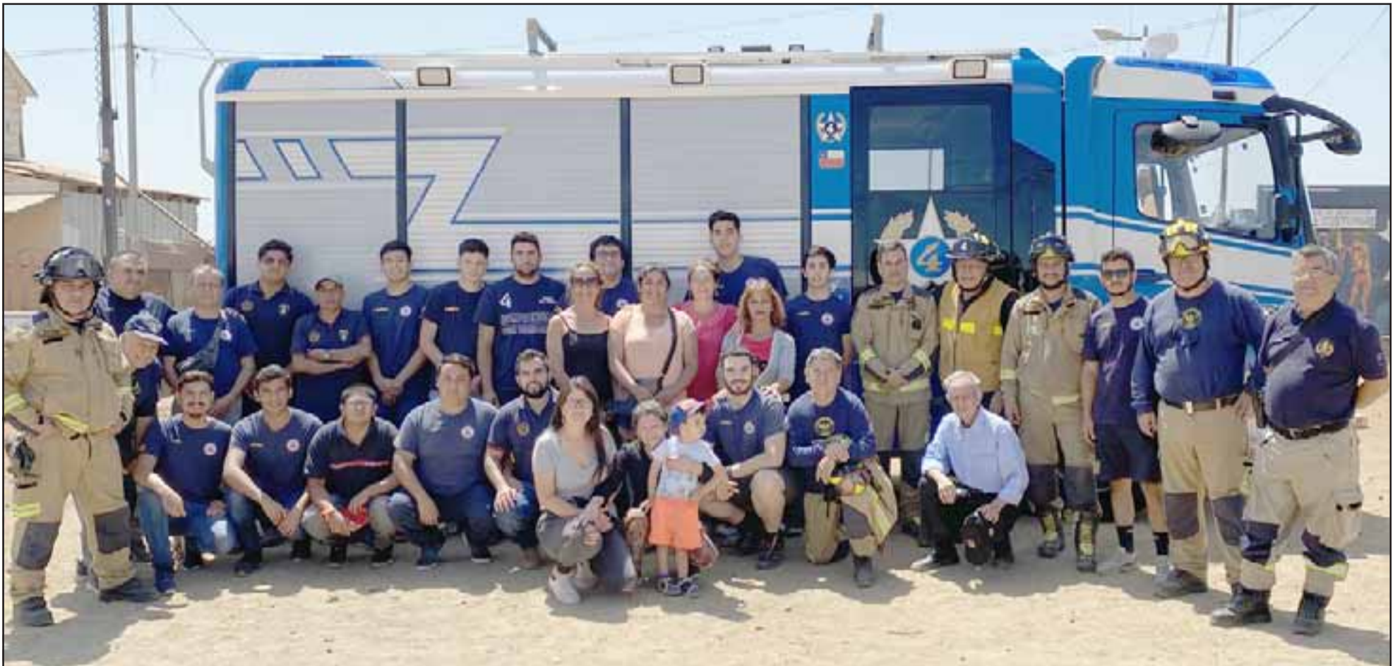
BOMBEROS EJEMPLARES. - Aquí vemos a la gran Familia Cuartina de Valparaíso y San Felipe, unida por un objetivo común al lado de los vecinos del cerro Rocuant: Ayudar.