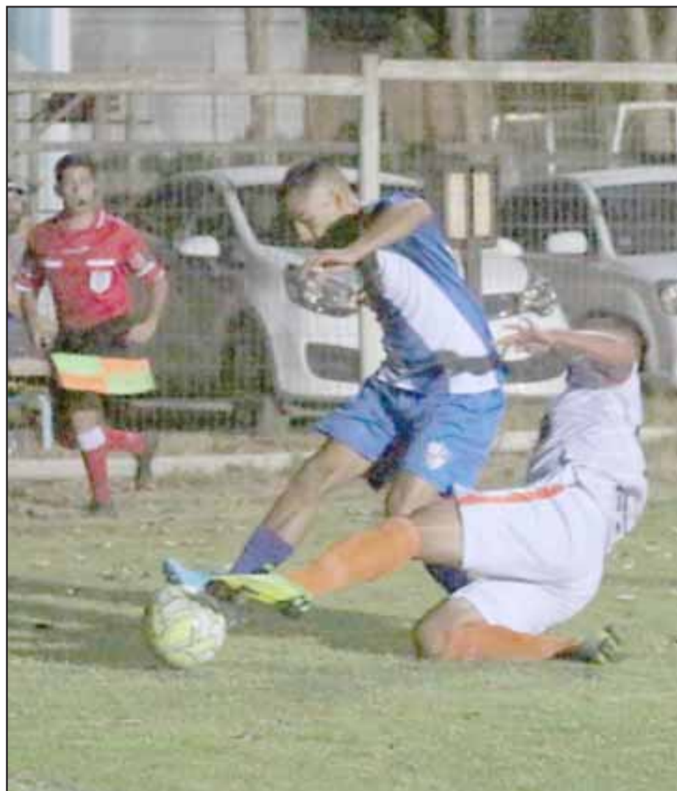
En la Semana Cachagüina los andinos defendieron al club Deportivo Parroquial de Zapallar.