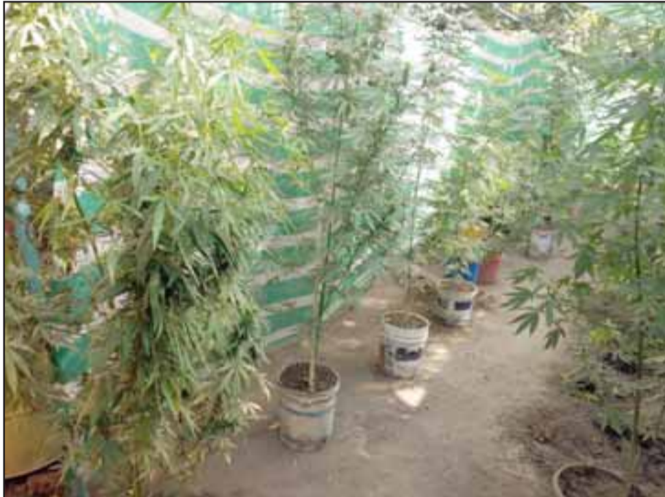
El cultivo de cannabis sativa se encontraba al interior del inmueble del imputado en la población Gabriel Mistral de Los Andes.

Para el imputado, por mantener un amplio prontuario delictual por delito de robo y receptación, el tribunal resolvió aplicar la cautelar de prisión preventiva por representar un peligro para la sociedad, mientras la fiscalía de Los Andes investiga el caso.