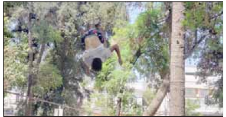
El pasado fin de semana se realizó el 'slackfest' en plena Plaza de Armas, actividad que cautivó la atención del público.

Asimismo, el profesional agregó que «hemos tratado de identificar todas las habilidades que tengan nuestros niños y jóvenes. Hoy estamos con el slack, en febrero realizaremos el torneo de calistenia. Entonces, hemos podido abrir espacios para todos y ellos se sienten parte de la comuna. Eso nos pone muy contentos», finalizó.