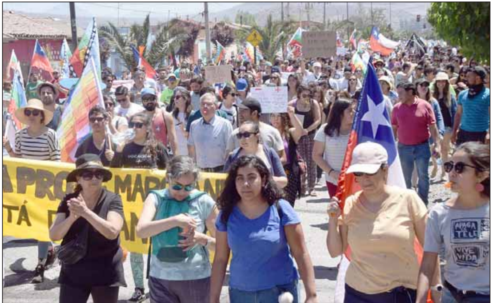
SIN VIOLENCIA.- Así serían las marchas que todos en San Felipe están dispuestos a apoyar y hasta participar.

- Yo creo definitivamente que las demandas sociales todo el mundo las comparte y nadie está ajeno a lo que la ciudadanía hoy día está reclamando, pero creo que el camino no es la violencia, más bien pienso que el camino es la conversación y el diálogo, es el trabajar es el aportar, yo creo que cuando se terminan los argumentos es cuando nace la