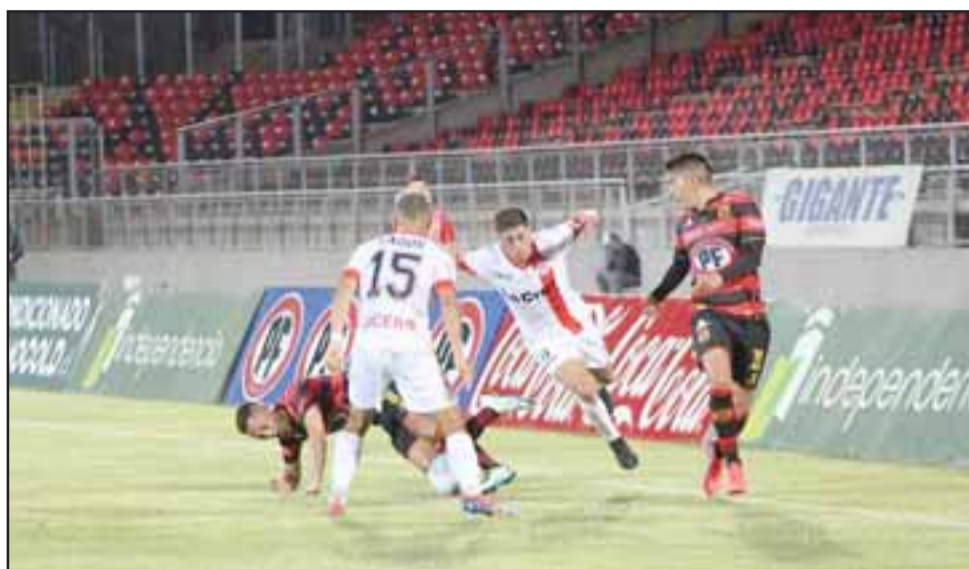
Talquinos y sanfelipeños repartieron puntos en el inicio del torneo.