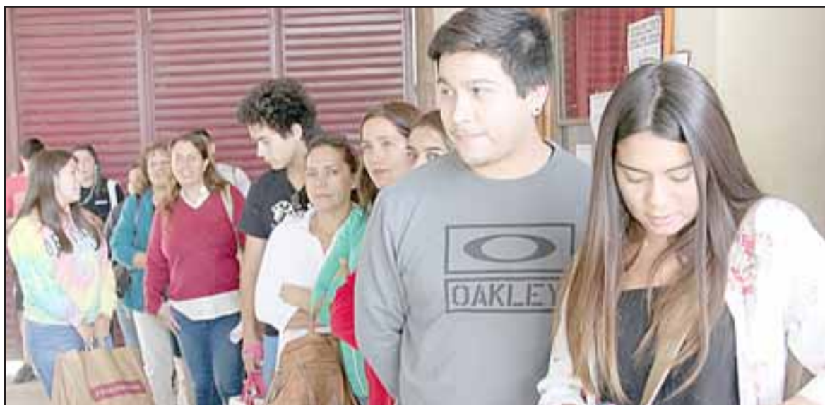
EL PROGRAMA FUNCIONA.- Ellos son estudiantes que el año pasado también recibieron sus pasajes para no sacrificar el cariño filial durante sus estudios.

«Invitamos a todos nuestros vecinos a postular a este productivo programa, y a desarrollar este trabajo desde de la página de la Municipalidad de San Felipe, encontrarán un Link para inscribirse, los requisitos son muy básicos: Tener Certificado de Matrícula, fotocopia del carnet de estudiante y la fotocopia del carnet del apoderado, además del Registro Social de Hogares para acreditar domicilio en la comuna, todos esos requisitos están en la página de la Municipalidad. El monto del programa es de $67 millones aprobado por Unanimidad en el Concejo Municipal, a propósi-