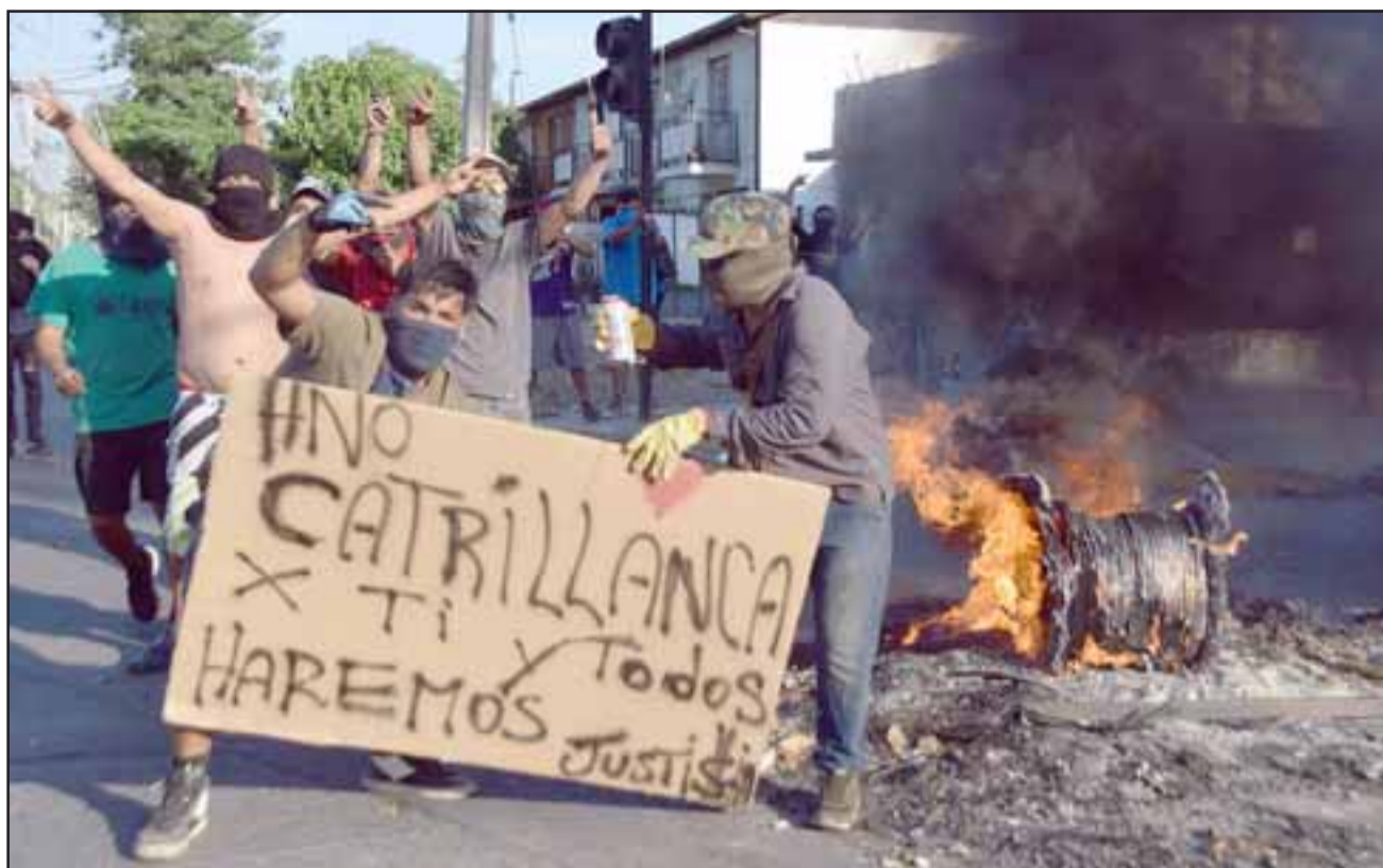
TRISTE RECUERDO.- Este tristemente célebre escenario es el que preocupa a todos en nuestra comuna.

cia chilena y particularmente a la convivencia en nuestra ciudad, yo estoy confiado en que el País ha tomado una decisión de iniciar un plebiscito para que la forma democrática se pueda resolver los problemas que puedan afectar un país o bien darle una conducción más democrática a los procesos de desarrollo de nuestro país. Si en marzo se inician nuevas jornadas de violencia el perjuicio indudablemente es enorme en nuestro valle y particularmente nuestra ciudad está viviendo una crisis muy compleja producto en primer lugar de la sequía, en segundo lugar por situaciones que se han generado producto del cierre y traslados de empresas, e iniciar un proceso nuevo de violencia, indudablemente que sería una situación muy compleja para nuestra ciudad. Yo estoy