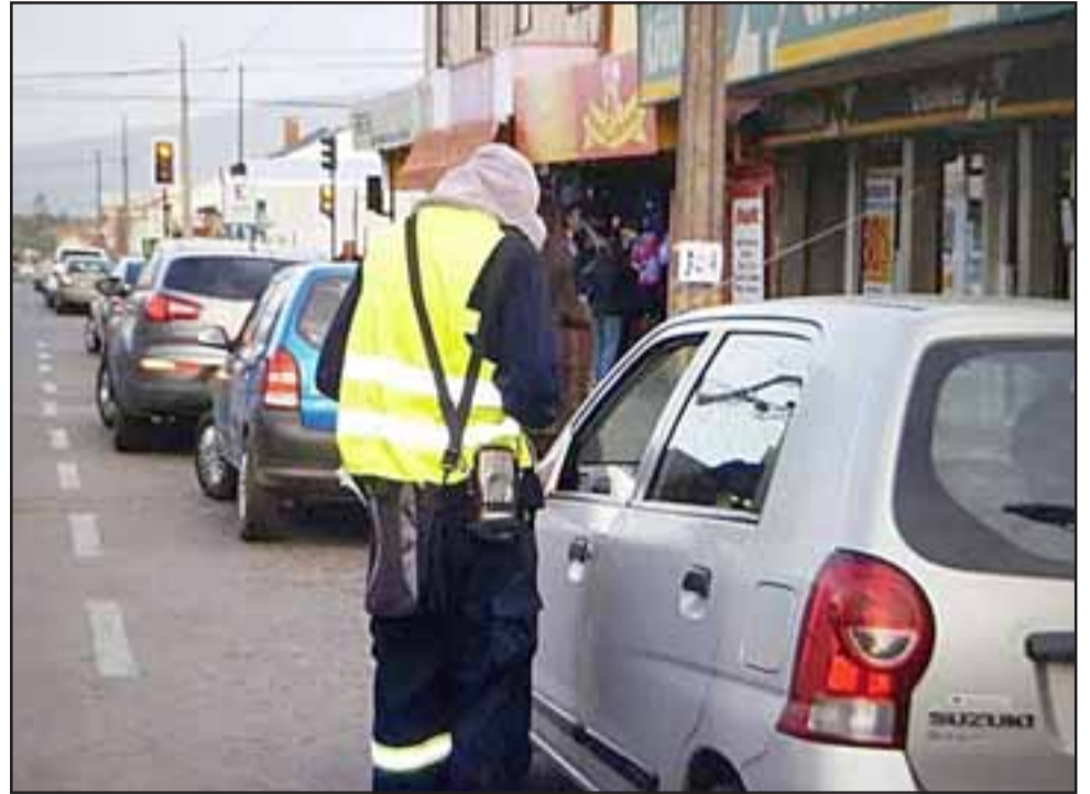
Debido a las deudas contraídas con sus trabajadores y con el propio municipio, la corporación edilicia decidió terminar el contrato con la empresa de parquímetros.

Finalmente, y con respecto a las deudas que mantiene la empresa, el alcalde Edgardo González aseguró que «vamos a entablar todas las acciones legales correspondientes. En este caso vamos a presentar una demanda civil por el cobro, además vamos a ejercer una denun-