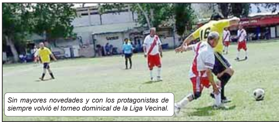
Sin mayores novedades y con los protagonistas de siempre volvió el torneo dominical de la Liga Vecinal.

1; Unión Esfuerzo 3 – Aconcagua 2; Los Amigos 3 – Hernán Pérez Quijanes 0; Carlos Barrera 4 – Barcelona 1; Pedro Aguirre Cerda 7 – Resto del Mundo 0.