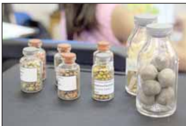
La jornada transcurrió con una muestra de semillas de árboles nativos, lo que cautivó la atención de los pequeños.