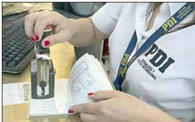
El camionero fue formalizado por falsificación de instrumento público, no obstante, el tribunal fijó un plazo de tres meses para el cierre judicial de la investigación.

Posteriormente el camionero fue formalizado por falsificación de instrumento público. Como no tiene antecedentes policiales el fiscal Raúl Ochoa pidió fijar una nueva audiencia para discutir una salida alternativa o discusión de medidas cautelares. No obstante, el tribunal fijó un plazo de tres meses para el cierre judicial de la investigación.