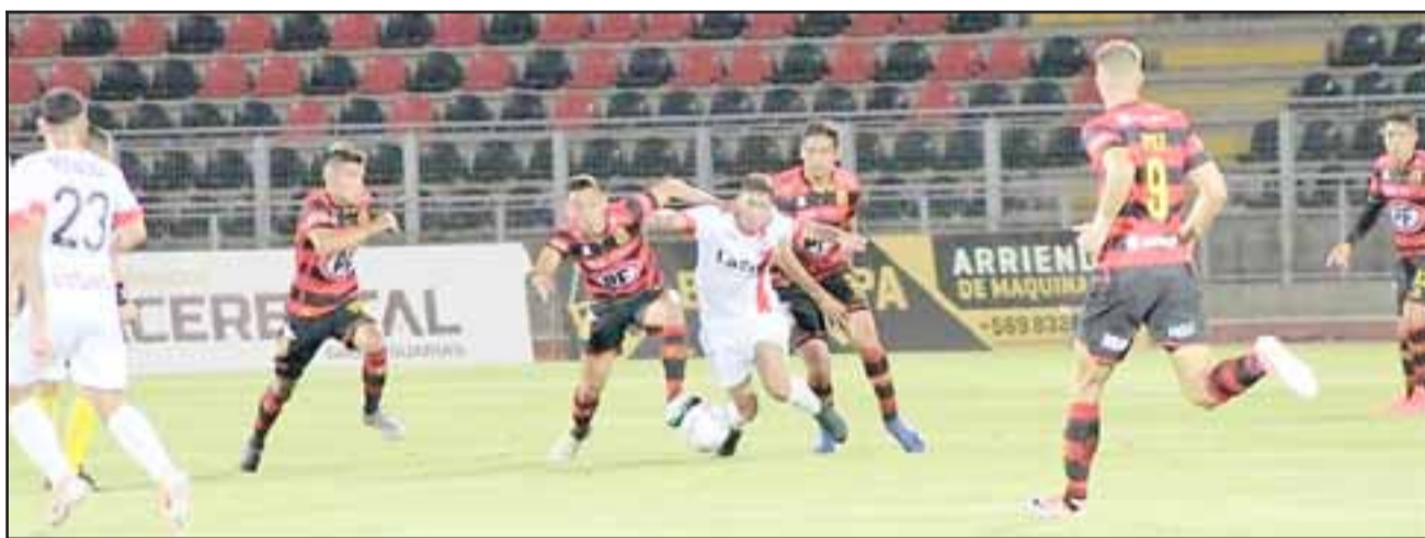
En la interna del Uní Uní valoraron la igualdad, aunque reconocen que deben mejorar.