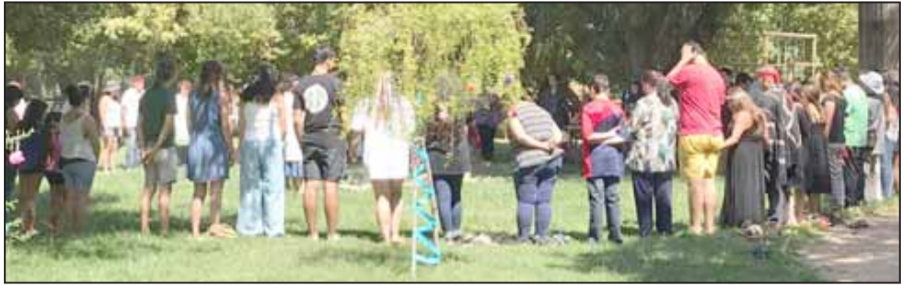
Tal como se ha realizado en otras dos oportunidades, en esta actividad se agradecerá a la naturaleza a través de tradicionales rituales y además se realizarán rogativas para que este año las lluvias alivien la cruenta sequía que afecta al Valle de Aconcagua.

CALLE LARGA. - Cuenta la leyenda que una hermosa joven india llamada Chaya, se enamoró del príncipe de su tribu, quien ignoró sus requerimientos amorosos. Al no ser correspondida ella se internó en las montañas a llorar sus penas. Fue tanto su llanto y tristeza que se convirtió en una nube, volviendo a mediados del verano del brazo de la diosa Luna (Quilla) en forma de rocío o fina lluvia.