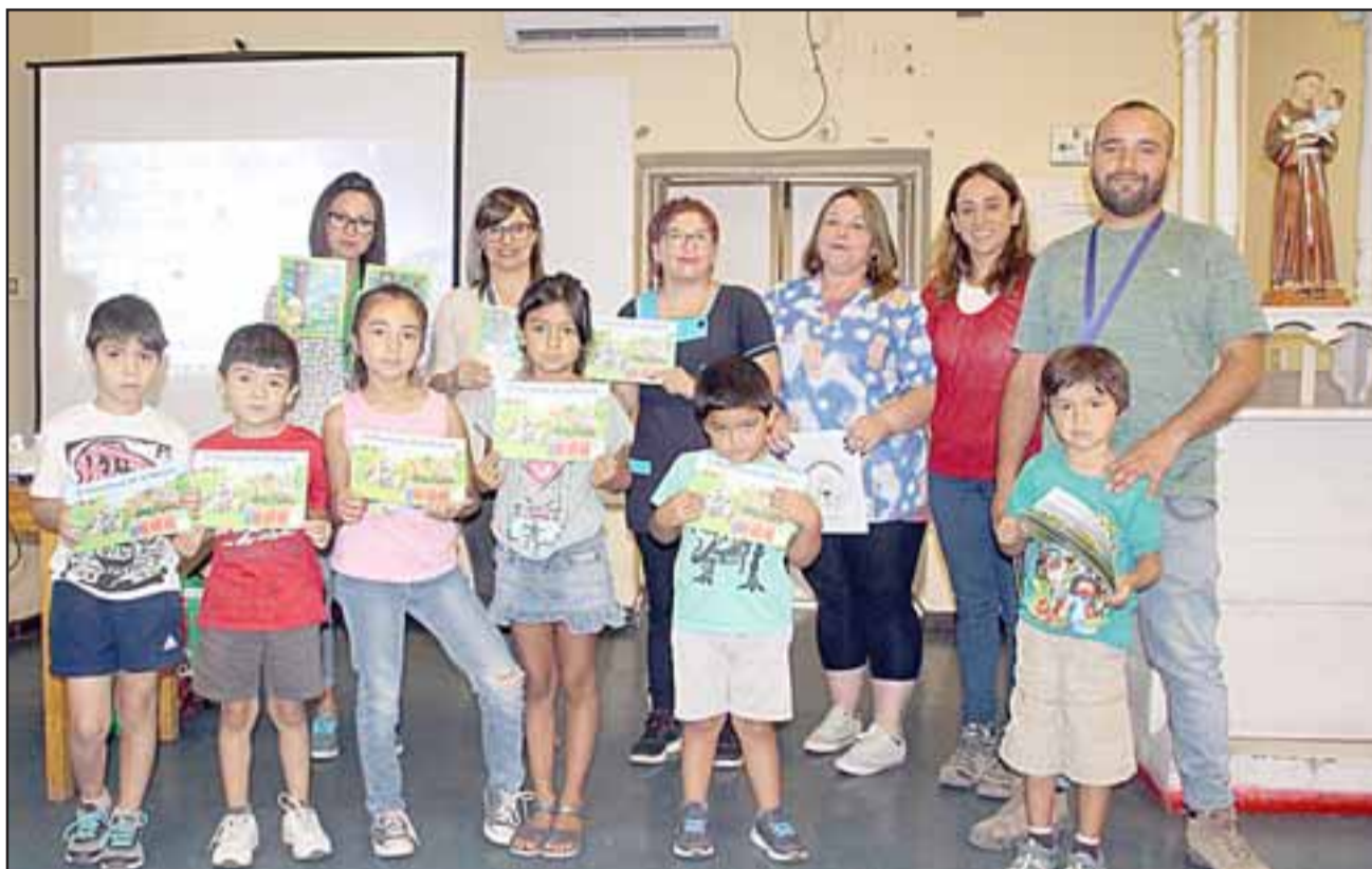
Los pequeños del Club Escolar 'Los Pitufitos' (hijas e hijos de funcionarios del hospital) tuvieron una amena mañana junto a personal de Conaf y del establecimiento, ocasión en que recibieron un colorido libro que refuerza los contenidos abordados en la charla.