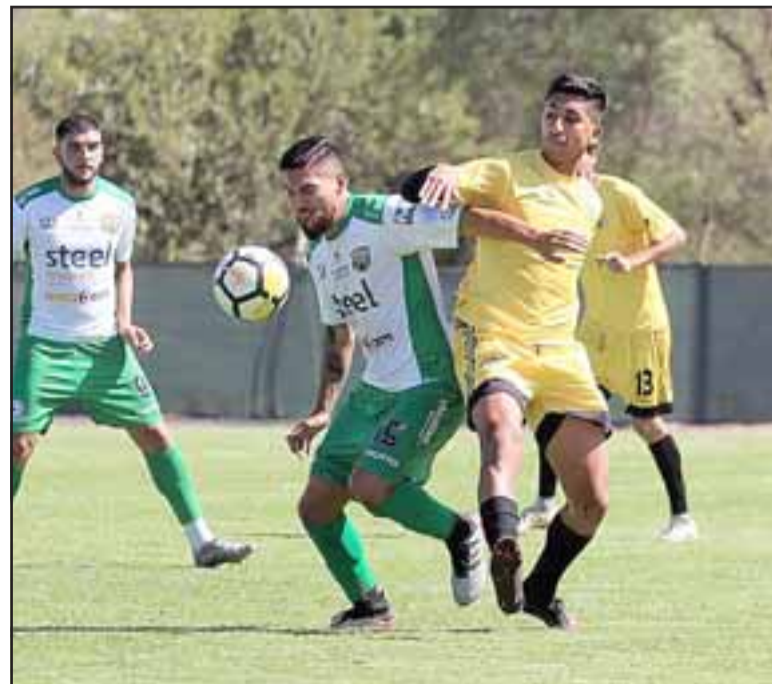
El conjunto andino jugó un encuentro amistoso frente a Lautaro de Buin.