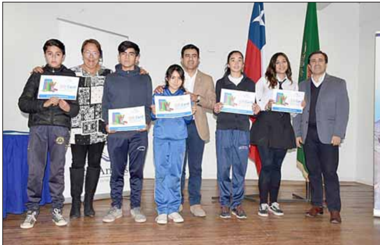
Para los interesados, las bases ya se pueden retirar en la Dirección de Desarrollo Comunitario –Dideco– en Calle Yervas Buenas 330 o a través de la página web del municipio: www.losandes.cl .

Para los matriculados en institutos profesionales y centros de formación técnica existe un monto de $140.000 y la entrega de 50 pasajes (una vez al año) para diez estudiantes matriculados en Santiago o Valparaíso, correspondiente a universidades, institutos, centros de formación técnica y escuelas matrices de las Fuerzas Armadas que