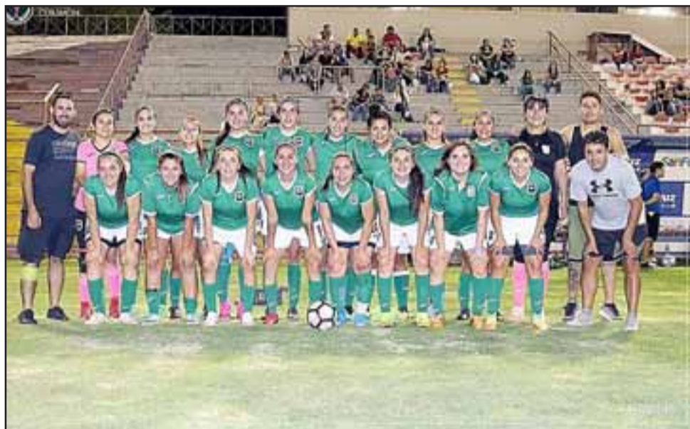
Alianza de Curimón es uno de los representantes del Valle de Aconcagua que será protagonista en la tercera fase de 'La Orejona' versión femenina.

Valle Alegre (Calle Larga), Mario Inostroza (San Felipe, Alianza de Curimón (San Felipe) y Central de Putaendo.