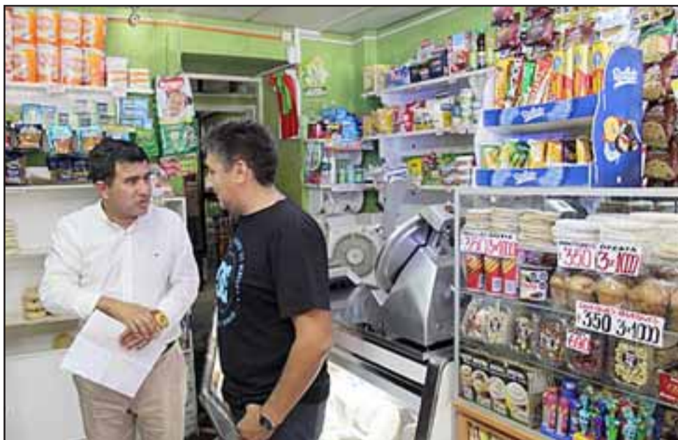
En esta versión 2020, el fondo concursable Digitaliza tu Almacén se prevé que beneficiará a 626 microempresarios almaceneros a lo largo de todo el país.

Los postulantes que cumplan todos los requisitos podrán recibir un subsidio de hasta $1.850.000 para solventar inversiones y acciones de gestión empresarial, sólo se les exigirá un cofinanciamiento de entre 5% y 20%.