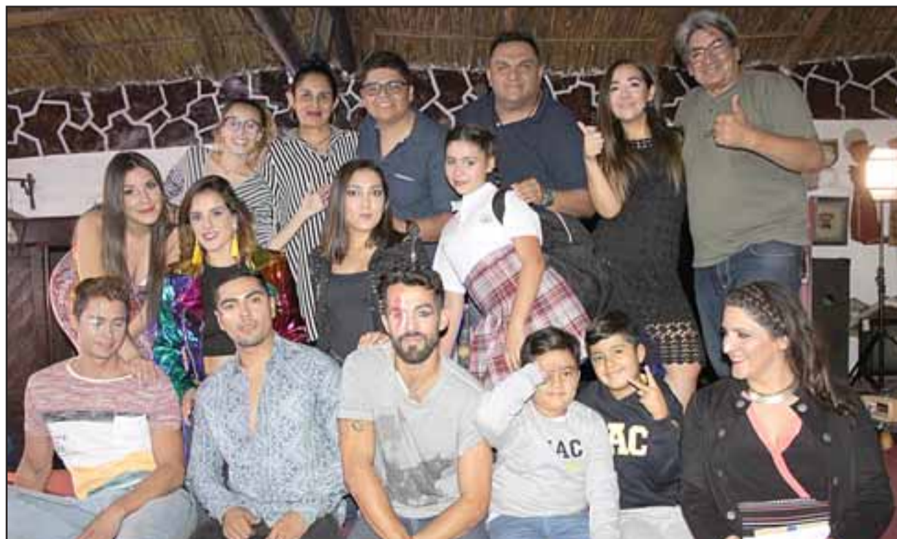
ELLOS AL FRENTE. - Ellos son los protagonistas de esta primera Moda PYME La Ruca 2020, desarrollada en Aconcagua.