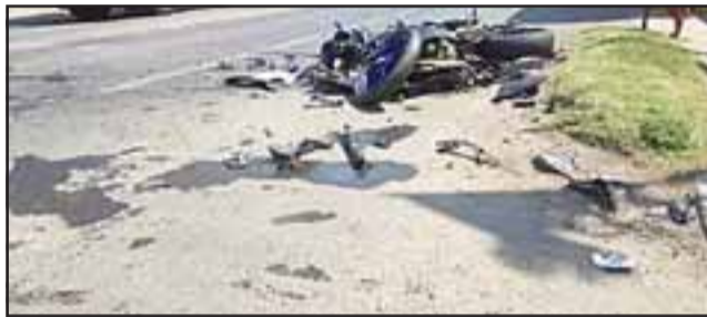
La moto en el suelo tras el violento impacto.