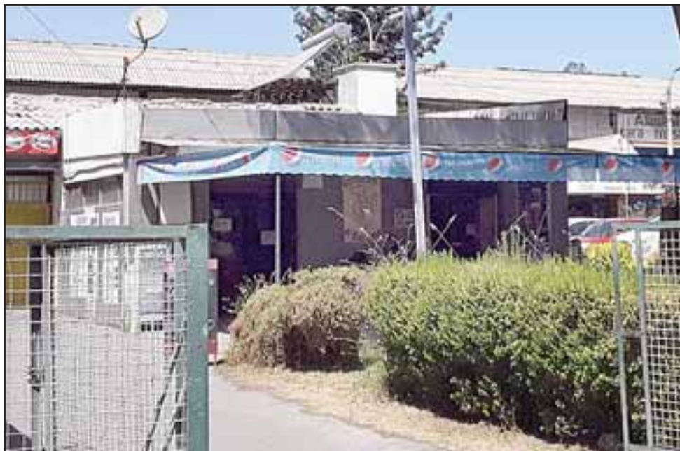
Este es uno de los locales en controversia, instalados en el complejo del terminal Rodoviario de San Felipe.

respecto de esa supuesta venta, que les permitió nuevamente enajenar a una empresa coligada esa propiedad y eso es lo que yo voy a informar al Concejo cuando el alcalde me lo solicite, los concejales pueden pedir la información, pero es el alcalde que me va a solicitar o me tendría que solicitar mi comparencia al Concejo y no tengo ningún problema en ir, además que la información está disponible para todo el público en el portal del Poder Judicial y el rol también es conocido, de hecho hay un abogado que está vigilando, con quien también he tenido contacto y le puede entregar información», señaló. En uno de esos locales funciona un restaurante.