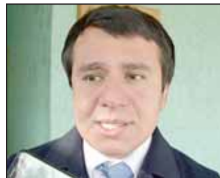
Francisco Álvarez, Seremi de Salud Quinta Región.

tando esta sintomatología. De inmediato se activaron los protocolos siendo trasladado hasta una sala de aislamiento en el Hospital San Camilo de San Felipe, lugar de donde le fue tomada la muestra de sangre para enviar al IPS. Reiteran de todas maneras el llamado a la calma ante este tipo de sospecha.