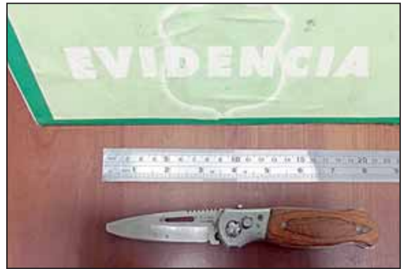
Aquí vemos una de las armas que portaban los antisociales.

Carabineros, concurriendo rápidamente un carro de la Tenencia de esa comuna. Al llegar los funcionarios sorprendieron Infraganti a los maleantes subiendo las planchas al vehículo, razón por la cual procedieron a su inmediata detención. Las planchas fueron avaluadas por a sanitaria en la suma de 30.000 pesos cada una.