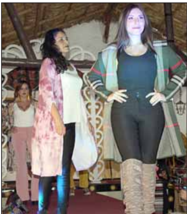
LAS MÁS BELLAS. - Despampanantes mujeres robaron más que suspiros esa noche en La Ruca.