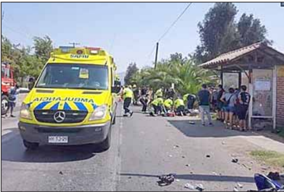
Personal del SAMU efectuando las maniobras para salvarle la vida.

Como suele suceder en estos casos, la investigación quedó a cargo de la SIAT San Felipe.