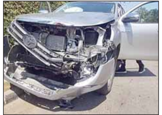
La camioneta Toyota con los daños sufridos por el choque.

El conductor de la camioneta no tuvo lesiones.