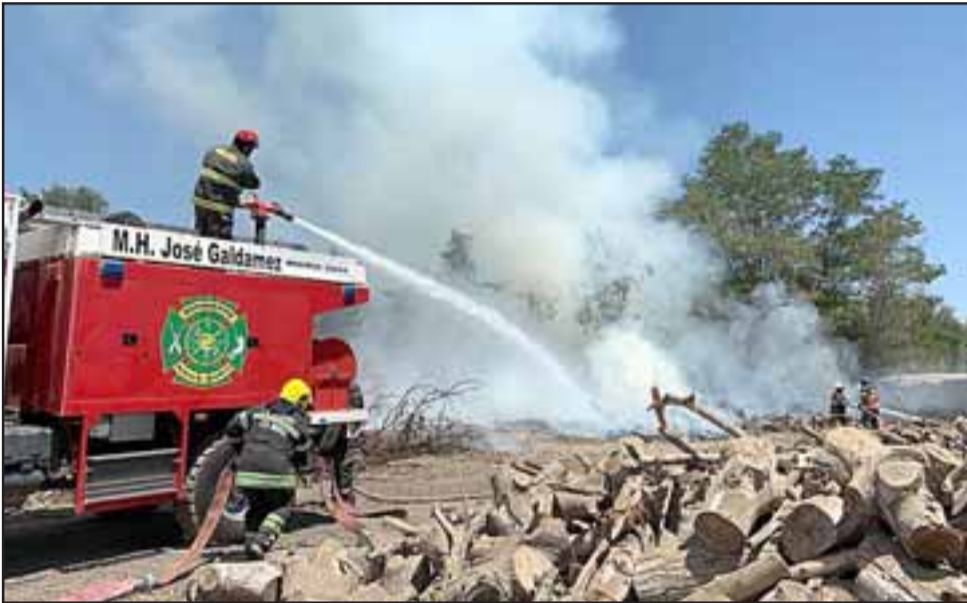
GRANDE LA SEGUNDA.- Muchos son los incendios forestales y estructurales que anualmente enfrentan estos Caballeros del Fuego.

significativo aniversario de su Segunda Compañía. Roberto González Short