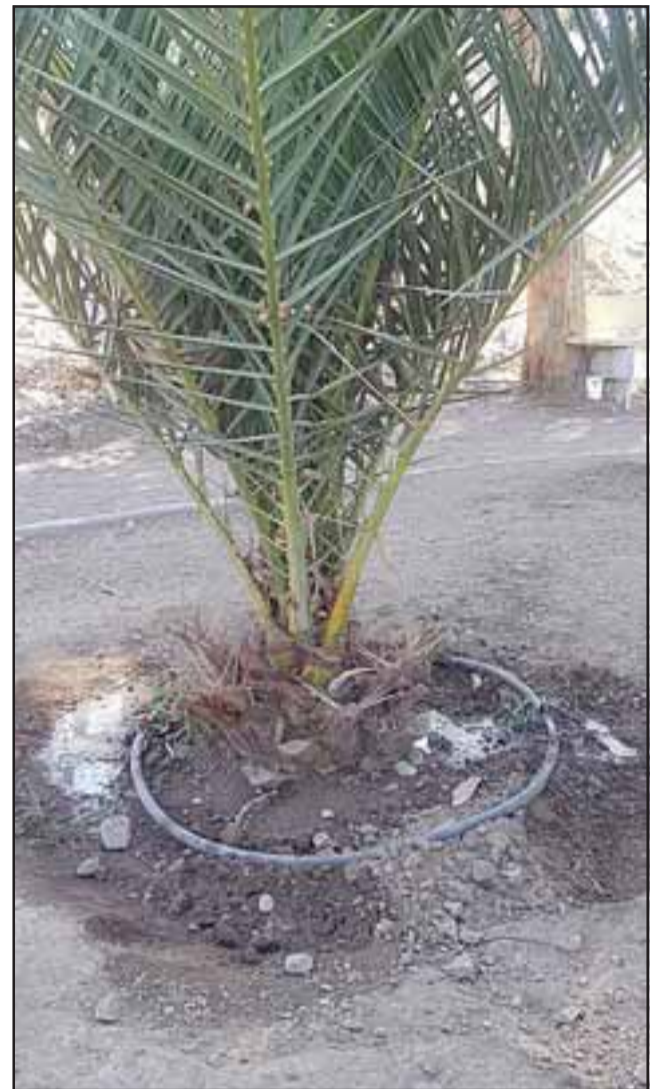
La agrupación desarrolló una iniciativa de recuperación de áreas verdes en el sector, hermoseando las plazas existentes y resembrando césped, a través de la implementación de un sistema de riego tecnificado por goteo.

ba el recurso en el riego de nuestras plazas. Es primera vez que postulamos a los fondos de Esva y fuimos uno de los ganadores, para nosotros es un privilegio y estamos muy agradecidos de que nos dieran esta oportunidad, ya que ahora tenemos un mejor lugar para los vecinos».