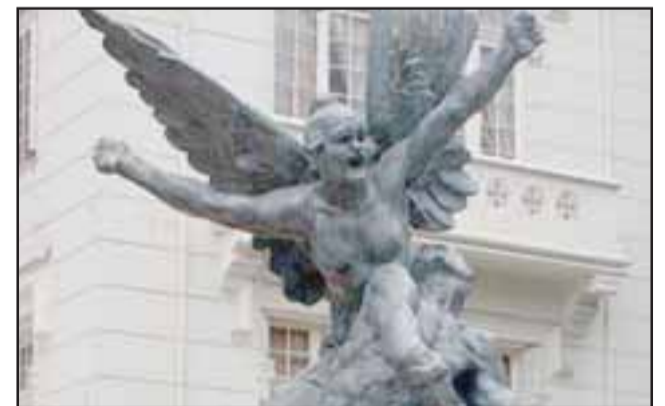
La Defensa, obra enviada por Rodín a un concurso en Valparaíso con motivo de las Glorias Navales, sin embargo, el jurado de la época la rechazó. Actualmente se ubica en Viña del Mar.

«El patriotismo es el último refugio de un canalla». Johnson