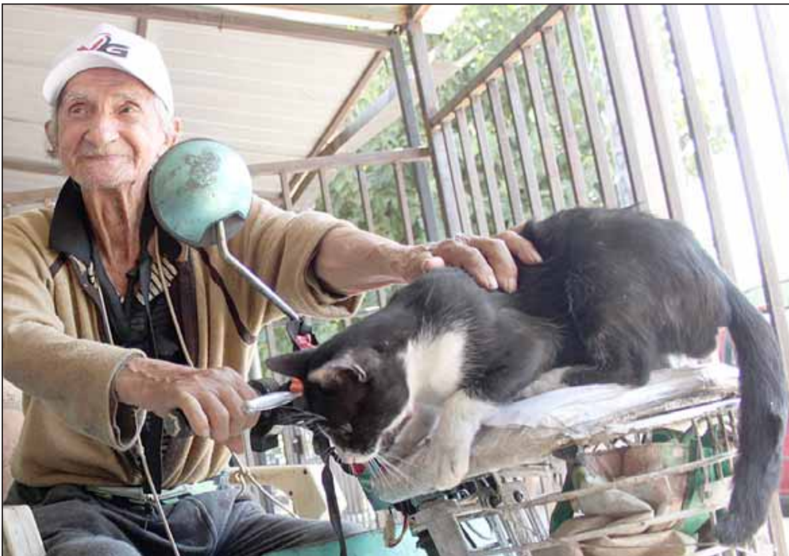
CON SU GATO 'KUCHO'. - Aquí vemos al abuelo con su gato regalón 'Kucho', una de sus mascotas más queridas, a veces le acompaña a vender gas.