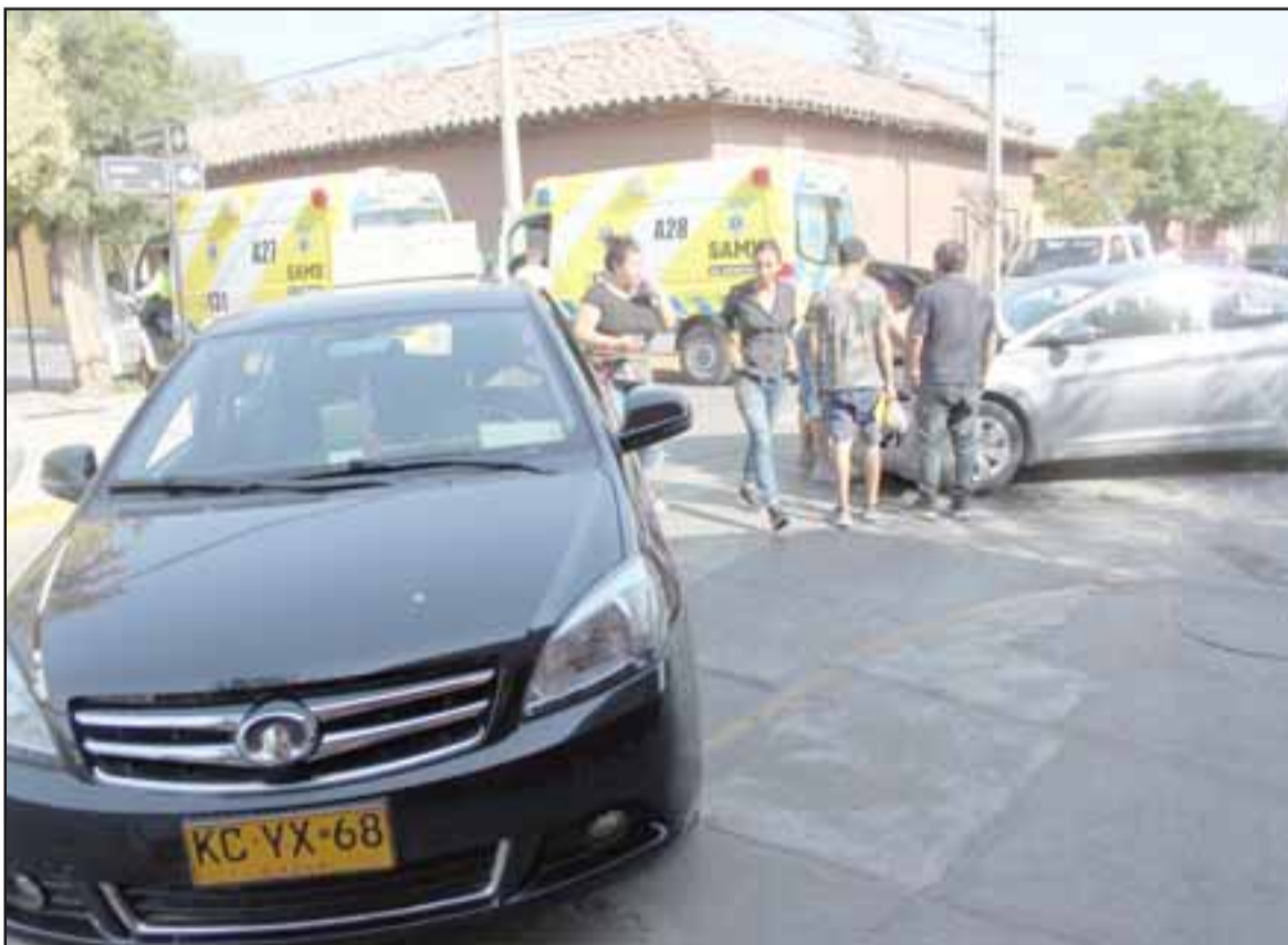
MUCHA ATENCIÓN.- Al parecer el disco PARE en calle Carlos Condell no está siendo respetado como se debe.