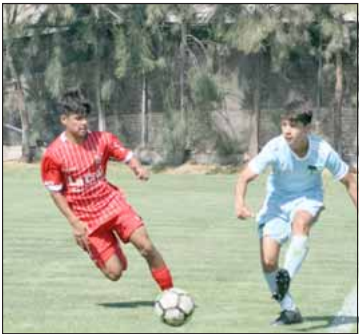
Este fin de semana será el estreno de los cadetes del Uní Uní en el torneo B del fútbol joven de Chile.