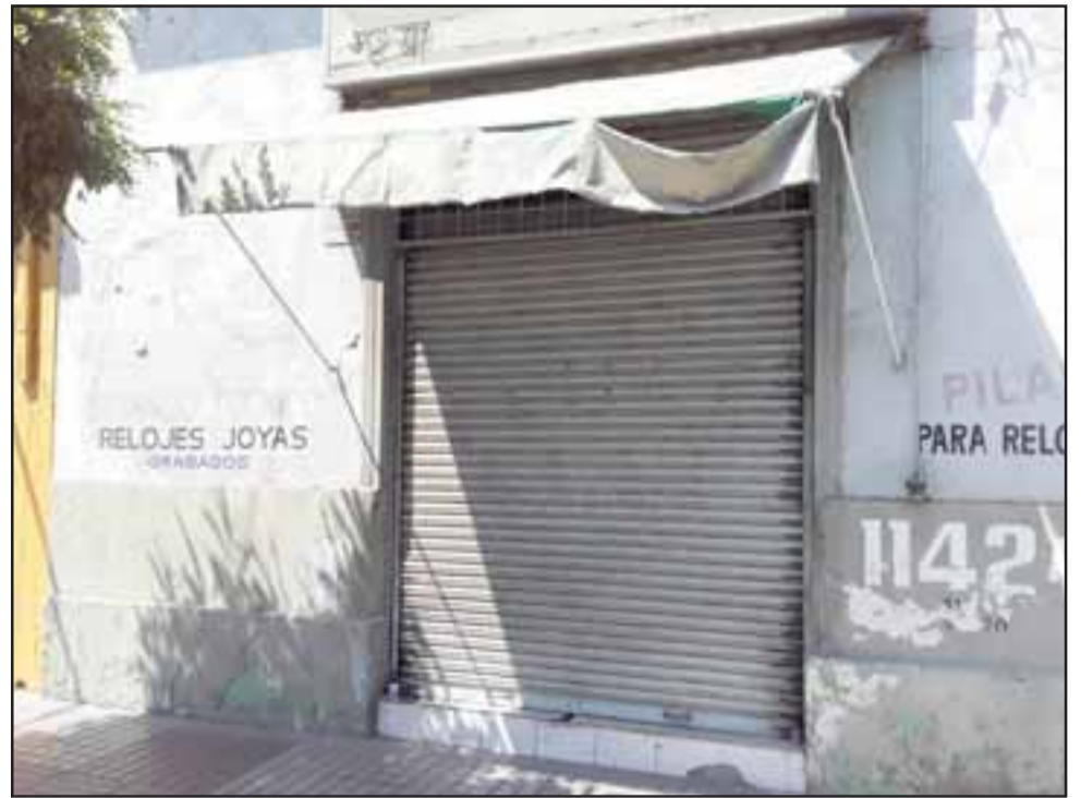
Frontis de la joyería ubicada en calle Coimas.

- Yo, lamentablemente voy a tener que pensarlo bien, porque yo voy a tener que ponerle el pecho a las balas, porque con esto voy a sufrir hasta demandas. Si no me puedo arreglar voy a tener que irme a la casa, ponerme de acuerdo con los clientes, entregar lo que está arreglado y lo que no, devolverlo porque no se puede seguir trabajando