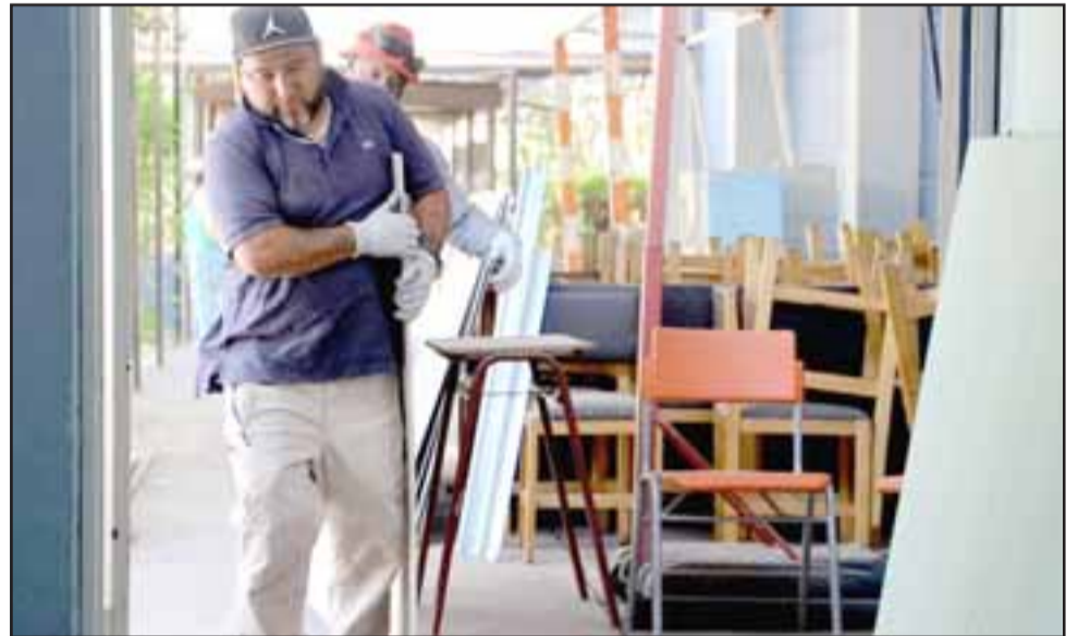
Durante el período de verano se ejecutaron diversas mejoras en infraestructura en escuelas y liceos.

NECESITO ARRENDAR CASA CON COMPROMISO DE COMPRA