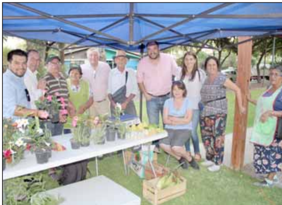
La feria tenía por objetivo dar a conocer a la comunidad panquehuina, las distintas habilidades, manualidades y emprendimientos que se pueden desarrollar en la comuna.