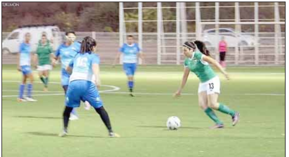
La Copa de Campeones de mujeres cuenta con cuatro conjuntos de la zona.

Mario Inostroza (San Felipe) – Aguas Buenas (Cartagena); San Francisco – Valle Alegre (Calle Larga); Parroquial (Puerta del Pacífico) – Huracán; Serena – Pedro Cabrera; Flecha Verde – Ritoque; Manuel Figueroa (Quillota) – Alianza de Curimón; Las Rosas – Mina Claudia; Central (Putendo) – Glorias Navales (Viña del Mar).