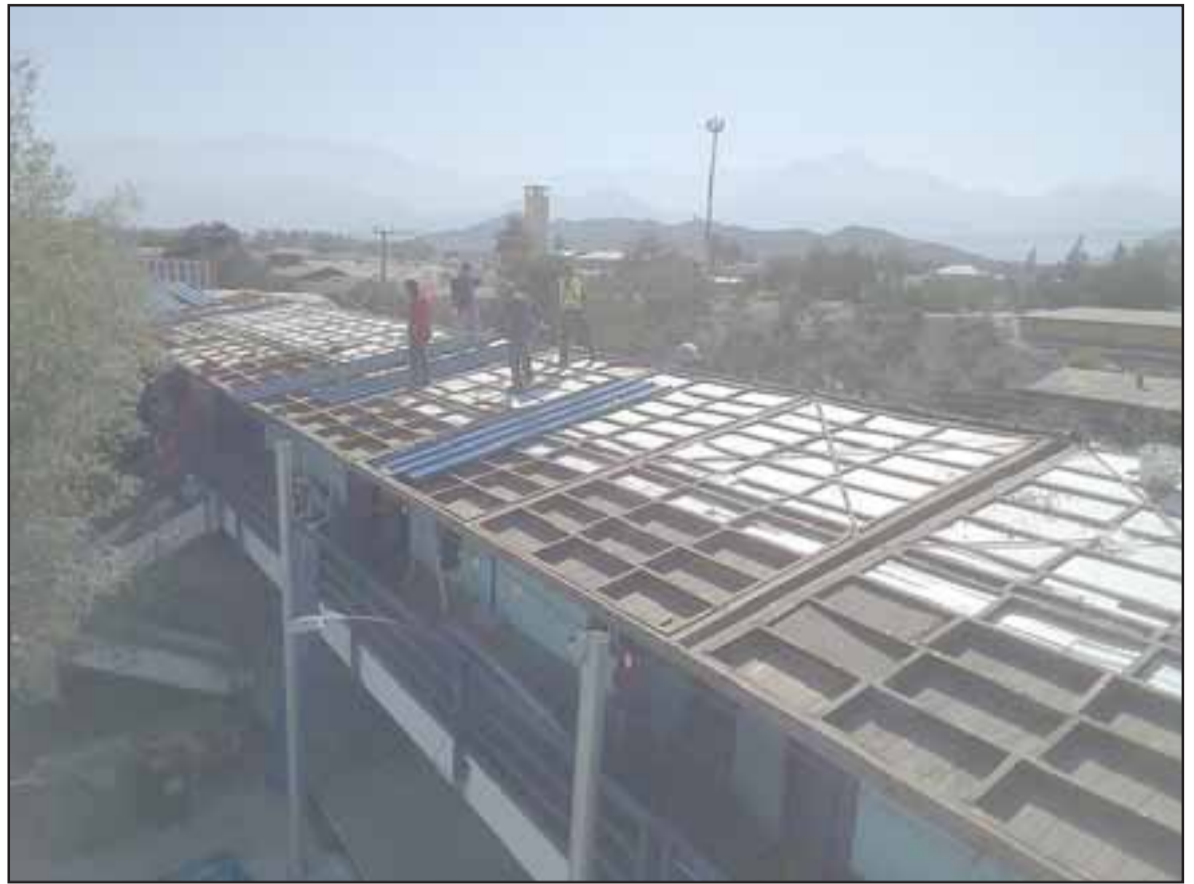
Recambio de techumbre completa se desarrolla en Liceo Amancay.