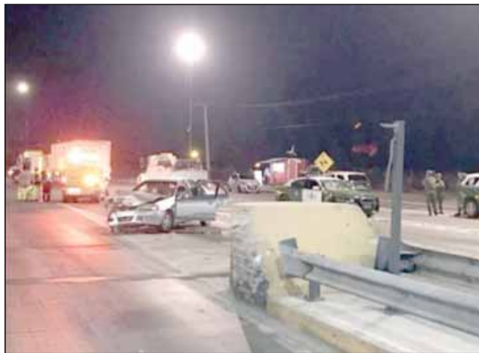
En esta posición quedaron los vehículos, tanto policial como particular, tras el insólito accidente.

los disparos, la víctima habría sido esposado, ¿qué hay de cierto?