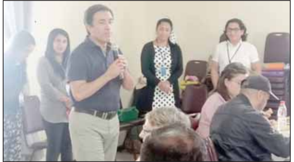
El alcalde de Los Andes dio el puntapié al Diagnóstico participativo de la estrategia de inclusión.