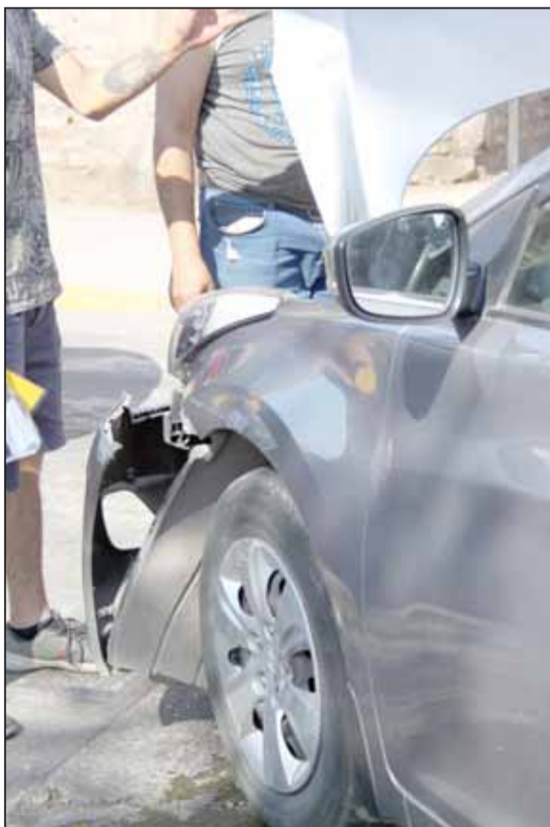
DAÑOS MATERIALES.- Los daños de momento son sólo materiales, ojala los mismos conductores logren acostumbrarse a este PARE obligatorio.