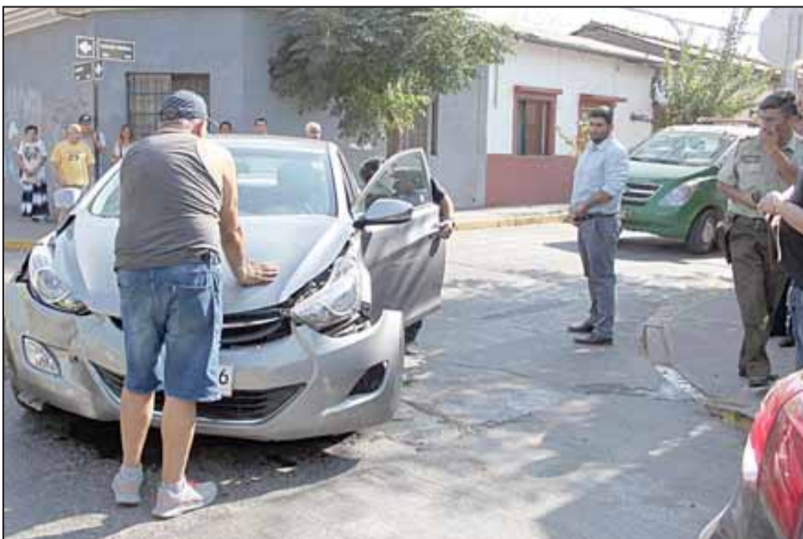
SIGUEN LOS CHOQUES.- Dos accidentes automovilísticos ocurrieron ayer miércoles en la esquina Navarro con Carlos Condell.