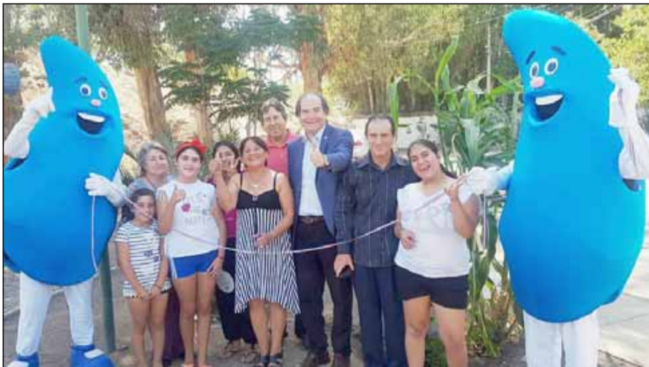
Vecinos de la comunidad de 'La Isla' y Esva inauguraron el proyecto financiado por el Fondo Concursable de la sanitaria, 'Contigo en cada Gota', el cual beneficia a unas 900 personas del sector.

Gracias a los recursos aportados por Esva, los vecinos recuperaron las plazas Los Quilos y Río Colorado, además de las áreas verdes existentes en la sede comunitaria, beneficiando a cerca de 900 vecinos del sector.