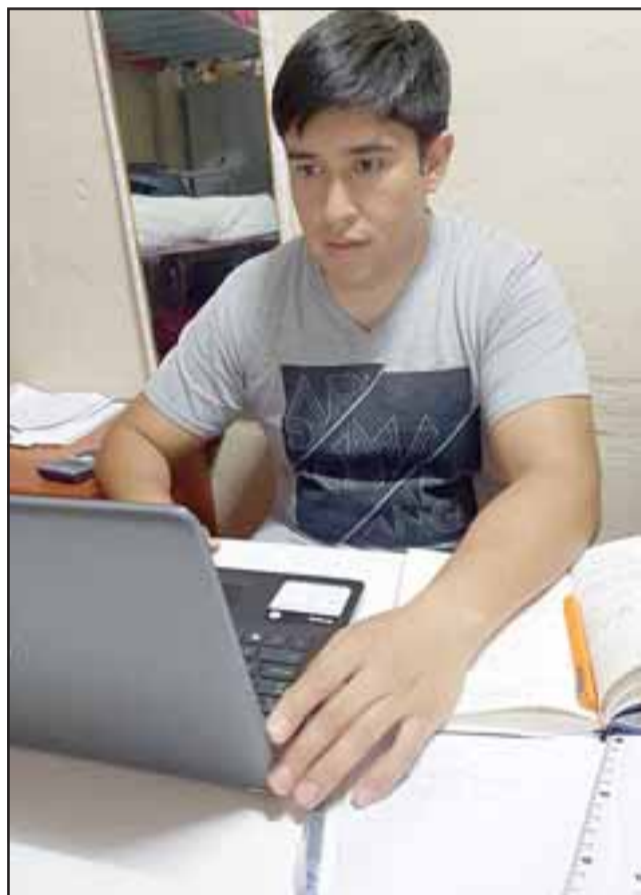
Los internos deben trabajar durante el día y asistir a clases en horario vespertino.

quirir herramientas para su reinserción social y laboral efectiva».