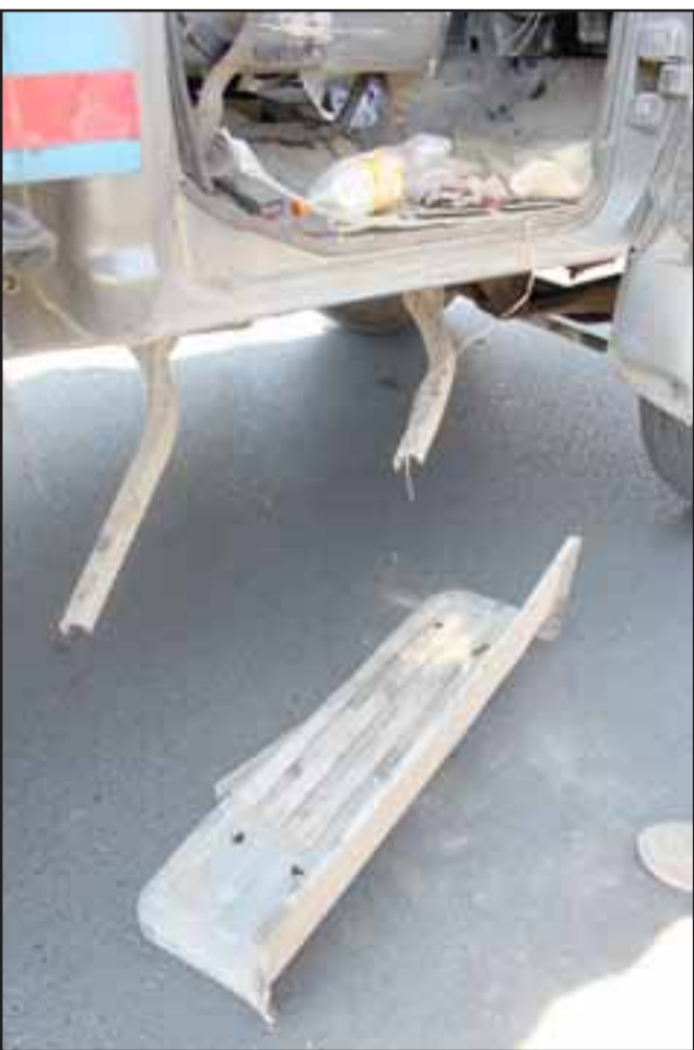
DAÑOS MENORES.- Al camión de la fruta sólo se le desprendió la pequeña escala para subir el acompañante.