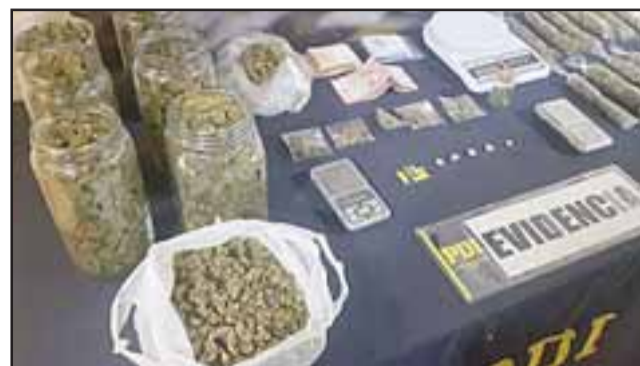
En la casa de la mujer ubicada en Calle Brasil de esa comuna, donde se incautó más droga a granel, dos balanzas digitales, $127.000 en efectivo, cinco comprimidos de MDMA y 15 láminas de LSD.

En total de la marihuana incautada fue de 869,86 gramos, incluida la que llevaba en la camioneta. La mujer fue puesta a disposición del Juzgado de Garantía de Los Andes donde el fiscal Fabián Garrido la formalizó por el delito de Tráfico en pequeñas cantidades.