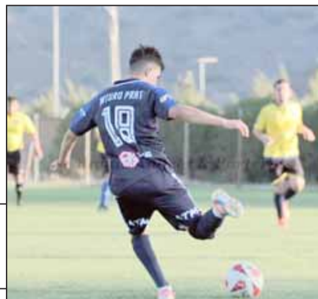
Clubes de San Felipe y Santa María serán los protagonistas del Amor a la Camiseta 2020.

po no podremos incluir a instituciones de otras comunas que quieren competir, pero trabajaremos para que el 2021 podamos hacer uno más grande, como debe ser, ya que el ‘Amor a la Camiseta’ es una copa importante, donde se resalta la amistad y confraternidad», culminó el organizador.