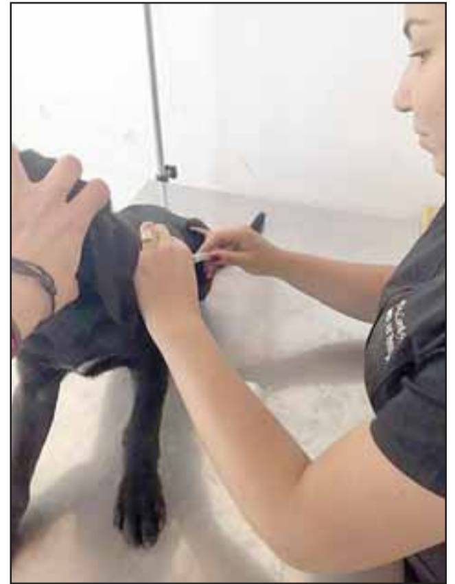
Profesionales de Veterinaria Municipal realizarán la atención a las mascotas de compañía. (Referencial).