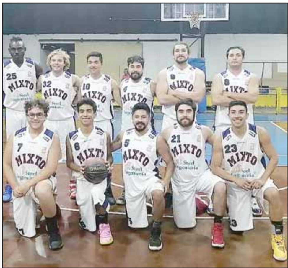
El Mixto y el Prat corren como favoritos para quedarse con la Copa Juan Arancibia.

De mantenerse la tónica de toda la fase regular, es muy probable que la lucha por el título se centre entre lo que puedan hacer Liceo Mixto y el Prat adulto, aunque no hay que descartar de esta lucha a 'tapados' como Lebajon y Canguros, cuadros que han dado muestras suficientes que pueden pelear por algo importante en la Copa Juan Arancibia.