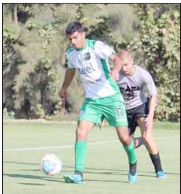
Los andinos ya saben a qué equipos enfrentarán en las primeras dos fechas del torneo de la Tercera A.

Como forastero y ante un equipo histórico de la división, como lo es Quintero Unido, será el debut de Trasandino en la nueva temporada de la Tercera A. El partido contra el conjunto de la costa debería jugarse el sábado 28 ó domingo 29 del presente mes.