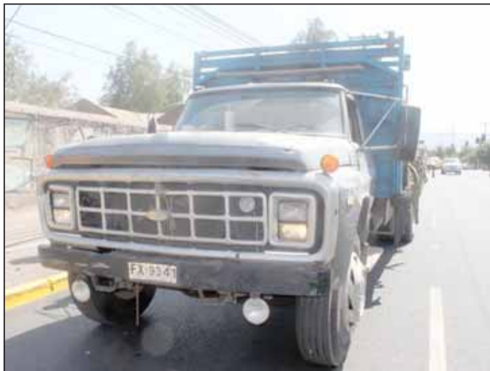
SIN DAÑOS.- Este es el camión cargado de pasas, no registra mayores daños que la pequeña escala.