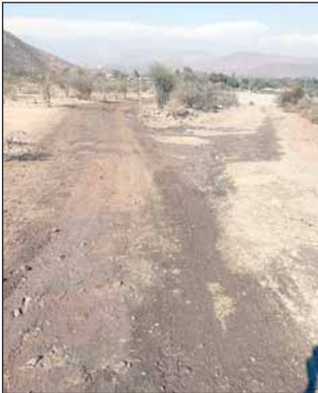
Un inmenso manchón en el suelo dejó el derrame de ácido sulfúrico proveniente del lavado de un camión con este tipo de carga peligrosa.