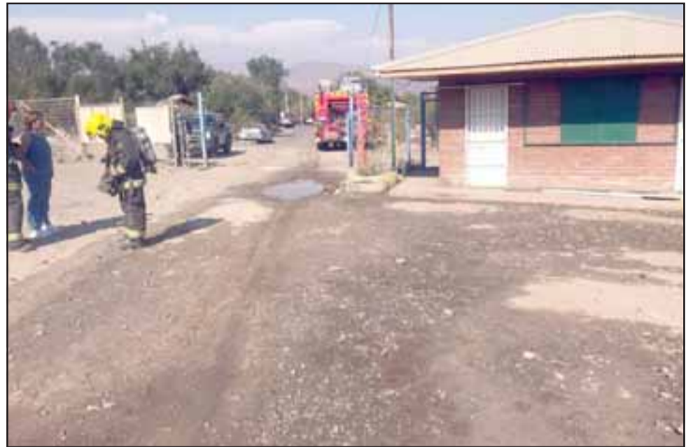
Bomberos acudió a controlar la emergencia de derrame de ácido sulfúrico en el sector de El Asiento, cerca de la mina existente en el lugar.

El camión, según indicó Herrera, arrancó hacia la mina cuando llegó la primera unidad de San Felipe: «El camión ya había desaparecido hacia arriba y de ahí bajaron estos señores en esta camioneta, se les informó, no entendían, de ahí no volvie-