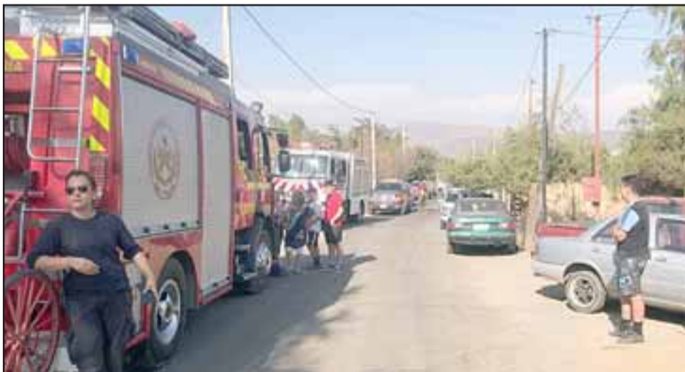
La emergencia química causó bastante expectación entre los residentes del sector, quienes acudieron a presenciar la labor de Bomberos.