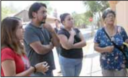
La familia de la víctima espera transparencia.

Familia reclama no se hizo 'Protocolo de Minnesota'