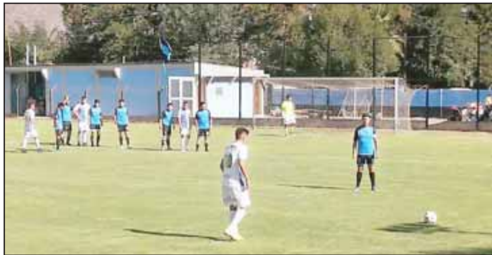
Este fin de semana comenzará la fase tres en las Copas de Campeones femenina y masculina.

12:00 horas: Canal Chacao (Quilpué) – Centro Chile (Putendo)