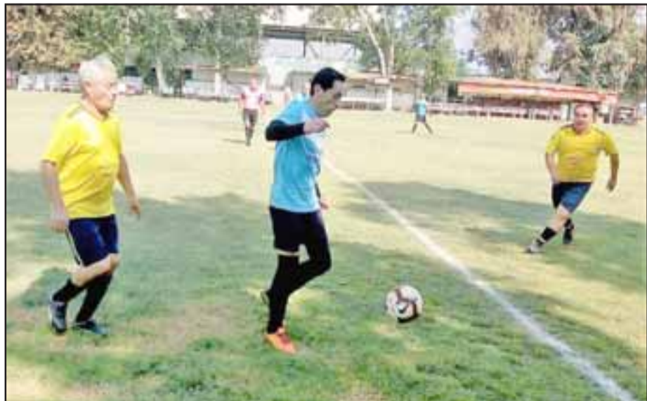
El puntero y uno de sus cancheros se enfrentarán este domingo en Parrasía.