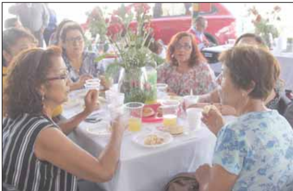
BUEN DESAYUNO. - Cada una disfrutó de un refrescante desayuno en compañía de las autoridades y empleadores.