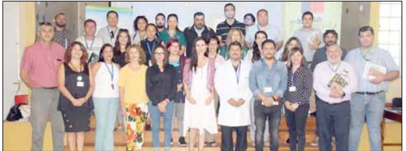
La jornada contó con unos 30 invitados provenientes de las comunas de Llay Llay, San Felipe, Los Andes y Putaendo.

«Esta jornada pretende que los hospitales puedan estar mucho más conectados con el medio ambiente a través de distintas iniciativas que permitan el uso de energías sustentables, con-