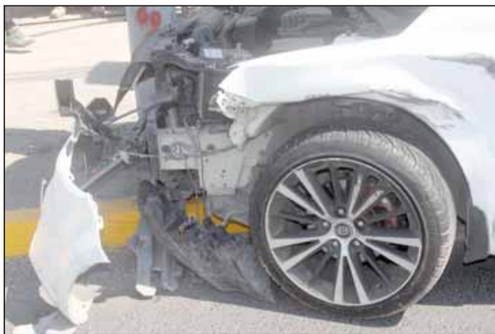
DAÑOS MATERIALES.- Los daños materiales podrían estar cercanos a los $2 millones tomando en cuenta que es un automóvil moderno.