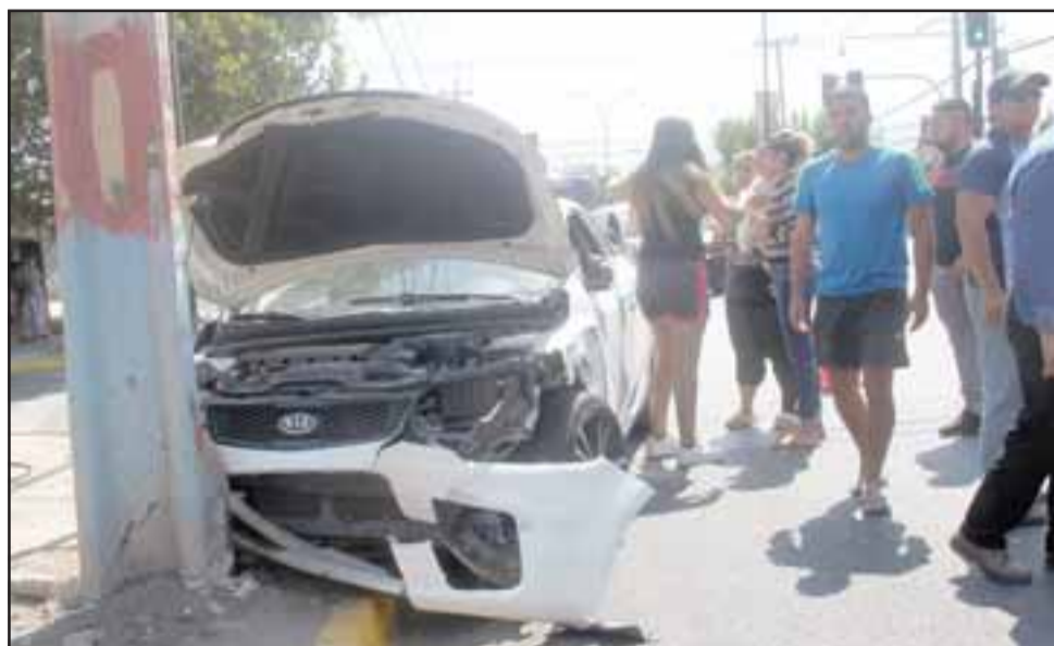
CONDUCTORA ILESA.- Así terminó el KIA tras la colisión con el camión de pasas, estrella-do contra este poste de alumbrado público.