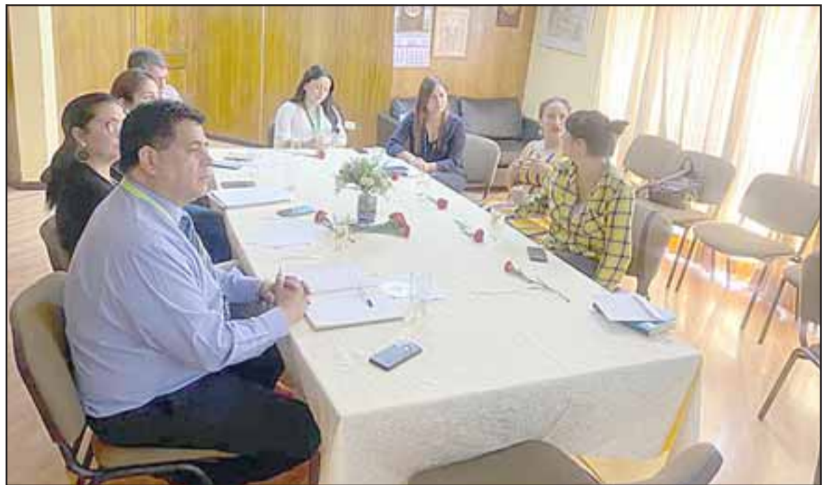
Reunión de coordinación para la implementación del programa 'Quiero mi Barrio', en Villa Los Aromos de la comuna de Santa María.

Se estima que el término del programa debiera ser el año 2023.