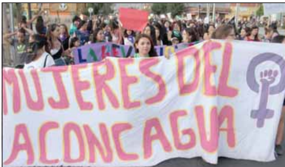
EN LETRAS GRANDES.- Grandes pancartas fueron exhibidas a lo largo de la caravana humana que desfiló por las avenidas sanfelipeñas.