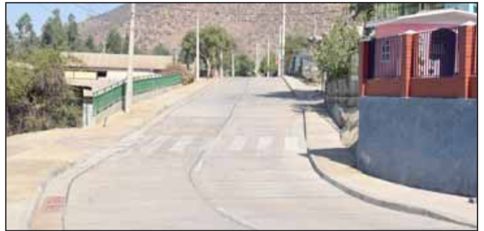
La emblemática Calle 2 de la Población Eliecer Estay requirió una inversión de más de 270 millones de pesos, gracias a Serviu y un importante aporte del municipio, cercano a los 70 millones de pesos.

«Para nosotros es una obra emblemática la Calle 2 de la Población Eliecer Estay, lo que significó una inversión mayor porque hubo que hacer mucho trabajo. Hace tres años nos reunimos con los vecinos del sector y con los dirigentes, no había postación, luz