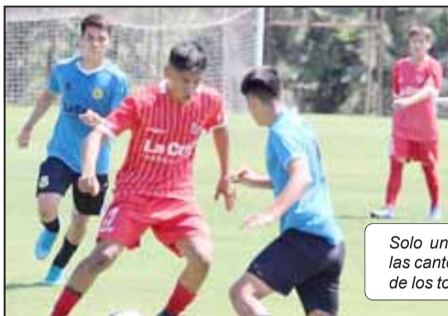
Solo una victoria fue la cosecha de las canteras del Uní Uní en el estreno de los torneos formativos de la ANFP.

Un estreno no muy feliz tuvieron las series cadetes de Unión San Felipe en los torneos de Fútbol Joven e Infantil de la ANFP. El recuento no fue muy halagüeño debido a que solo un cuadro albirrojo logró ganar.