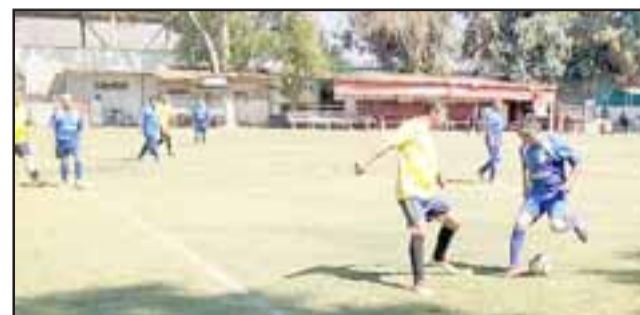
En la actualidad la cancha Parrasía alberga dos torneos de la Liga Vecinal.