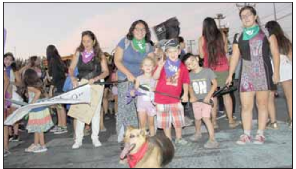
FUERZAS VIVAS.- Peques y grandes, hasta esta perrita salió a las calles para hacer sentir su presencia en la conmemoración del Día Mundial de la Mujer.