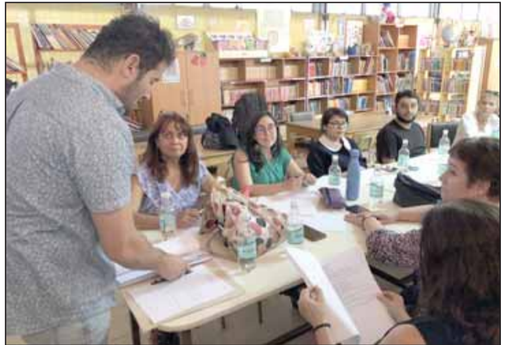
Los docentes de la red de inglés participaron en la primera reunión de planificación del año.

«El inglés Abre Puertas nos está potenciando esta instancia de poder participar en una red y así poder articular el trabajo en beneficio de los niños. Actualmente tenemos muchas capacitaciones, de distinta índole, de currículum, de