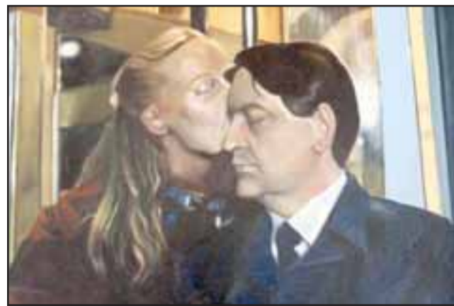
IMPECABLE TEXTURA. - Aquí vemos una de las obras que estarán en exposición hasta fines de mes en Buen Pastor.

San Felipe y Aconcagua, sino que también de la V Región y del país, para que puedan mostrar el trabajo que están haciendo. Y quisimos comenzar este ciclo de exposiciones temporales con una muestra colectiva de distintos jóvenes