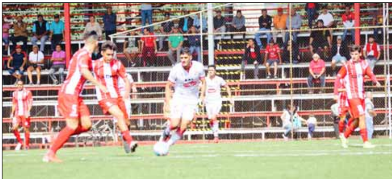
En el Félix Gallardo de Valdivia, sureños y aconcagüinos protagonizaron un partido dramático.