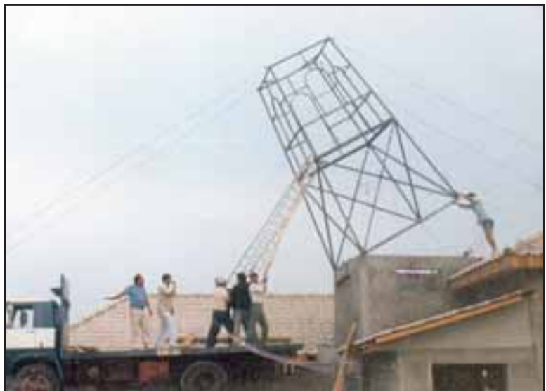
FOTO HISTÓRICA.- El torreón principal del cuartel cuando era instalada su armadura sobre el edificio.