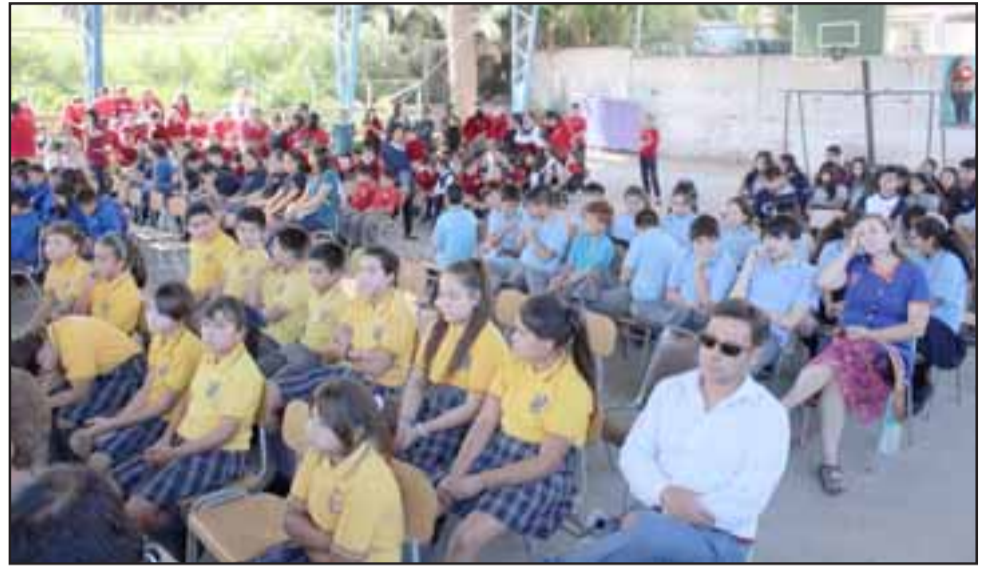
En la escuela Ema Lobos Reyes del sector de San Roque se inauguró el año escolar 2020 en Panquehue, con presencia de delegaciones de las diferentes escuelas de la comuna.

Para el alcalde Luis Pradenas , la sociedad