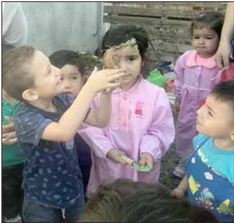
Maravillados quedaron los pequeños cosechando lo que sembraron los últimos meses del año 2019 en el huerto que posee el jardín.

Para dar el vamos al año parvulario 2020 los niños, niñas y sus familias cosecharon diversas verduras y frutas que sembraron en el huerto del jardín infantil a fines del año recién pasado.