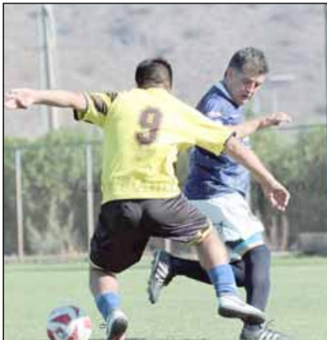
El domingo se dará el puntapié inicial del 'Amor a la Camiseta'.

*Jugarán en el mismo orden en la fecha inaugural del domingo 15 de marzo de 2020