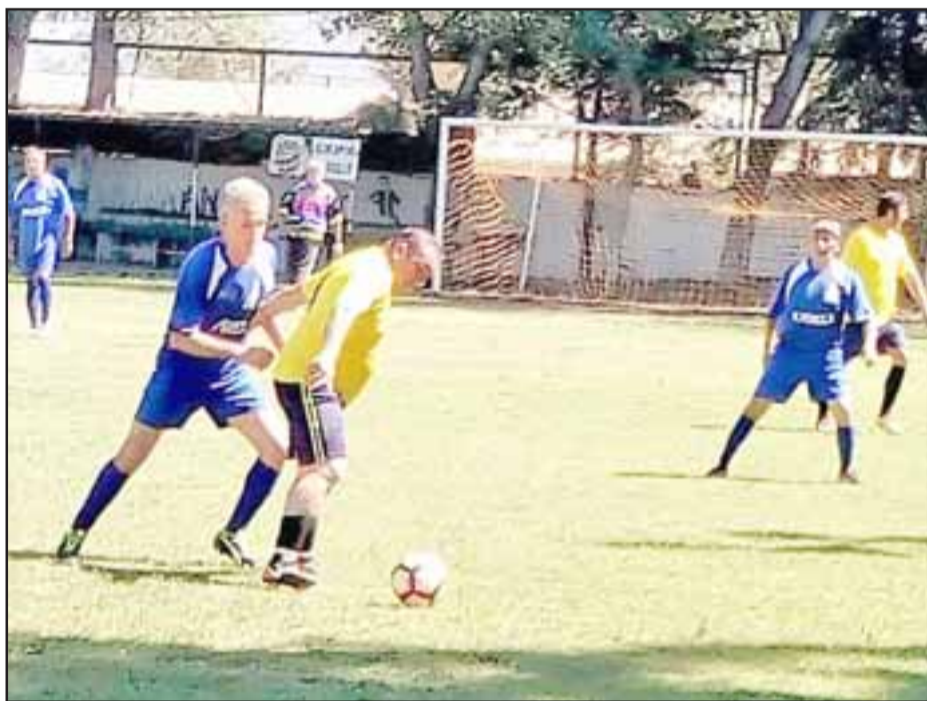
Hasta ahora tres son los equipos que luchan por el lugar de privilegio del Apertura de la Liga Vecinal.