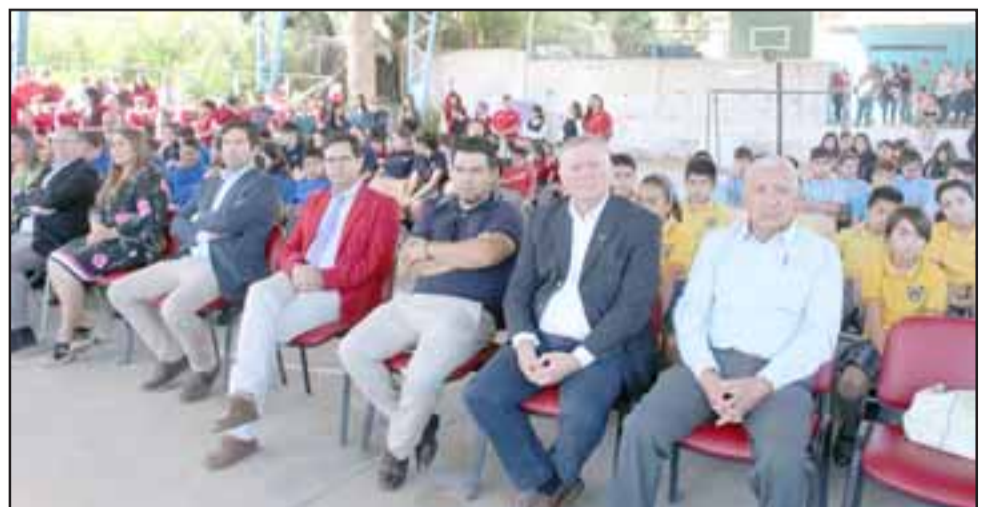
Autoridades encabezadas por el alcalde Luis Pradenas durante la ceremonia de inauguración.