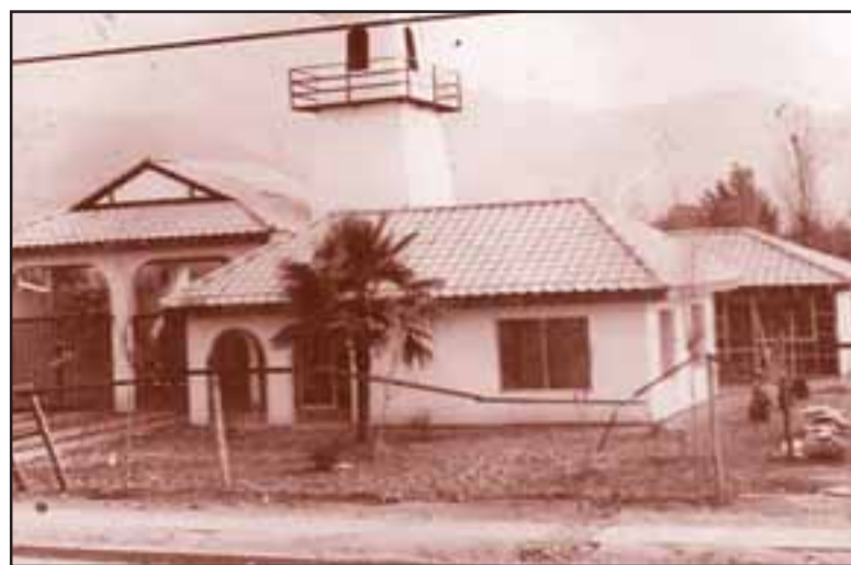
CUARTEL TERMINADO.- Así lucía este cuartel una vez terminado, una muestra fiel de que el trabajo en equipo, si se concentra en una meta definida, siempre será bien aprovechado.

Fue toda una odisea, éramos considerados locos por las otras Compañías, pero fuimos venciendo obstáculos, el superintendente del Cuerpo,