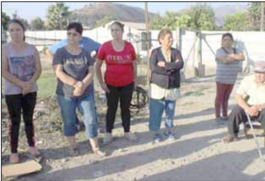
La comunidad del sector lleva ya seis años esperando para tener alcantarillado, lo cual los tiene justificadamente molestos.

El alcantarillado debería beneficiar a unas cuatrocientas personas.