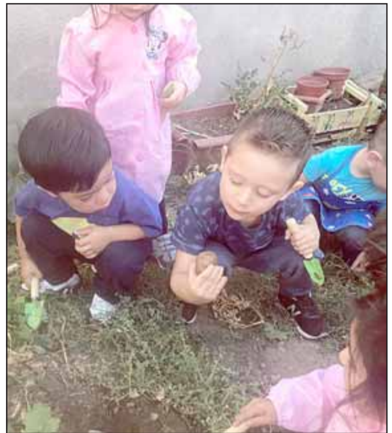
Los menores sacaron desde la tierra las papas, tomates, zapallos italianos y otros vegetales que sembraron con sus propias manos y que cuidaron y regaron por largos meses.