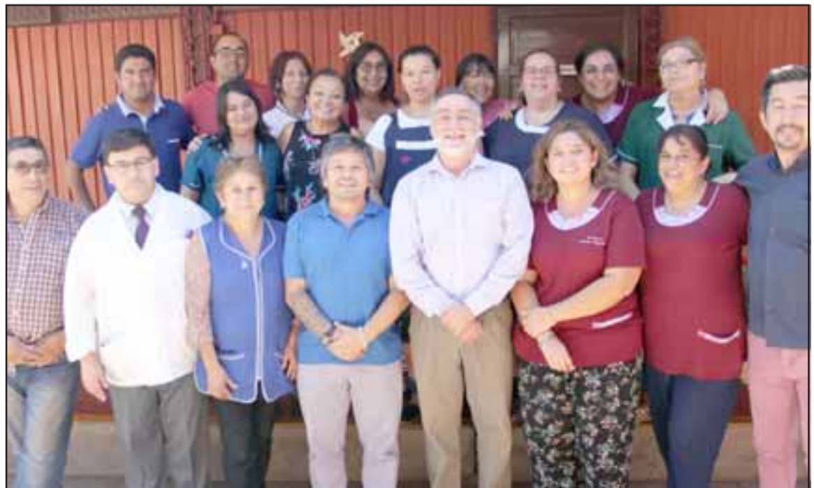
PROFES LISTOS. - Aquí tenemos sólo a una parte del profesorado de la Escuela Bucalemu, respaldando a su nuevo director.