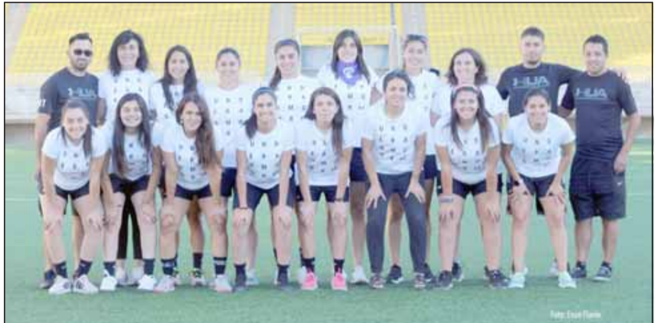
Solo un desastre deportivo impediría al conjunto femenino de Alianza Curimón seguir en carrera por la Copa de Campeones.

17:00 horas: Litoral (Puchuncaví) – Independiente (Panquehue)