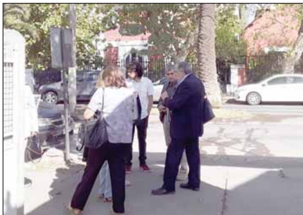
El alcalde Boris Luksic en las afueras del tribunal conversando con familiares y testigos.

- Nada más, desde el punto de vista laboral esto se terminó.