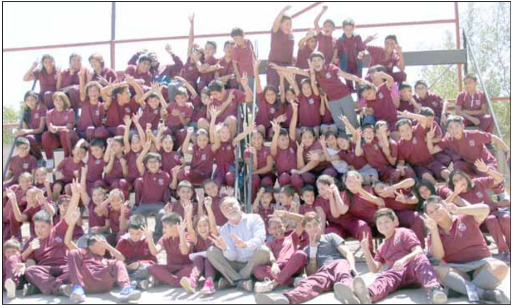
DIRECTOR REGALONEADO. - Así de tremendos son estos pequeñitos en su patio, quienes recibieron a su nuevo director con lo que más tienen para compartir: Cariño.