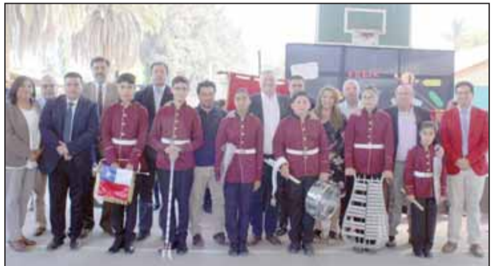
Al término de la ceremonia de inauguración del año escolar, se invitó a los alumnos a ser parte de la Banda Comunal, ocasión en que se entregaron algunos instrumentos en forma simbólica.

En la ocasión se hizo entrega de algunos instrumentos de manera simbólica.