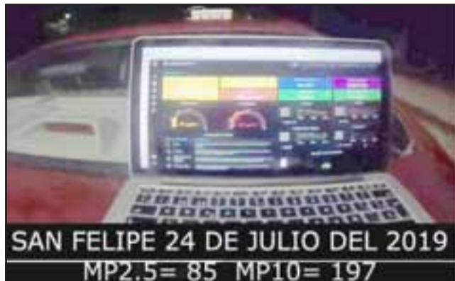
EN TERRENO. - Aquí vemos los resultados de una de las mediciones realizadas al aire sanfelipeño el año pasado.