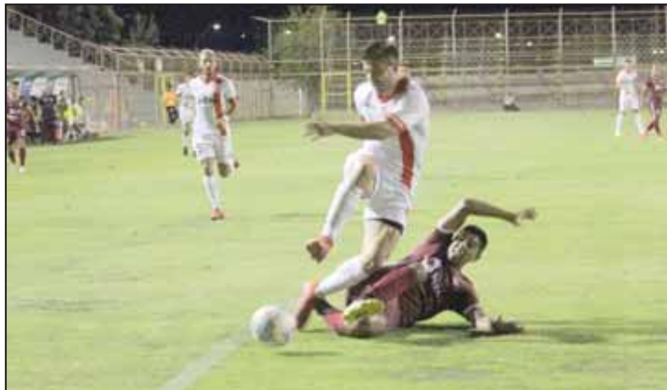
El delantero en plena acción en el último partido que jugó el Uní Uní antes de la suspensión del torneo.

no contraer el virus, es el que los jugadores extranjeros están solos, lejos de sus familias. «Obviamente se complica en ese aspecto, pero por suerte existen las comunicaciones. Hay alternativas para hablar y así ver a mis seres queridos prácticamente todos los días», dijo Palacios respecto a este punto tan sensible.