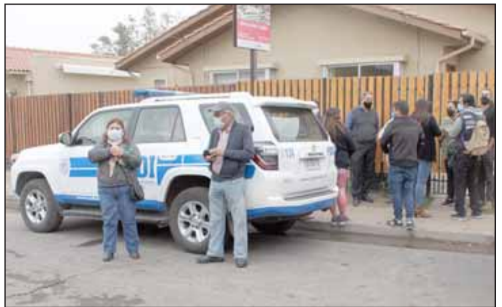
El Servicio Médico Legal quedó a cargo del cuerpo encontrado, y certificará las causas exactas de la muerte de la mujer.