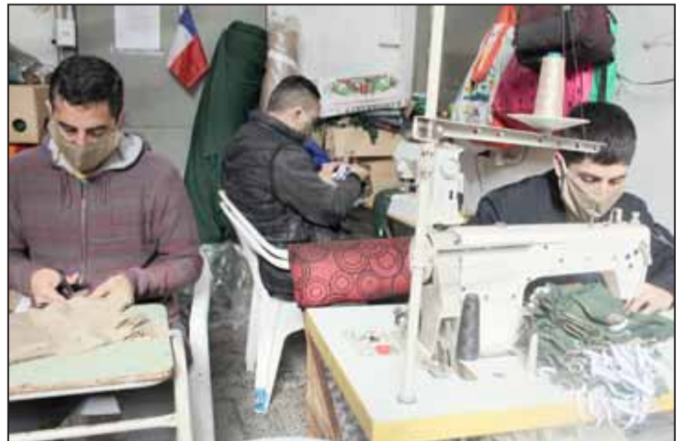
RECURSOS DE PROTECCIÓN. - Las cámaras de Diario El Trabajo captaron a los privados de libertad fabricando mascarillas.