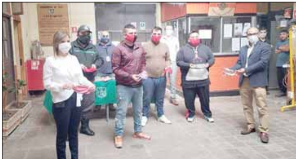
La iniciativa se logró gracias a un trabajo colaborativo entre el Municipio (a través de la Oficina de Migración), el Servicio de Salud Aconcagua, el Obispado y Gendarmería.

fección de estos barbijos, sostuvo que «somos conscientes de la pandemia que hay afuera en estos momentos. Por eso queremos donársela a la gente de escasos recursos. Nos significó mucho trabajo, realizábamos casi 30 mascarillas por día. Finalmente, logramos hacer de todos los tamaños. Es el trabajo voluntario de un grupo de personas interesadas en apoyar», finalizó.