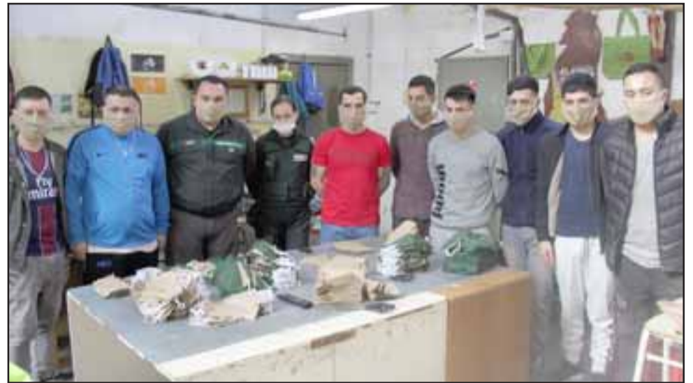
TIENEN TRABAJO. - Ellos son los encargados de confeccionar mascarillas para el uso tanto de oficiales de Gendarmería, como para ellos mismos.

- Bien, nosotros ya comenzamos el día viernes con los indultos conmuta-