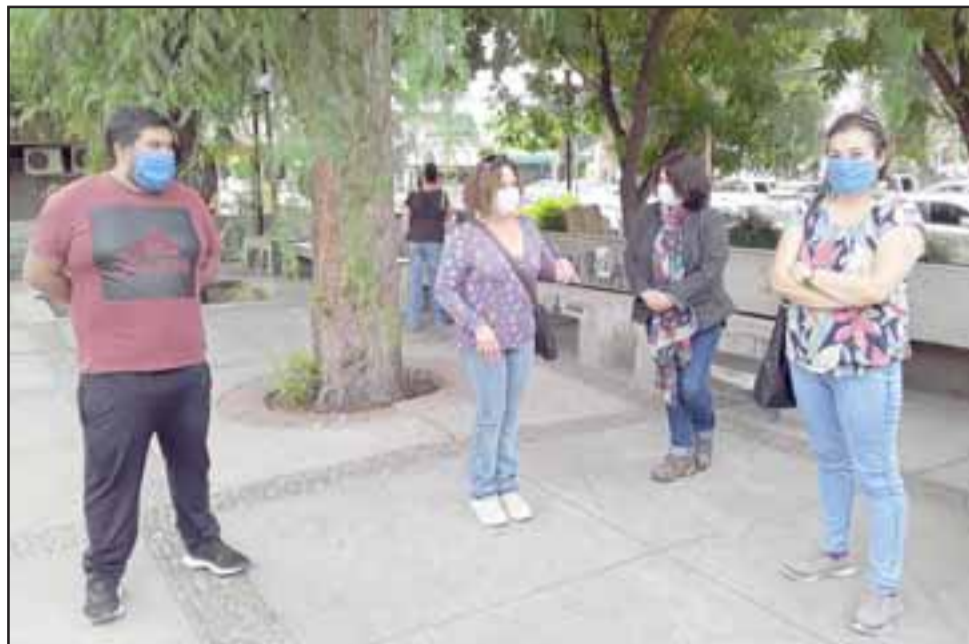
Cuatro ex trabajadores que están preocupados por la situación actual que están viviendo.

Se despiden atentamente grupo de ex trabajadores Conservera Pentzke.