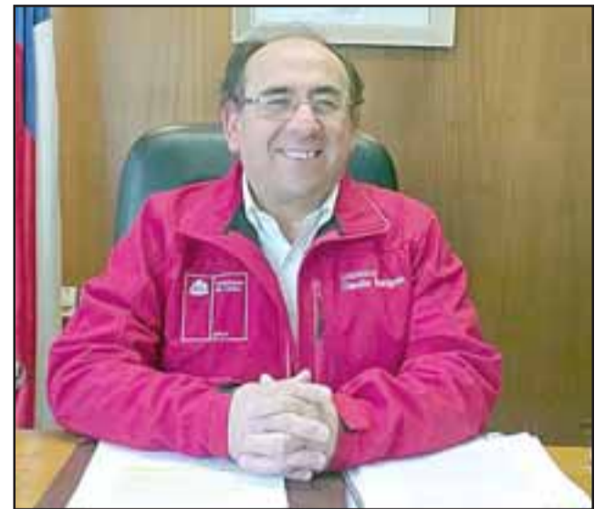
Gobernador de San Felipe Claudio Rodríguez Cataldo.

- Esto no se va a entregar a través de cargas familiares, sino de acuerdo a la composición que tenga cada grupo familiar. Por ejemplo, una familia que tenga cuatro personas y que sea parte del 40% de los hogares más vulnerables, estaría recibiendo esta ayuda equivalente a unos $260.000 mensuales, esto será por tres meses e irá disminuyendo ese valor, pero la idea es ayudar para enfrentar mejor esta crisis. Este es un bono especial que el Gobierno va a entregar en el marco del Plan de Emergencia Económica y tiene como objetivo apoyar a las familias más vulnerables en esta contingencia que estamos viviendo. Por esa razón van a tener acceso a este beneficio las personas que reciben subsidio familiar, quienes recibirán 50.000 pesos por cada causante del subsidio. También recibirán las personas acogidas al Subsistema de Seguridad y Oportunidades que han sido incorporadas hasta el 29 de febrero, quienes recibirán 50.000 pesos por familia; a