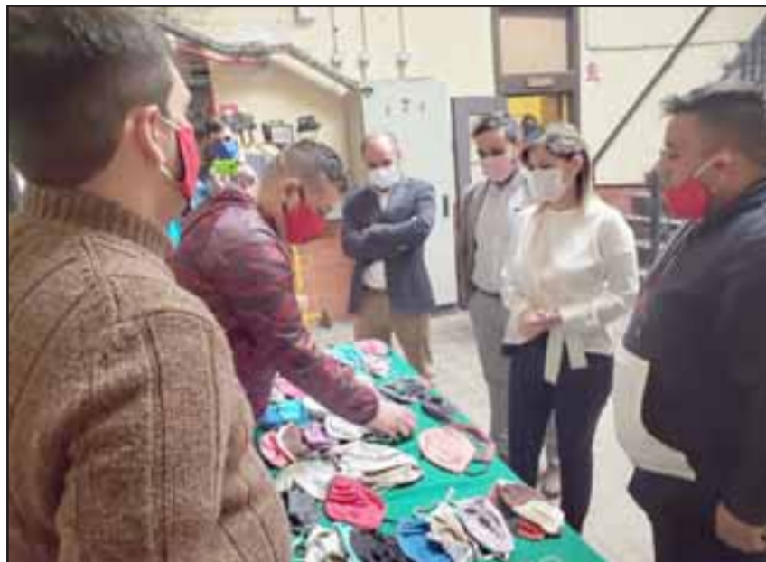
Las mascarillas, que además son lavables, fueron confeccionadas por los internos del CCP San Felipe.