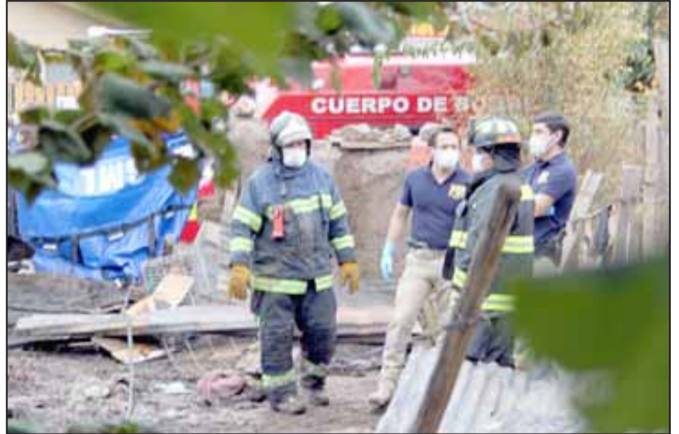
INVESTIGAN TRAGEDIA.- Las cámaras de Diario El Trabajo tomaron registro del accionar de la PDI y Bomberos al interior del inmueble siniestrado.