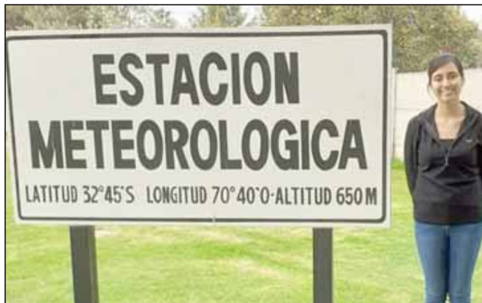
NUEVA VIGILANCIA. - A partir de este año esta joven sanfelipeña es la encargada de atender esta estación.

- Desde inicios del mes de abril las temperaturas mínimas comenzaron a bajar, oscilando entre 6° y 8°C. Mientras que las tempera-