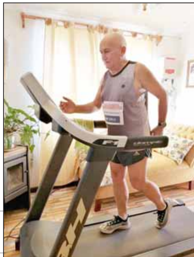
Desde la intimidad de su hogar el fondista sanfelipeño participó en una maratón virtual.

desde el hogar. «Debíamos mandar una foto de la pantalla de la trotadora en el inicio y finalización del kilometraje en que uno se había inscrito. En mi caso 10 K. en esta ocasión no hubo posiciones ni tiempo porque el objetivo era ayudar, pero debo decir que fue una gran experiencia y al mismo tiempo una gran iniciativa para que los runners podamos seguir activos y no sufrir tanto mientras volvemos al asfalto», dijo el atleta máster sanfelipeño.