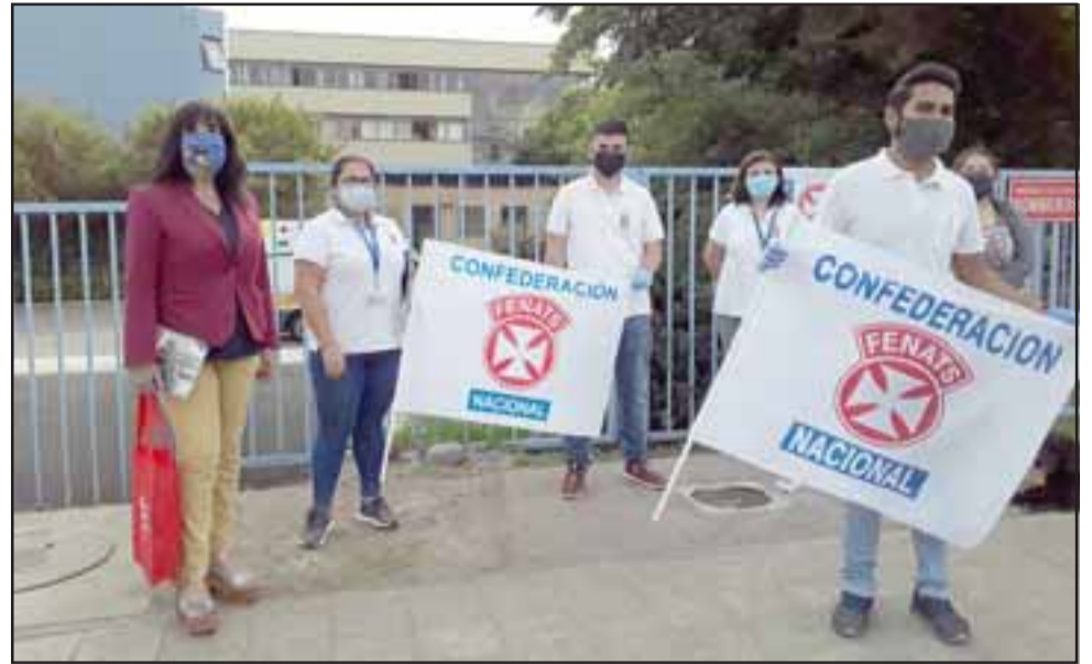
Los dirigentes a nivel provincial se manifestaron este miércoles en las afueras del Hospital San Camilo de San Felipe.

- Por ejemplo, necesitamos que los elementos de protección personal sean entregados por parte del servicio y no por la comuni-