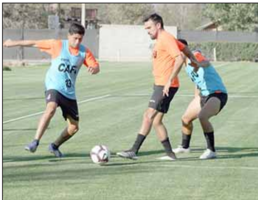
Tal vez en el mes de junio los equipos profesionales vuelvan a entrenar.

poder hacer la Copa Chile, descartándose por ahora que esta competencia no se haga. Si bien es cierto están las ganas y urgencia por volver; todo dependerá del comportamiento del Covid-19.