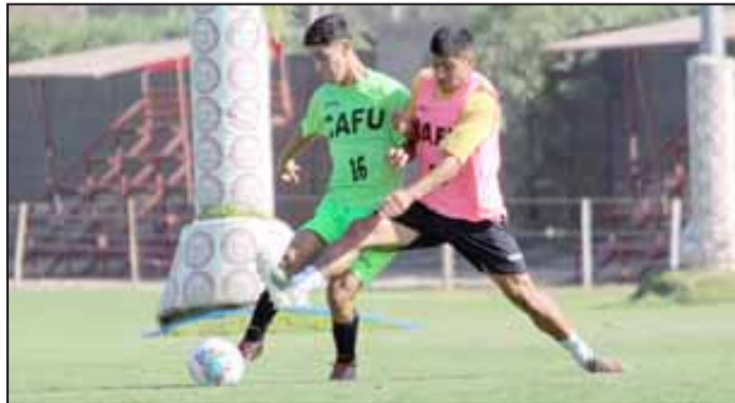
El jefe técnico del área formativa del Uní Uní contó que cada serie del club sigue trabajando.

deben hacer llegar los jugadores», afirmó el estratega, que además contó que tanto los jugadores como los respectivos cuerpos técnicos de cada serie tienen muchas ganas de volver a la cotidianidad una vez que se supere el Covid-19. «Todos tenemos ganas de volver, y cuando llegue ese momento habrá que controlar las ganas y ansiedad de los chicos para que no se vayan a 'pasar de vueltas' y en el entusiasmo se vayan a lesionar algunos», culminó.