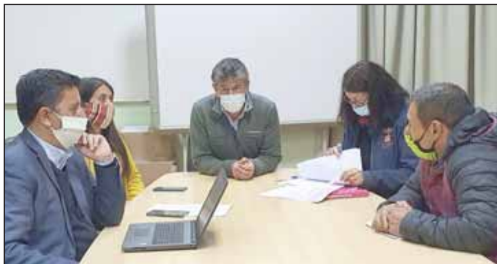
La mesa técnica, mandatada por el alcalde Freire, sostuvo una nueva reunión con los representantes de las ferias de antigüedades y bazares para estudiar otras alternativas que permitan la instalación de los más de 500 locatarios que trabajan los días domingo.

Debido a lo anterior, la mesa técnica, mandatada por el alcalde Freire, sostuvo una nueva reunión con los representantes de las ferias de antigüedades y bazares para estudiar otras alternativas que permitan la instalación de los más de 500 locatarios que trabajan los días domingo.