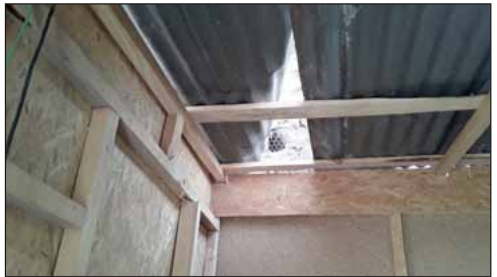
Por este forado se supone que ingresaron el o los delincuentes.

Al momento de conversar con nuestro medio, trabajadores estaban reforzando una de las paredes para evitar que ingresen sujetos a robar.