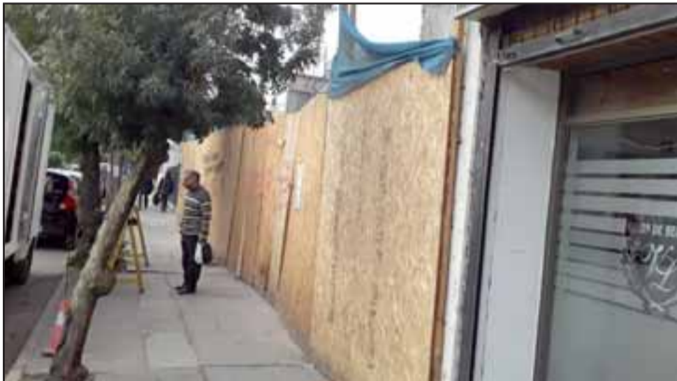
Este es el frontis de la construcción en calle Merced, la cual una vez más fue víctima de robo pese a encontrarse en pleno centro de la ciudad.