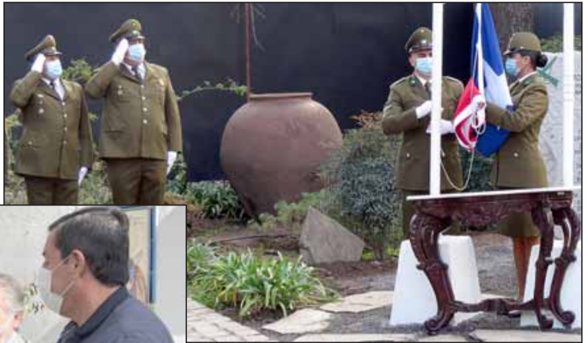
CUMPLEN 93 AÑOS. - El Saludo a la Bandera se realizó en horas de la mañana en la Segunda Comisaría de San Felipe y Prefectura Aconcagua.

Las actividades fueron sobriamente básicas, el izamiento y saludo a nuestra Bandera en horas de la mañana, momentos en los que los altos mandos de la institución realizaron una breve intervención para destacar la importancia del accionar de Carabineros en beneficio de nuestra sociedad, se cantó el Himno Nacional y el de Carabineros.