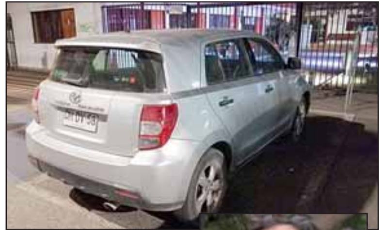
RECUPERADO. - Este es uno de los autos recuperados por Carabineros este fin de semana en un control sanitario en Cuesta Chacabuco.

Según explicó Guzmán a Diario El Trabajo , la modalidad de