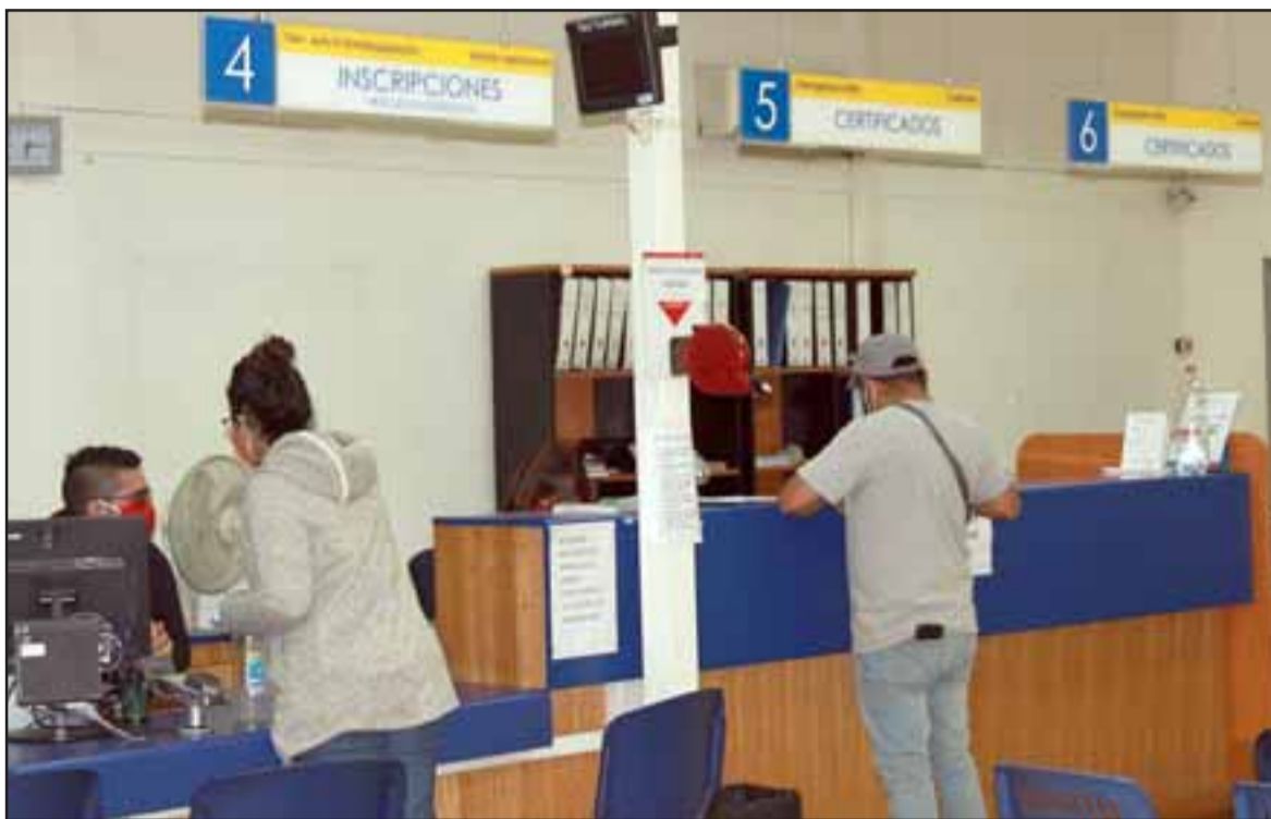
A MEDIO GAS.- Las cámaras de Diario El Trabajo tomaron registro del movimiento en el Registro Civil de San Felipe.

- ¿Y el tema de cédulas y pasaportes vencidos?