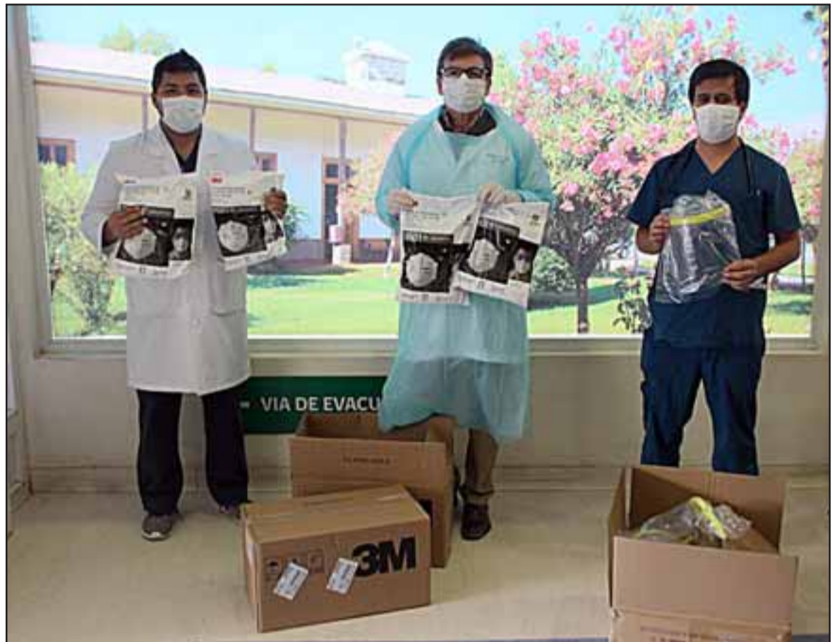
Fundación Luksic y el Consejo Regional Aconcagua del Colegio Médico, hicieron entrega de mil mascarillas KN95 y 25 escudos faciales al Hospital San Antonio de Putaendo.

La instancia concluyó con un recorrido por las instalaciones del Hospital San Antonio de Putaendo, ocasión en la que el dirigente gremial destacó la calidad de las dependencias.