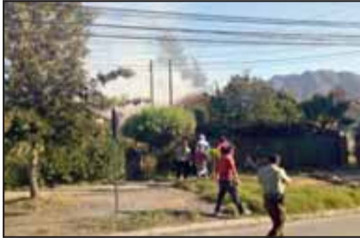
Vecinos escucharon una explosión y luego humo

Afectado sufrió graves quemaduras en el cuerpo