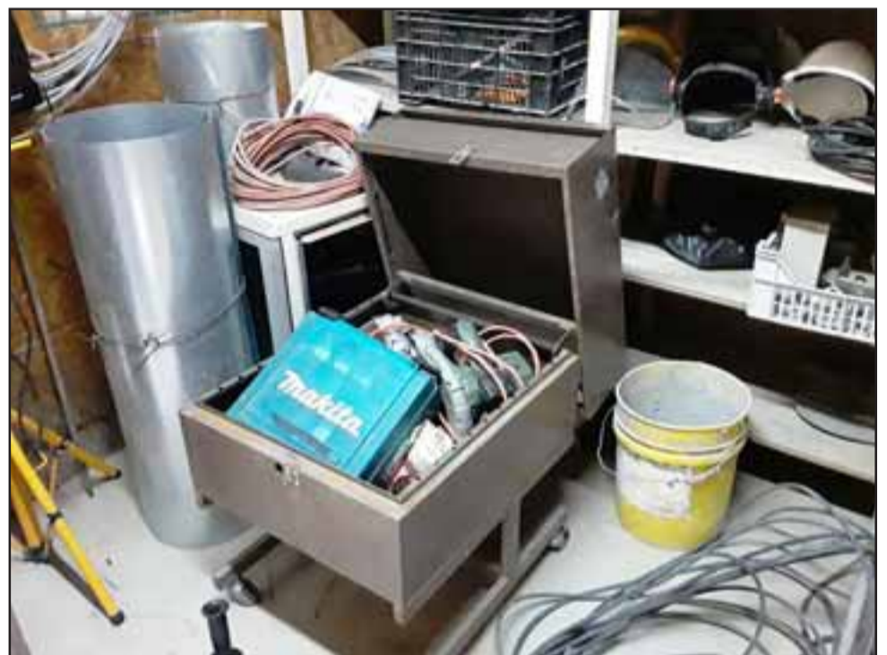
Las herramientas se encontraban guardadas en cajas, las cuales fueron sustraídas.