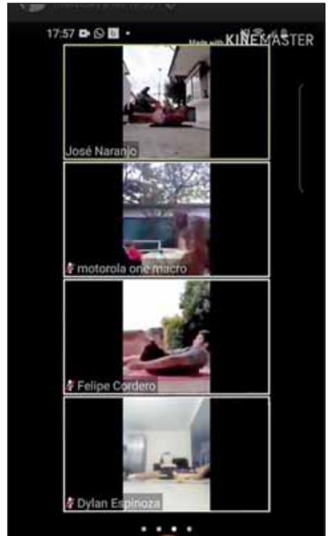
Las series de San Felipe Basket entrenan en la actualidad vía Zoom.