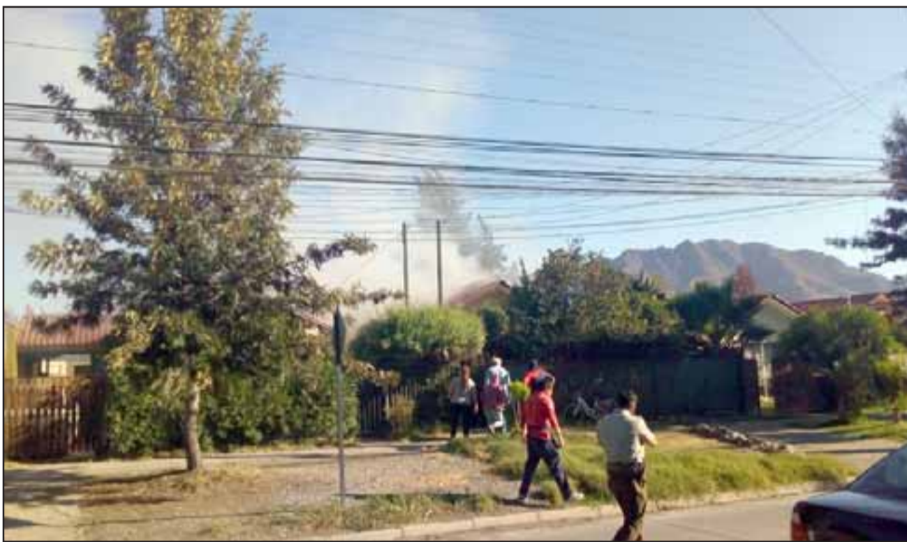
Vecinos escucharon una fuerte explosión y luego se percataron que de la vivienda salía abundante humo.

Reiteró que la primera información fue que se sintió una fuerte explosión en el interior de la vivienda, provocando daños de consideración al inmueble; «toda la parte de la techumbre, en el interior habían unos muebles, unos colchones, tuvimos que romper algunas puertas, mamparas, para poder ingresar y trabajar en el control de este incendio», señaló Herrera Lillo.