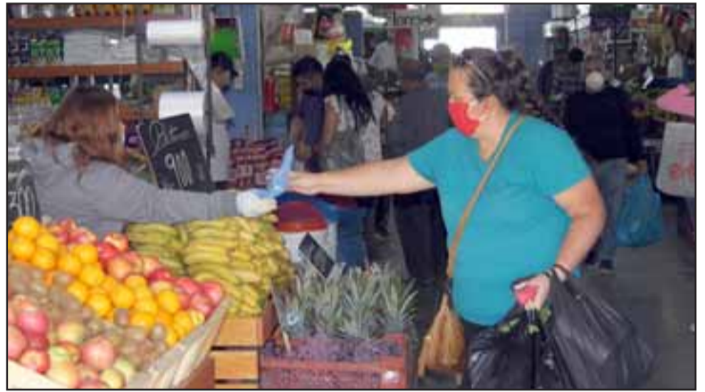
TODOS A FLOTE. - La clientela fiel que estos locatarios tienen les ha permitido mantenerse a flote económicamente pese a la adversidad.