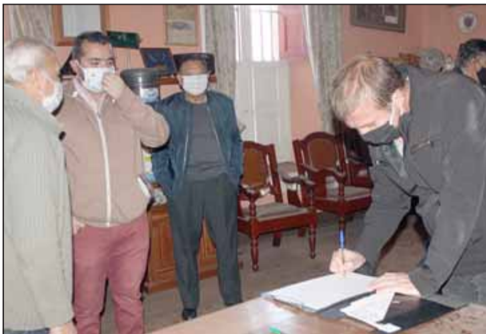
POR FIN.- El receptor judicial hizo personalmente la entrega del inmueble a sus legítimos dueños.