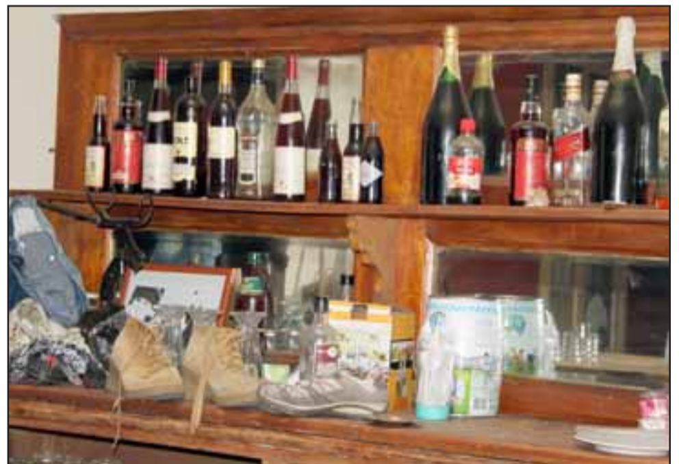
TUDO ABANDONADO.- Mucha basura y desorden es lo que se encontraron los socios al interior del inmueble.