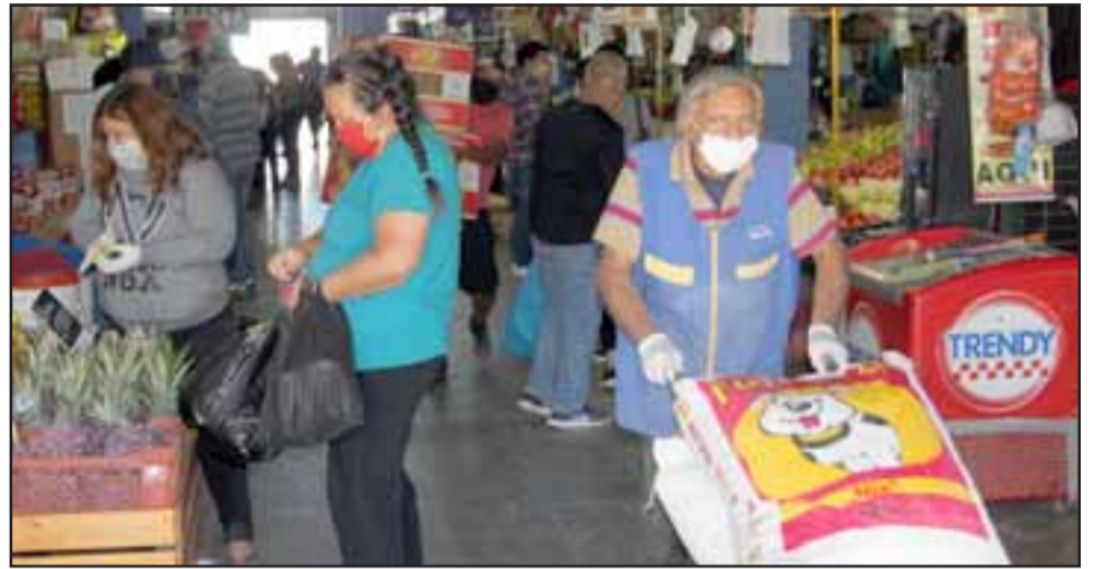
LIMPIA Y ORDENADA. - El movimiento en esta feria sigue activo, aunque no tanto como en abril, según indicó nuestro entrevistado.