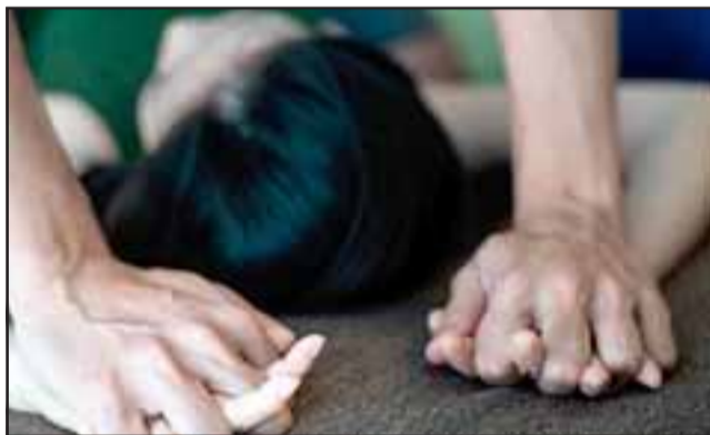
BRUTAL ULTRAJE.- El sujeto ingresó al dormitorio y aprovechándose de su contextura física procedió a violentar sexualmente a la niña. (Referencial)

menor de edad, la magistrado Valeria Crosta dictó en su contra la medida cautelar de Prisión Preventiva por los cinco meses que durará la investigación. El depravado fue derivado hasta la Cárcel de Petorca en donde permanecerá recluso.