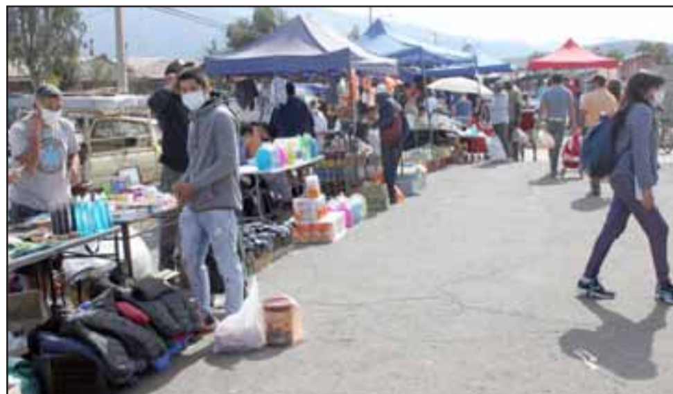
Ayer domingo se instalaron Bazar y Paquetería; mientras que el domingo 10 de mayo lo hará la Feria de Las Pulgas.

«El llamado es cumplir con las normas, en el uso de la mascarilla, el lavado de