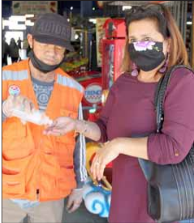
LIMPIEZA PRIMERO. - Aquí vemos a este empleado de la feria, aplicando alcohol gel a quienes visitan el lugar.

Las cámaras de Diario El Trabajo tomaron registro del movimiento en esa feria, no había mucha gente, lo que coincide con las palabras del dirigente en el sentido que esta semana sí están algo bajas las ventas.