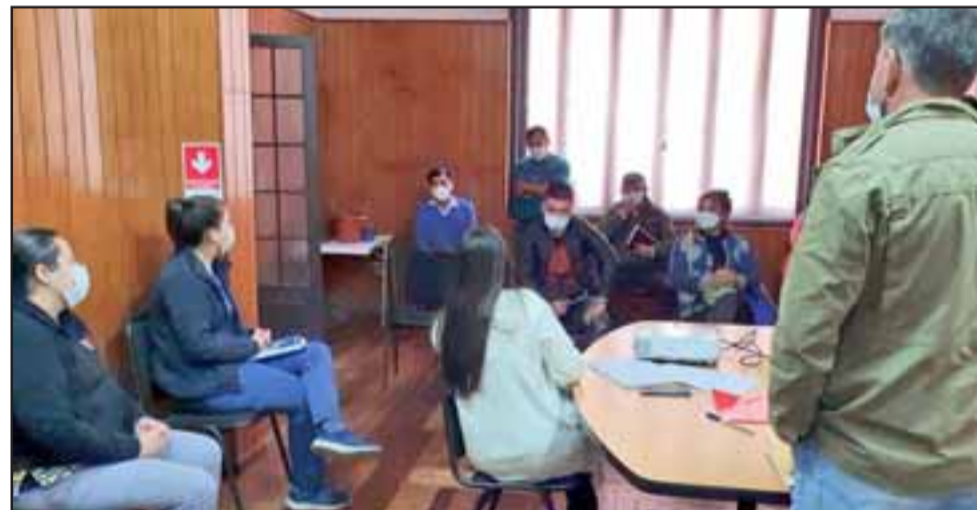
Finalmente el diálogo dio sus frutos en esta Mesa de Trabajo con los feriantes de nuestra ciudad.

decir a todos los funcionarios municipales y de salud, quienes se comprometieron para llegar a un consenso. Me voy muy feliz».