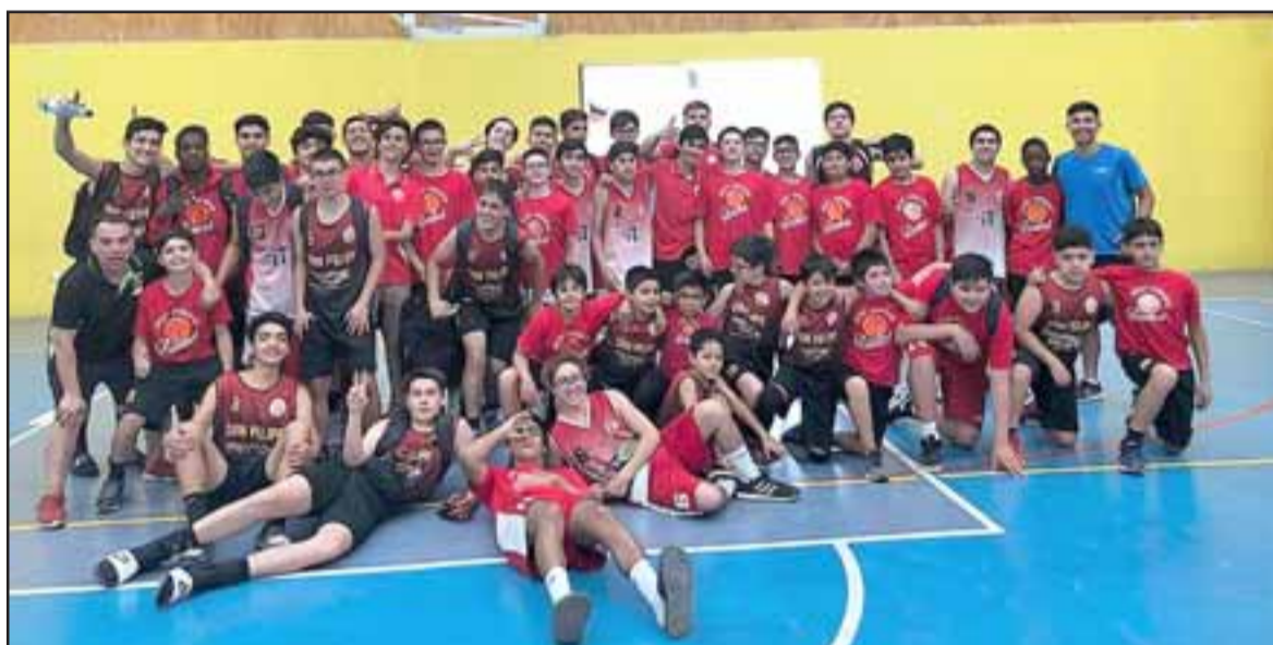
Cuando se vuelva a la normalidad el club San Felipe Básquet tendrá que hacer frente a una serie de desafíos.