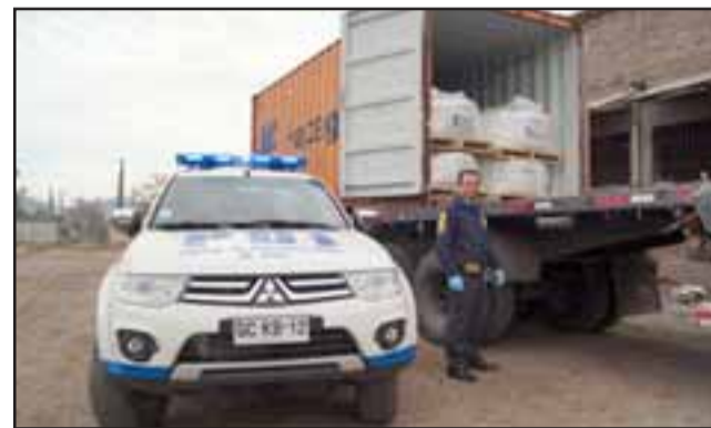
El vehículo fue recuperado por la Brigada de Robos de la PDI en San Felipe.

Con estos antecedentes los detectives de la Biro llegaron hasta una bodega en la comuna de San Felipe, donde fue incautado el camión y la totalidad de la carga. En primera instancia tanto el conductor y su cómplice fueron detenidos de Hurto Agravado, pero el Fiscal de Turno dispuso que quedaran en libertad a la espera de ser citados a declarar.