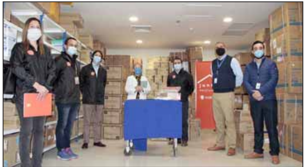
La primera entrega de Codelco Andina consistió en 4.000 mascarillas, 10.000 guantes y 30 caretas faciales que buscan ofrecer mayor protección a los funcionarios de la salud.

ción asistencial del Servicio de Salud Aconcagua, recaló que esta actividad es una forma de generar una mejor atención para los pacientes y un mejor trabajo para los funcionarios de salud: «Podemos decirle a nuestros trabajadores que estamos en condiciones de entregarles todo lo que ellos requieran para realizar su trabajo en buenas condiciones».