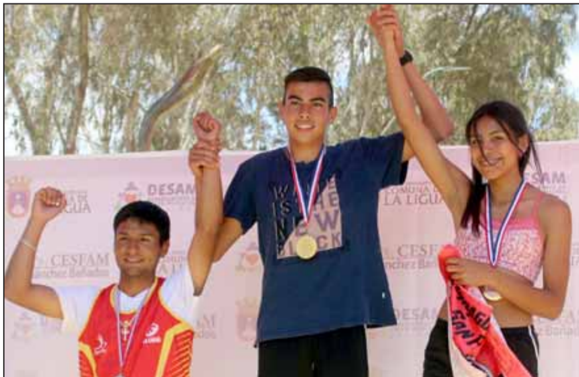
ESPERANDO SU MOMENTO. - Una de las mejores atletas del valle y promesa deportiva para esta década.