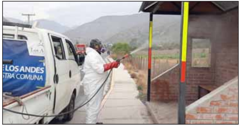
Plan de sanitización se reforzará durante todo el mes de mayo.