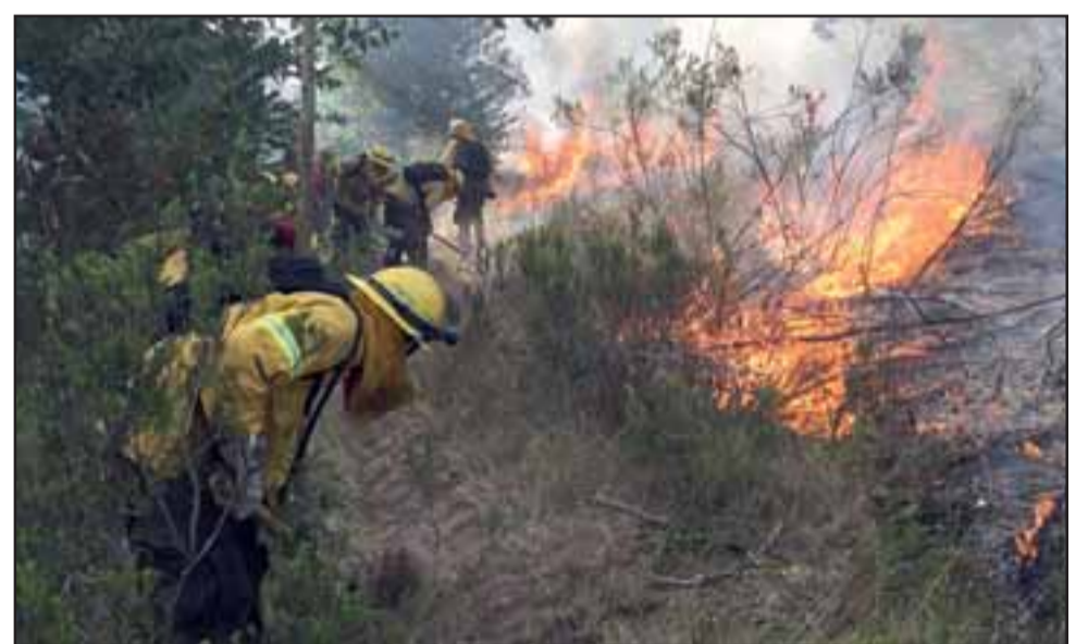
Hasta el 31 de mayo se prolongó la prohibición de realizar quemas agrícolas controladas en el valle de Aconcagua y toda la región de Valparaíso.

La suspensión del calendario de avisos de quemas controladas, que administra Conaf de acuerdo al Decreto Supremo N° 276/1980, del Ministerio de Agricultura, originalmente culminaba el 31 de marzo de 2020, en la región de Valparaíso. No obstante, debido a la amenaza de los incendios