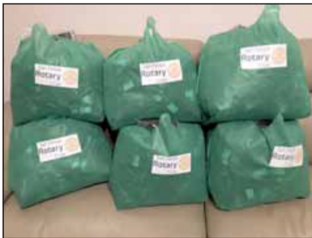
JUSTO A TIEMPO.- Todas estas mascarillas apoyarán el trabajo diario del personal del SSA.