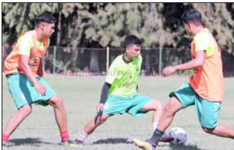
Trasandino no pudo escapar a la realidad de la división y ya sufre los efectos de la crisis del Coronavirus.