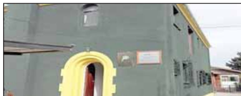
A pesar del Covid – 19, los funcionarios de ARFA Quinta tienen asegurado su lugar de trabajo.

que con mucho sentido social se la está jugando por conservar el puesto de trabajo a cada uno de sus trabajadores. «Nuestros cinco funcionarios fueron enviados a sus casas con goce de sueldo completo. No haremos uso de ninguna de las leyes que están saliendo en el último tiempo. Los trabajadores de ARFA Quinta seguirán en sus hogares hasta que la emergencia dure, ya que lo primero es su salud, ya que a la vuelta queremos reencontrarnos con todos y que no falte absolutamente