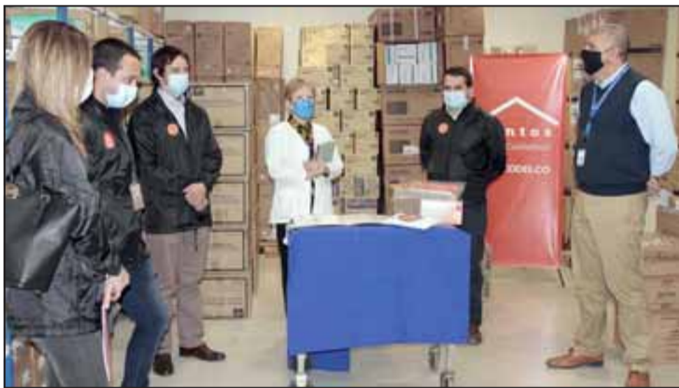
El aporte del plan desarrollado por Codelco permitirá que los servicios de salud del valle cuenten con la protección necesaria para desarrollar sus labores.

cuidamos', vamos a entregar apoyos adicionales en las próximas semanas para el manejo de esta pandemia que ha sido bastante compleja, lo que nos permite estar junto a la comunidad, a nuestras familias y nuestros trabajadores, y así enfrentar unidos esta emergencia que afecta al país y al mundo».