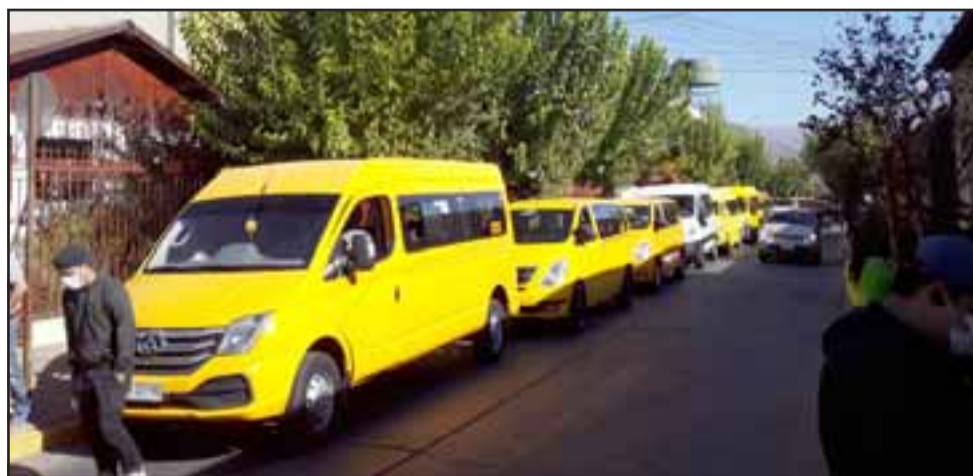
La Caravana de furgones escolares detenida en calle Freire, frente al Colegio Santa Juana de Arco.