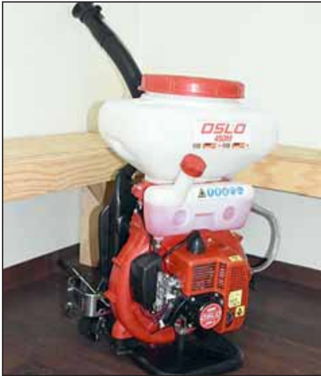
Atomizador Oslo, nueva maquinaria de la Municipalidad de Los Andes para mejorar proceso de sanitización.

El plan incorpora a hogares de ancianos, de menores, terminales de locomoción colectiva menor y superior, tiendas y comercios, edificios de departamentos, gracias a la adquisición de nueva maquinaria municipal.