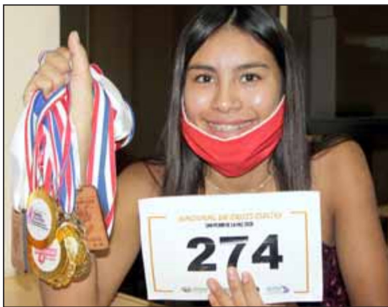
LA CHICA DE ORO. - La joven atleta sanfelipeña visitó nuestra Sala de Redacción para compartir con nuestros lectores su quehacer deportivo ahora en cuarentena.

- ¿Y cómo va tu rendimiento, te mantienes o bajaste?