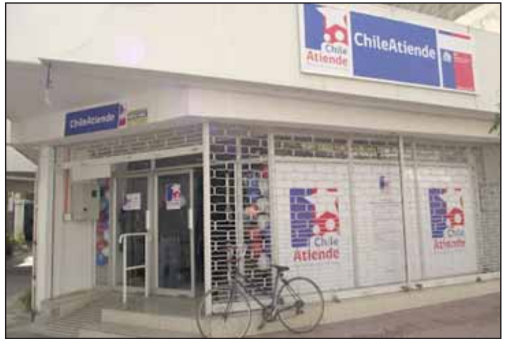
En Los Andes son 7.489 los beneficiados, en tanto en San Felipe son 13.709 personas.