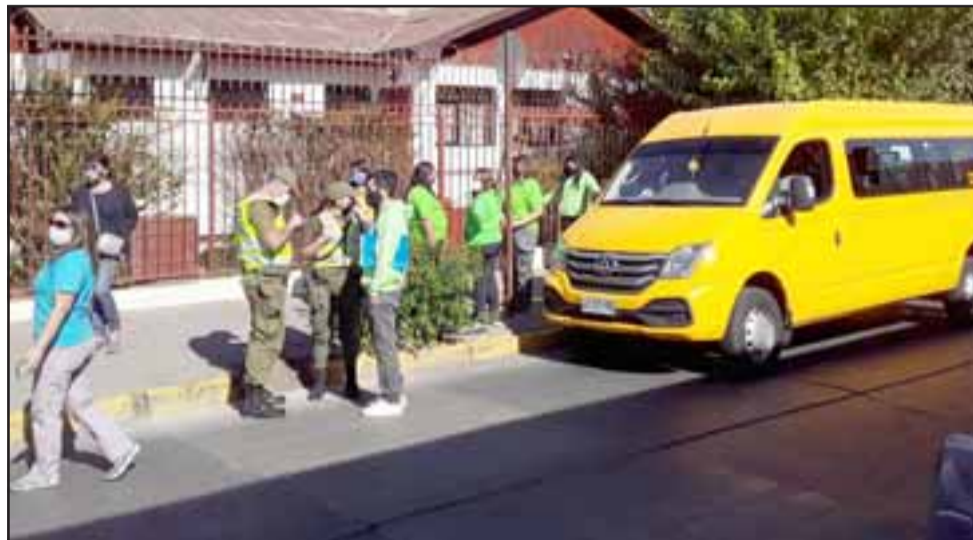
El momento en que Carabineros le cursa un parte a uno de los tíos del transporte escolar.

En cuanto al motivo de la caravana, Contreras explicó que tiene que ver con «llamar la atención por lo que estamos viviendo, lamentablemente estamos con brazos cruzados, lleva-