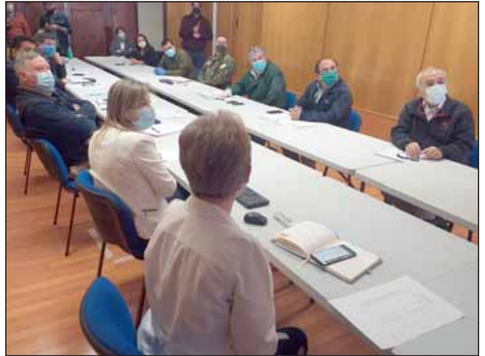
Una reunión de coordinación sostuvieron la mañana de este jueves el gobernador de San Felipe con autoridades de Salud, Ejército, Carabineros, y los alcaldes de la provincia.