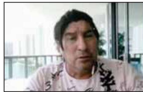
Desde su residencia en Miami, Iván Zamorano dialogó vía Zoom con parte de las series cadetes del Uní Uní.

Los cadetes unionistas pudieron entender que para triunfar en el fútbol es fundamental tener confianza en sus me-