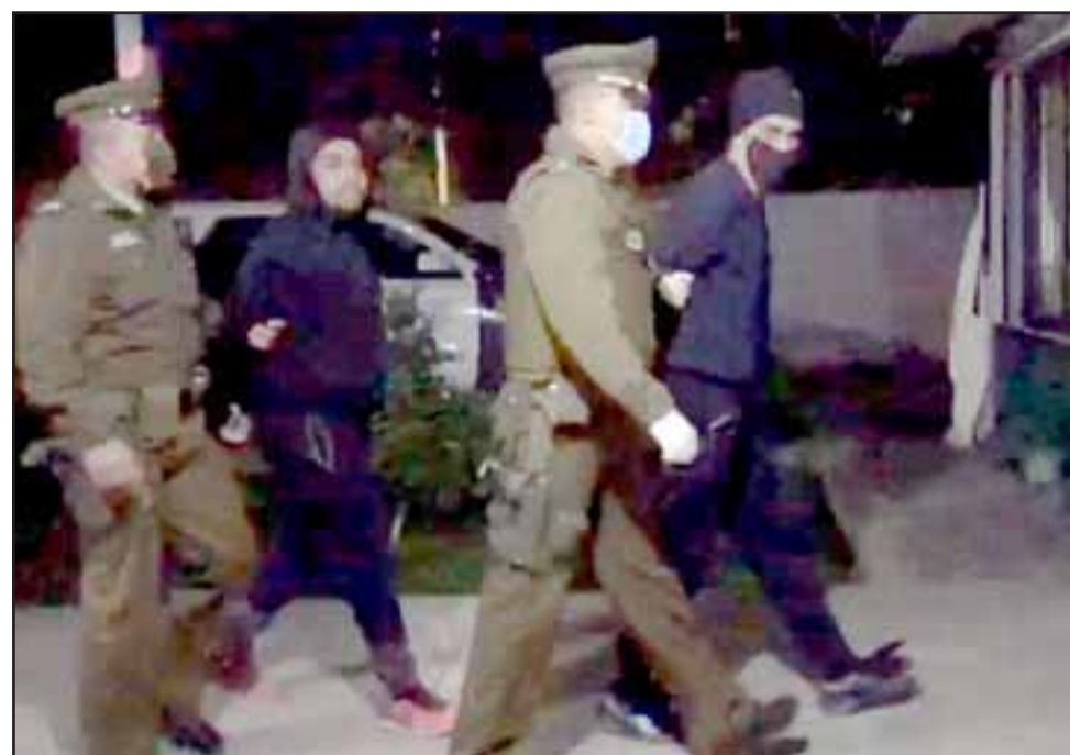
Carabineros conduce a dos de los detenidos acusados de secuestro, hasta las dependencias de la unidad policial de Santa María.