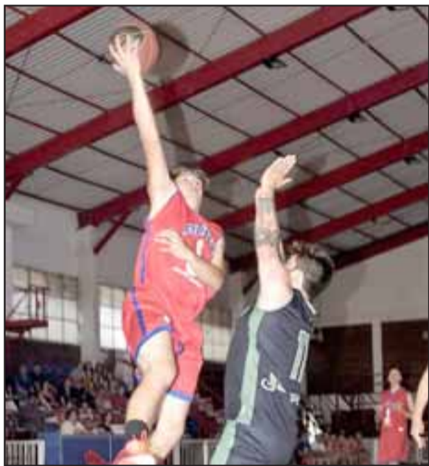
El alto que impuso la pandemia del Covid-19 ha permitido que la gente del básquetbol sume conocimientos teóricos.