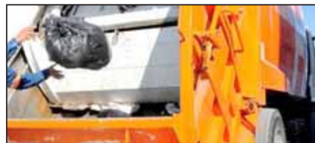
El municipio dispuso del pago online, a través de la página www.munisanfelipe.cl y también presencial, en la oficina de Tesorería, de lunes a viernes, de 08.00 a 13.00 horas.

teléfonos 34 2 509 069, 34 2 509 100, 34 2 509 086 ó al mail mguerra@munisanfelipe.cl