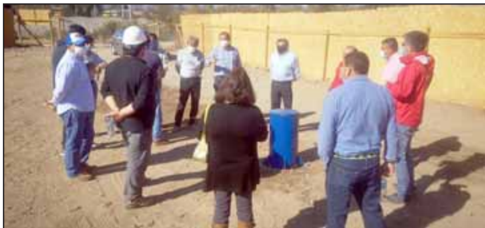
El diputado Luis Pardo realizó una visita inspectiva al APR de Bellavista junto al director de Obras Hidráulicas, reuniéndose con dirigentes del sector para informar los detalles y gestiones que se han realizado para concretar la obra.

Cabe destacar que este pozo, para que entre en funcionamiento, solamente falta la instalación de bomba y panel eléctrico, con esto la obra debiese estar comenzando a bombear en el corto plazo.