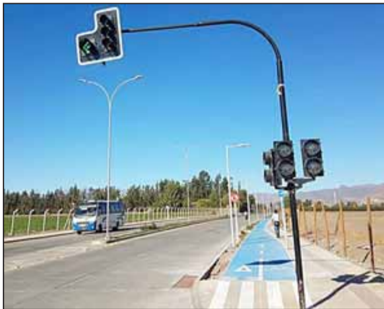
Esto es parte de los nuevos semáforos que incorpora el proyecto de circunvalación, ya que se instalarán también en las intersecciones de Hermanos Carrera Noriente-Yungay y Abraham Ahumada.