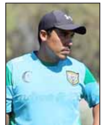
El técnico de Trasandino es enfático en señalar que urge una reunión con los dirigentes del 'Cóndor'.

Respecto a si había plazos para encontrar el diálogo, esto señaló el adestrador andino: "Siempre es importante hablar, más todavía por lo que está pasando en la actualidad, donde todo está tan complicado. Quizás el error