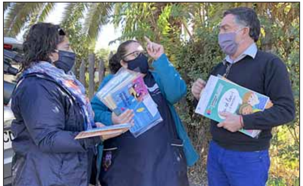
Los docentes junto al director entregaron el material pedagógico durante la mañana de este jueves.

La profesional señaló que en el Cesfam existen seis funcionarios que se encuentran disponibles para la toma del examen, a quienes se suman 16 médicos y enfermeras y kinesiólogos.