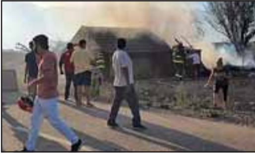
Según vecinos el hijo habría incendiado la casa.

Cuando llegó Bomberos ya la casa estaba destruida