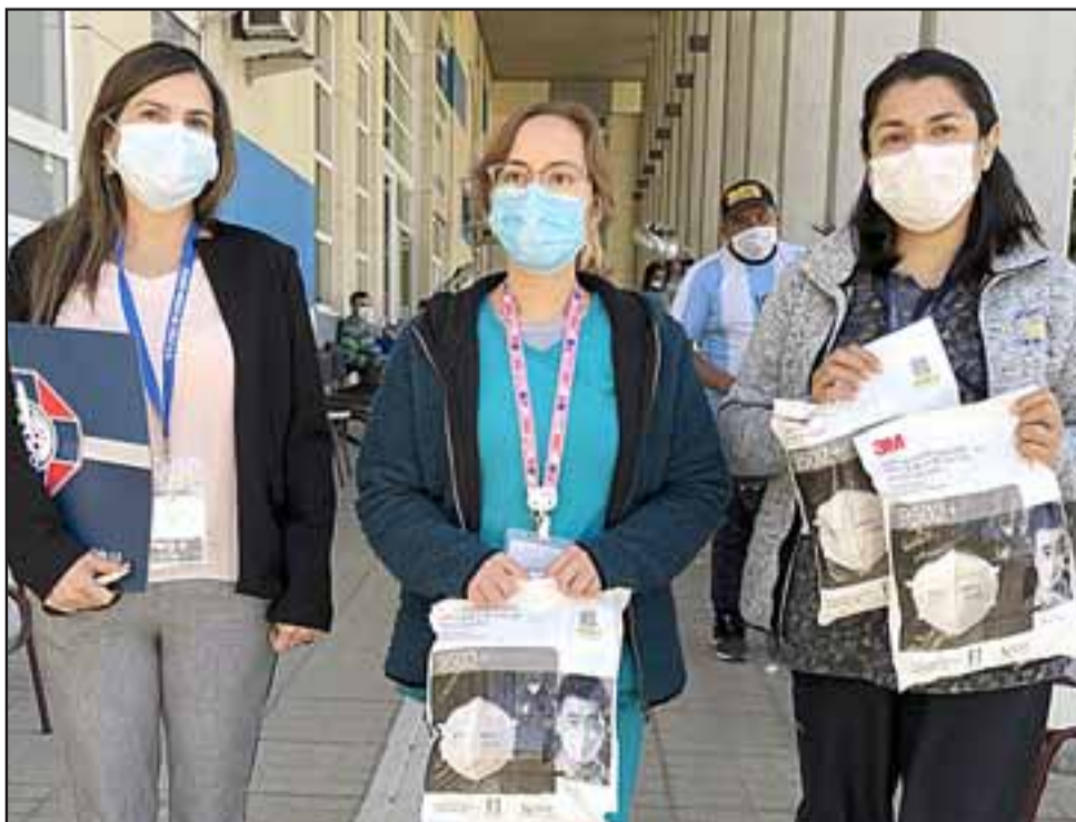
Más de 400 mascarillas KN95 entregó el Regional Aconcagua del Colegio Médico a los Cesfam San Felipe El Real y Segismundo Iturra Taito.

la alternativa, por lo tanto estamos repartiendo los libros», dijo el director.