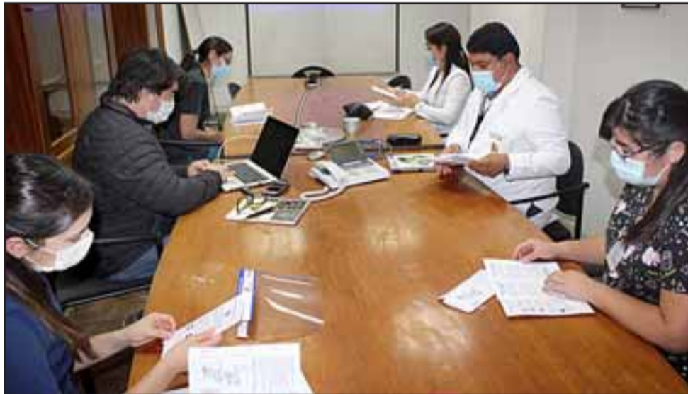
El trabajador que labora en la bodega de Viña Errázuriz y cuyo examen dio positivo, no tiene residencia en Panquehue, sin embargo se aplicó protocolo para descartar infectados.

de trabaja gente de la comuna de Panquehue, entonces lo que queremos nosotros es trabajar en la prevención de estos casos.