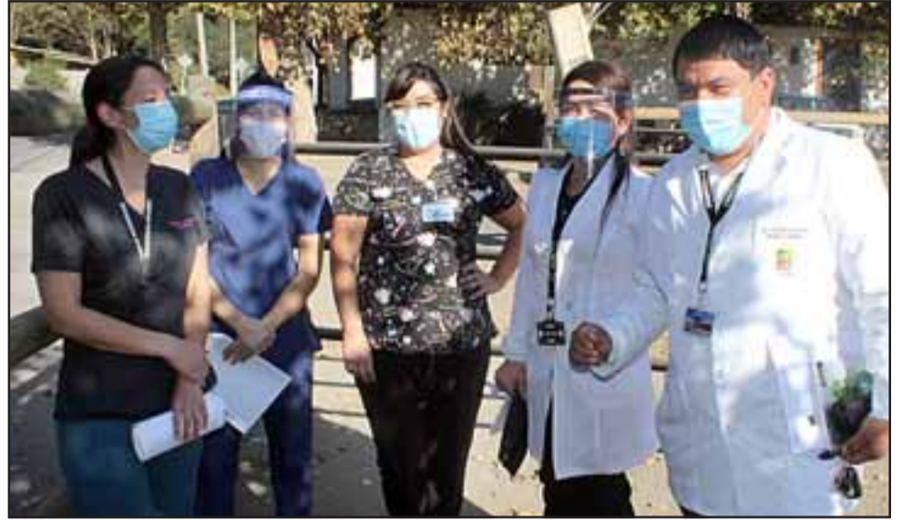
En Panquehue se han adoptado una serie de medidas, apoyadas por profesionales del Cesfam María Elena Peñaloza, con el fin de aplicar un protocolo sanitario.

«Nosotros nos reunimos para poder acompañar y guiar a la empresa, específicamente a la bodega de Viña Errázuriz y poder trabajar articuladamente, pues es una responsabilidad también de salud, independientemente de donde sea el domicilio de la persona, pues hay personas que están vinculadas al tema de contacto estrecho. Por lo tanto, nos toca a nosotros, sabiendo que es una empresa que tiene una gran cantidad de personas, don-