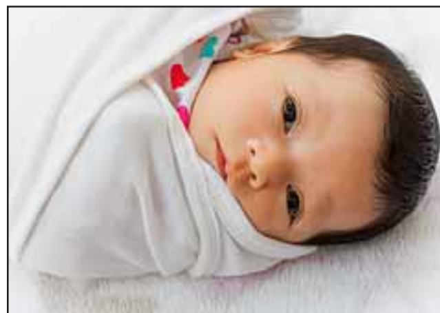
El lunes pasado la guagua fue atendida en su domicilio por una funcionaria de atención primaria y quien luego fue caso positivo para Covid-19. (Foto referencial)

Dada la confirmación del caso positivo de la funcionaria, se da cuenta que el Centro de Salud Familiar se comunicó con los integrantes del equipo de salud que trabajaron con ella y también con los pacientes que fueron atendidos por la profesional entre los días 30 de