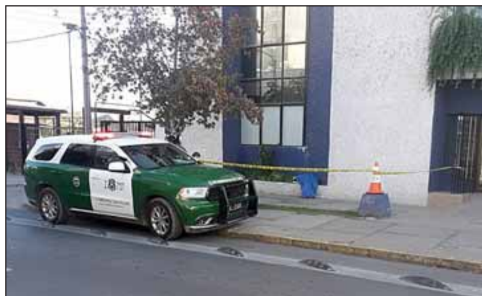
El cuerpo cubierto con una lona de color azul en el edificio del IST de San Felipe.

mayo. Sus restos fueron sepultados en el Cementerio Municipal de San Felipe.