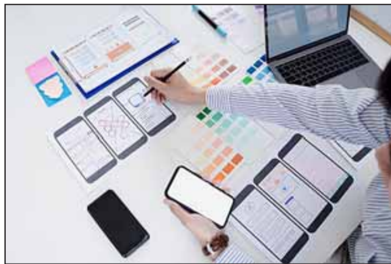
Los cursos son gratuitos y cuentan con un subsidio de $3.000 diarios para transporte o conexión a Internet.

Entre los requisitos del primer llamado 2020 está el que los postulantes puedan estudiar en las regiones Metropolitana, Valparaíso y