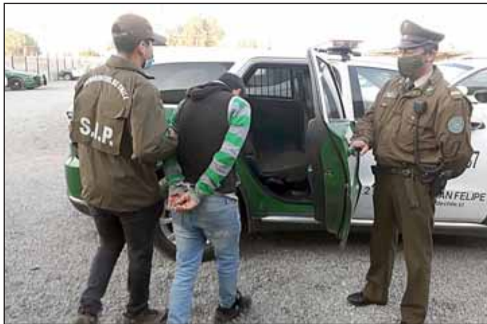
En las imágenes se puede apreciar a ambos imputados en momentos que son subidos al carro policial para ser trasladados al juzgado de garantía de San Felipe.