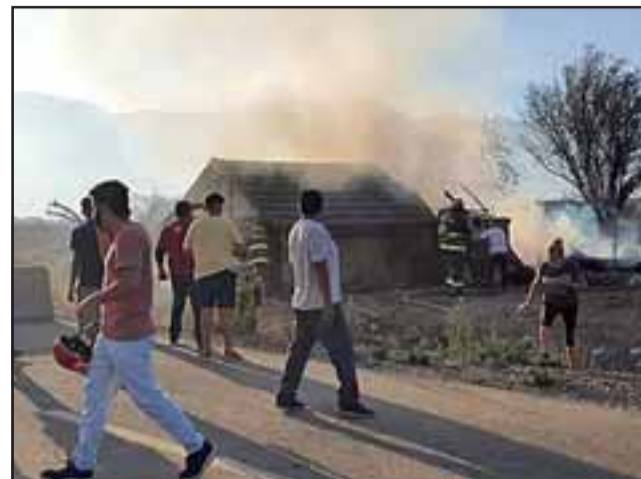
Bomberos trabajando en el lugar, mientras vecinos observan la vivienda siniestrada.

tuar violento de un sujeto que vive en las cercanías, el cual ingresó a ver a la dueña de la casa y luego se enfrentó con personal de Bomberos e incluso lanzó algunos puñetazos, siendo de todas maneras reducido y sacado posteriormente por Carabineros. Del hijo de la propietaria no se supo nada en ese momento, presumiendo que arrancó del lugar. Todos los antecedentes puestos a disposición del Ministerio Público.