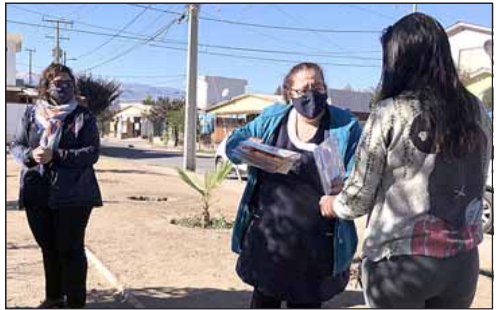
Así, el material disponible llegó a cada casa de estudiantes de esta pequeña escuela.

en Curimón, otros profesores partieron en un auto en forma simultánea, hay otro que fue a Tierras Blancas, más rato seguimos hacia el sector de El Rincón y Bucalemu y otro auto fue a San Felipe porque tenemos alumnos de todos los sectores, entonces cada vez que nosotros planteábamos que había que ir a buscar guías a la escuela, nos dábamos cuenta que no todos tenían