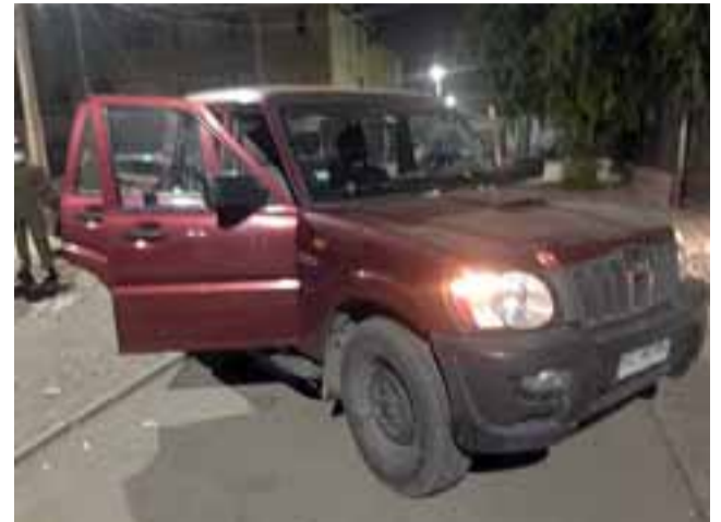
Esta es la camioneta que fue recuperada por personal de la SIP de la Segunda Comisaría de Carabineros.