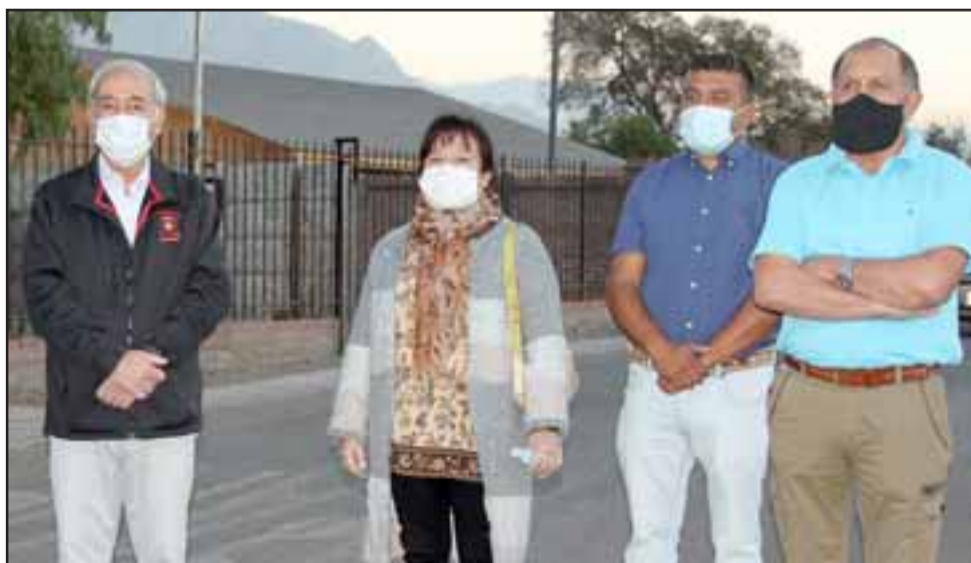
FRENO A LA COVID-19.- Vecinos, autoridades y la empresa privada unen esfuerzos para que el Coronavirus no avance en Bellavista.