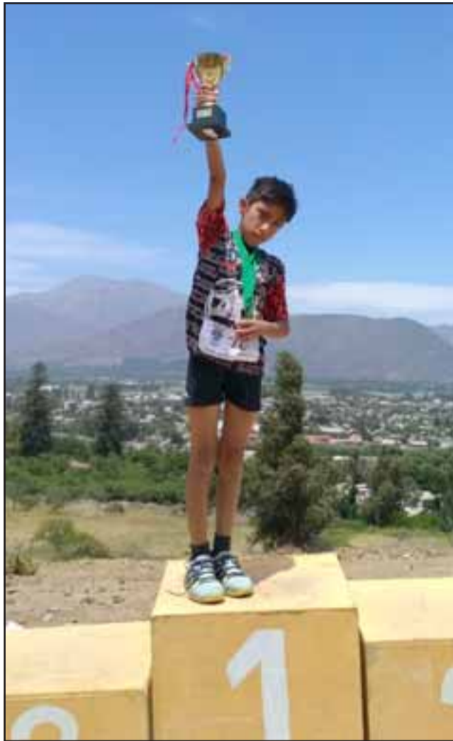
NUUESTRO CAMPEÓN. - Aquí lo vemos de primer lugar en una de sus tantas corridas a nivel de V Región y Santiago.

Seguimos hoy compartiendo con nuestros lectores entrevistas de atletas sanfelipeños en 'Modo Pandemia', o sea, guardando preventiva cuarentena, pero entrenando ocasionalmente para poder estar en forma cuando así lo autoricen las autoridades de Salud. En esta oportunidad queremos