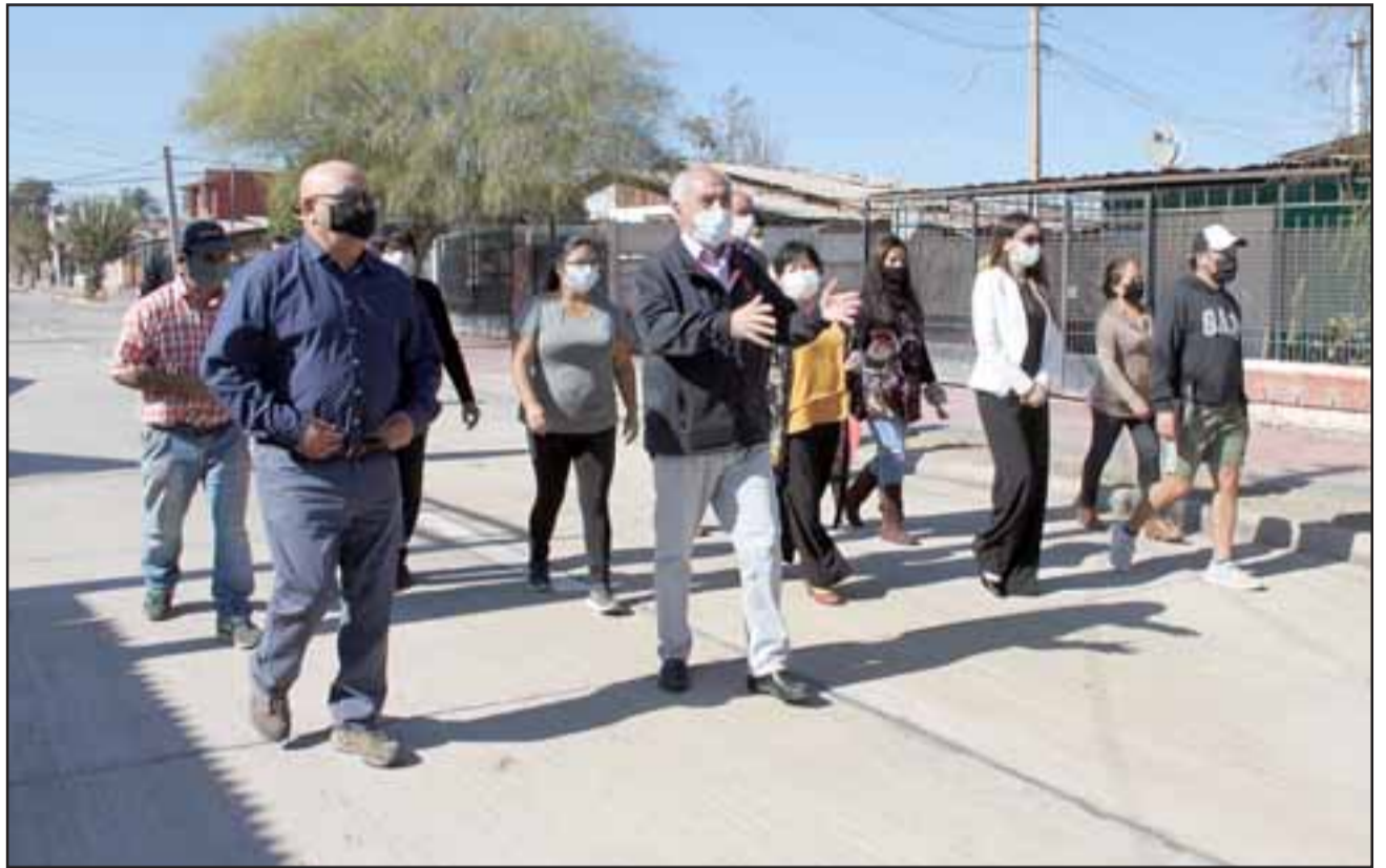
TRAS 40 AÑOS TRAGANDO POLVO.- Hoy se cumplió el sueño de muchos vecinos en sector Chorrillos, cuando su calle principal fue inaugurada y recorrida por autoridades y vecinos.

El alcalde de San Felipe Patricio Freire Canto , comentó a nuestro medio lo siguiente: «Bueno feliz, feliz de estar entregando a los vecinos la calle Chorrillos, son 40 años esperando la pavimentación, estaba lleno de tierra este sector, hoy día se pavimentó, quedó con un perfil muy bonito para esta calle. Esto es posible porque también hay dirigentes empoderados que quieren ver bien sus sectores, van al Municipio y trabajan con nosotros para desarrollar los proyectos de ciudad que necesitamos en nuestra comuna. Hoy día también nos comprometemos a instalar los resaltes que sean necesarios para evitar accidentes. Somos una comuna que avanza a pasos agigantados hacia el futuro. También Hermanos Carrera la tenemos con un perfil maravilloso de calle y viene Michimalongo a doble vía,