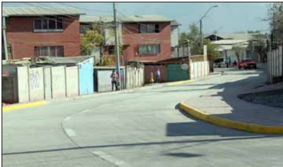
DE PRIMERA.- Así luce la nueva vía, impecable acabado para el disfrute de todos en Población Chorrillos y sectores aledaños.