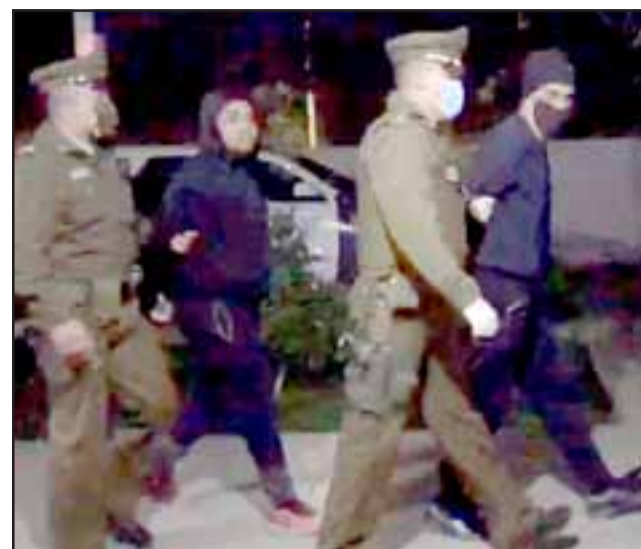
Los imputados quedaron en prisión preventiva tras la audiencia de formalización realizada este domingo.

La incautación estuvo a cargo del personal de la Brigada de Homicidios cuando realizan las diligencias, además de incautar un vehículo, propiedad de uno de los