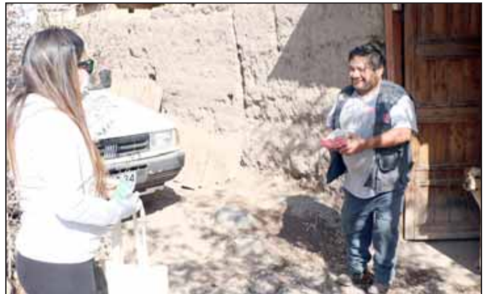
La Municipalidad de Calle Larga organizó la campaña 'Calle Larga Ayuda a Calle Larga', en la que durante diez días funcionarios municipales y voluntarios recorrieron toda la comuna, recolectando alimentos no perecibles.