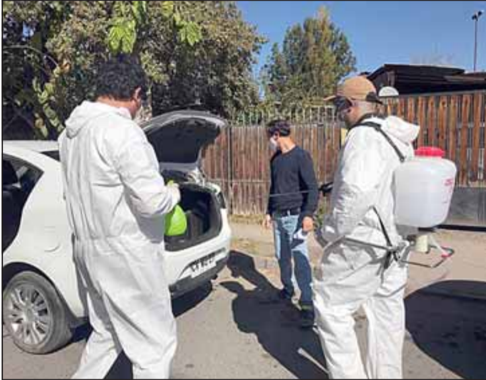
La medida busca ayudar a reducir los riesgos de contagio del Covid-19.

vehículos. En total fueron unos 158 vehículos los sanitizados por el concejal, para de esta forma dar tranquilidad a las personas sobre un posible contagio.