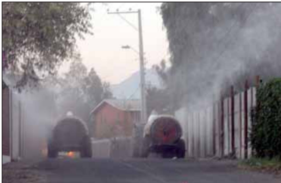
SEMANALMENTE.- Todas las semanas en horas de la tarde-noche los rincones de Bellavista y calles principales son sanitizadas por esta empresa agrícola.