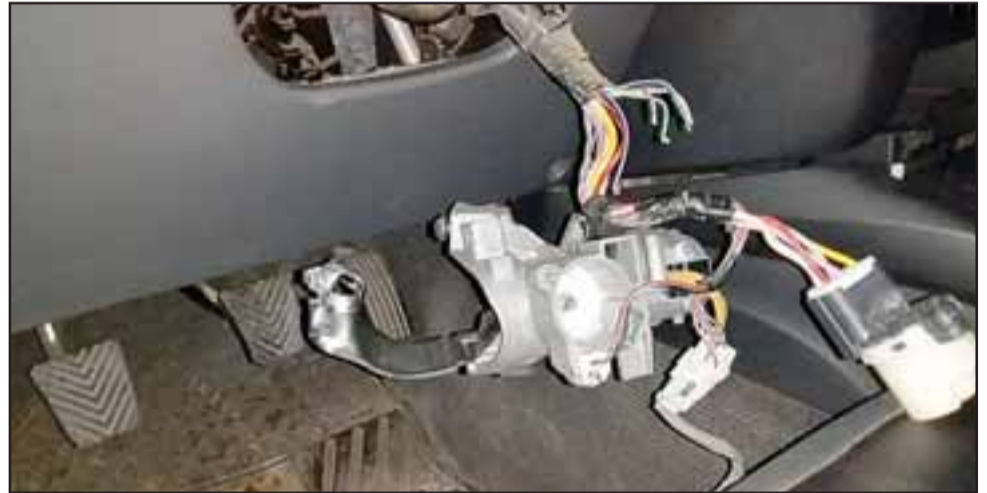
Los juveniles delincuentes causaron varios daños al interior de la camioneta, específicamente en la chapa de arranque.