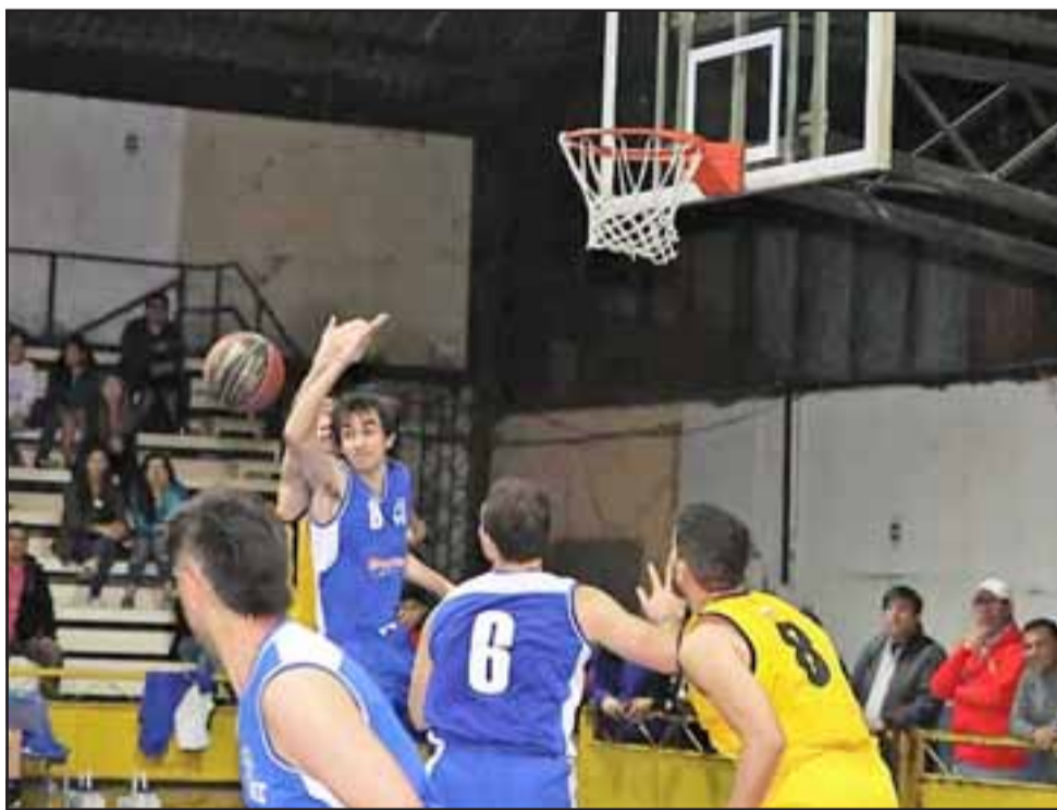
El Prat está a la espera de la resolución si jugará en la Segunda o Tercera División.