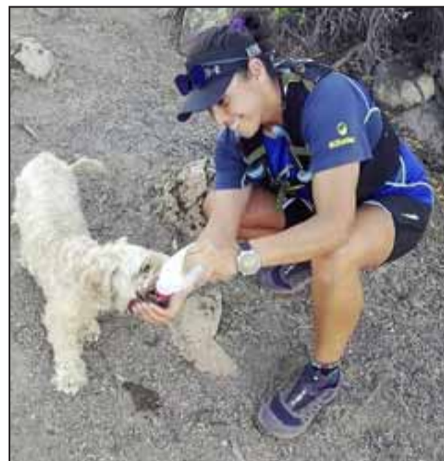
La uno de Chile en el Deporte Aventura añadió a sus entrenamientos diarios actividades recreativas como la lectura, tocar guitarra, escuchar mucha música o pasear a su perro.

pre intento mantener la calma para resistir esto. En lo mental no me afecta estar encerrada, porque tengo una capacidad psicológica muy alta, así que mentalmente no me he visto superada. También siempre estoy haciendo cosas como tocar guitarra, leer y escuchar música; cosas que antes no podía hacer debido a que no tenía el tiempo para hacerlo. Por ese lado puedo decir que estoy hasta contenta, porque he podido reencontrarme con una parte de mí que tenía dejada de lado, y que son muy importantes para el diario vivir», finalizó.