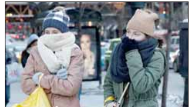
VIENE EL INVIERNO.- En pocas semanas el frío será más inclemente con nosotros, hay que tomar medidas para enfrentarlo.

«Otro punto importante es hablar siempre de Tiempo que es el estado de la atmósfera en un tiempo y lugar determinado (lo que cambia todos los días). El Clima es más permanente y es característico de una región geográfica (el clima de la zona de