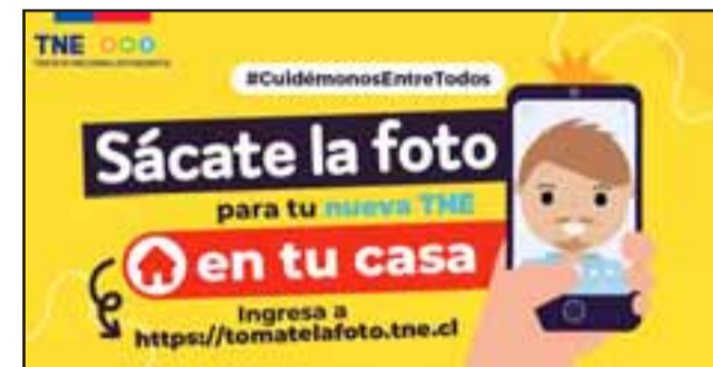
La Junaeb habilitó una plataforma para que los jóvenes puedan tomarse la foto para la TNE desde cualquier dispositivo Android o un computador, sin necesidad de salir de sus hogares.

«No queremos que se siga atrasando la entrega de la TNE, por lo que hacemos un llamado a todos