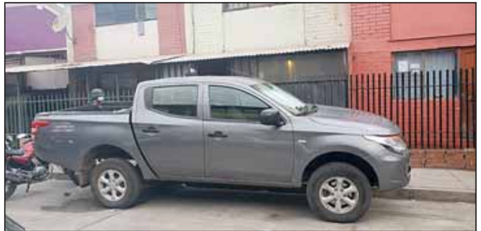
Esta es la camioneta recuperada por personal de la SIP de Carabineros en el sector de Las Cuatro Villas.

Cabe destacar que la camioneta de todas maneras presentaba daños en la chapa y vidrios quebrados.