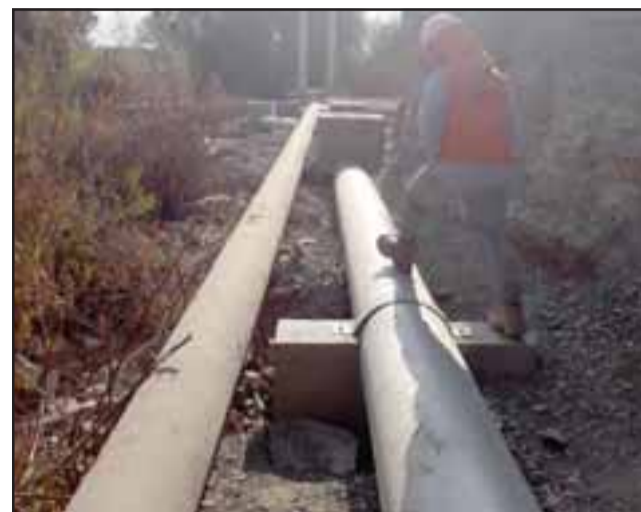
El proyecto tuvo una inversión de $1.300 millones y consideró el mejoramiento de cerca de 2 kilómetros en la red de alcantarillado.

Finalmente, Placencio destacó la coordinación realizada con la Ilustre Municipalidad de San Esteban, a través de su Dirección de Tránsito, y agradeció el apoyo de la autoridad, así como la comprensión de los vecinos mientras se desarrollaron los trabajos.