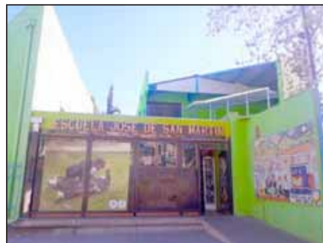
Los docentes de la Escuela José de San Martín han elaborado material de trabajo en relación a los contenidos mínimos que debían ser abordados durante este año académico.

«Estas guías tienen carácter formativo, bajo ninguna circunstancia van a ser evaluadas y solamente nos sirve a nosotros como retroalimentación del trabajo que se ha ido levantando», dijo la directora.