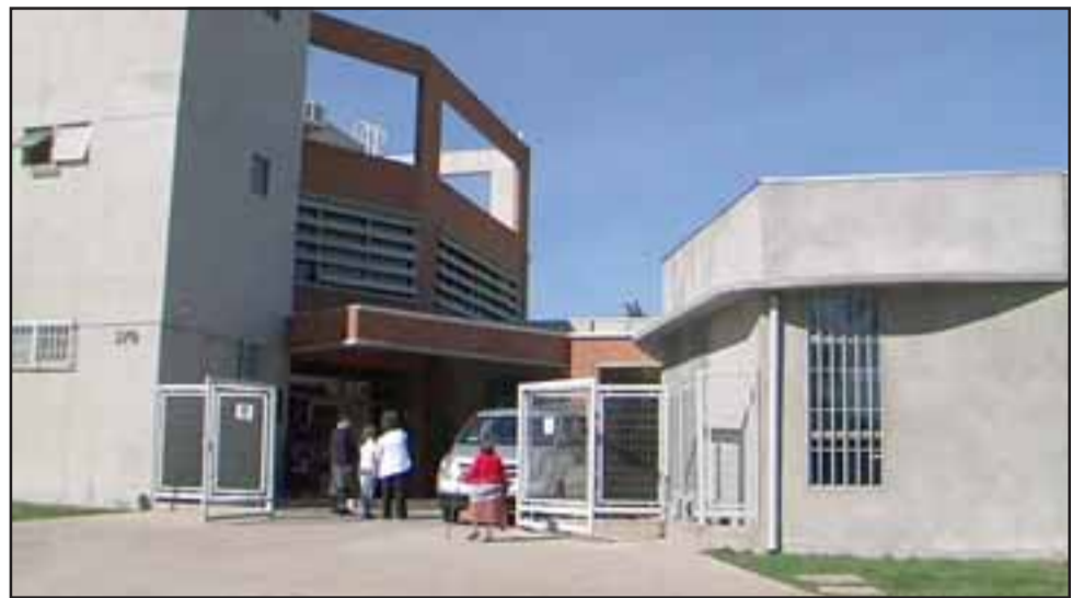
La municipalidad informó que al momento de consultar, la funcionaria no se encontraba en labores presenciales en el Cesfam Segismundo Iturra, por lo cual no estaba realizando atención directa de usuarios(as).

En el Cesfam se han adoptado todos los protocolos indicados por el Ministerio de Salud para asegurar que la atención a los usuarios no se vea afectada por esta situación y así evitar que otros funcionarios re-