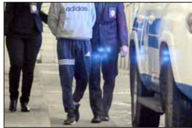
Efectivos de la PDI lograron desbaratar a la banda que asaltó a una empresaria agrícola, robándole la nómina de sueldos. (Referencial)

Los imputados P.L.C. (24), H.L.Q. (25) y la mujer, M.C.S. (36), serán puestos a disposición del Juzgado de Garantía de San Felipe para efectuar el control de detención y formalización correspondiente.