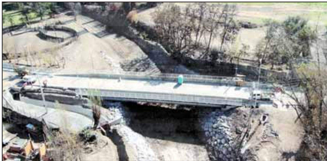
DESDE ARRIBA.- Así lucía la obra hace pocas semanas, estero limpio y obras a punto de ser terminadas. La obra representó una inversión superior a los $2.600 millones.