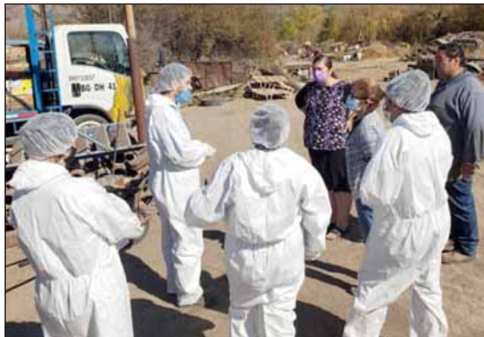
Los profesionales apoyarán a los vecinos en la denuncia por crueldad animal tras encontrar más una docena de animales fallecidos tras ingerir carne con pesticidas, despertando la preocupación de la comunidad.

« Estamos prestando asesoría por esta situación, que lamentamos muchísimo. Los vecinos están muy afectados porque son perros que tienen dueño y ayudaban en la seguridad. Por eso, los estamos apoyando en la denuncia porque constituye un delito por la crueldad en que fueron asesinados », afirmó.