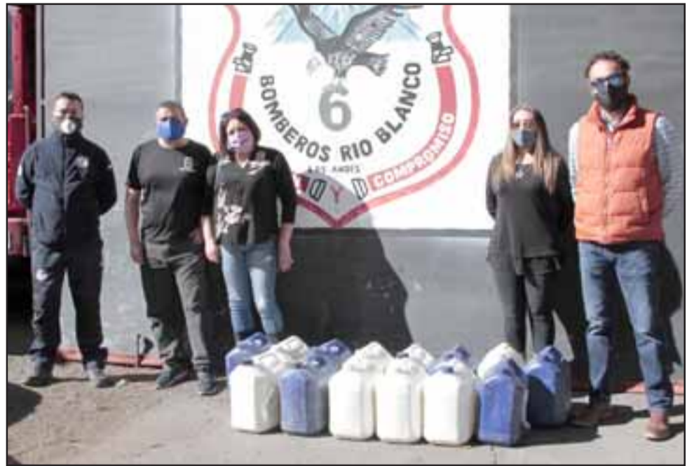
En primera instancia la sanitización se realizará en las localidades de Río Blanco, Bocatmoa y Riecillo, para posteriormente continuar con el resto del Camino Internacional.

La iniciativa fue posible gracias a la mesa de trabajo