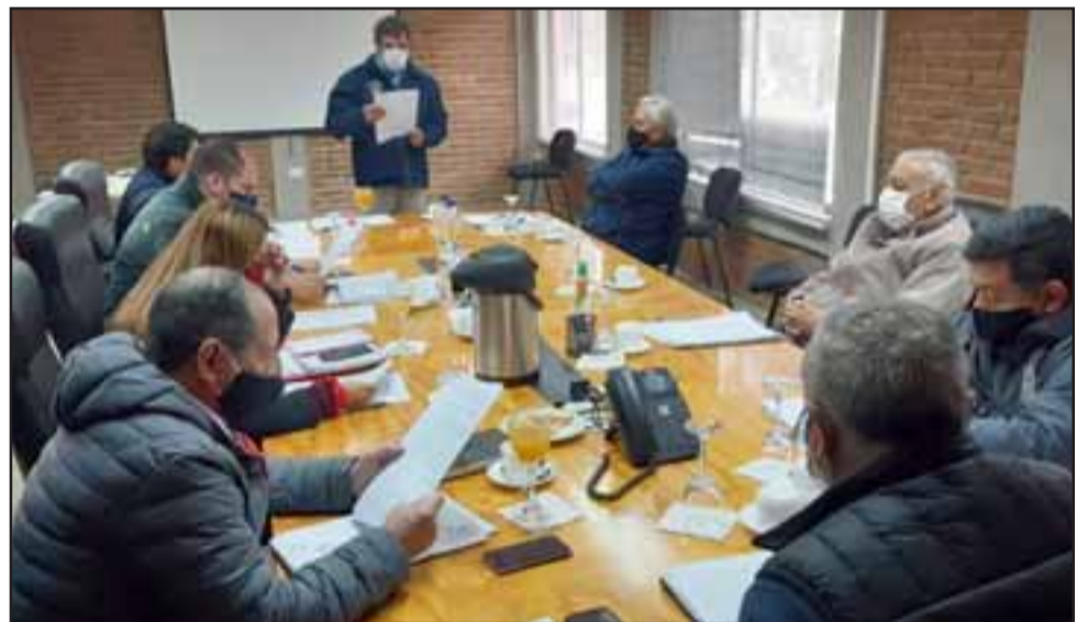
Se trata de dos reglamentos que están focalizados en restringir las reuniones masivas públicas, el uso de mascarillas y los horarios e ingreso al Cementerio Municipal y que fuera aprobado por el Concejo Municipal.

En relación al Cementerio Municipal, la presente ordenanza dispone el horario de atención en el recinto que será de lunes a sábado de 8:30 a 18:00 y domingos de 9:00 a 13:00 horas. Agre-