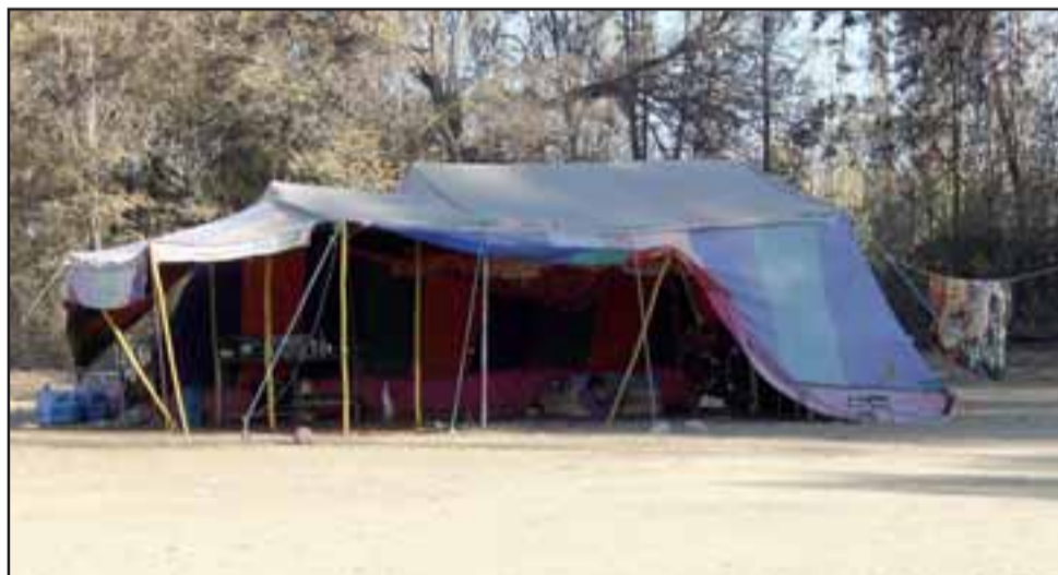
DE NUEVO EL PROBLEMA.- Esta es una de las carpas de los gitanos, al momento de visitar el lugar estaban pocos de ellos.