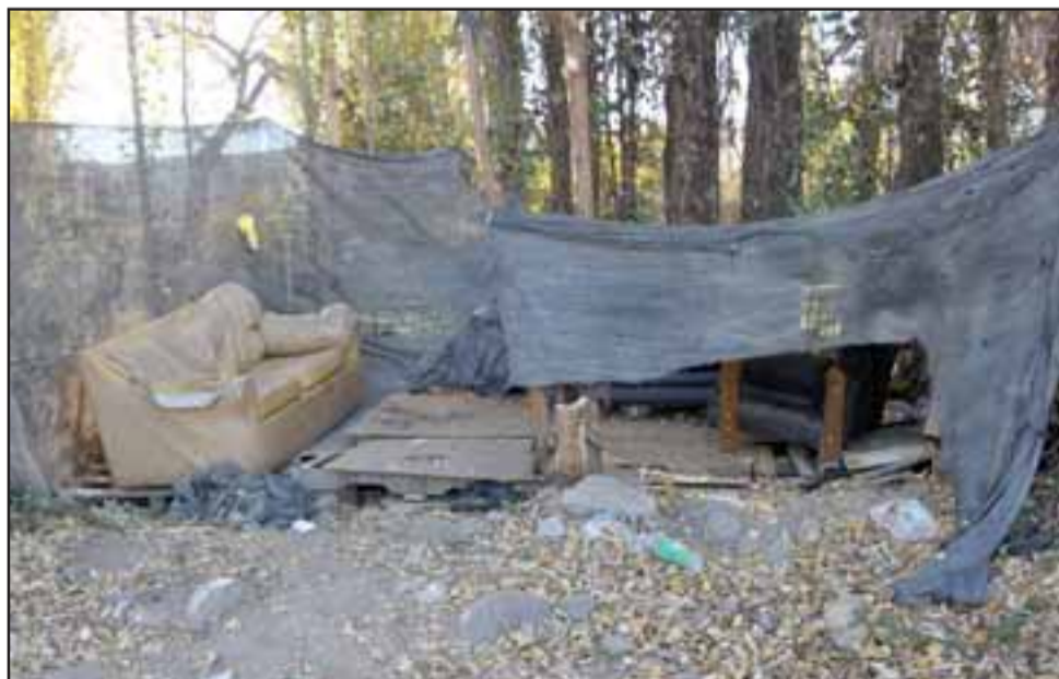
OTRO PROBLEMA.- Aquí vemos uno de los lugares que los delincuentes y viciosos locales usan para sus carretes al lado de la cancha del Club Juventud La Troya.