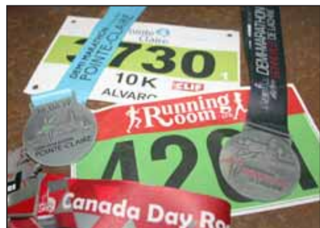
TREMENDOS LOGROS. - Aquí están sus medallas obtenidas en los cinco meses que Álvaro compitió en Canadá.