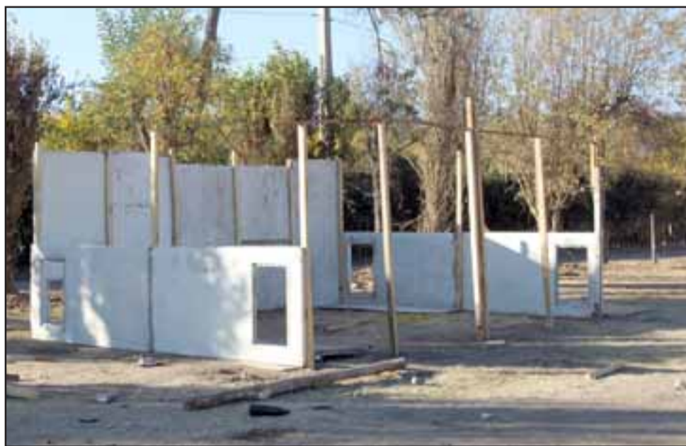
INSTALAN MEDIA AGUA.- Esta es una de las media agua que los gitanos tienen a medio instalar, cuando visitamos el lugar una de las gitanas mencionó que ya las personas que la estaban instalando se habían ido del lugar, y que hoy lunes serían quitadas del lugar.

También nuestro medio hizo un recorrido por la propiedad aledaña a la otra cancha de La Troya, donde se juegan los partidos, y en ese lugar hay otro problema, ya ahí no son los gitanos, son los delincuentes locales del lugar quienes ya instalaron una especie de búnker para consumir drogas e ingesta de licores, tienen hasta sillones y todo un basurero, algunos vecinos nos comentaron que se han metido a robar desde ese terreno, que se entiende está siendo preparado para un proyecto habitacional.