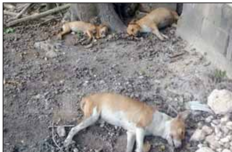
La muerte de los animales quedó al descubierto durante la tarde del pasado martes, cuando habitantes del sector encontraron una gran cantidad de canes agonizando tras comer carne con pesticidas.