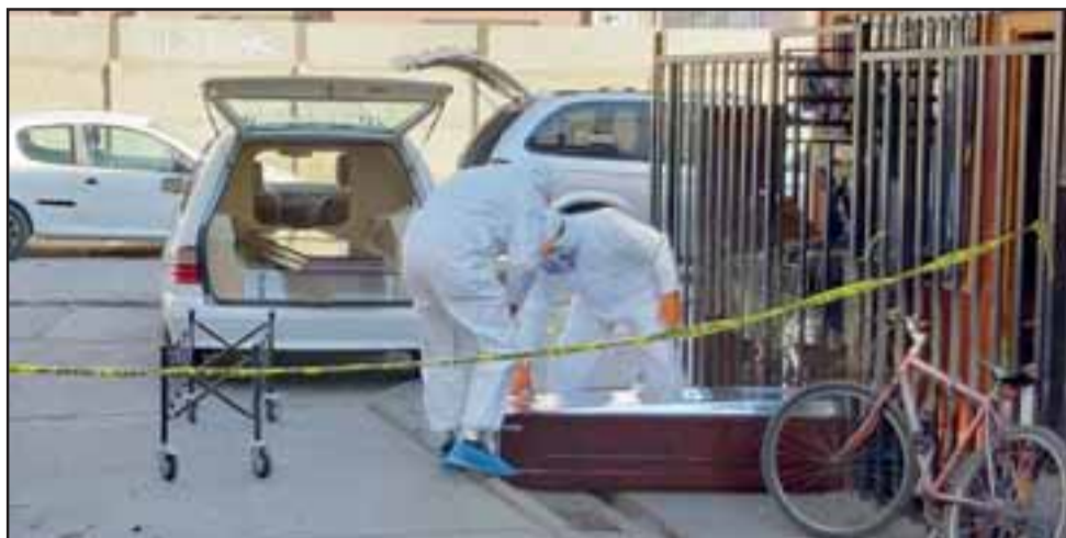
ATAÚD SELLADO.- Las cámaras de Diario El Trabajo registran el momento cuando el ataúd era sellado por empleados de Funerales Almendral con todas las medidas sanitarias del caso.