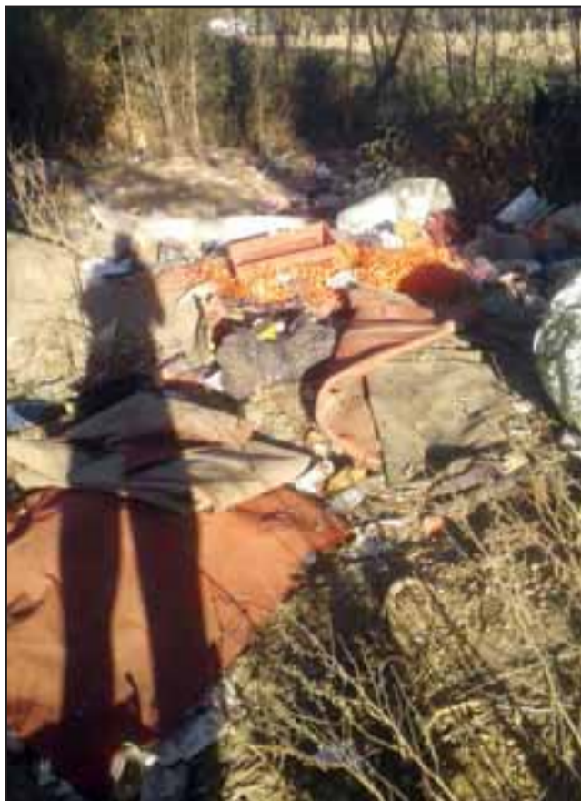
MUCHA BASURA.- Estos son los basurales que los gitanos tienen en la parte trasera de su carpa.