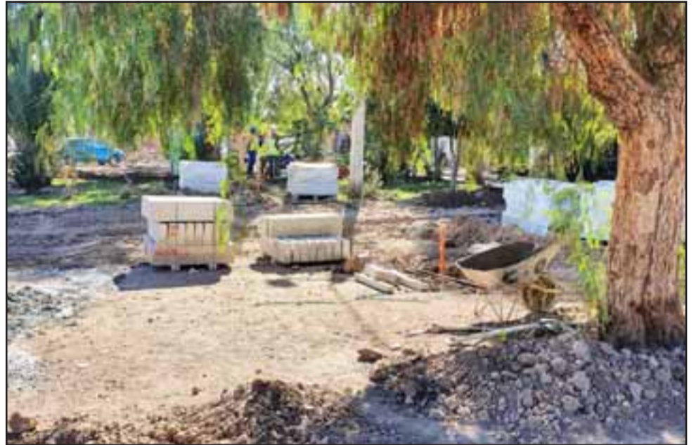
Esta obra tiene como objetivo recuperar un área verde, mejorar la seguridad con nueva iluminación LED y la incorporación de juegos para niños.