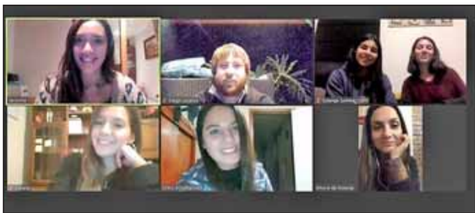
La rama de hockey de Los Halcones se reúne cada viernes mediante la plataforma Zoom.