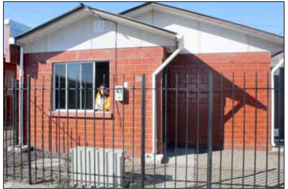
La inspección que realizaron las familias estuvieron centradas en revisar el medidor del agua, las chapas, las ventanas y fisuras.

ciales de dos y tres dormitorios, dependiendo del grupo familiar, de construcción sólida, con cierre perimetral, pandereta, rejas y calefón ionizado.