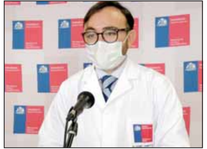
Jaime Jamett, Seremi de Salud subrogante Quinta Región.

A nivel regional podemos informar que hay 2.730 casos confirmados, 310 recuperados, 73 hospitalizados en UCI y 60 fallecidos (es decir dos nuevos decesos).