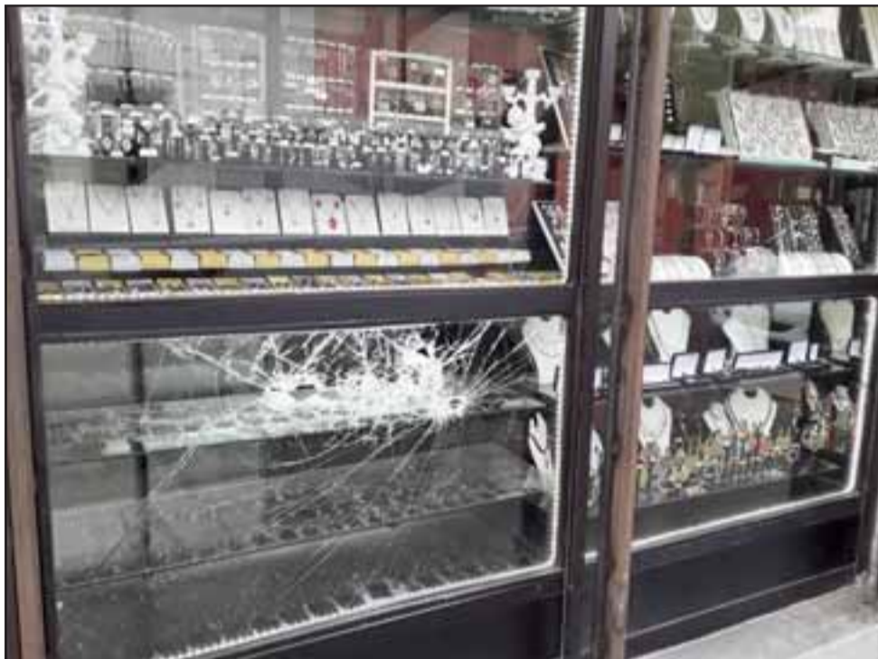
Los vidrios de la joyería quedaron destrozados, aunque el delincuente no pudo robar ninguna especie.

- Fiscalía los suelta (dice la madre), si no sé cuál será el modus operandi de allá, tendrían que estar adentro y los veo en la calle.