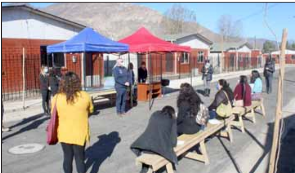
Las 42 familias, en grupos de 10, con mascarillas, toma de temperatura y distanciamiento social, efectuaron una visita técnica para realizar cualquier observación que pudiera presentar su futura casa.

En lo que respecta al comité habitacional Nuevo Amanecer 2, consistente en la construcción de 42 viviendas, este se ejecuta de acuerdo al cronograma fijado.