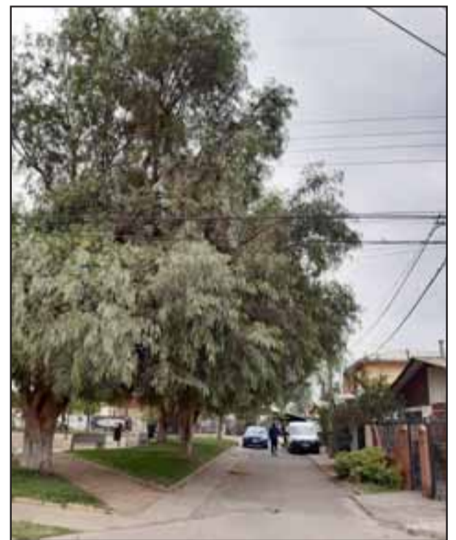
Las enormes ramas causan preocupación por su cercanía con los cables del tendido eléctrico.

Esos dos árboles han alcanzado gran altura, con lo cual con los vientos del invierno podrían provocar el desprendimiento de sus grandes ganchos con enormes ramas, porque quedaron