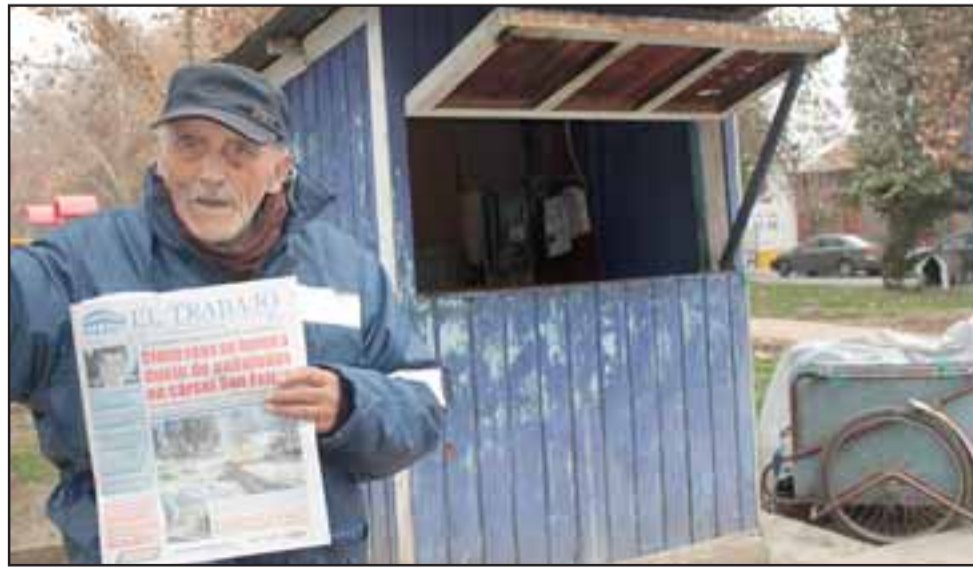
¡MUCHAS GRACIAS!- Aquí tenemos a nuestro insigne suplementero sanfelipeño, quien por 46 años colaboró con Diario El Trabajo y sirvió a miles de vecinos en nuestra comuna.