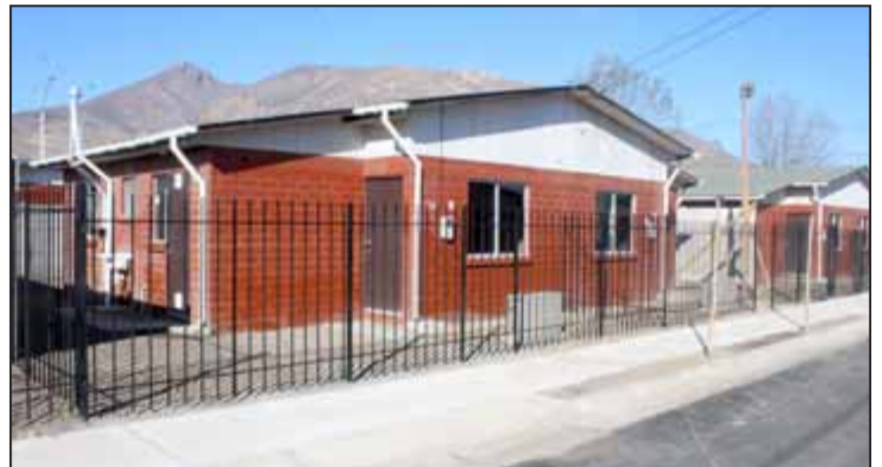
Se trata de viviendas sociales de dos y tres dormitorios, dependiendo del grupo familiar, de construcción sólida, con cierre perimetral, pandereta, rejas y calefón ionizado.