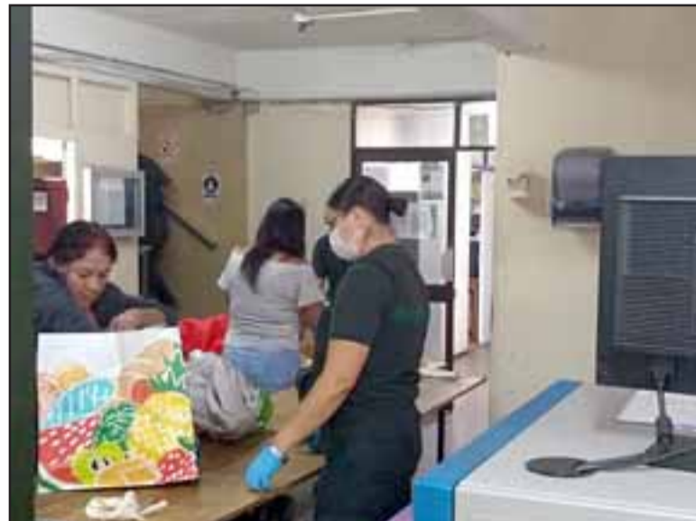
En el CCP de Los Andes se registró el primer caso de un gendarme, en este caso una mujer, contagiado con Covid-19 en el Valle de Aconcagua y en toda la región de Valparaíso.

• Sanitización de los espacios de los recintos penitenciarios y carros de traslados.