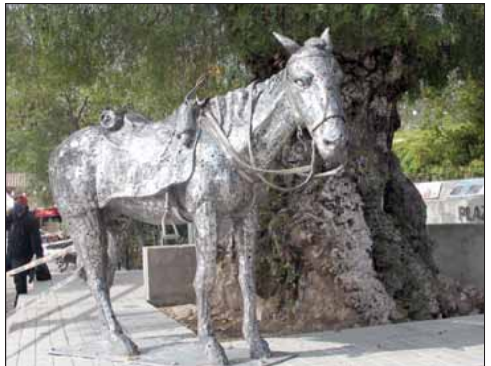
SIMBÓLICO EQUINO.- Aquí vemos la obra del escultor Sergio León, al pie del mítico pimiento tan apreciado por los putaendinos.