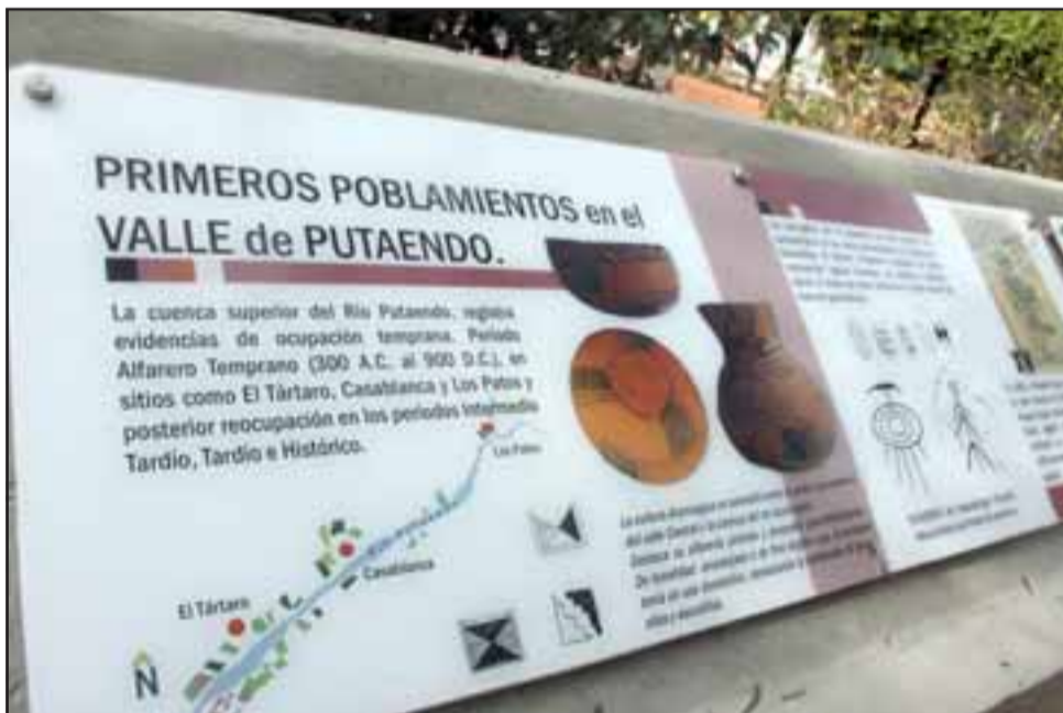
PATRIMONIO DE TODOS.- Varios e importantes afiches bien protegidos contra el clima son los que están en este homenaje a la historia de Putaendo y Chile.