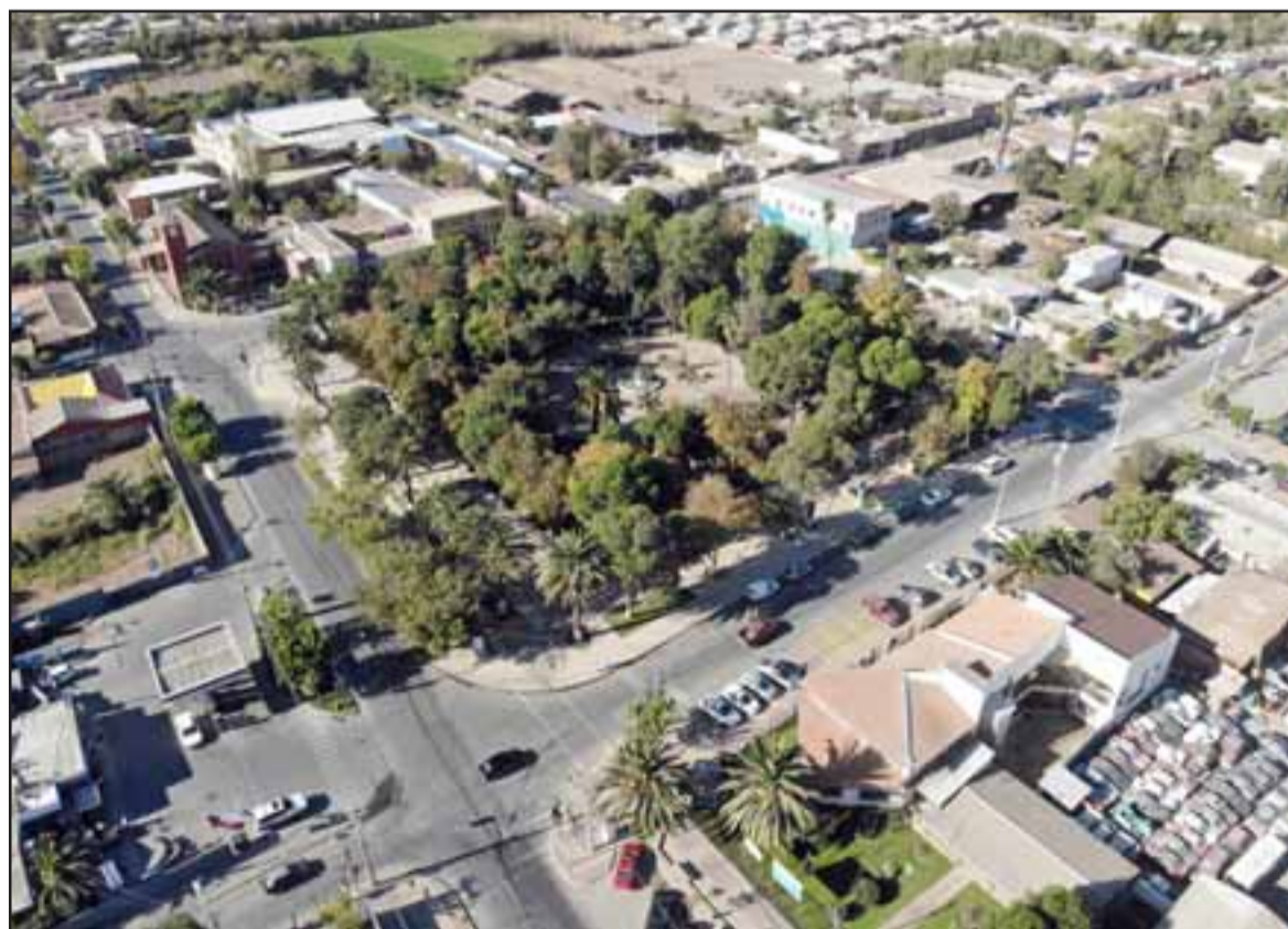
COMUNA DE LEYENDAS.- La ciudad de Santa María de todas maneras celebrará este fin de semana el Día Nacional del Patrimonio 2020 con dos estupendos programas radiales.