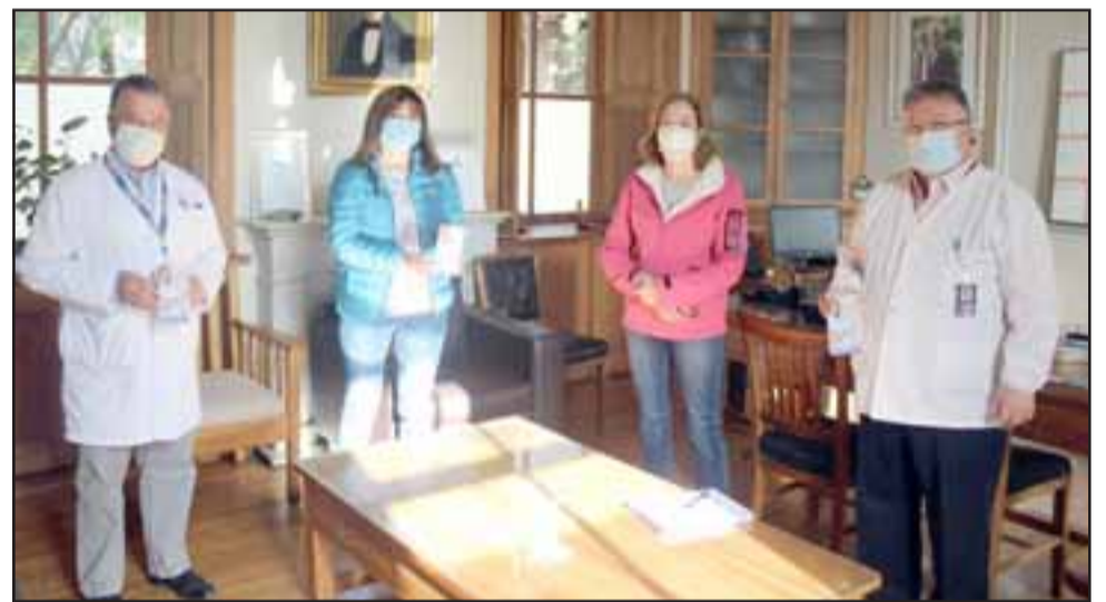
Tres termómetros digitales fueron donados por el Instituto Chacabuco al Hospital San Juan de Dios de Los Andes.