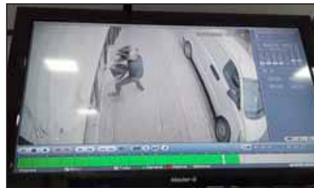
En la imagen captada por las cámaras de vigilancia del local, se aprecia al delincuente en plena faena intentando romper el vidrio de la mampara.

- Ya llevamos cuatro robos; el primero fue un asalto con arma, el segundo fue