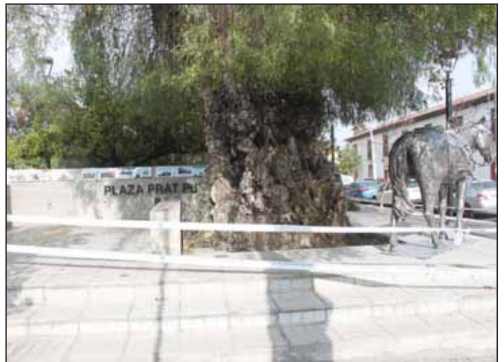
RINCÓN DE LA HISTORIA.- Así se aprecia la pequeña terraza creada para recordar otros hitos importantes del primer pueblo libre de Chile.