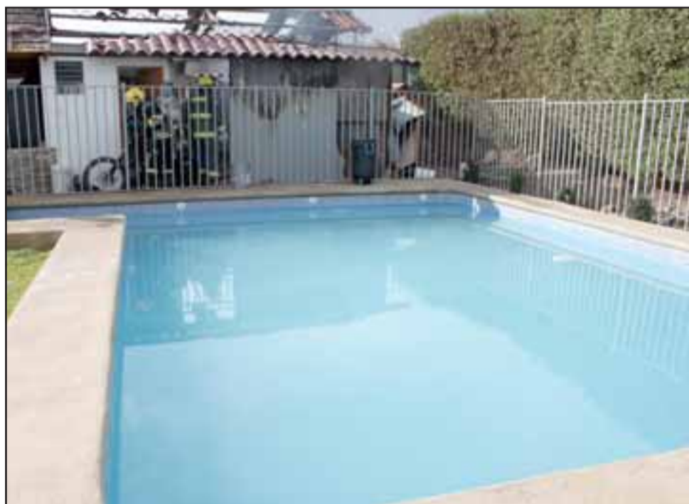
BENDITA PISCINA.- De esta piscina los vecinos sacaron agua para enfrentar las llamas.