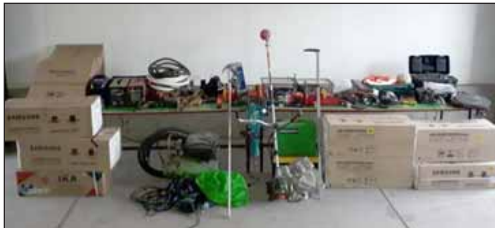
Aquí vemos varias de las herramientas que fueron robadas.

Desde Carabineros señalaron que durante el mes de abril ocurrió un robo en lugar no habitado, en el Sunnyland School, ubicado camino a Putaendo en Callejón Los Naranjos de esta comuna, consistente en herramientas de construcción como galleteros, taladros, compresor y soldadora entre otros accesorios avaluados en más de 15 millones de pesos, dando cuanta a la fiscalía local la dispuso en forma verbal que la S.I.P. de esta unidad se hiciera cargo de las primeras diligencias, por lo que el jueves a las 14:00 horas se posterior a diversas diligencias investigativas se estableció que un