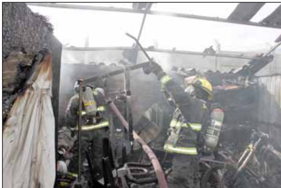
MISIÓN CUMPLIDA.- Los Caballeros del Fuego controlaron finalmente la situación, la ayuda primaria fue brindada por los mismos vecinos del lugar.