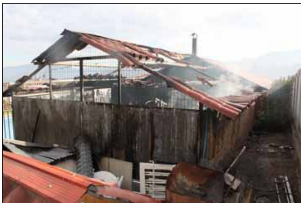
Así quedó esta bodega tras el incendio, de no haber sido detenido el fuego el resto de la vivienda también hoy estuviera destruida.