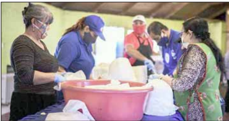
Para acoger a personas en situación de calle, abrió sus puertas el albergue municipal y está vez lo hace con la adopción de medidas sanitarias a raíz de la pandemia. (Referencial)