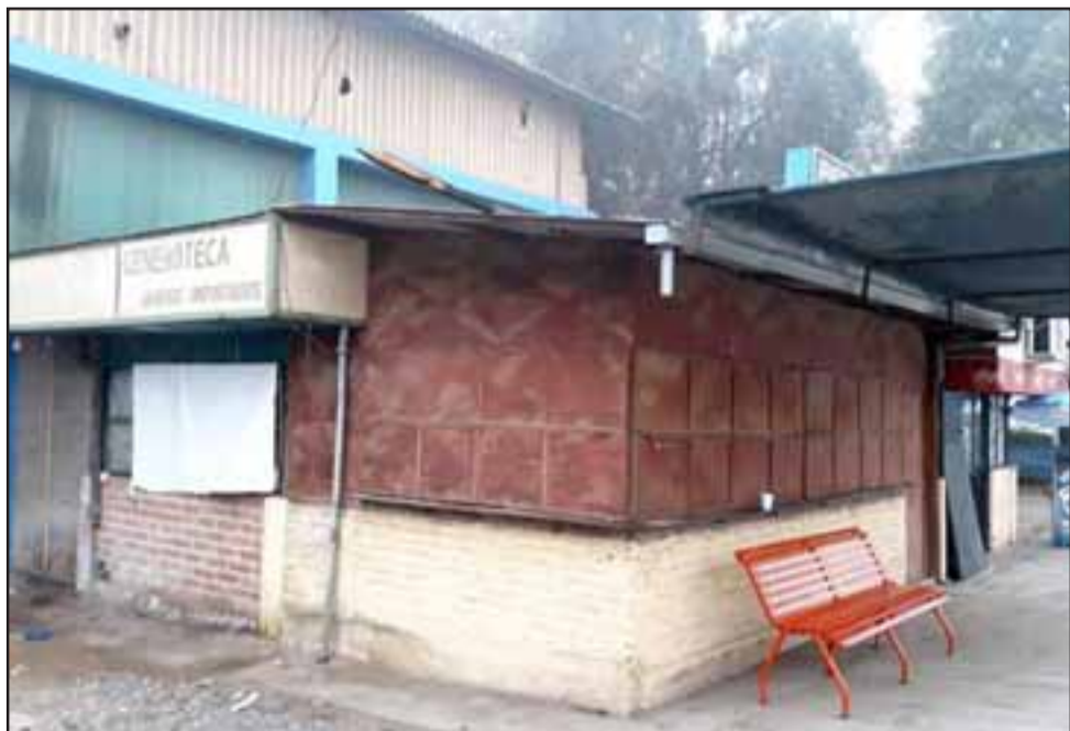
El hampón registra un amplio prontuario policial y condenas por varios hechos delictivos, principalmente de robos y otros en contra de la propiedad.

Informados los antecedentes del hecho y del imputado el Fiscal de Turno de San Felipe, dispuso que fijara domicilio y quedara a la espera de citación por parte del Ministerio Público local, recobrando posteriormente su libertad.