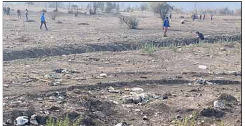
El día viernes en la mañana nuevamente se encendieron las alarmas en el sentido que había personas en el lugar.