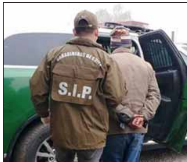
Personal de la Sección de Investigación Policial (SIP) de la Segunda Comisaría de Carabineros de San Felipe logró la detención en tiempo récord.

En dicho lugar comprobaron que al interior de un ruco había diversas cajas y otras especies que eran coincidentes con las detalladas por el comerciante afectado, encontrando también al sujeto de iniciales J.R.A.G. , de 34 años, el que al ser consultado por la procedencia de las mismas