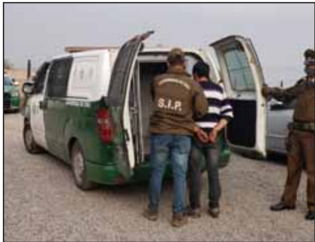
El imputado siendo sacado desde la comisaría para ser llevado al Tribunal de Garantía de San Felipe.

domicilio ubicado en Calle Luis Gajardo Guerrero, se encontraban ocultas las especies producto del ilícito, concurriendo personal de esta sección SIP, e ingresando al domicilio incautado gran parte de las especies evaluadas en más de 10 millones de pesos.