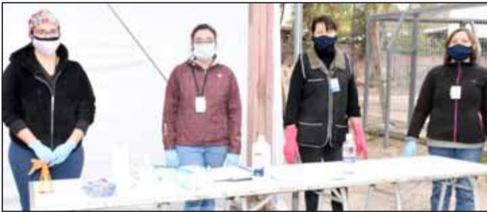
Funcionarias municipales ya están en sus puestos para atender a estas personas en Los Andes.

El jefe comunal agregó que se necesita recolectar ropa de abrigo, útiles de aseo y ropa de cama: «Hacemos el llamado a quienes quieren donar, a llevar sus enseres directamente a la Dirección de Desarrollo Comunitario en Yervas Buenas 330».