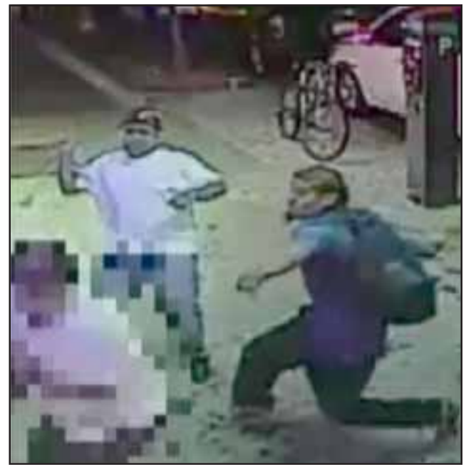
La paliza que la víctima recibió lo dejó con heridas graves en su rostro en el hospital andino. (Reeferencial)

Los hermanos, uno de los cuales registra antecedentes penales, fueron detenidos y puestos a disposición del Juzgado de Garantía de Los Andes donde se los formalizó en calidad de autores del delito de Lesiones graves. Ambos quedaron con la medida cautelar de Prohibición de acercarse