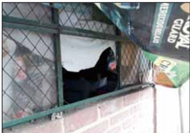
Por esta ventana ingresó el antisocial a robar al local del Terminal Rodoviario.

Personal de la Sección de Investigación Policial (SIP) de la Segunda Comisaría de Carabineros de San Felipe logró la detención en tiempo récord de un delincuente que durante la madrugada, en plena vigencia del Toque de Queda, entró a robar a un local ubicado al interior del Terminal Rodoviario de esta comuna.