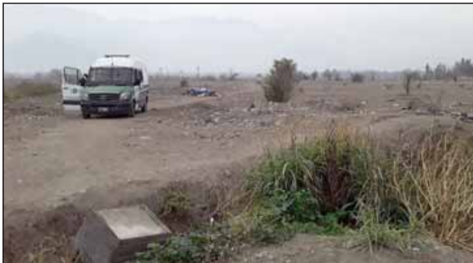
Aquí vemos la presencia de Carabineros en la propiedad, evitando nuevas tomas del terreno.

Importante señalar que esta acción se viene a unir a la misma que informáramos en su momento producida en el límite de Villa Yevide con Villa Departamental. El gobernador señaló que el dueño debe interponer la denuncia correspondiente.