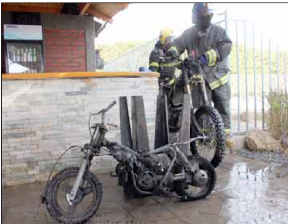
PÉRDIDAS MILLONARIAS.- Las pérdidas fueron sólo materiales, motocicletas y electrodomésticos y una máquina de hacer ejercicios quedaron hechas cenizas.