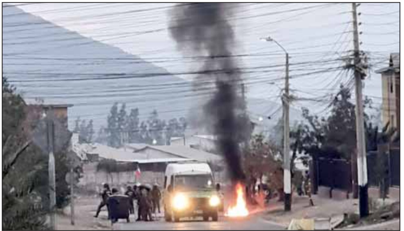
Carabineros llegó a las poblaciones en respuesta a las tomas de terrenos en sectores limítrofes con lo rural.