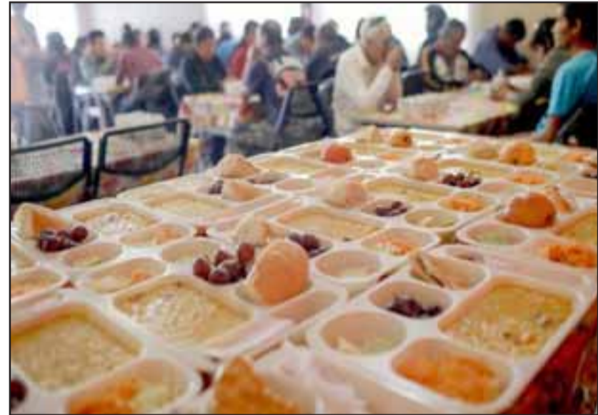
Alimentos calientes y ropa limpia para personas en condición de calle es lo que ofrece este comedor municipal.