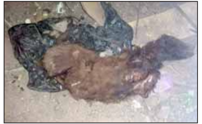
La impactante imagen muestra cómo quedó el perrito luego que un demente lo cortó sus cuatro extremidades.

Piensa que la persona que hizo esto es alguien que debiera estar en el Hospital Psiquiátrico, «porque anoche tuvimos muchos comentarios, no es una persona que esté bien de la mente, tiene que irse al psiquiátrico; estos es macabro porque esta persona lo va a seguir haciendo seguramente, si ya vio que lo supo hacer muy bien, le cortó las extremidades al perrito, yo creo que sí lo va a seguir