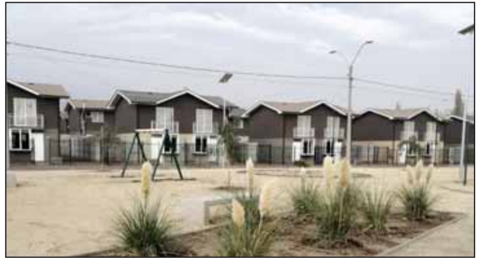
El proyecto habitacional Santa Rosa de Los Andes albergará a 249 familias, 67 de ellas vulnerables.

Debido a la situación sanitaria del país, las entregas de estas viviendas se han realizado de forma parcializada, donde los propietarios reciben las llaves de sus hogares de forma individual, para evitar aglomeraciones y así disminuir los riesgos de contagio, evitando que