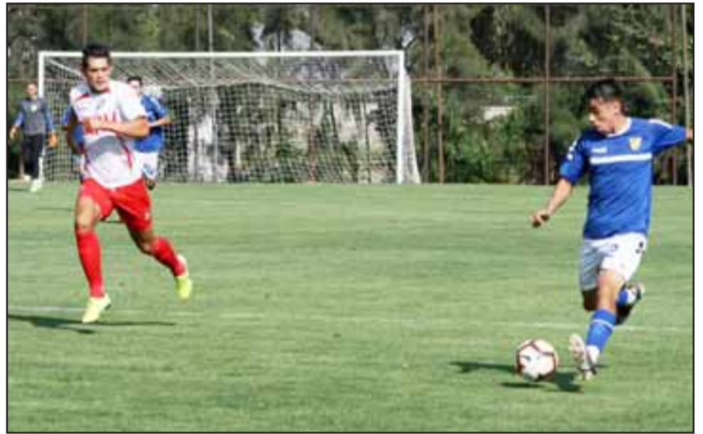
Para fines de julio se propuso volver a las competencias de la ANFP.

Entre las medidas que deberán adoptar los diferentes clubes, destacan por ejemplo el que no habrá concentraciones para los equipos locales, mientras que se seleccionarán hoteles para los planteles