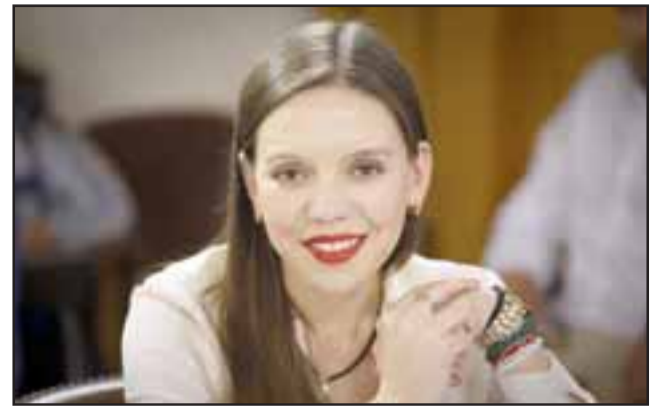
La diputada Camila Flores dijo que ha sostenido diversas reuniones con representantes empresariales, quienes le han descrito las dificultades para acceder a los créditos bancarios, pese a que hay garantías estatales.

«Ellos son quienes dinamizan la economía y concentran la mayor cantidad de empleabilidad a nivel nacional y que son absolutamente los que más perjudicados se han visto, y muchos de los cuales arrastran deudas derivadas en particular desde el estallido de violencia desatada en octubre pasado y que con esta pandemia se agudiza su merma», Finalizó.