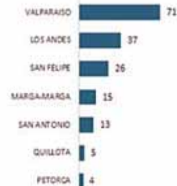
CASOS NUEVOS POR PROVINCIA

CRUELDAD EXTREMA. -Un macabro hallazgo de un perrito con sus cuatro extremidades totalmente cortadas realizó un grupo de niños en el sector de Las Coimas en la comuna de Putaendo. Según un vecino del lugar, el perrito tenía como siete u ocho meses de vida. El infortunado animal se encontraba tirado a la entrada del estero El Manantial, presumiéndose que el autor del cruel acto debería ser habitante del sector donde lo dejó.