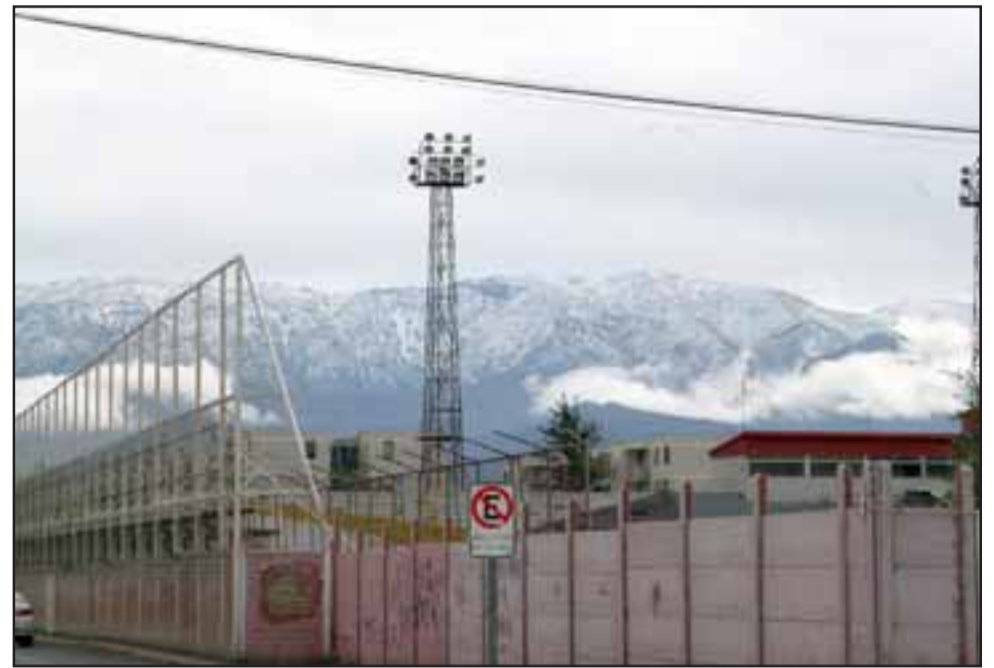
¿PASAREMOS AGOSTO?- Estas son las mediciones de esta semana y el pronóstico para los días que siguen hasta el domingo.