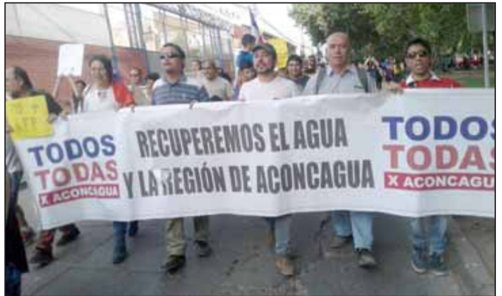
UNA NUEVA LUCHA.- El ‘Movimiento Todos y todas por Aconcagua’ desde hace dos años viene manifestándose en distintos escenarios y con diferentes demandas civiles y sociales.