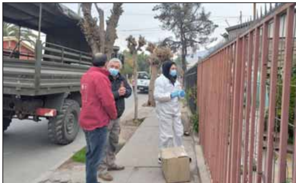
Las familias beneficiadas se han mostrado sumamente agradecidas por esta ayuda que llega en momentos verdaderamente críticos para una inmensa mayoría de chilenos.

cho». De esta manera, la provincia ya ha logrado recepcionar y en su mayoría también distribuir cerca de un tercio de la entrega total considerada para sus seis comunas, la que corresponde a 13 mil canastas familiares, las que deben ser distribuidas antes del 21 de junio.