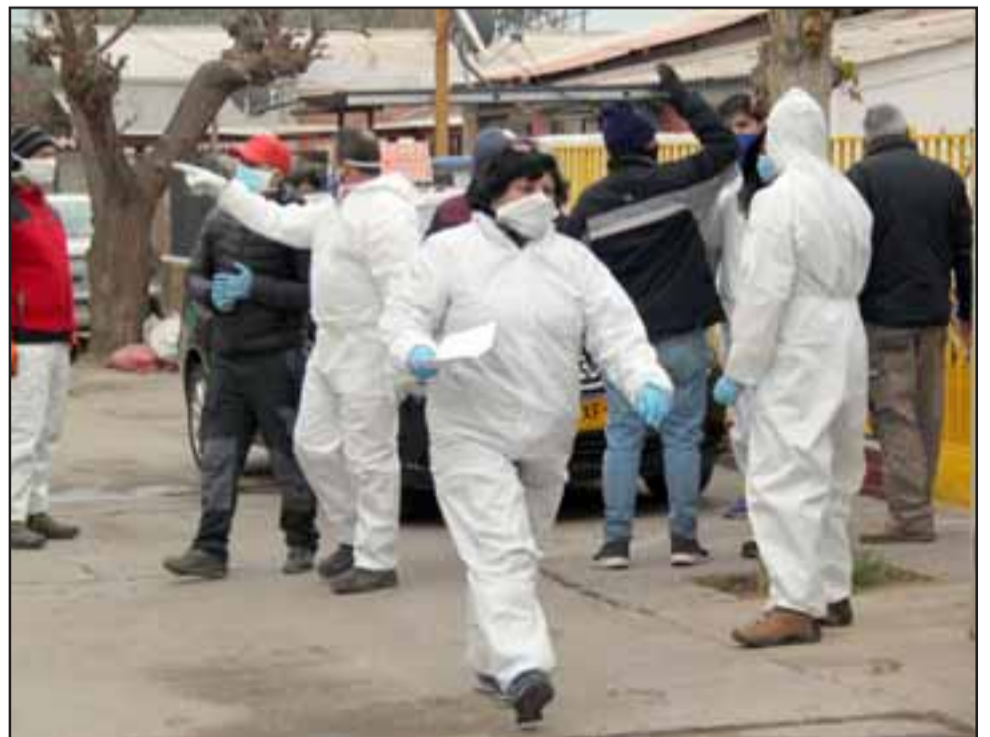
PREVENCIÓN ANTE TODO.- Cada caja entregada se hizo con ficha en mano, y cumpliendo también con las estrictas medidas sanitarias.