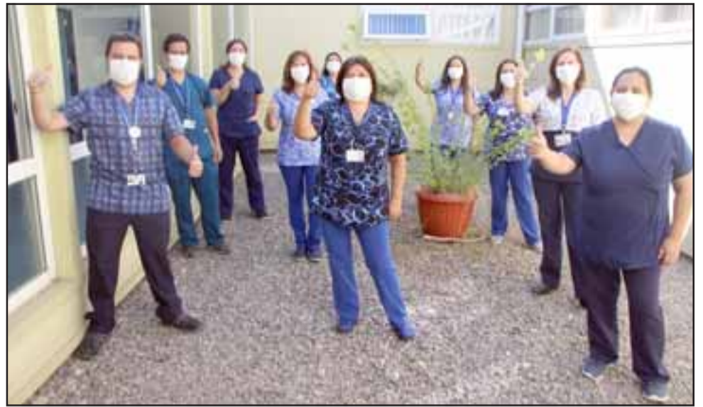
Desde inicios del mes de marzo, el Hospital viene implementando una serie de medidas como ejercicios de simulación, capacitaciones, habilitación de nuevas camas clínicas y readecuación de sus instalaciones.

Director del Hospital San Antonio: «Nuestro equipo se ha preparado para enfrentar esta pandemia y así cumplir adecuadamente su rol como hospital de descarga», recalcando que la preparación que durante meses ha tenido el Establecimiento les permite enfrentar en óptimas condiciones las derivaciones que se realizan.