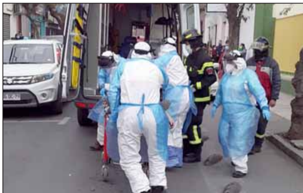
Personal del SAMU debió trabajar intensamente para estabilizar al conocido ex garzón antes de poder subirlo a la ambulancia para trasladarlo al hospital.