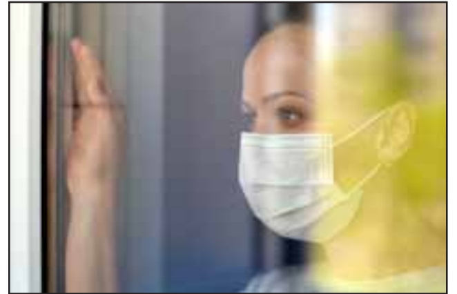
La idea es que la ciudadanía done implementos de aseo personal como cepillos y pastas de dientes, shampoo, jabón, toallas higiénicas, entre otros, para entregarlos a las familias que lo necesiten.

Los interesados pueden dejar sus donaciones en la Oficina de la Mujer, ubica-