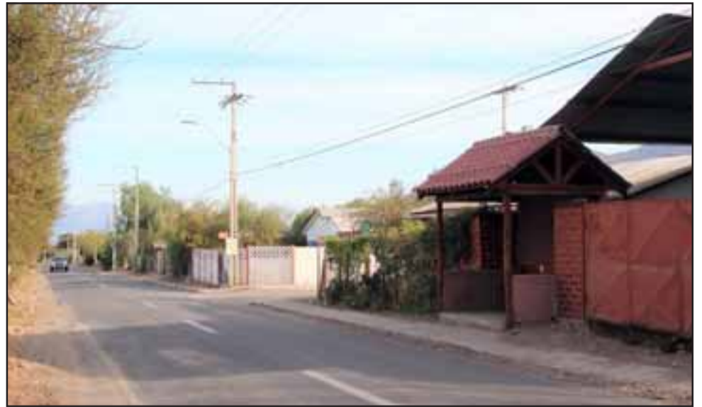
En este lugar, Calle Central, cercano a una Villa del sector Las Tres Canchas en Quebrada Herrera, se produjo el asalto.

que portaba, donde llevaba su celular avaluado en unos 140 mil pesos.