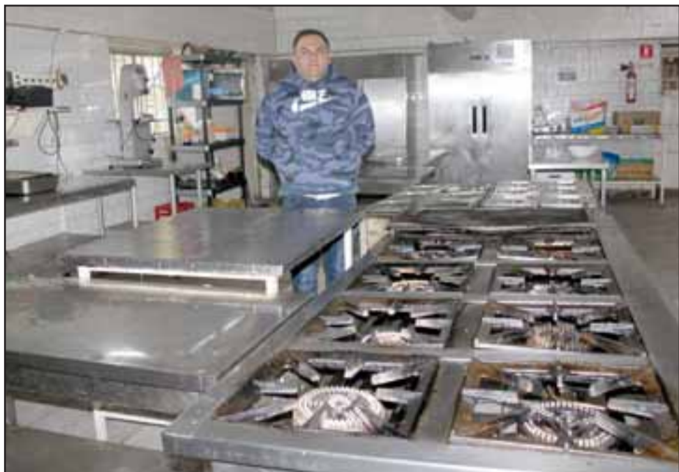
NUNCA ANTES VISTO.- Así lucen también las estufas, nada se mueve, nada es alegría hoy día donde tantas alegrías vivimos.