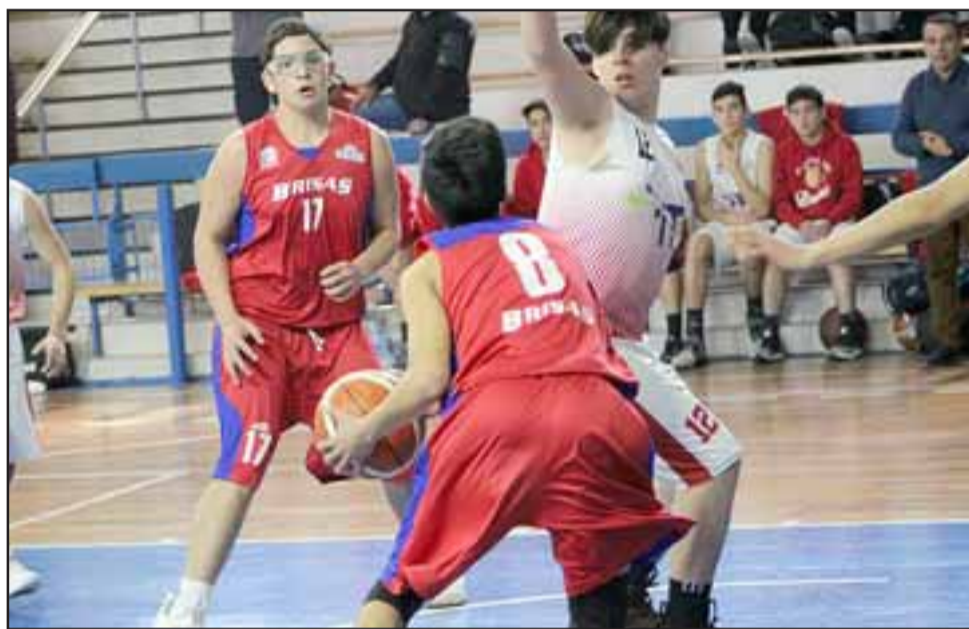
Los Juegos Binacionales fueron aplazados para el próximo año.

y Argentina, a raíz de la pandemia, obligó a tomar medidas, además de estudiar los pasos que se darán a futuro, tal como lo plantea la nota escrita, a la que de manera exclusiva tuvo acceso El Trabajo Deportivo . «Se propone realizar en el breve plazo una videoconferencia para reforzar esta determinación (suspensión de los juegos) y acordar de manera conjunta los pasos a seguir. Tal como lo señalan las bases y principios sólidos de estos juegos, donde priman los acuerdos y la colaboración mutua entre ambos países», concluyó.