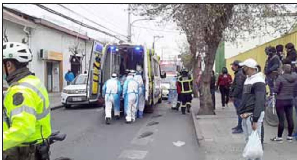
Bastante connoción causó el incidente en calle Prat, donde un automovilista sufrió un paro cardio respiratorio mientras conducía su vehículo, quedando a centímetros de un árbol.

Importante aclarar que en un primer momento se dijo que había chocado con un árbol existente en el lugar, pero esa situación se descartó completamente. Eso sí, el automóvil quedó a centímetros del mismo árbol