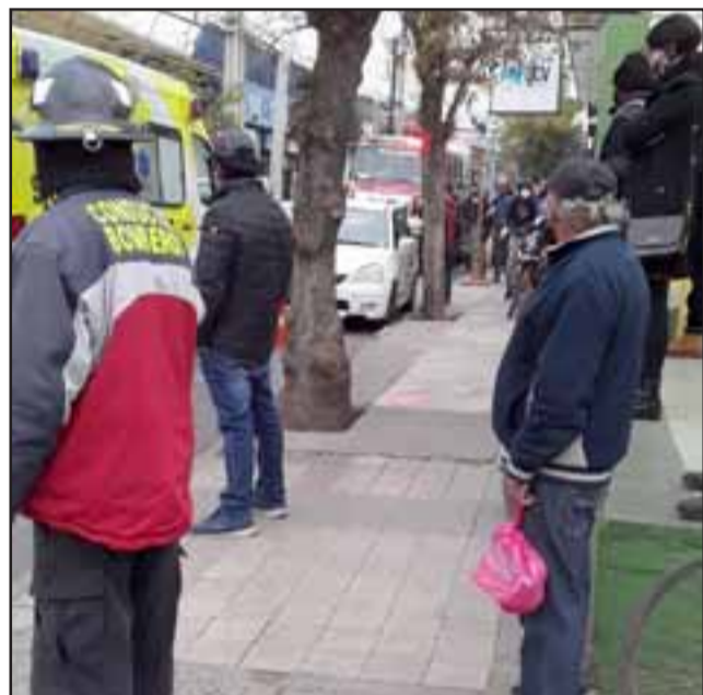
Al fondo se aprecia el automóvil blanco detenido junto a un árbol contra el cual estuvo a punto de estrellarse.

frente al templo de Conferencias bíblicas y también al propio local donde va a dejar comida 'Magaly', ambos ubicados en calle Prat.