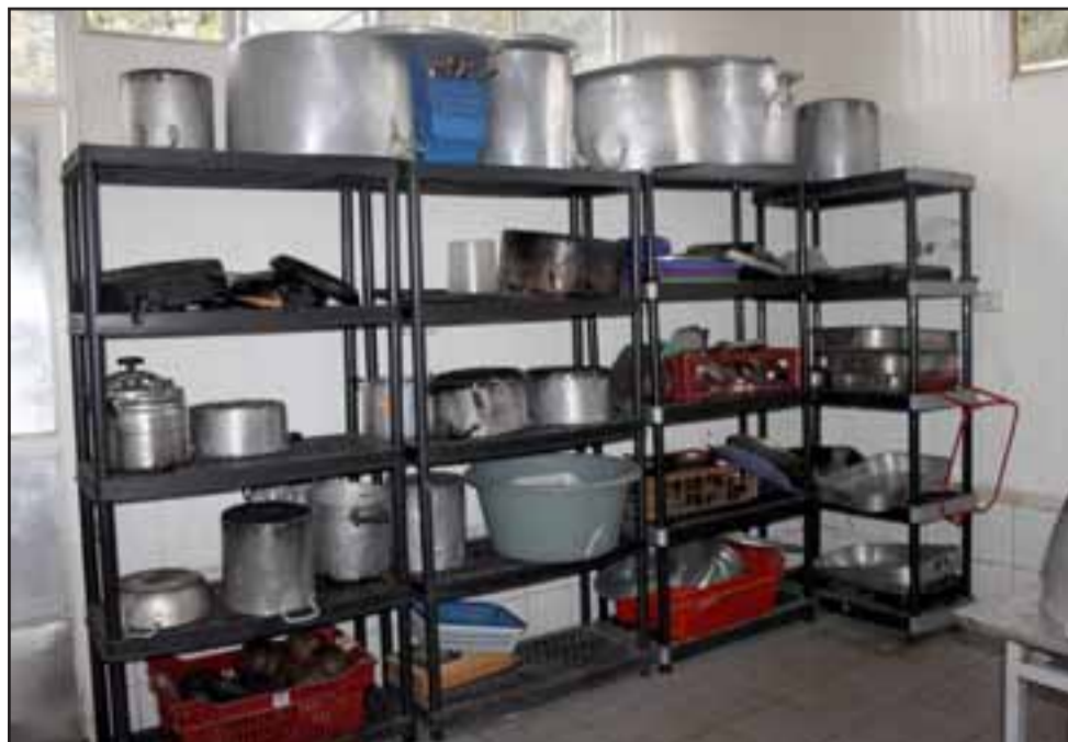
SOLEDAD ABSOLUTA.- Las ollas, sartenes y demás utensilios de la cocina más gustada de Aconcagua se guardaron hace tiempo ya.