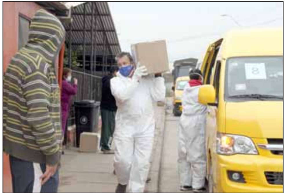
AYUDA LLEGANDO.- Todo el día los funcionarios municipales y de Gobernación entregan de casa en casa la mercadería tan esperada.