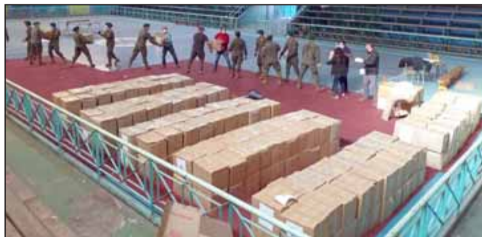
Durante la semana arribaron 4 mil 377 canastas familiares para las diferentes comunas de la provincia de San Felipe, las que fueron acopiadas en el gimnasio del Liceo de Hombres.