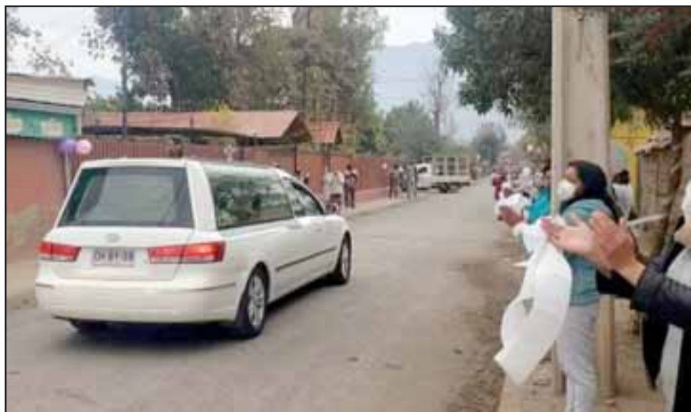
ADIÓS CARMENCITA.- Con pañuelos blancos, globos en la calle, lágrimas y aplausos, así despidieron a la dueña de Restaurante Valeria de Catemu. El Covid-19 se sigue llevando a los mejores.

Todo el personal administrativo, gerencial y perio-