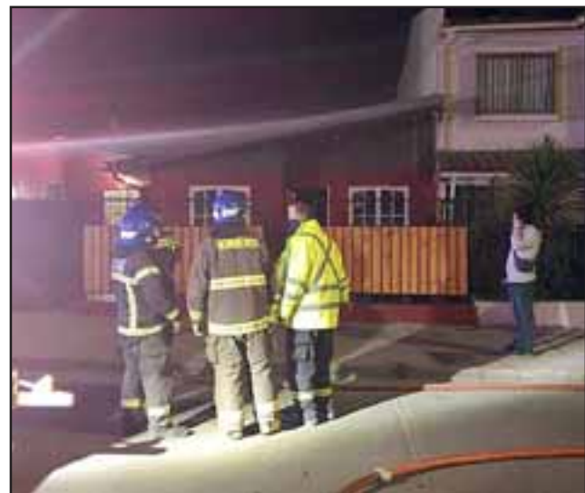
Voluntarios de Bomberos trabajando en controlar el incendio que afectó a uno de los suyos.

Reiteró que el incendio se originó en el dormitorio; «lo que pasa que había gente ahí, familiares, ellos sintieron se les cortó la luz, volvieron a levantar el automático, posteriormente se dan cuenta que en el dormitorio está saliendo mucho humo y la verdad que el fuego estaba quemando