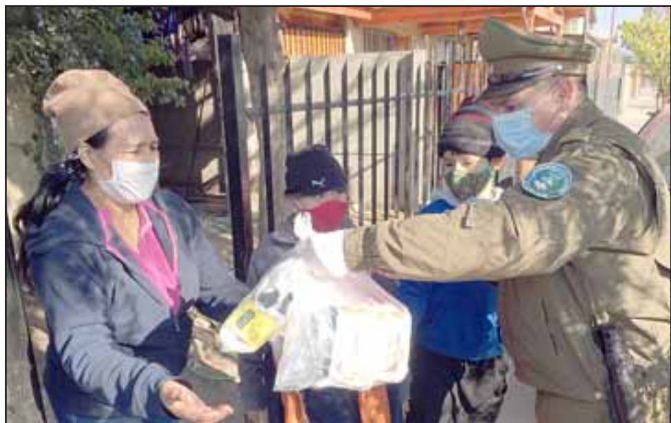
CARABINEROS PRESENTE.- Las cámaras de Diario El Trabajo registran el momento cuando funcionarios de la Oficina de Integración Comunitaria de la Segunda Comisaría de Carabineros San Felipe entregan recursos a estas familias.

Según una lista hecha para ser publicada en esta crónica, lo que más urge en estos momentos para estas familias es: Leche en polvo