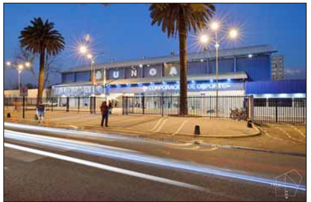
Los Andes se pondrá a la altura de las grandes ciudades del país con su moderno Polideportivo. En la imagen, el polideportivo de Ñuñoa.

Cuántas cosas te quitaron querido fútbol, desde tus comienzos en tu infancia en las calles del barrio... el espectáculo y la pandemia han borrado la sonrisa de tu cara y aparece dibujada la tristeza con la esperanza que todo vuelva a la normalidad.