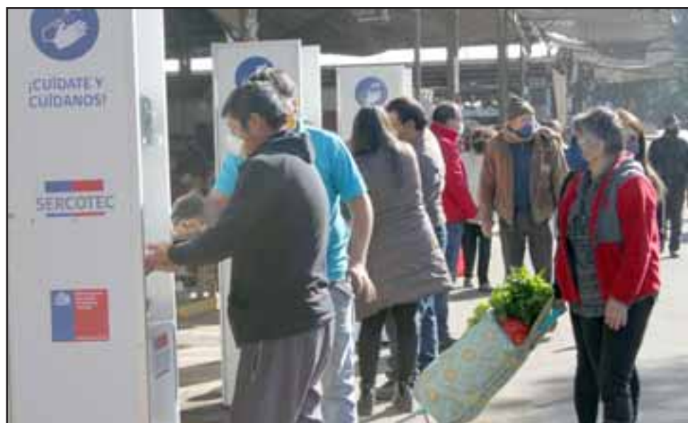
LIMPIEZA ES SALUD. Los clientes de la feria de inmediato empezaron a usar los lavamanos luego que fueron instalados.

cuidar de la salud de nuestros clientes mientras estén acá en nuestra feria. Aquí son cerca de 200 puestos los que operan en Afema, los