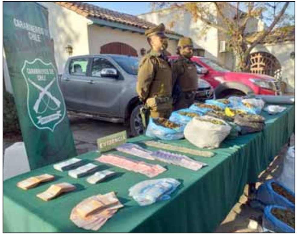
Más de 137 mil dosis de droga avaluada en 140 millones de pesos, además de una importante cantidad de dinero en efectivo, decomisó personal del OPS7 de Carabineros de Aconcagua.