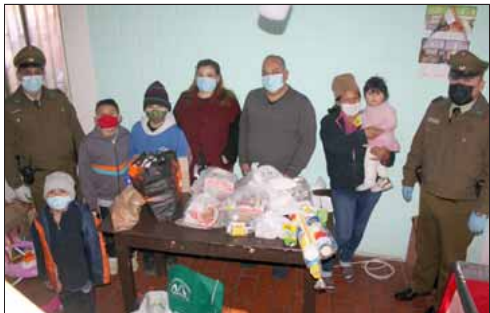
FALTA MÁS.- Poco a poco la ayuda llega al hogar de estas familias, los niños se muestran contentos e ilusionados porque ahora comerán a sus horas.