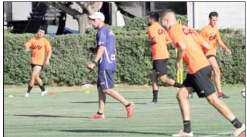
No se contempla que en los próximos días el plantel unionista vuelva a entrenar al complejo deportivo.

rrasía Bajo. «Aún no volveremos, así que seguiremos con el sistema actual que es el entrenamiento en casa donde se trabaja la fuerza. Ahora hay que ver cómo evoluciona el tema de la pandemia», explicó el profesional.