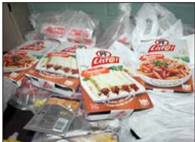
CAMPAÑA HUMANITARIA.- Alimentos preparados llegaron para esta familia, aunque no tienen microondas para calentarlos.