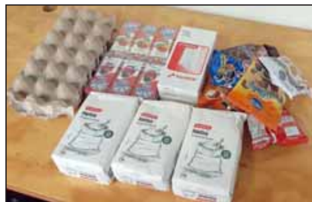
Con aportes en dinero de los funcionarios de la Municipalidad de Panquehue se confeccionan 72 bolsas con alimentos para apoyar a familias que no lo están pasando bien en esta emergencia sanitaria.

«Se solicitó a tres funcionarios de los programas