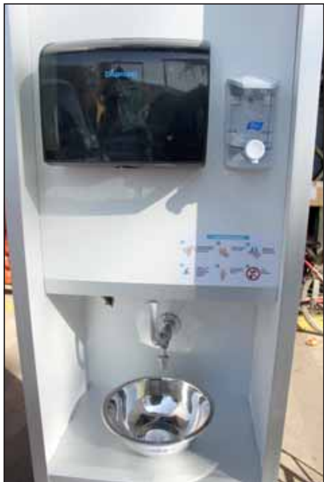
PARA PREVENIR CONTAGIOS. Así luce cada uno de los lavamanos que están ya disponibles para clientes y feriantes en Afema.