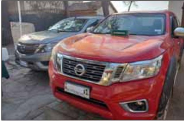
La investigación, además, arrojó el decomiso de vehículos que utilizaban para el transporte de la droga, la que también lograban ocultar en tubos de PVC.

El gobernador Sergio Salazar reconoció el trabajo coordinado realizado por la Prefectura de Carabineros Aconcagua, que permitió desbaratar esta banda. La autoridad provincial destacó que más allá de la emergencia sanitaria, producida por la pandemia, las policías continúan haciendo su trabajo y en especial en temas como la lucha contra el narcotráfico.