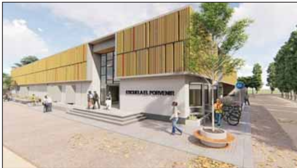
Esta iniciativa Llayllaíno fue la única seleccionada de la V Región y está dentro de los nueve proyectos a nivel nacional financiados por la cartera.