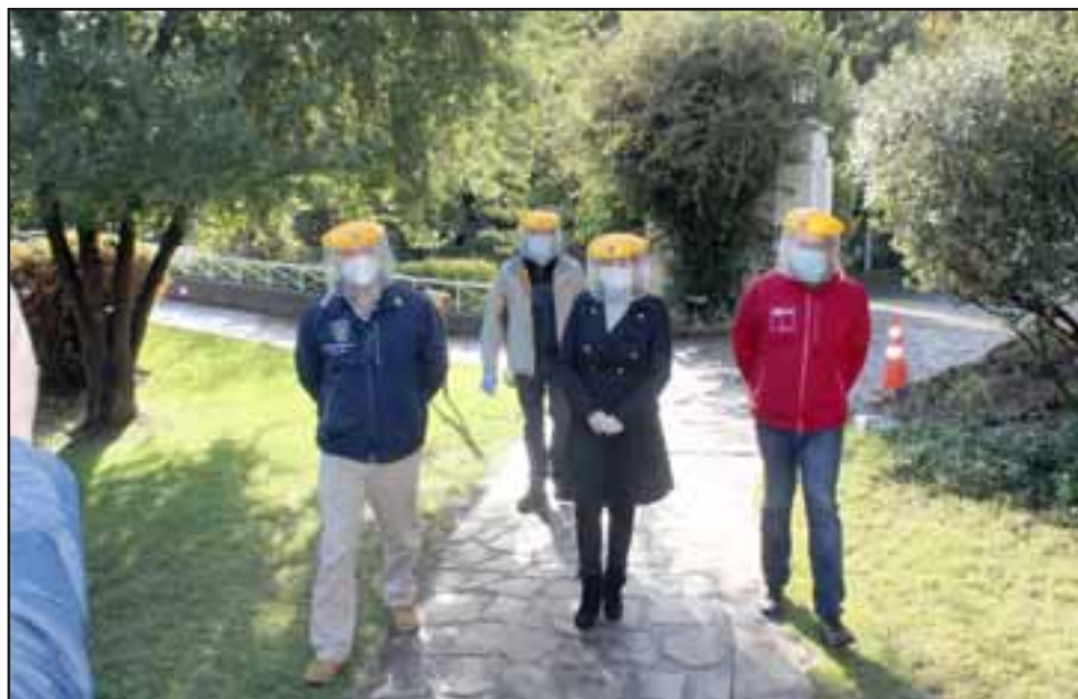
Las autoridades inspeccionaron cada rincón del inmueble y de la propiedad.