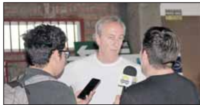
El propietario del Uní Uní sigue siendo actor relevante en el fútbol profesional.