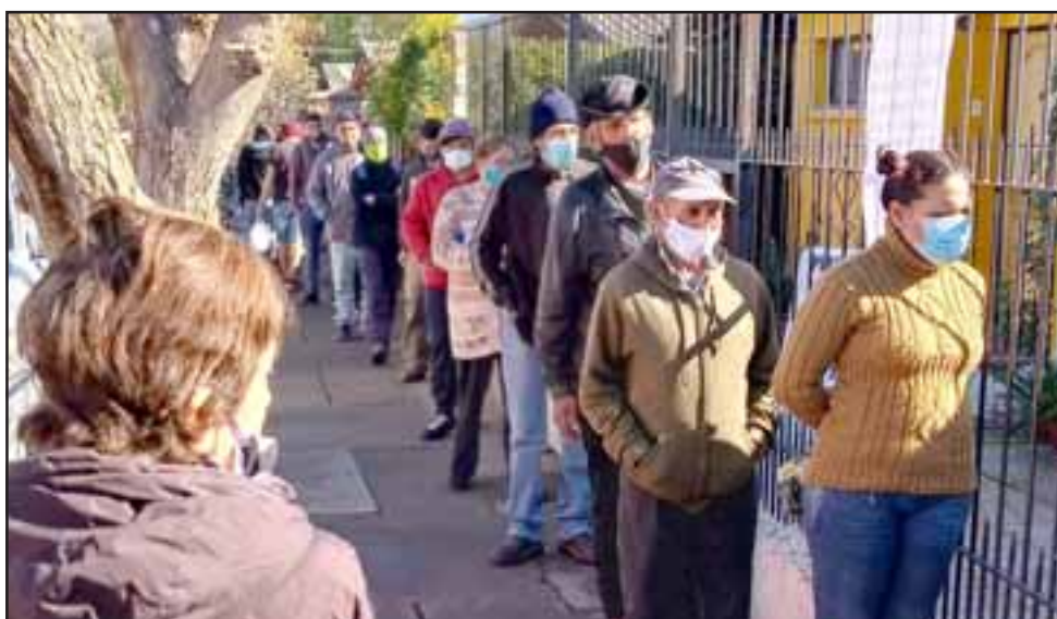
UNA MANO AYUDA A LA OTRA.- Aquí vemos la gran fila de vecinos en Población San Felipe para recibir sus colaciones en este comedor solidario.