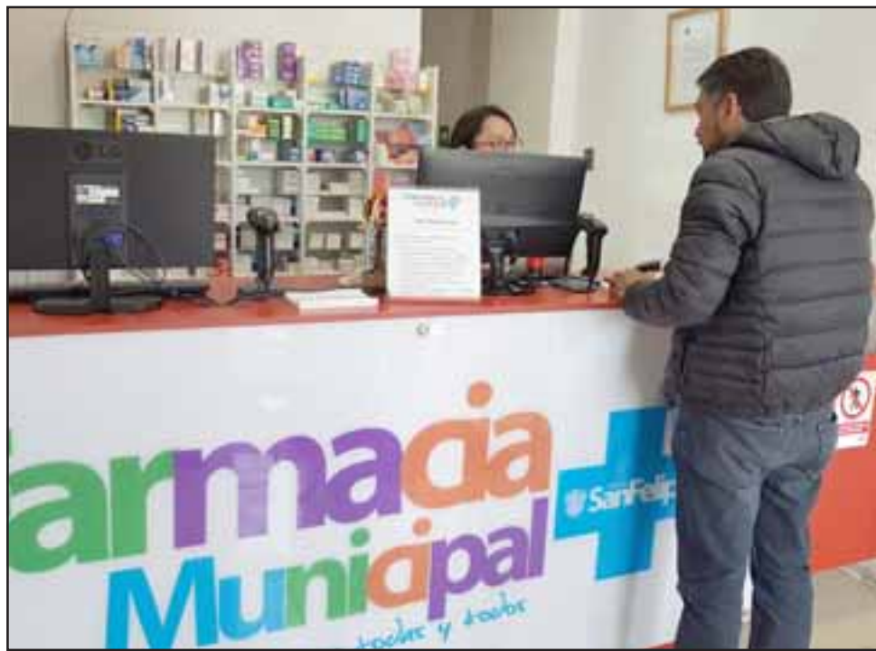
La Farmacia Municipal ha dispuesto de atención por números para la entrega de medicamentos y la inscripción de nuevos usuarios.

Las recetas médicas no deben tener una antigüedad mayor a tres meses, sobre