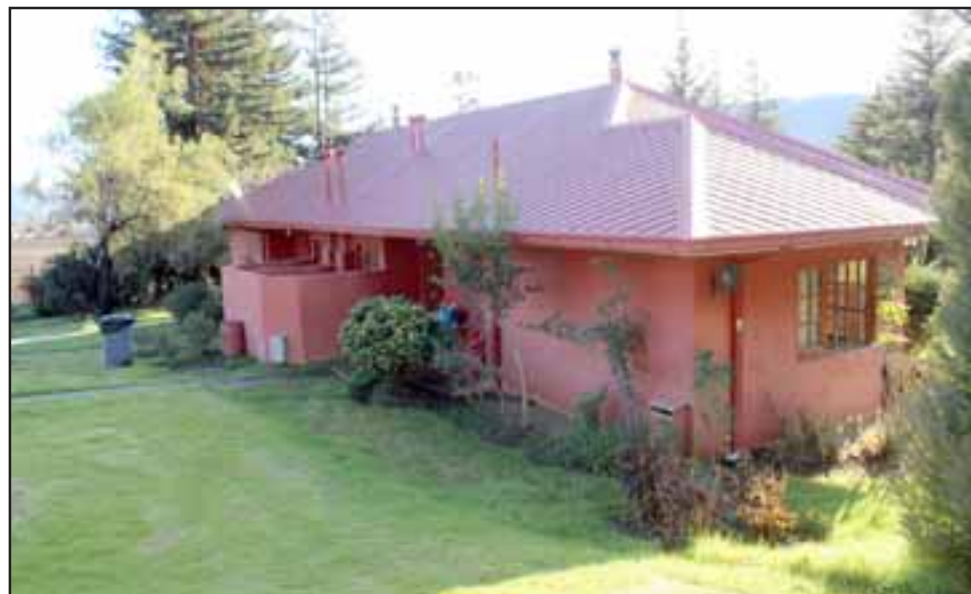
Esta Residencia Sanitaria cuenta con 27 cabañas con un total de 82 camas para pacientes con Covid-19 asintomáticos y que serán derivados por los Cefam de Aconcagua.