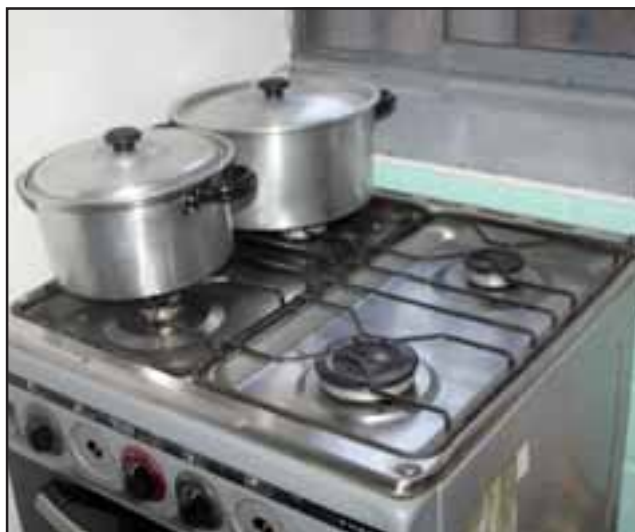
EN PERFECTO ESTADO. - Esta es otra de las cocinas donadas a estas tres familias, lo que les ha cambiado la vida a todos.

Luego que en Diario El Trabajo iniciáramos una campaña solidaria para auxiliar a tres familias bolivianas procedentes de Cochabamba y residentes en nuestra comuna las reacciones de nuestros lectores y de personas de todo el Valle de Aconcagua no se hicieron esperar, participando Carabineros, Dideco San Felipe, la Oficina Municipal de Migrantes, manos anónimas y muchos de nuestros lectores.