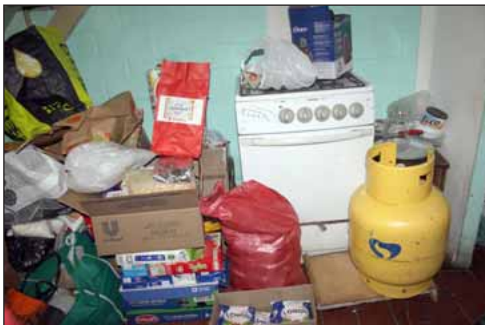
MUCHAS DONACIONES. - Aquí vemos mercadería, una cocina con su cilindro, todo donado por nuestros lectores y vecinos anónimos.