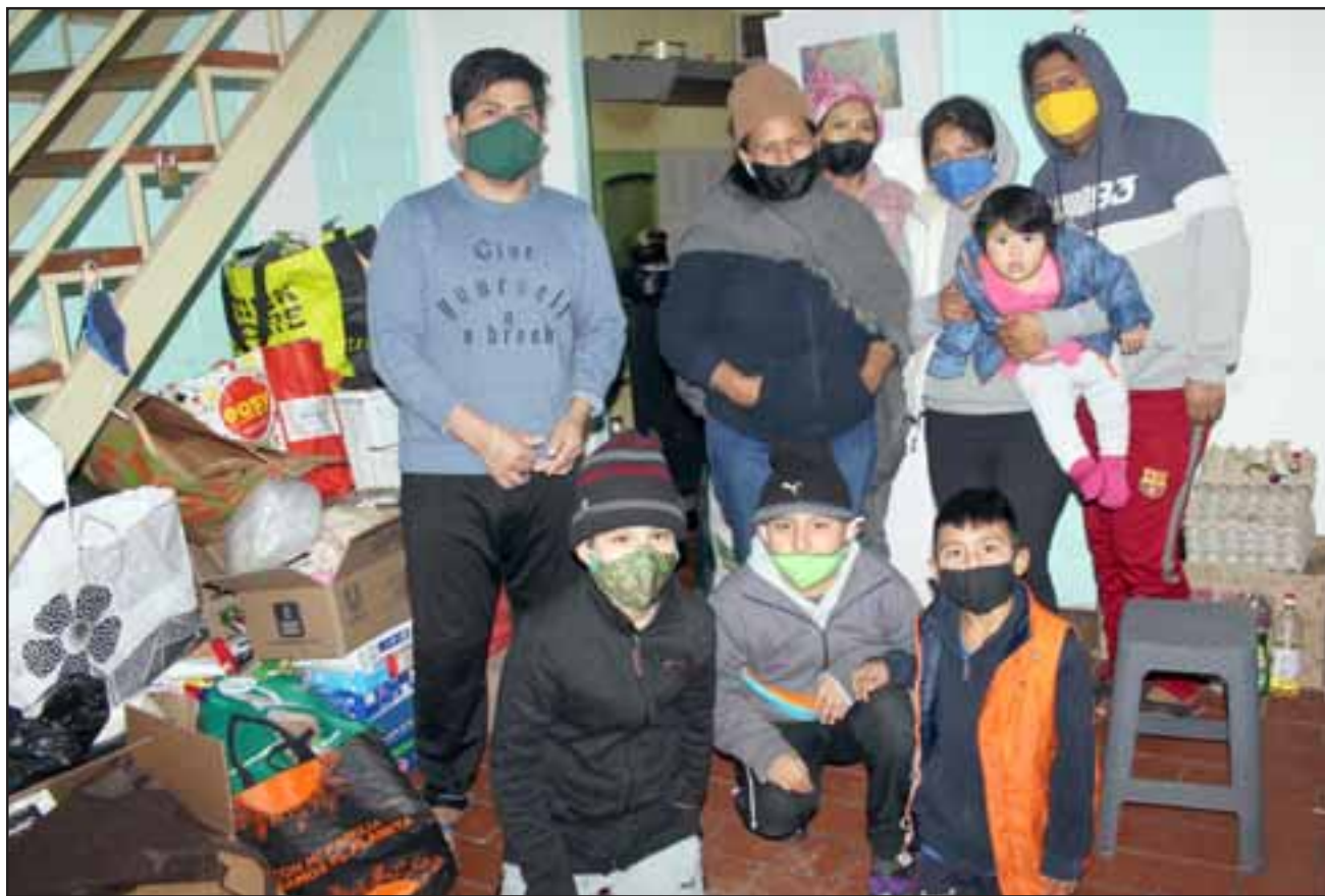
FAMILIAS AGRADECIDAS. - Ellos son la mayoría de las personas favorecidas con la cariñosa entrega de muchos vecinos ante su situación ya conocida.