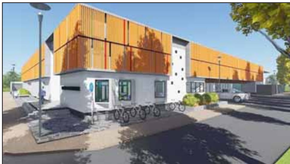
Este proyecto permitirá cambiar completamente a este establecimiento rural y agregar educación media a su oferta académica.