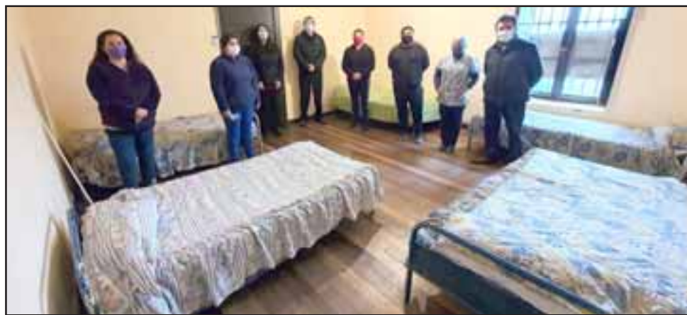
Por séptimo año consecutivo el municipio abrió las puertas de este recinto, el que permitirá a los usuarios soportar las inclemencias del tiempo.

«El Municipio, en coordinación con el Ministerio de Desarrollo Social, trabajó coordinadamente para poder abrir el albergue. Lo que queremos es dar cobijo a nuestros vecinos en situación de calle, sobre todo porque este será un invierno muy frío. Este séptimo año consecutivo de funcionamiento nos ha permitido ir afinando los protocolos y resguardados. Esto es un trabajo que se realiza gracias a nuestros profesionales», finalizó.