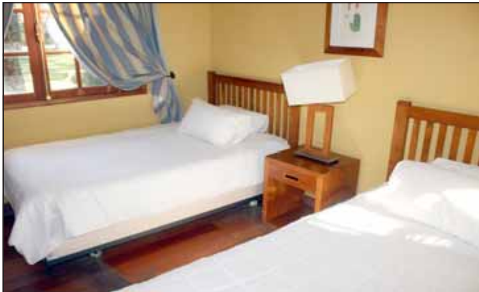
Las personas destinadas a esta residencia sanitaria, están obligadas a permanecer al interior de sus habitaciones.

Se indicó finalmente que las personas destinadas a esta residencia sanitaria, están obligadas a permanecer al interior de sus habitaciones, y que todos los desechos que se generan por lo mismo, serán retirados por una empresa externa, bajo un estricto protocolo sanitario y trasladado a un depósito final a Santiago.