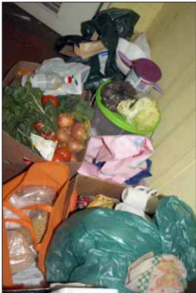
NO MÁS HAMBRE. - También verduras y legumbres llegaron para todos, la campaña fue todo un éxito.