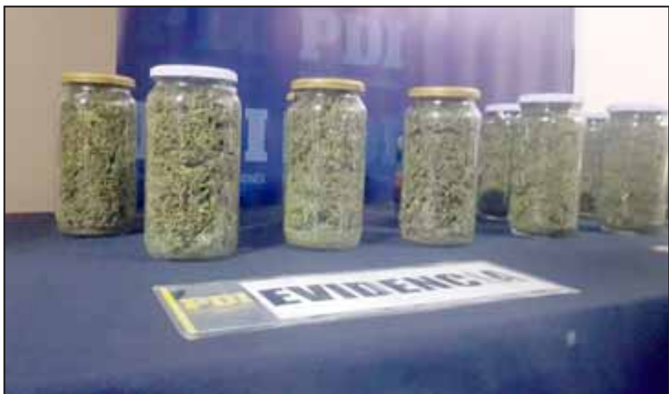
La marihuana dentro de frasco que incautó la PDI

Los sistemas de cultivo Indoor se utilizan para cualquier tipo de planta que el cliente quiera tener, porque al poder regular parámetros internos como la humedad, la temperatura, el tipo y la cantidad de horas de luz, puedes tener una planta tropical, una planta del desierto o una de temperaturas bajas.