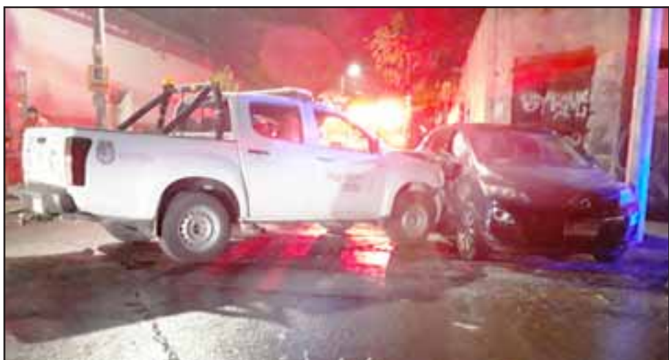
En esa posición quedaron ambos vehículos en la intersección de Toro Mazote y Santo Domingo.

Ambos vehículos resultaron con daños en sus estructuras; la camioneta en la parte delantera, mientras que el automóvil en el costado derecho. Este último estuvo a punto de ter-