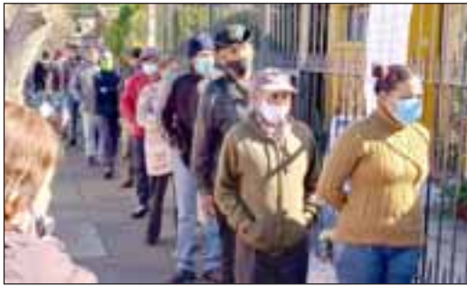
Numerosos vecinos acuden al comedor solidario

Iniciativa municipal hace 7 años: Habilitado el Albergue Municipal y atenderá las 24 horas del día