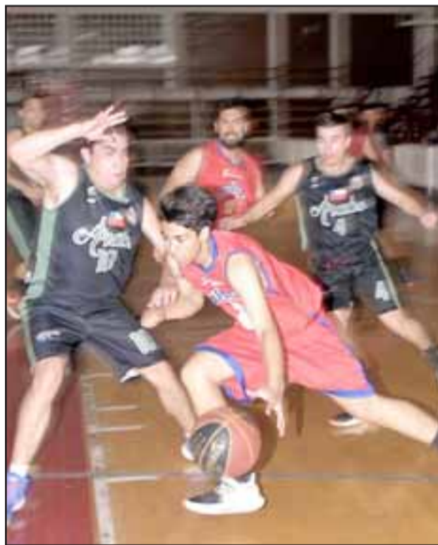
Los basquetbolistas aconcagüinos tendrán acceso gratuito al manual de la Febachile.