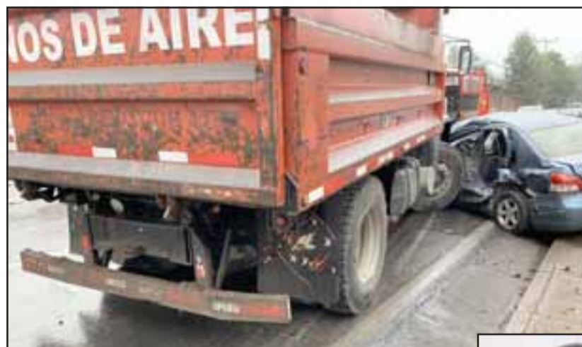
ARRASTRADO. - El pesado camión tolva arrastró al auto liviano unos 25 metros tras el impacto.