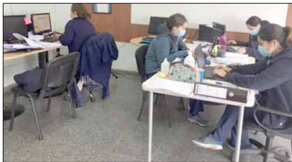
El seguimiento se realiza vía telefónica, comunicándose directamente con la persona contagiada y familiares, para identificar, además, a los contactos estrechos, las derivaciones que requiere y la articulación con otros servicios.

meras mantienen las comunicaciones con los pacientes positivos, y el resto del equipo realiza el seguimiento de contactos estrechos. Debido a la alta demanda, replanteamos el rendimiento, poniendo a prácticamente todo el equipo en el seguimiento de contactos estrechos. De acuerdo al protocolo, establecimos un formato de llamada. El objetivo de este seguimiento es que, primero, informemos, pesquiseemos síntomas y coordinemos derivaciones con otros profesionales que se necesiten, tales como odontología, trabajadoras sociales, psicólogos, entre otros», sostuvo.