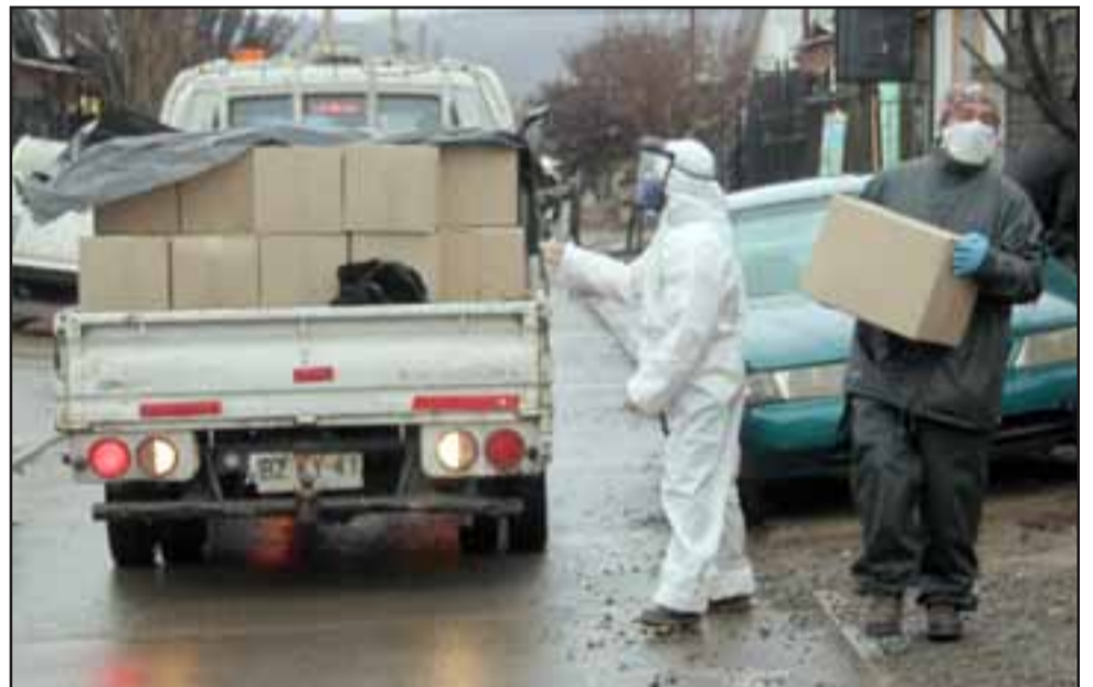
EL TRABAJO CONTINÚA. - Nadie de la lista quedó sin su respectiva caja de mercadería en ese sector sanfelipeño.