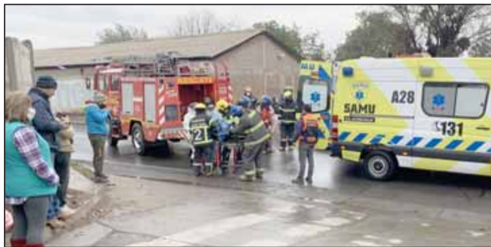
AL SAN CAMILO. - Ambos conductores fueron trasladados al Hospital San Camilo por personal del Samu.

plicó que «al ser las 9:10 de la mañana se despachó a un accidente vehicular en el sector El Pino camino Tocornal, fueron despachadas las unidades B3, RV1 y RX2. Al llegar al lugar se trabajó en la inmovilización de ambos conductores, pues el vehículo menor estaba en la parte inferior del camión tolva. El chofer del camión se había ya bajado y presentaba fuerte dolor en la zona torácica producto del golpe con el manubrio, mientras que el conductor del vehículo menor tenía contusión frontal con sangra-