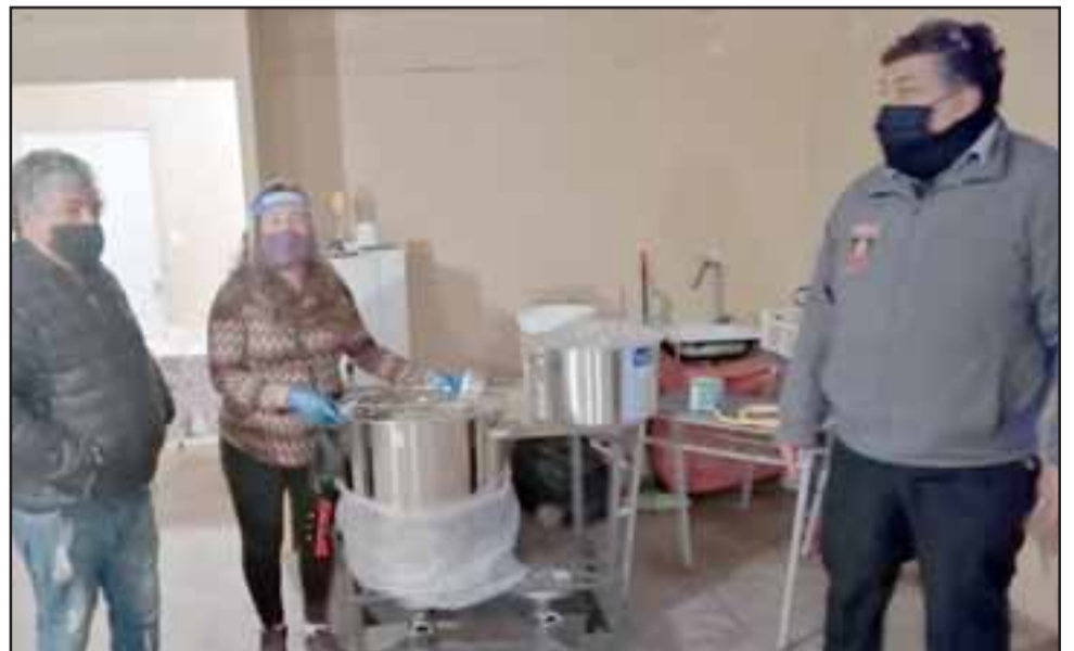
COMEDOR SOLIDARIO. - Mientras tanto en esta población de nuestra comuna muchas personas han dependido de lo que les entrega un pequeño comedor solidario en la sede vecinal.