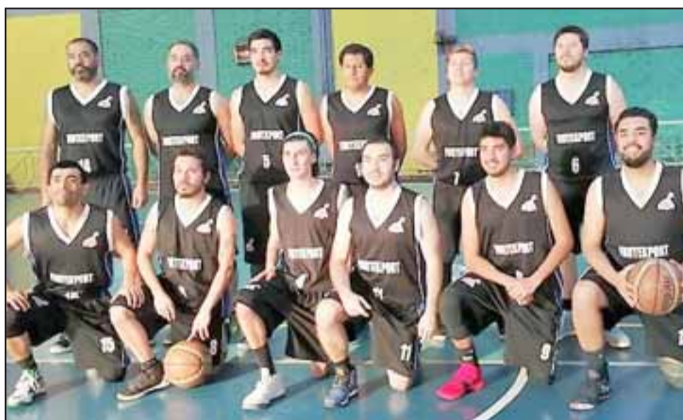
Los equipos femeninos y masculinos del Frutexport entrenan de manera virtual.