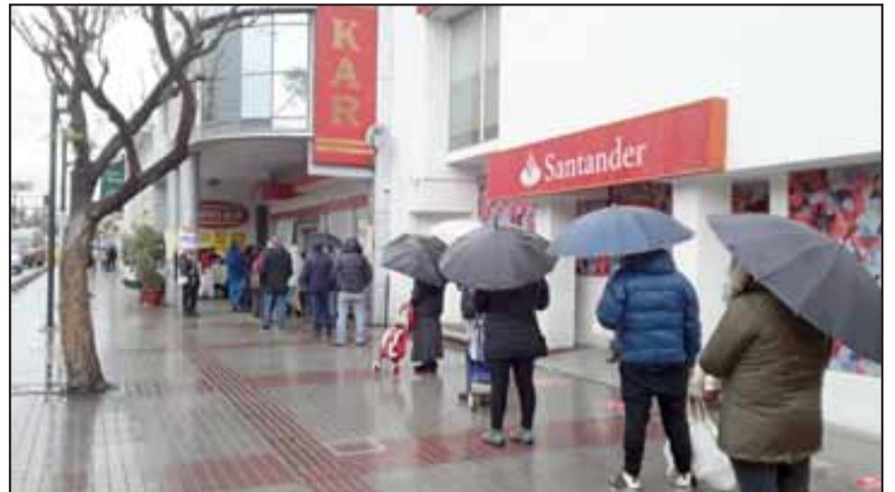
Las personas se aglomeraron rápidamente en este caso frente a Carnes KAR de calle Prat para abastecerse ante el anuncio de la cuarentena a partir de este viernes.

- «Me parece muy bien en realidad, creo que era necesaria, ya estamos atrasados con este tema. Yo creo que el Gobierno ha manejado muy mal el tema y estamos muy atrasados con respecto a este tema. Hay mucha gente que está contagiada, no sabemos cuántas personas están contagiadas, ahora hay que