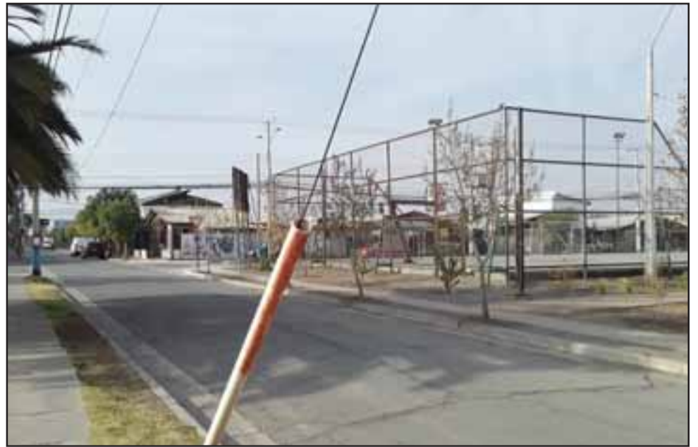
Cancha de Villa El Señorial de San Felipe, donde vehículos estacionados en las calles aledañas han sido afectados por robo.