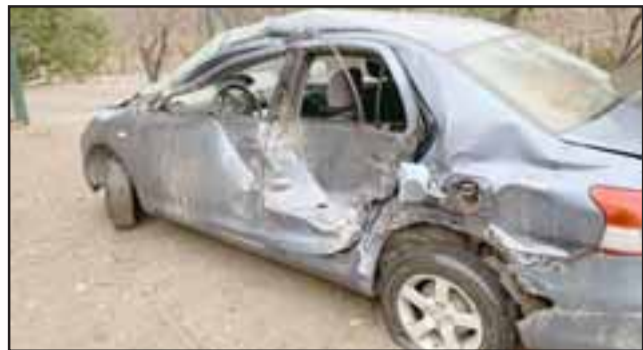
DAÑOS MATERIALES. - Así quedó el vehículo menor luego que con equipo especial de Bomberos éste fuera liberado del pesado camión.