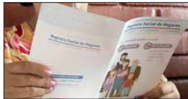
Actualmente se puede solicitar ayuda a los teléfonos 34 2 509 153 ó +56 9 9936 8837, también está habilitado el correo electrónico smancilla@munisanfelipe.cl .

«Luego se asignan los porcentajes que le darán acceso a las ayudas que entrega hoy el Gobierno. Sólo si se encuentran errores en la ficha será citado, de lo contrario revise al mes si-