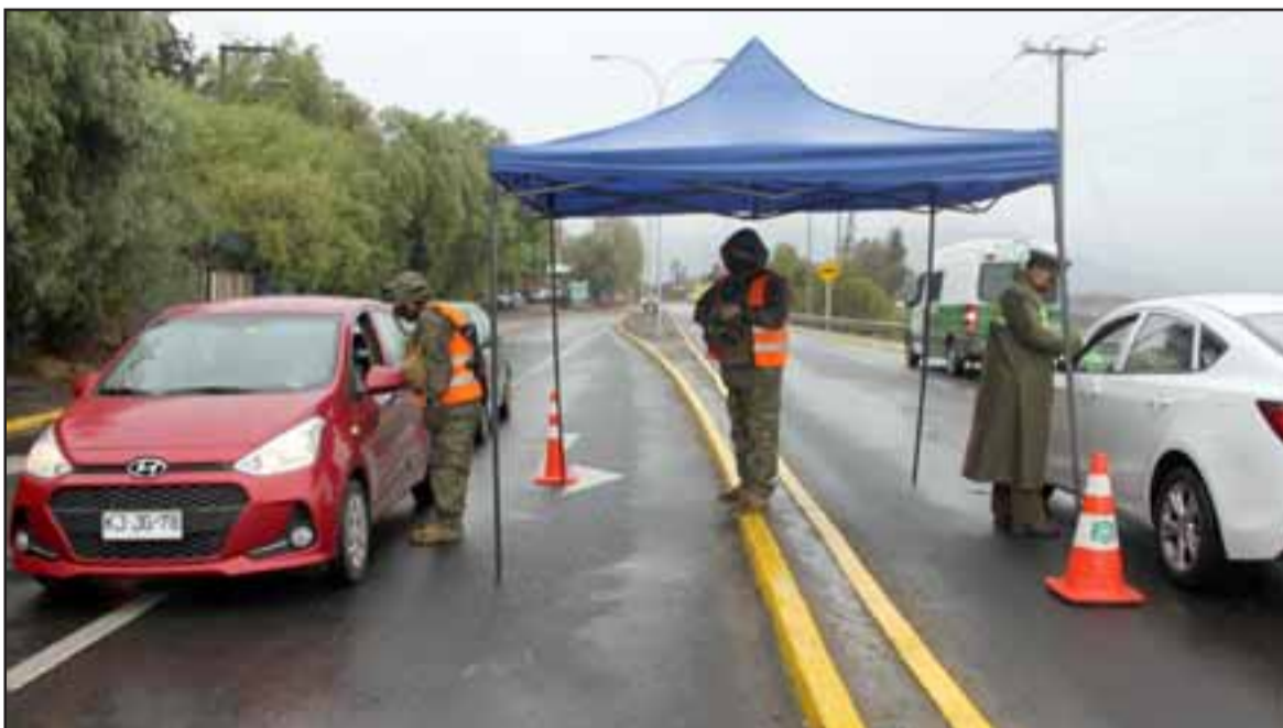
A CUBIERTO.- Militares y carabineros debieron instalar toldos en carretera para poder realizar su trabajo.