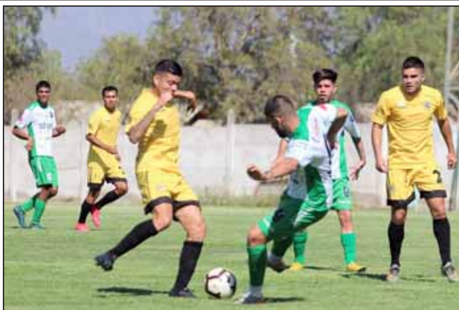
Se confirmó que ANFA y Tercera División elaboran un protocolo de retorno al fútbol.