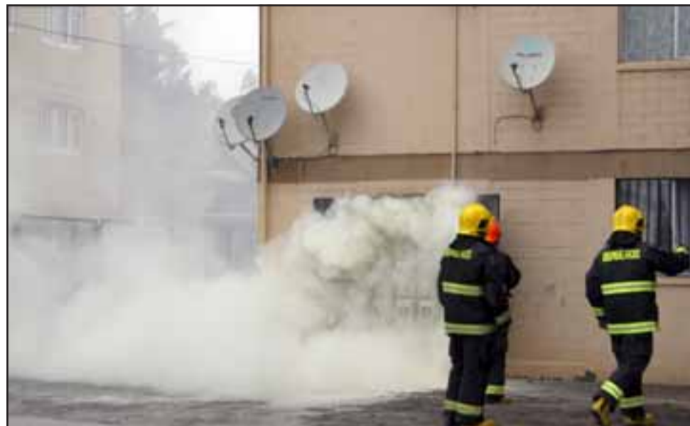
TORRE EN PELIGRO.- Gracias a que estos dispositivos están fuera de las viviendas, el daño se pudo controlar sin peores consecuencias.

Agua en las paredes pudo causar el corto circuito: