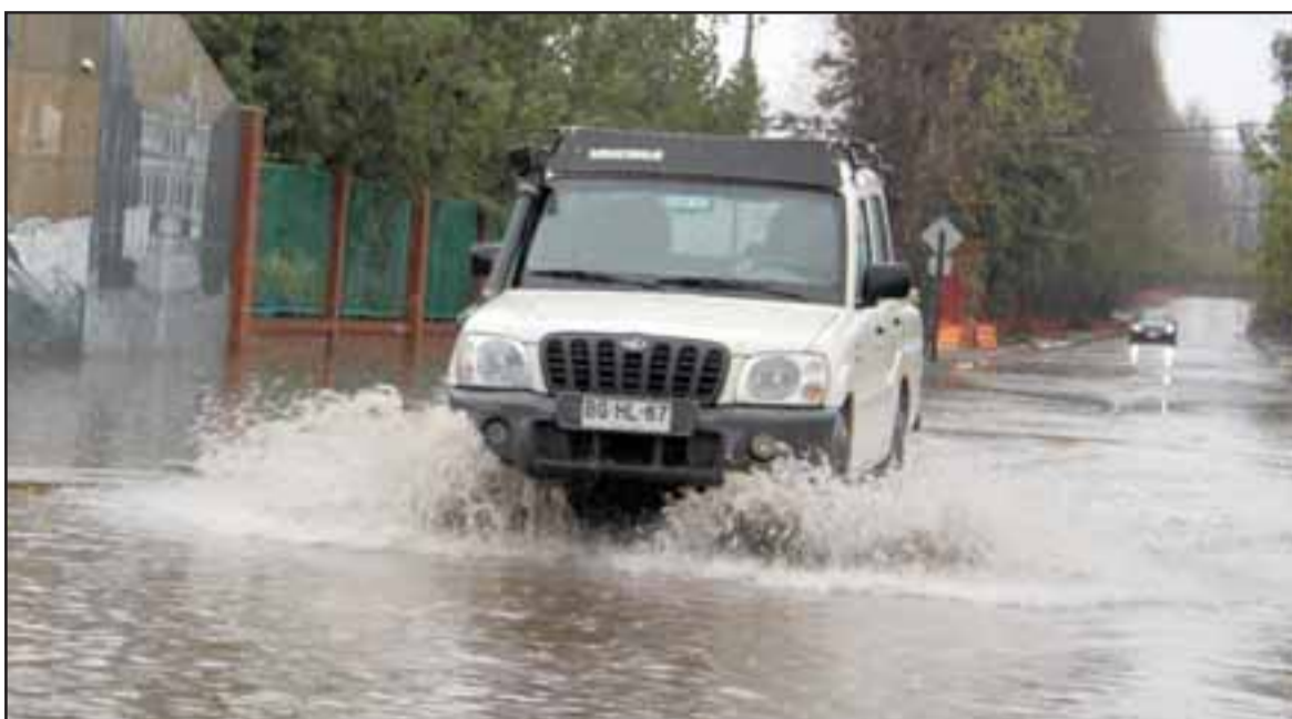
VAMOS BIEN.- Así lucía la mañana de ayer martes el frontis de la Universidad Valparaíso en La Troya.