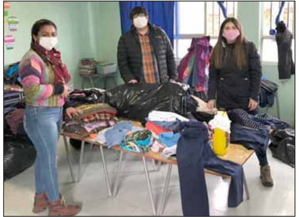
Un solidario trabajo vienen realizando los profesionales de la Escuela 21 de Mayo en el área social, apoyando a las familias que más lo necesitan.

«Desde el punto de vista de la solidaridad, acompañar a nuestras familias, nos sentimos tremendamente orgullosos y felices y