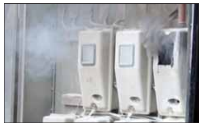
PUDO SER PEOR.- Los bomberos finalmente desconectaron el flujo eléctrico y pudieron controlar la escena.