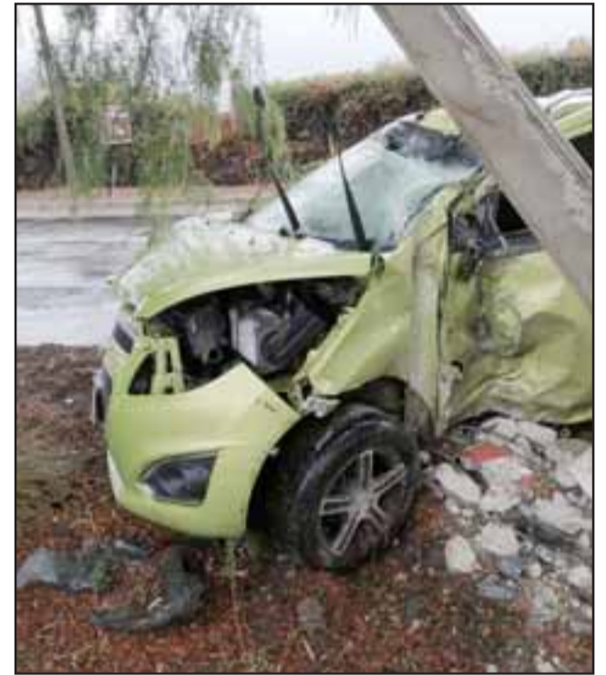
Incrustado en el poste del alumbrado público terminó el automóvil, cuyo conductor resultó milagrosamente ileso.