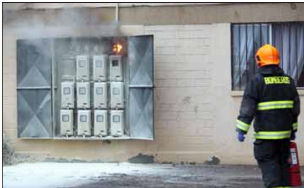
MUCHAS EXPLOSIONES.- El peligro fue real, los químicos de los extintores en nada útil resultaron, pues la lluvia no dejaba de caer.