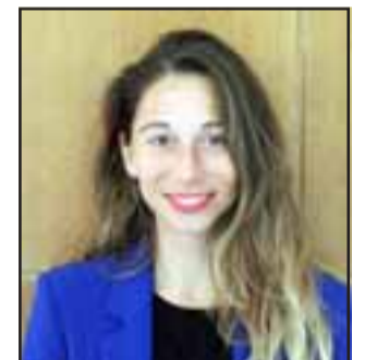
Valentina Stagno, Seremi de la Mujer y Equidad de Género.

Este proyecto de ley es hoy una oportunidad para que el aparato estatal: poder ejecutivo, legislativo y judicial refuercen medidas y acciones concretas que reduz-