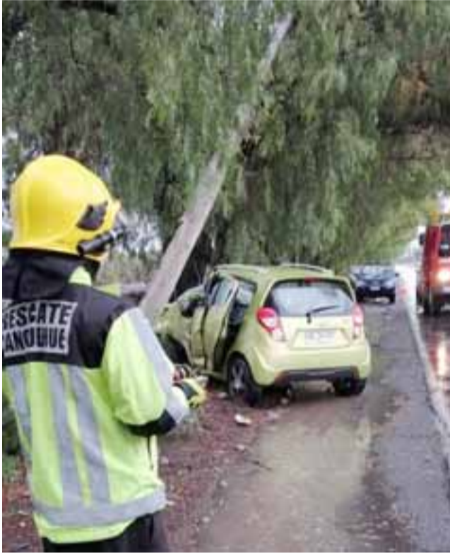
Personal de Bomberos de San Felipe debió concurrir al sitio del suceso para liberar al conductor que quedó atrapado en el deformado habitáculo.

• «La saqué barata», reconoció el único ocupante del vehículo que sufrió daños severos tras el violento impacto.