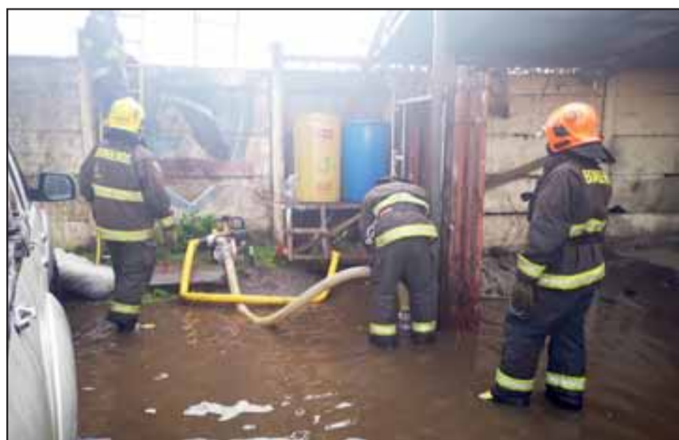
Voluntarios de Bomberos debieron atender inundaciones en varios sectores de la comuna. (Imagen referencial).

Al finalizar y teniendo en cuenta que se vienen