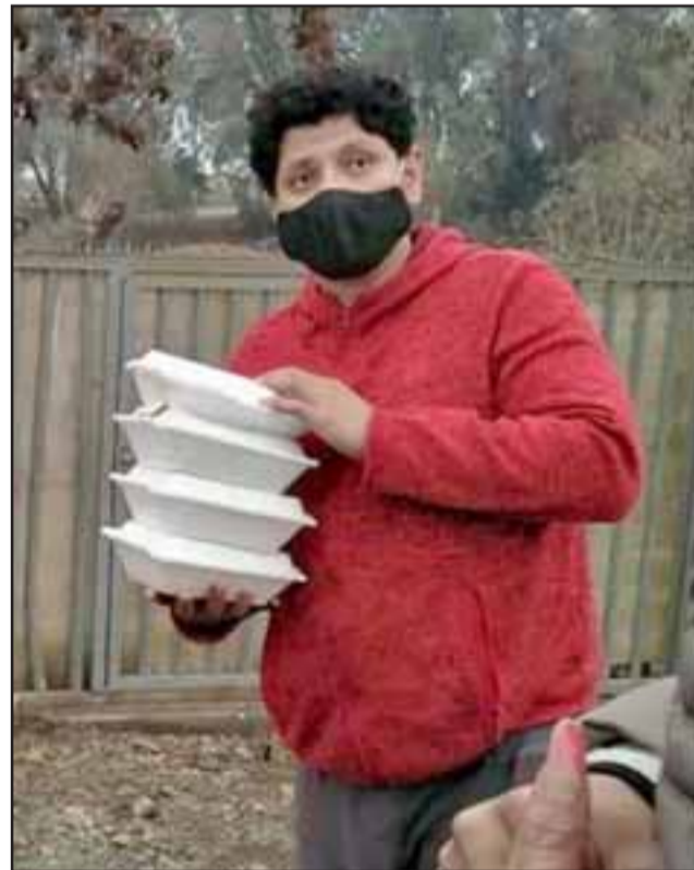
ALMUERZOS CALIENTES.- Muchos vecinos de nuestra comuna reciben agradecidos los alimentos que estas personas preparan y reparten en los alrededores de San Felipe.