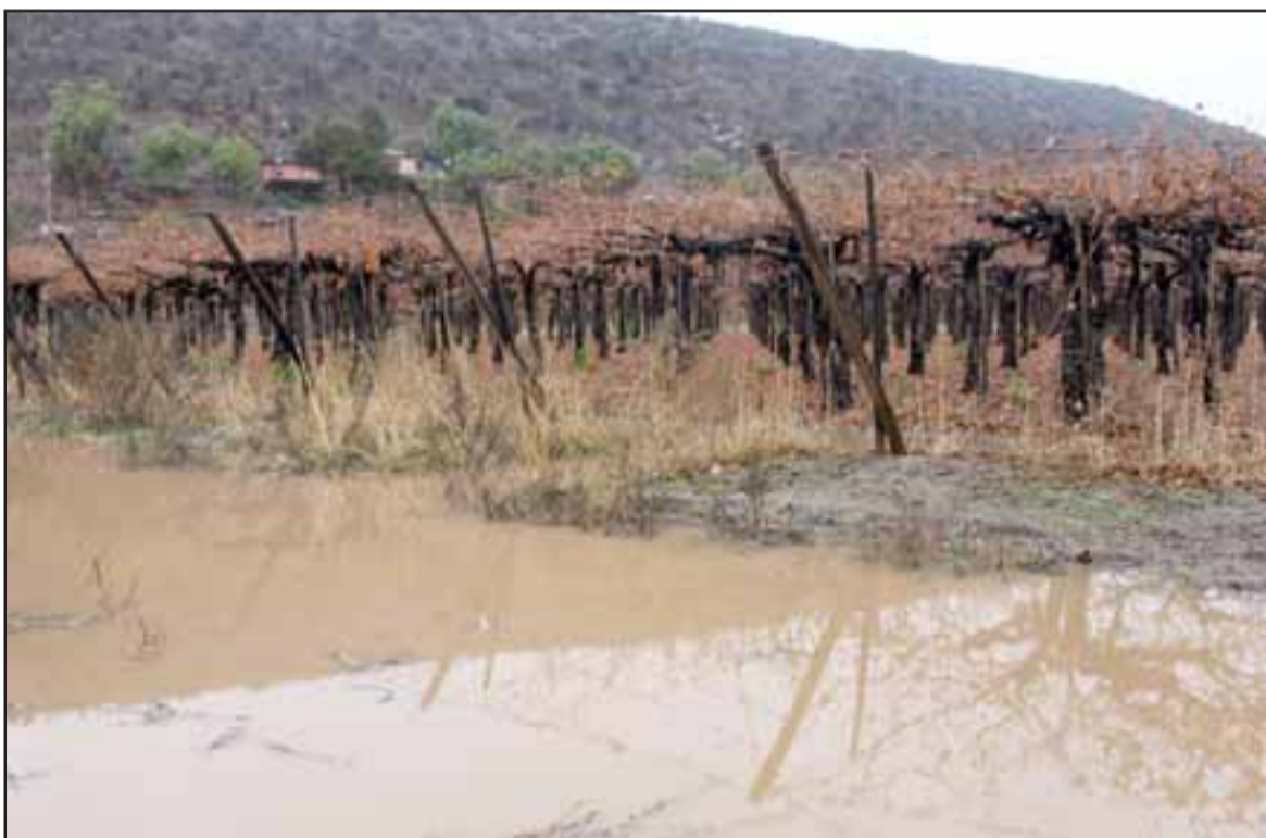
AGUA BENDITA.- Nuestras cámaras viajaron a El Algarrobal, callejón Los Naranjos, así lucen los parronales.