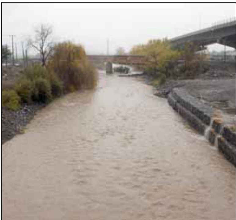
DESDE PUENTE EL REY.- El Río Aconcagua con buen torrente recogió también el preciado líquido para bañar la costa.