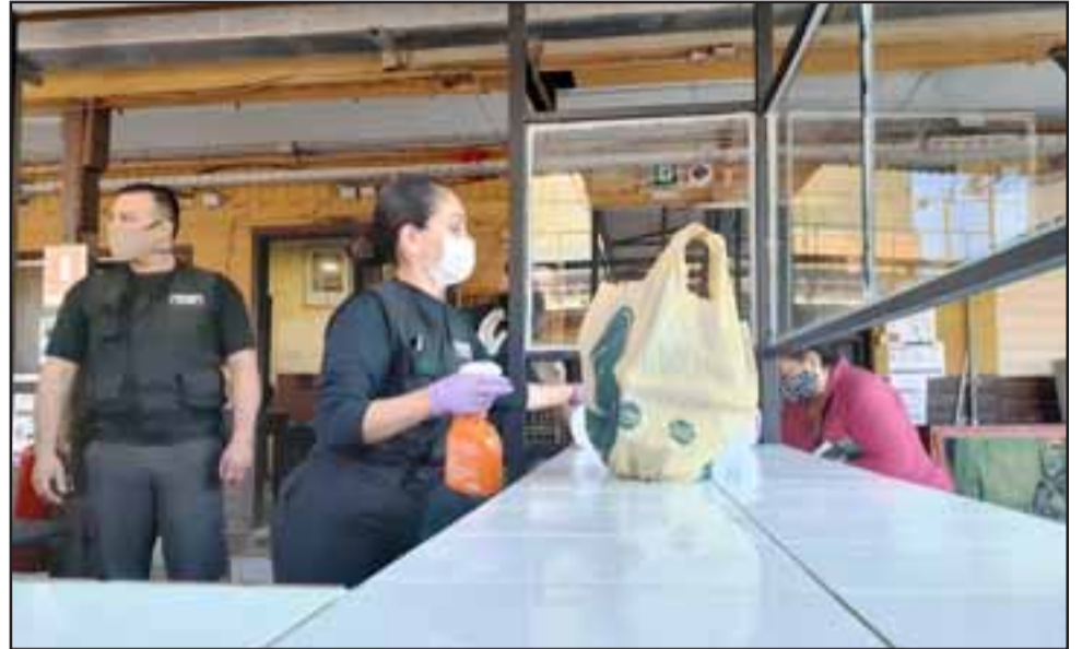
Gendarmería implementó un minucioso protocolo de sanitización de los artículos destinados a los internos, el que implica el uso de guantes y mascarillas por parte de los gendarmes

Situación similar al de las unidades del Aconcagua es la que se vive en los establecimientos de San Antonio y Valparaíso, donde la cuarentena no ha impedido que el servicio de recepción de encomiendas continúe funcionando regularmente.