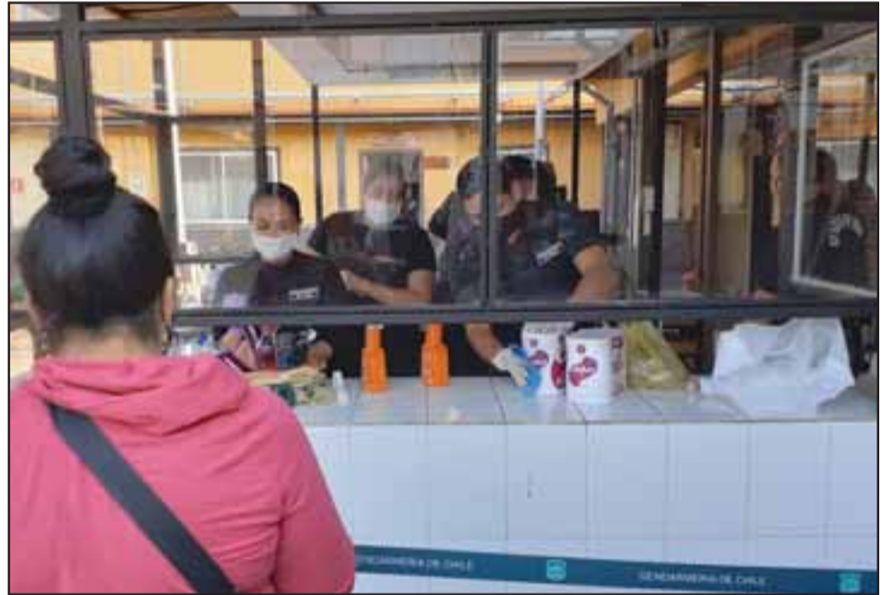
Desde la entrada en vigencia de la cuarentena, se ha experimentado una disminución en la cantidad de personas que concurren a entregar encomiendas, lo cual desde ahora se puede hacer de lunes a viernes.