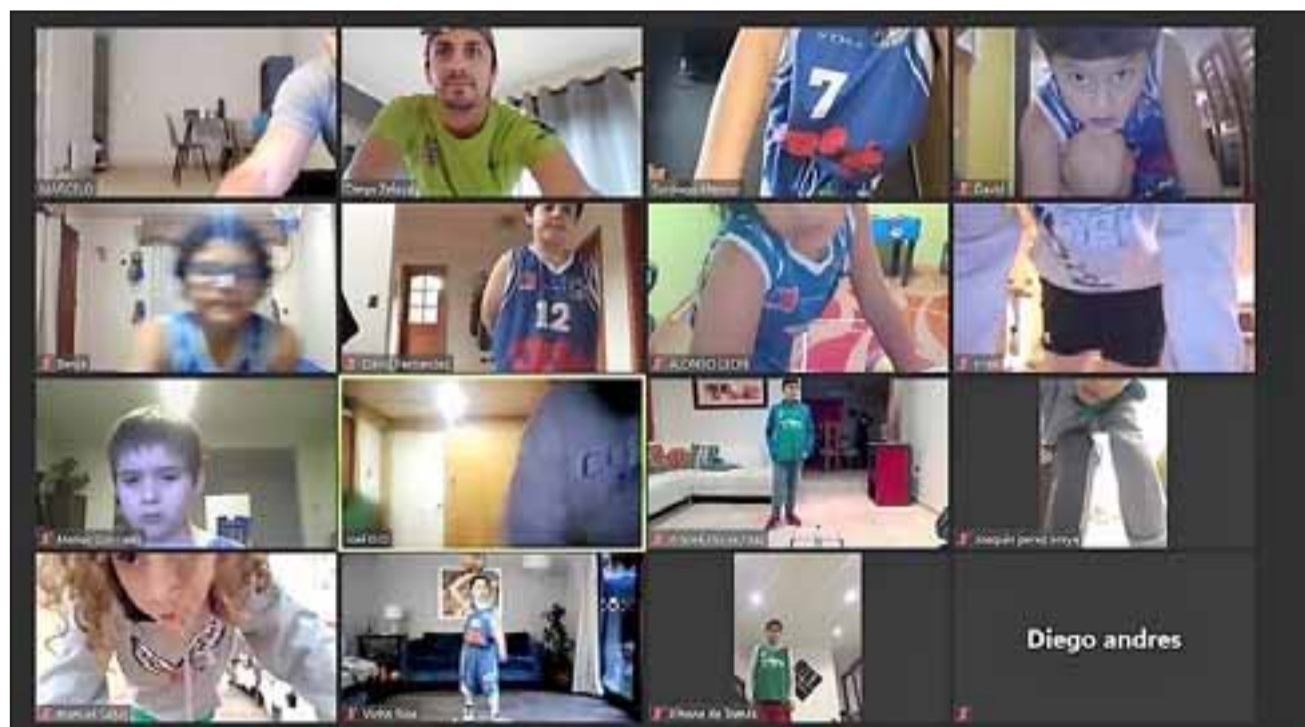
Niños (as) del valle de Aconcagua participaron en la competencia virtual de Mini Básquet.

En la ronda final de preguntas los integrantes de Trasandino debieron 'enfrentarse' al equipo del Club Deportivo Osorno.