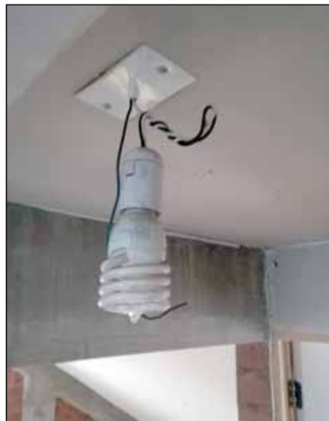
Esta es la ampolleta, aún goteando, por donde ingresó agua a través del cableado.