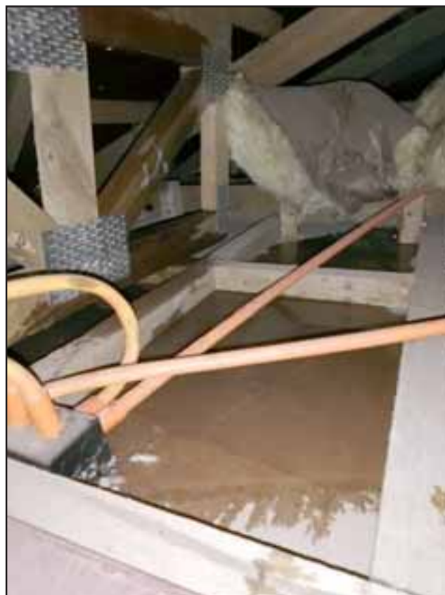
En la imagen se aprecia lo mojado que está el entretecho producto de la filtración de aguas lluvias.