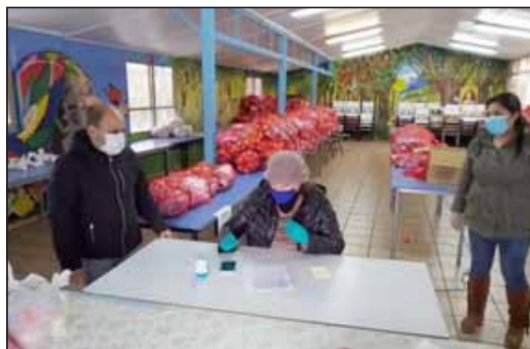
Este martes, en un día bastante lluvioso, se realizó la cuarta entrega de canastas de alimentos de Junaeb en el Liceo Corina Urbina, entre las 9:00 de la mañana y las 17:00 horas, con el apoyo de los funcionarios del liceo.