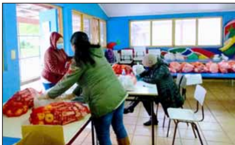
Con bastante normalidad se desarrolló la entrega de canastas de alimentos en el Liceo Corina Urbina.