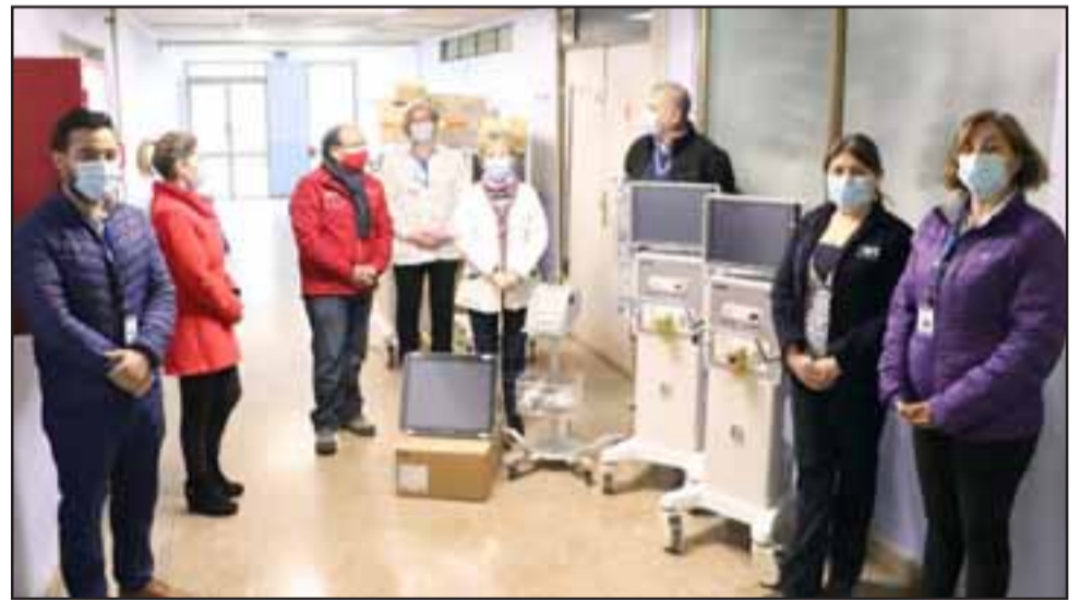
En la imagen los nuevos equipos recibidos que permiten aumentar a 18 las camas críticas en el Hospital San Camilo de San Felipe.