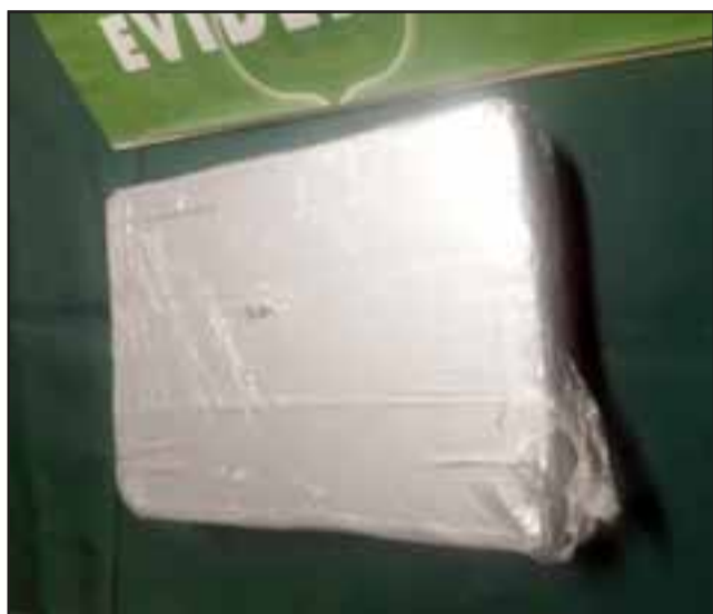
DE ALTA PUREZA.- Esta droga con los agregados químicos o 'cortes' que hacen los microtraficantes, les habría generado cerca de 50 millones de pesos.

Te invitamos a seguir estas recomendaciones para prevenir eventuales contagios del COVID-19