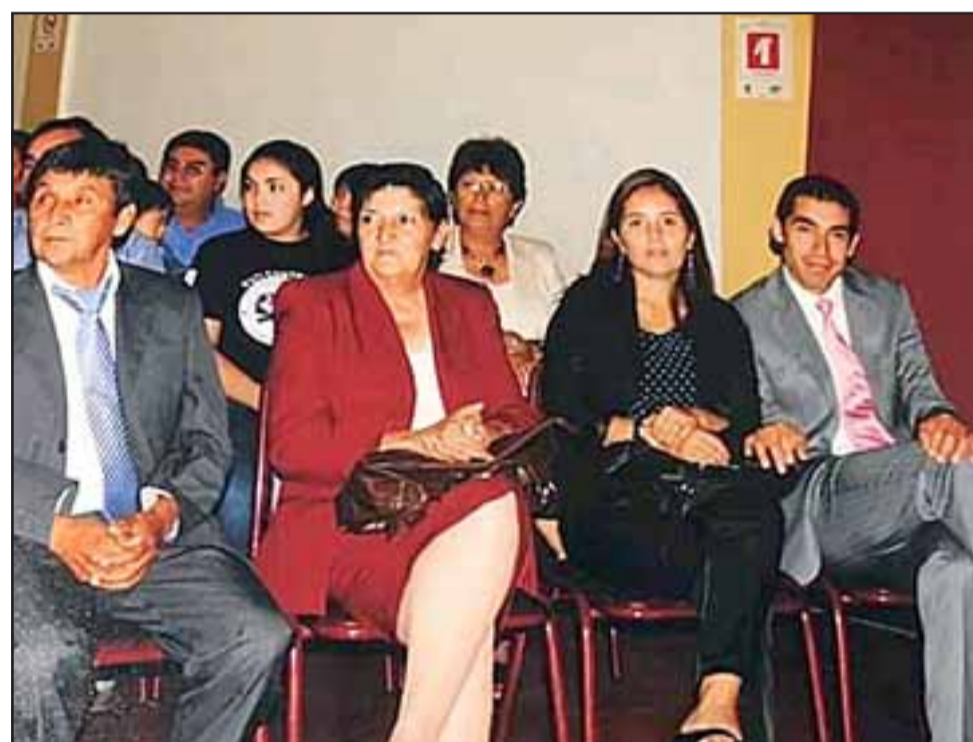
La víctima de este lamentable accidente (primero de izquierda a derecha), en una fotografía tomada cuando era concejal entre los años 2012 a 2016.