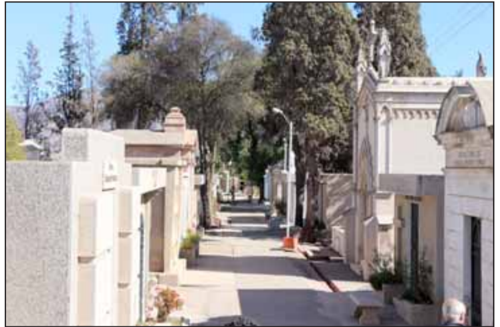
El Cementerio Municipal permanece totalmente vacío ya que mientras dure la cuarentena territorial permanecerá cerrado, y se abrirá exclusivamente para la realización de funerales.

«El camposanto se abrirá sólo para recibir los servicios funerarios, a los asistentes se le tomará la temperatura al ingreso y todos deberán tener su mascarilla. Al término del funeral, se procede a efectuar la sanitización de todo el recinto», precisó.