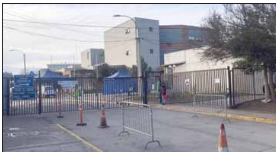
Diversas medidas para proteger la salud de usuarios y funcionarios ha implementado el SAPU del Cesfam Segismundo Iturra, las que incluyen un sistema de clasificación de usuarios entre respiratorios y no respiratorios para evitar el contagio y la propagación del virus.

pechosos de Covid-19 para brindarles a éstos una rápida atención, lo que significa una disminución en la posibilidad de contagios entre pacientes. Tanto el ingreso como la salida se realiza por una vía distinta a la de los otros usuarios no respiratorios», sostuvo