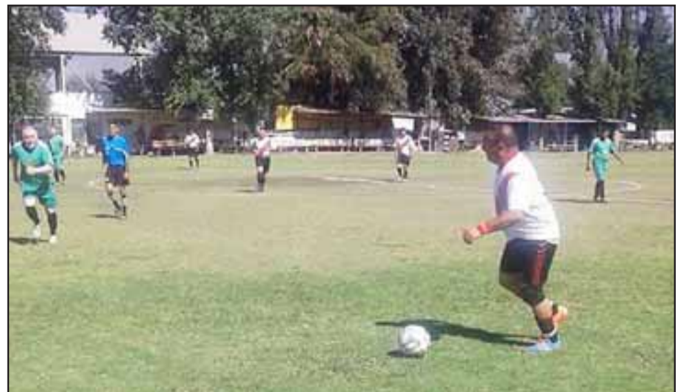
La Liga Vecinal no escapa a la realidad de gran parte de las asociaciones deportivas locales y nacionales.

ción con los integrantes de la liga, por lo que no se sabe cuál es la realidad de los integrantes de cada club, aunque es evidente que algunos jugadores lo deben estar pasando mal. «Por lo que supe un club hizo una caja de alimentos para ayudar a algunos de sus miembros, pero claramente es complejo que eso pueda suceder a nivel más masivo, ya que esto es muy popular», informó.