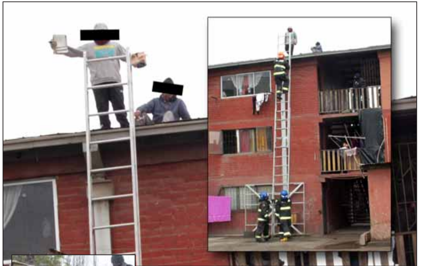
FÁCIL SUBIR, DIFÍCIL BAJAR. - Un pintoresco llamado debió atender Bomberos la tarde de ayer cuando dos vecinos de la Villa Departamental quedaron atrapados en el techo de una de las torres, luego que subieran para efectuar algunas reparaciones y no lograron bajar por sus propios medios. Finalmente gracias a una escala los bomberos lograron poner a salvo a los improvisados carpinteros.