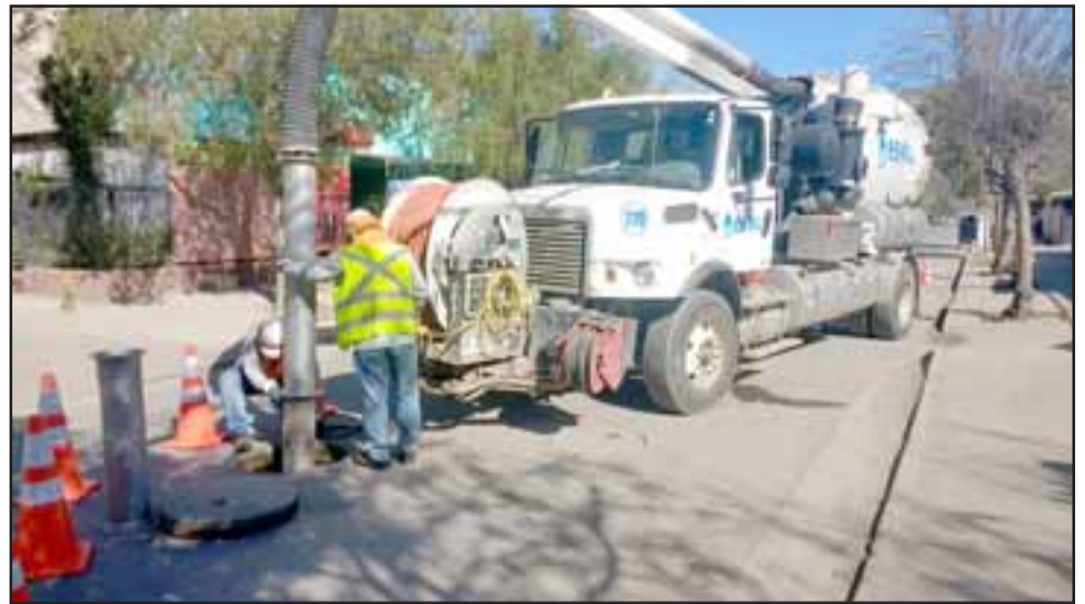
Junto con anunciar el nuevo plan de apoyo a Pymes, Esva aseguró que desde el inicio de la pandemia mantiene suspendidos los cortes por no pago.

En tanto, el Seremi de Economía de la Región de