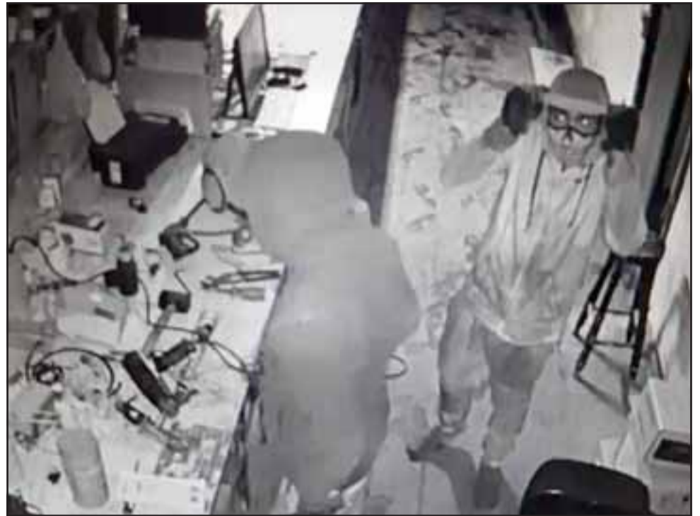
Uno de los sujetos en plena faena captado por las cámaras del sistema de vigilancia de la empresa.

- Ayer (miércoles), cuando llegan los trabajadores se dan cuenta que está todo desordenado, puertas rotas, candados tirados en el piso. Claramente esta gente sabía a lo que venía porque nosotros tenemos detergentes,