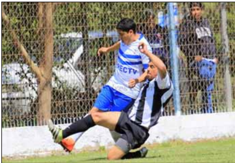
En los torneos futuros del balompié aficionado habrá restricciones de edad.

puertas, aunque sería lindo seguir acá con el equipo en Segunda División», finalizó.