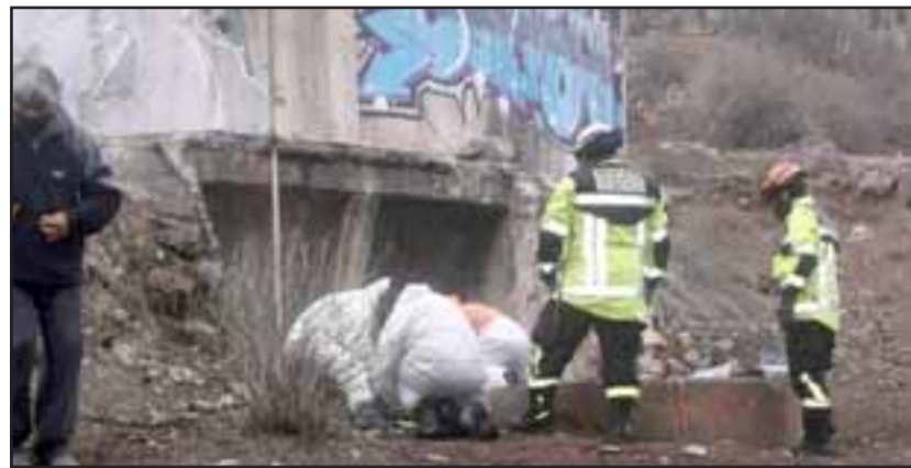
Personal del SAMU y de Bomberos trabajando en el lugar.