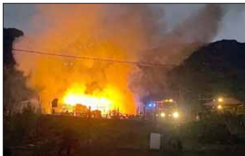
INFERNAL ESCENARIO.- En pocos minutos la casa de habitación fue destruida por las llamas que consumieron por completo el inmueble.