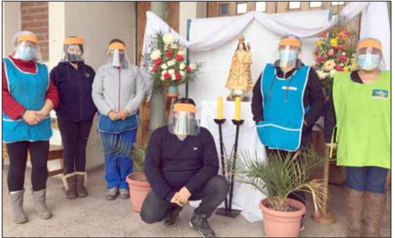
Los voluntarios que preparan la comida para los usuarios trabajan religiosamente en esta iniciativa social desde hace 7 años.

- Solamente reiterar a la gente que nos quiera cooperar y ayudar sino tiene permiso para venir, nos com-