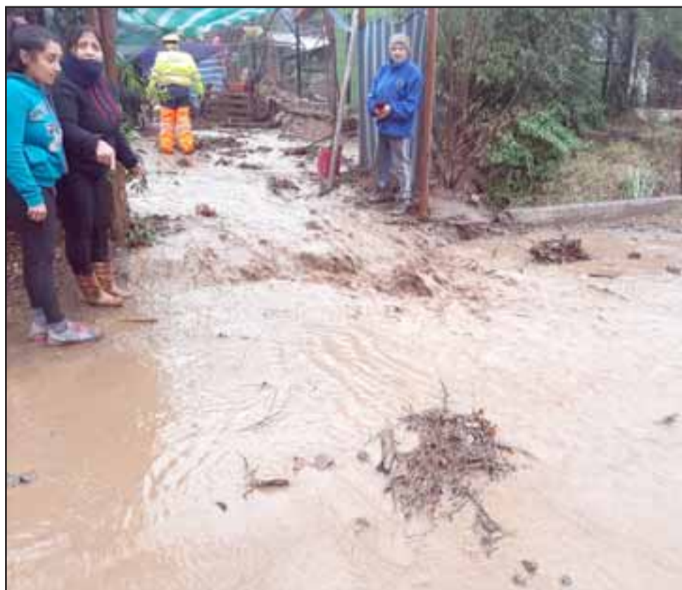
RÍO DE LODO.- Los anegamientos en San Felipe y Santa María que se registraron ayer generaron muchos daños a los vecinos. Aquí vemos a los vecinos en Las Cabras, buscando refugio frente al río de lodo que entró a su vivienda.

Roberto González Short