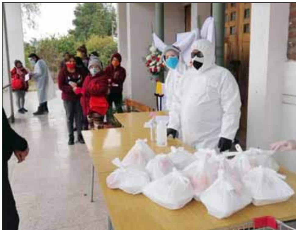
La comida lista para ser repartida junto a los voluntarios del comedor de la Parroquia de Andacollo.