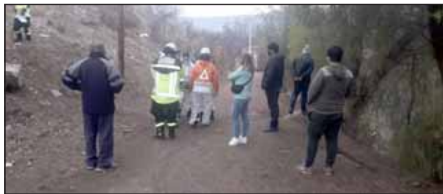
Personas del sector observan el trabajo de emergencia.