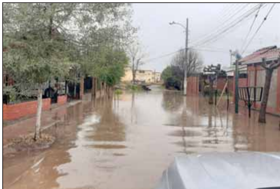
ESTA VEZ FUE MUCHO.- Las calles de varias poblaciones lucían así durante el fuerte aguacero que cayó la mañana de ayer lunes en Aconcagua.