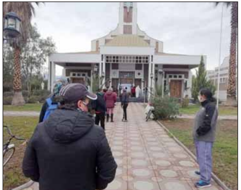
Los usuarios haciendo fila para recibir su comida en el comedor de la Parroquia Andacollo.