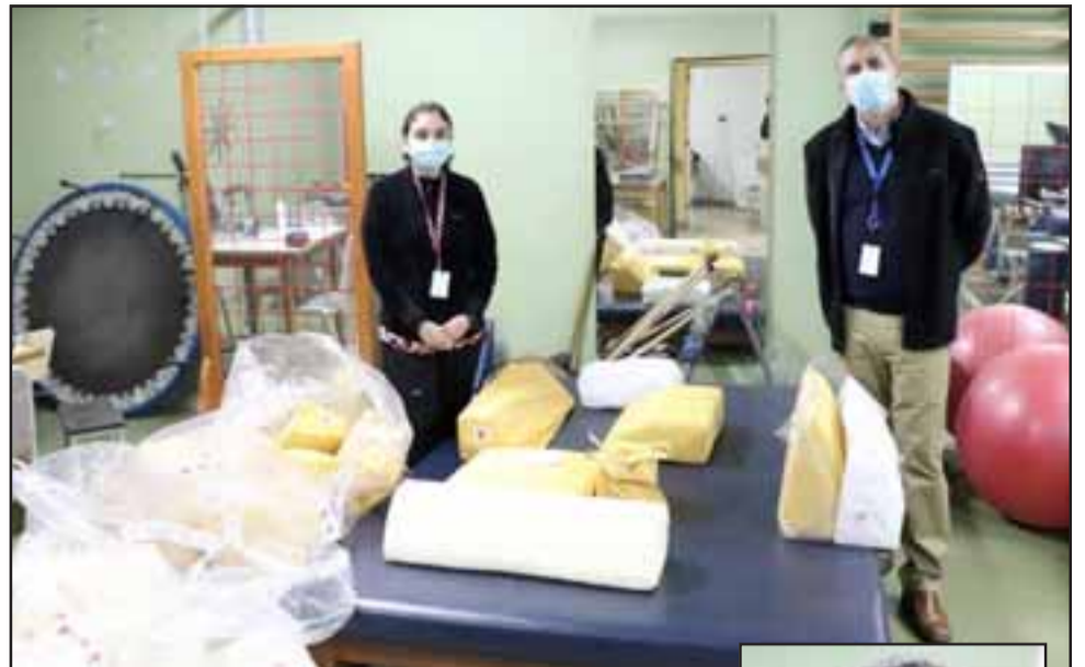
Estos elementos permiten una mejor posición de pronó o de 'guatita' en la que deben permanecer los usuarios para favorecer su capacidad respiratoria.